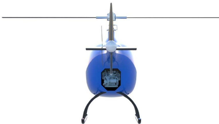
Obr. 2 Vizualizace vrtulníku - pohled zezadu