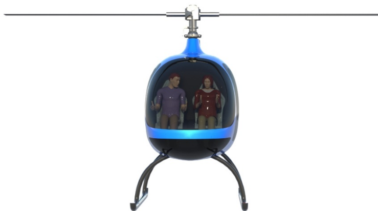
Obr. 1 Vizualizace vrtulníku - pohled zepředu