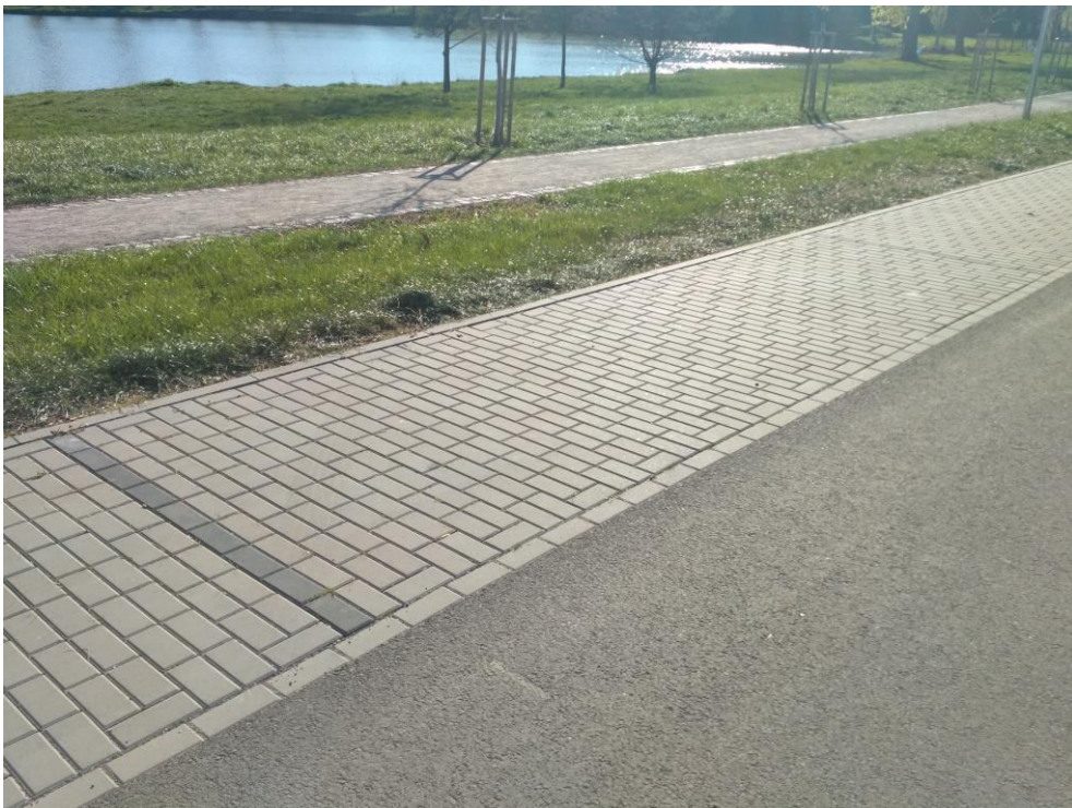
Obrázek 4 - Podélné parkování (Lanškroun)