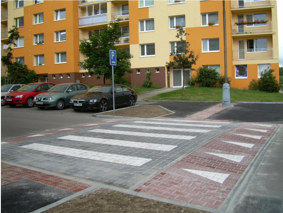
Obrázek 1 - Příčný práh (Plzeň) [1]