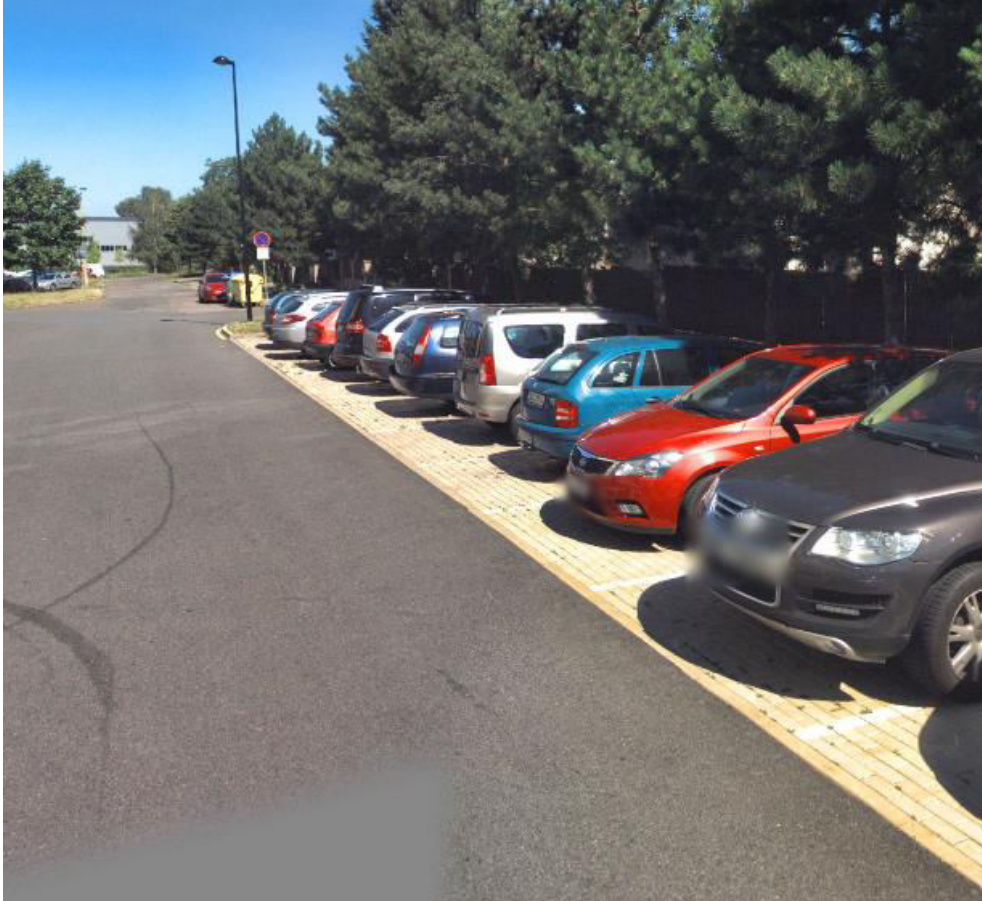
Obrázek 3 - Kolmé parkování (Praha) [3]