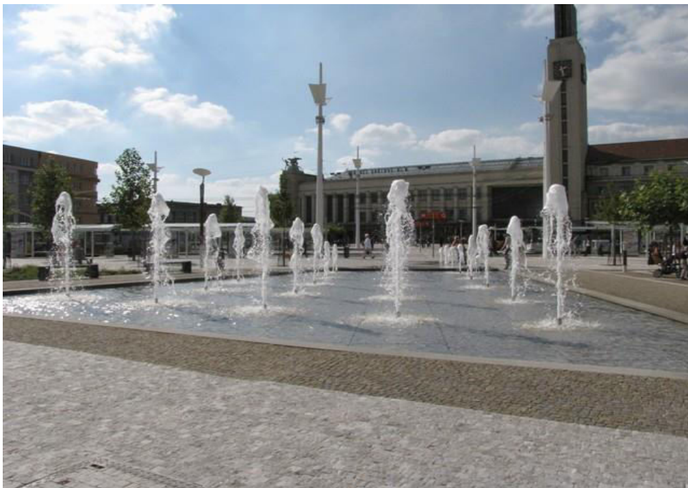
Obrázek 6 - Vodní plocha (Hradec Králové) [4]