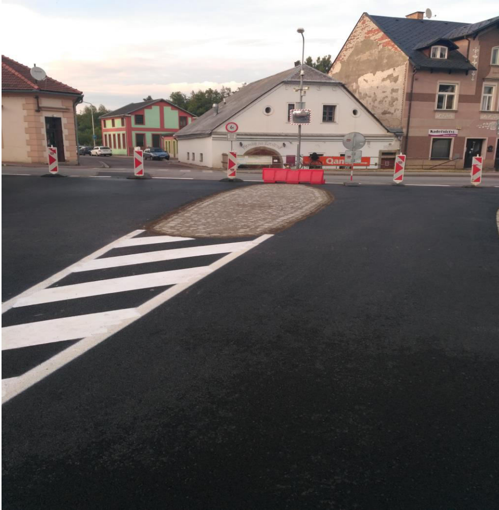
Obrázek 5 - Pojížděná plocha z kamenné dlažby (Letohrad)