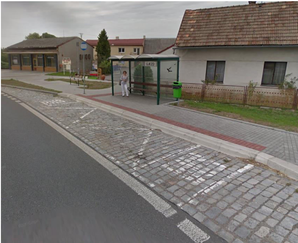
Obrázek 2 - Autobusová zastávka Smilovice, Újezd [2]