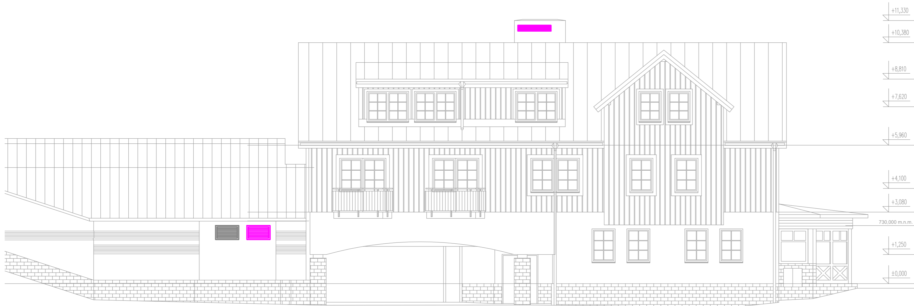
ROVINA FASÁDY NATOČENA ROVNOBĚŽNĚ S PRŮMĚTNOU