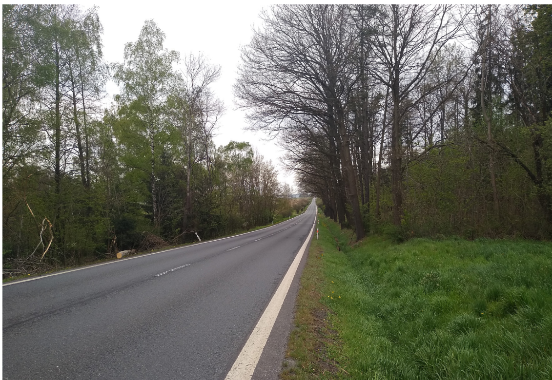
4.4 Přibližné místo křižovatky III/02014 s I/20 rozhled směr na Nepomuk