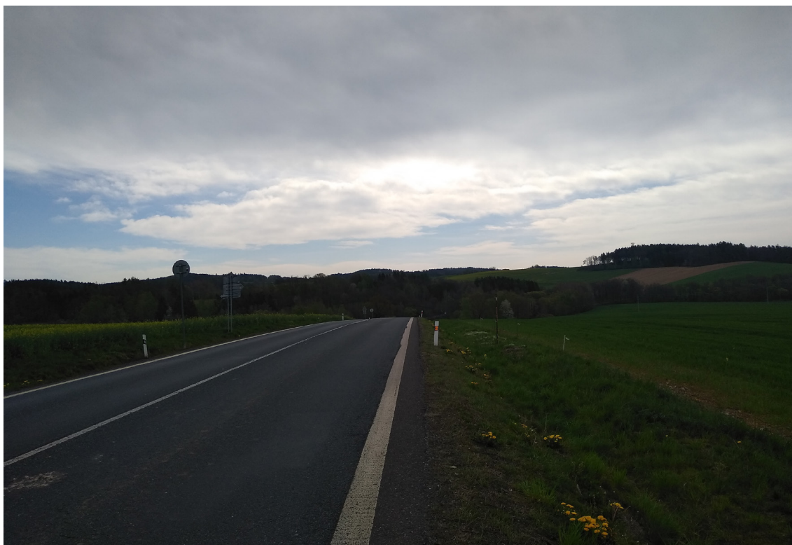
2.3 Pohled na horizont I/20 (směr na Životice)