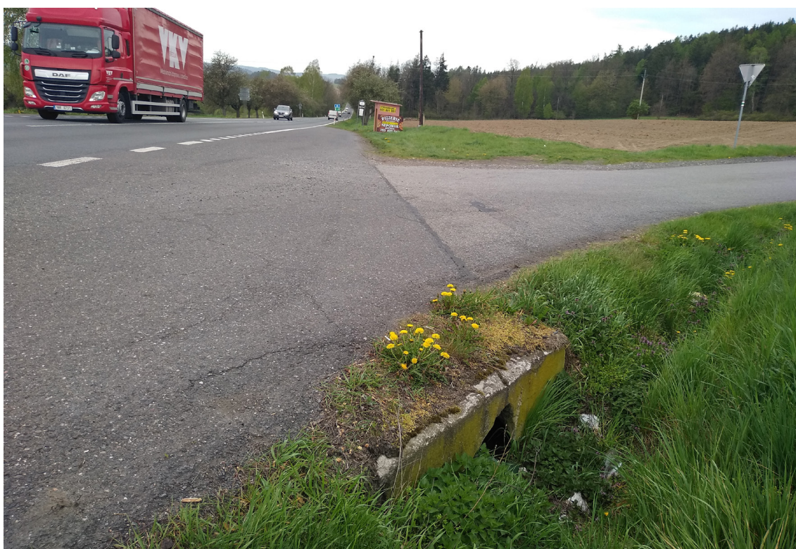
2.4 Propustek I/20