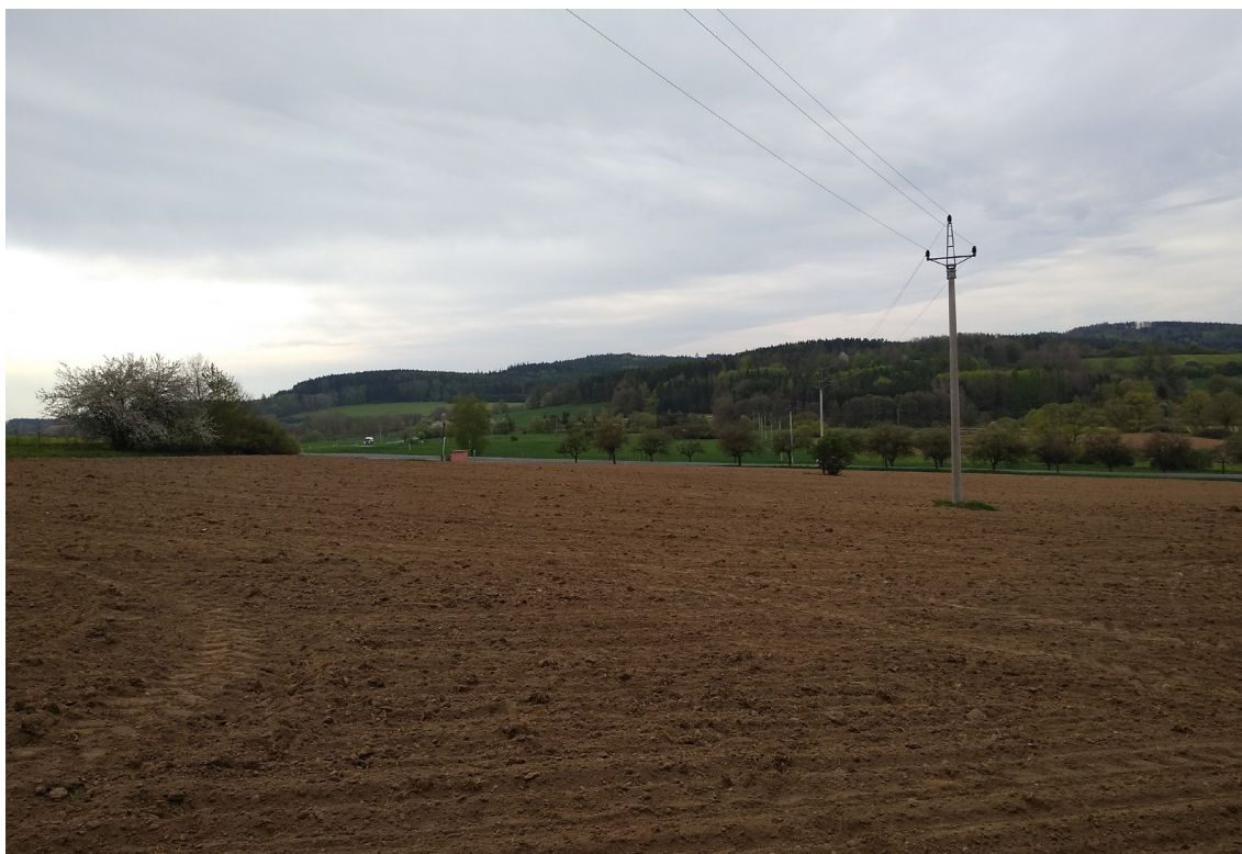
4.7 Pohled na předpokládanou oblast přeložky silnice III/02014