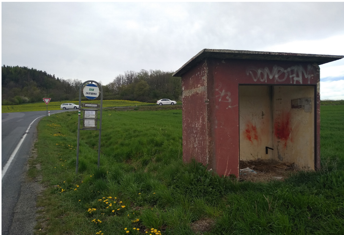
3.3 Současný stav autobusové zastávky II/180 (směr I/20)