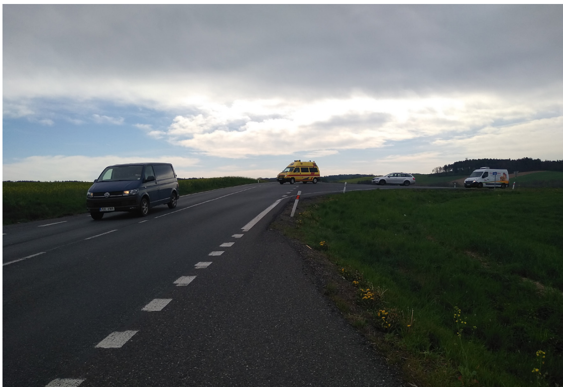
1.1 Pohled na současné křížení I/20 s II/188 (ze směru Nepomuk)