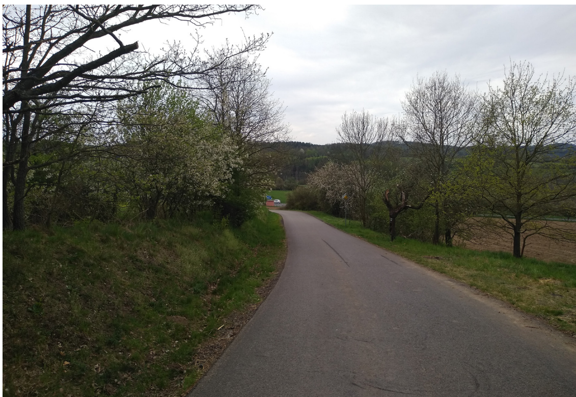
4.8 Oblast konce přeložky III/02014