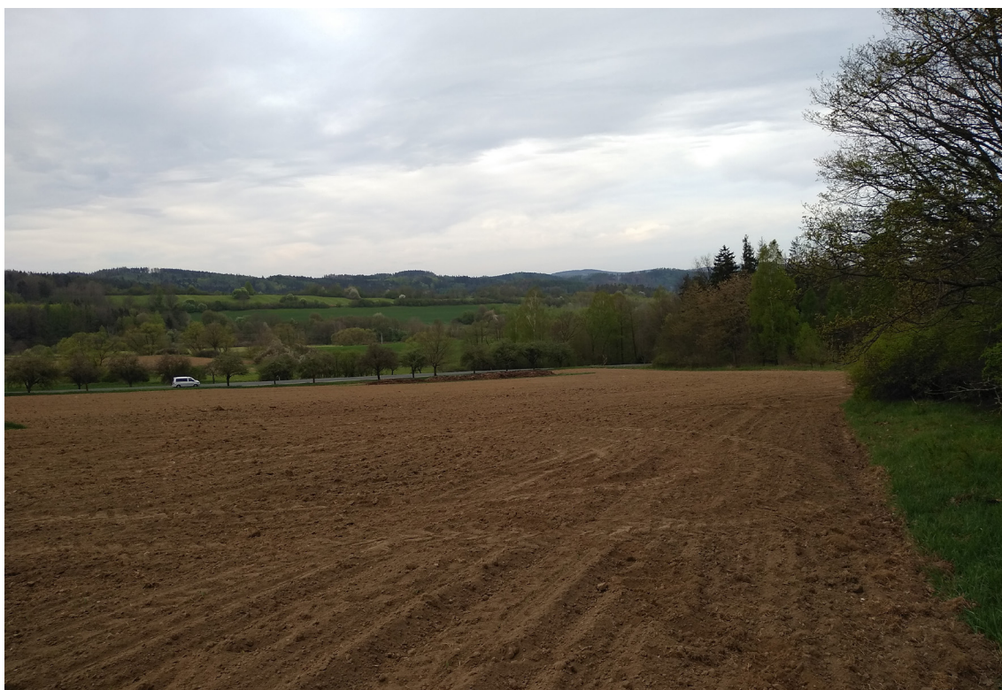
4.6 Pohled na předpokládané místo křížení III/02014 s I/20