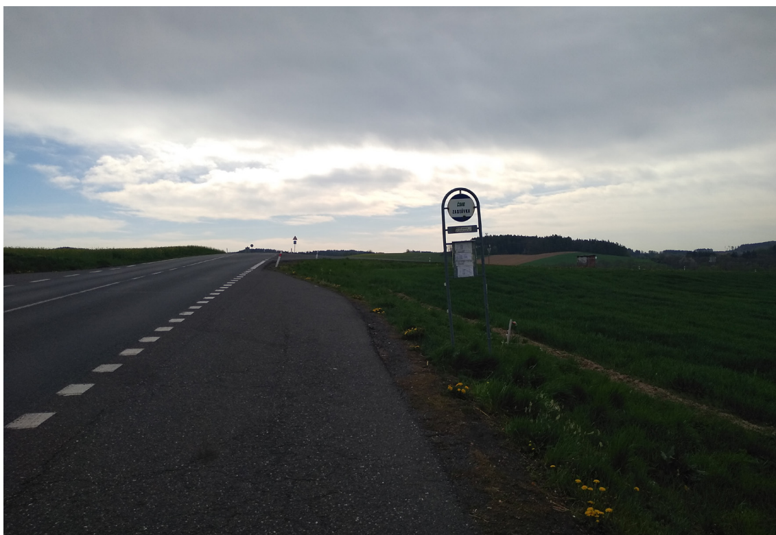
3.2 Současný stav autobusového zálivu I/20 (směr na Životice)