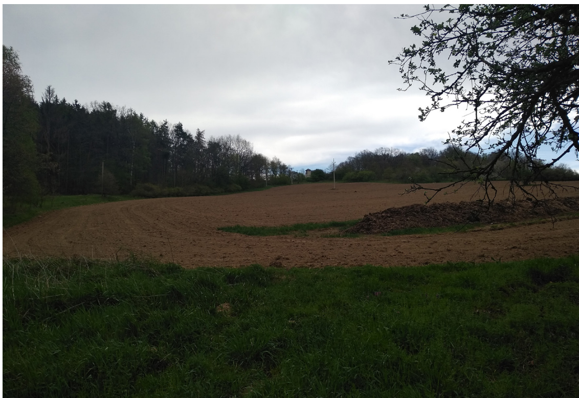
4.5 Přibližné místo křižovatky III/02014 s I/20 rozhled směr na Podhůří