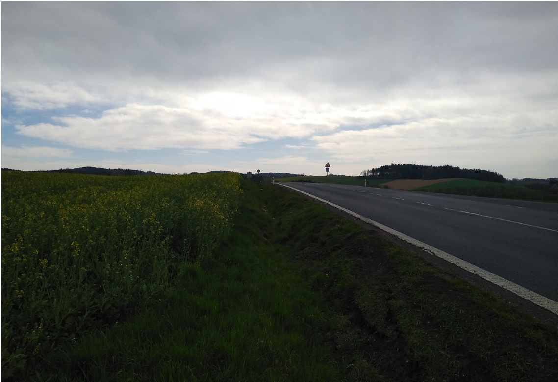
2.1 Současný rozhled z napojení III/02014 (Podhůří) na I/20 (směr na Životice)