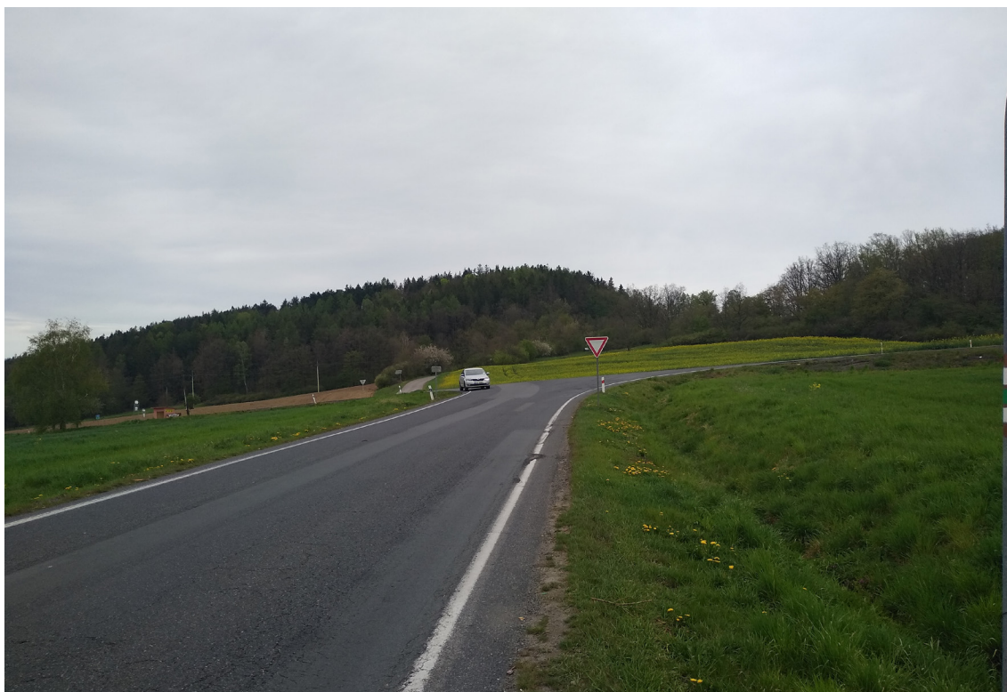
1.3 Pohled na současné křížení II/188 s I/20 (ze směru Kotouň)