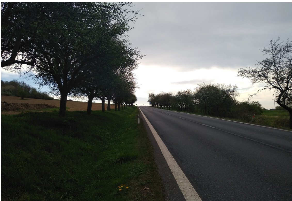
4.3 Přibližné místo křižovatky III/02014 s I/20 rozhled směr na Životice