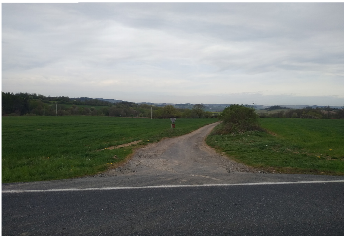
4.1 Pohled na předpokládanou oblast přeložky silnice II/188