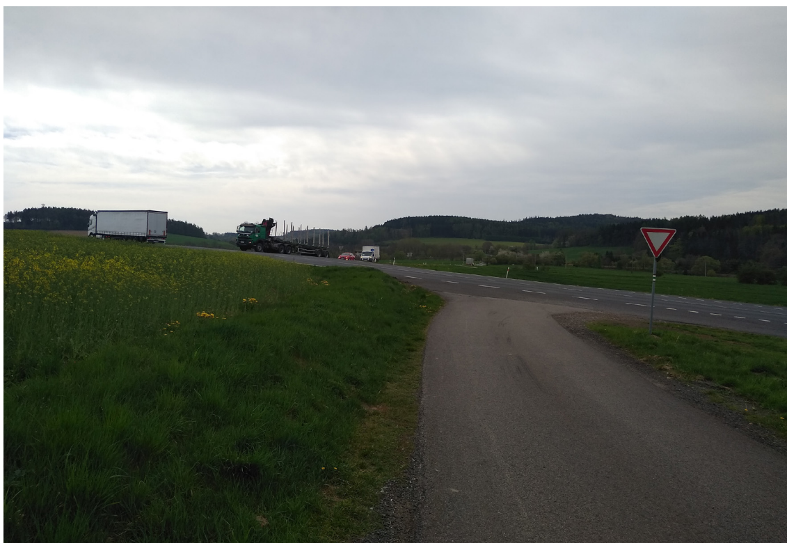
1.4 Pohled na současné křížení III/02014 s I/20 (ze směru Podhůří)