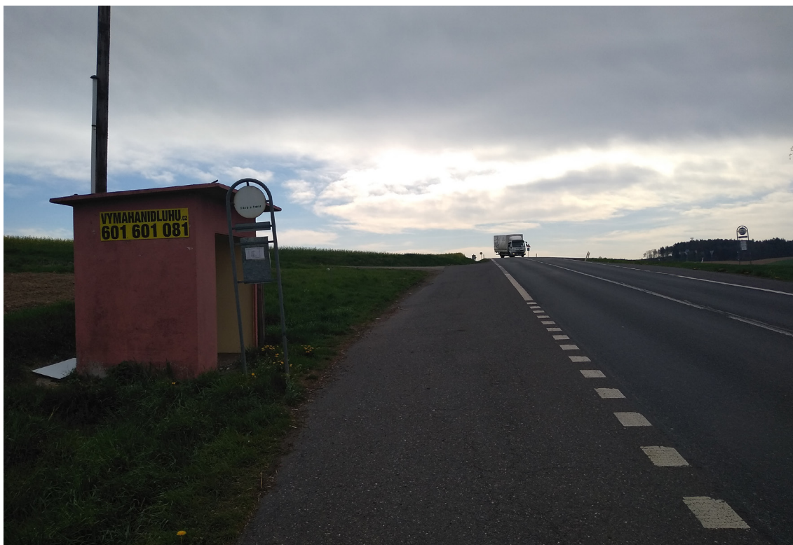
3.1 Současný stav autobusového zálivu I/20 (směr na Nepomuk)