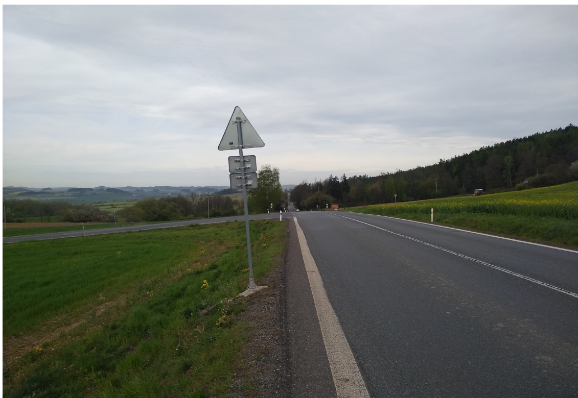
1.2 Pohled na současné křížení I/20 s II/188 (ze směru Životice)