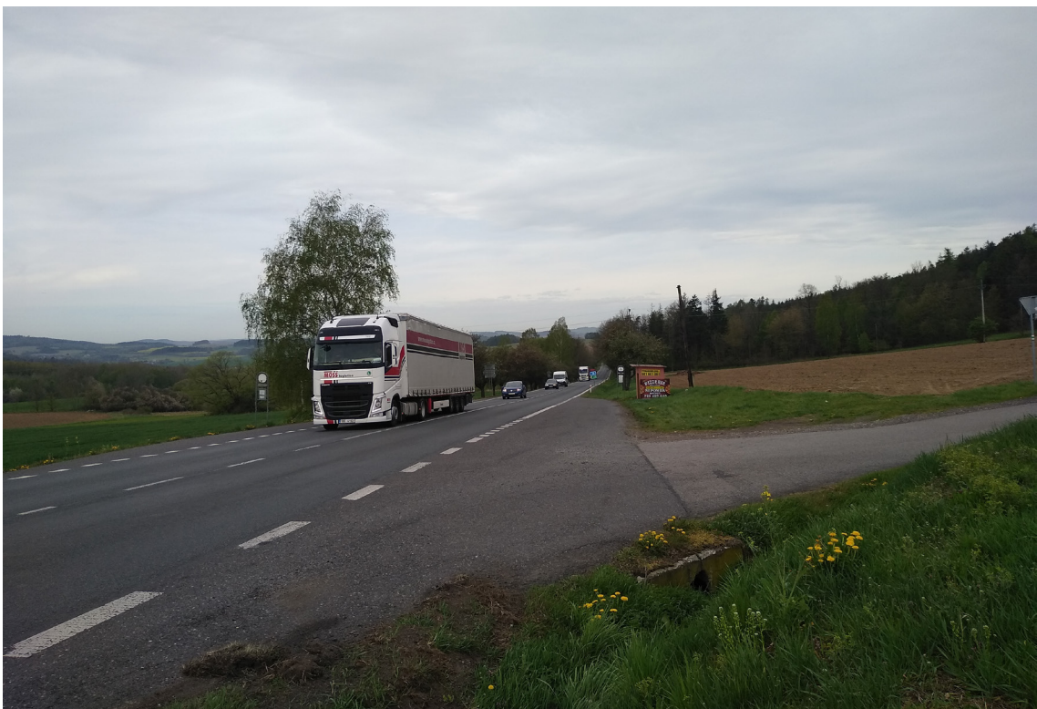
2.2 Současný rozhled z napojení III/02014 (Podhůří) na I/20 (směr na Nepomuk)