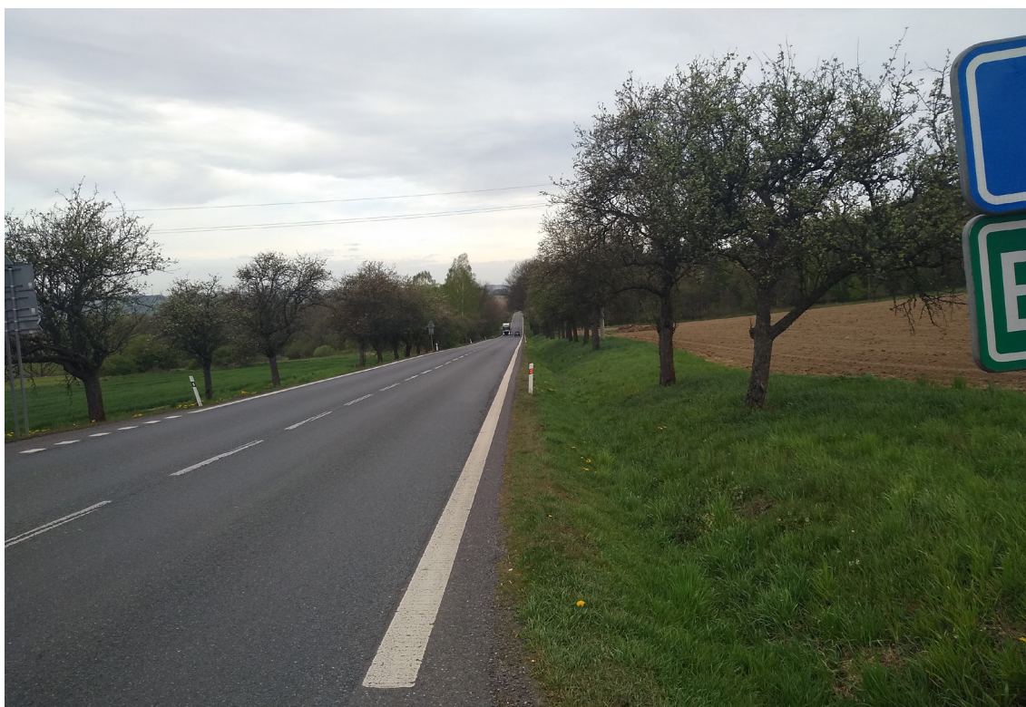
4.2 Pohled na příjezd k předpokládanému místu křížení I/20 (ze směru Životice)