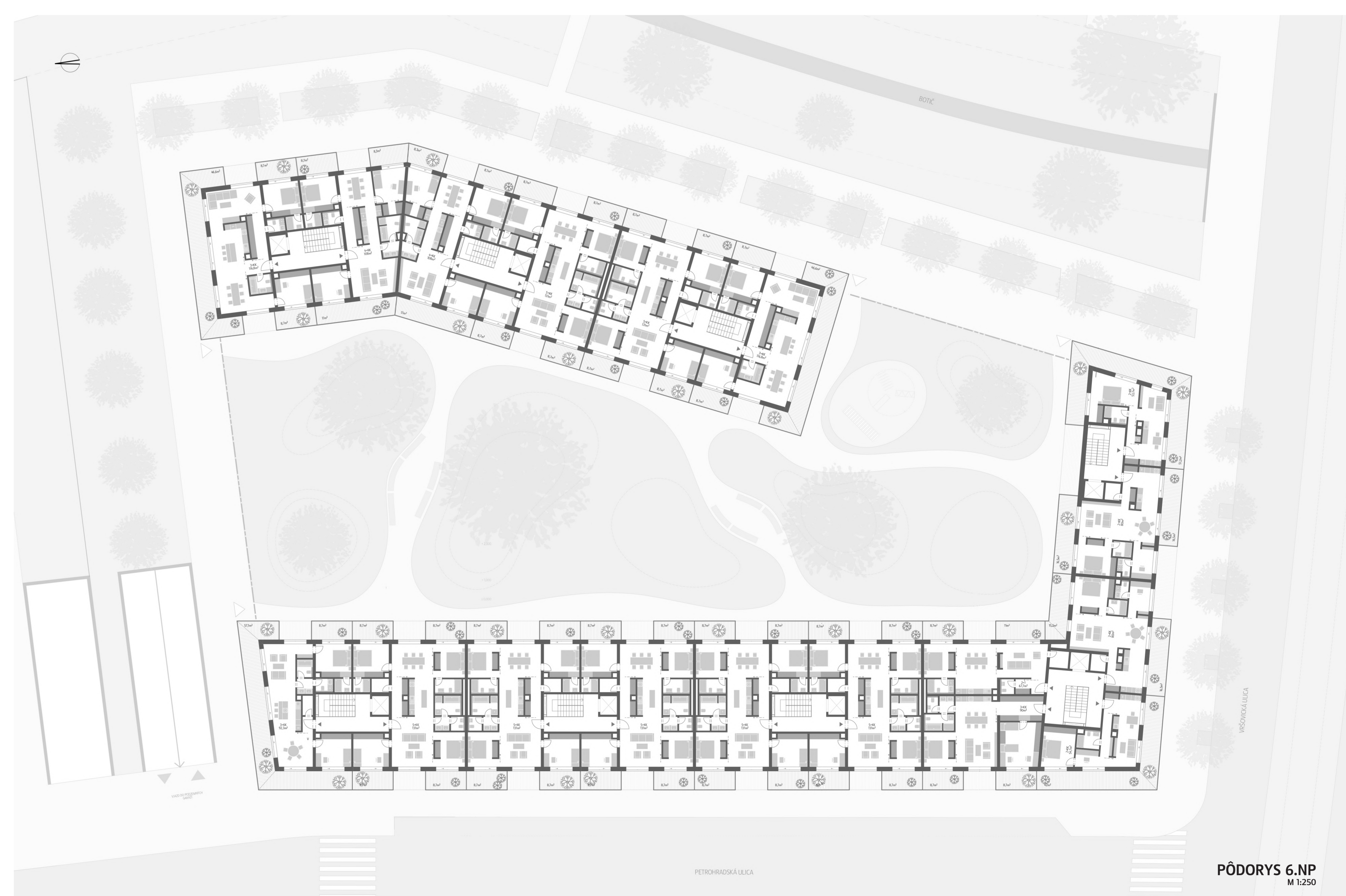
PÓDORYS 6.NP M 1:250