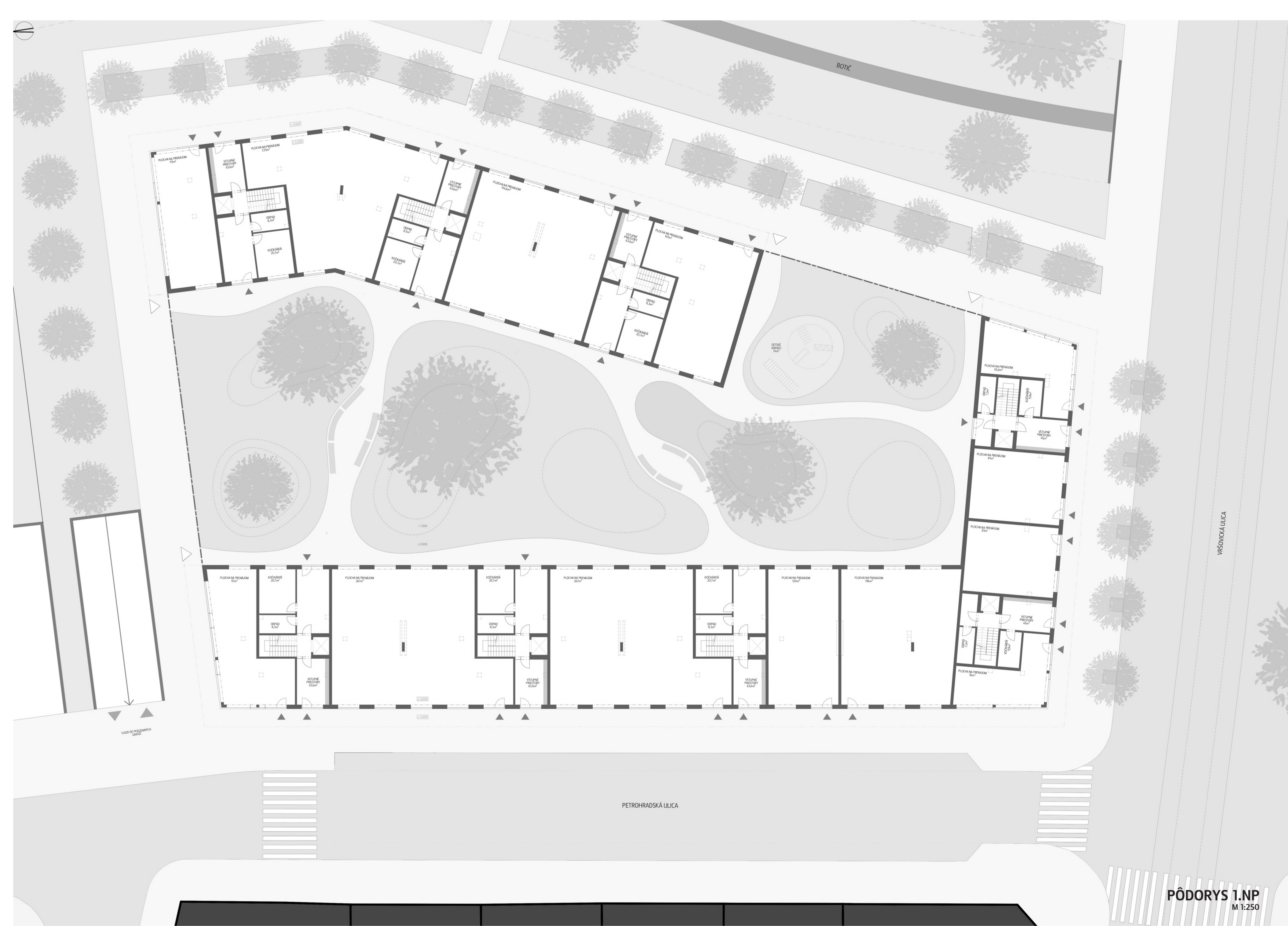
PÓDORYS 1.NP M 1:250