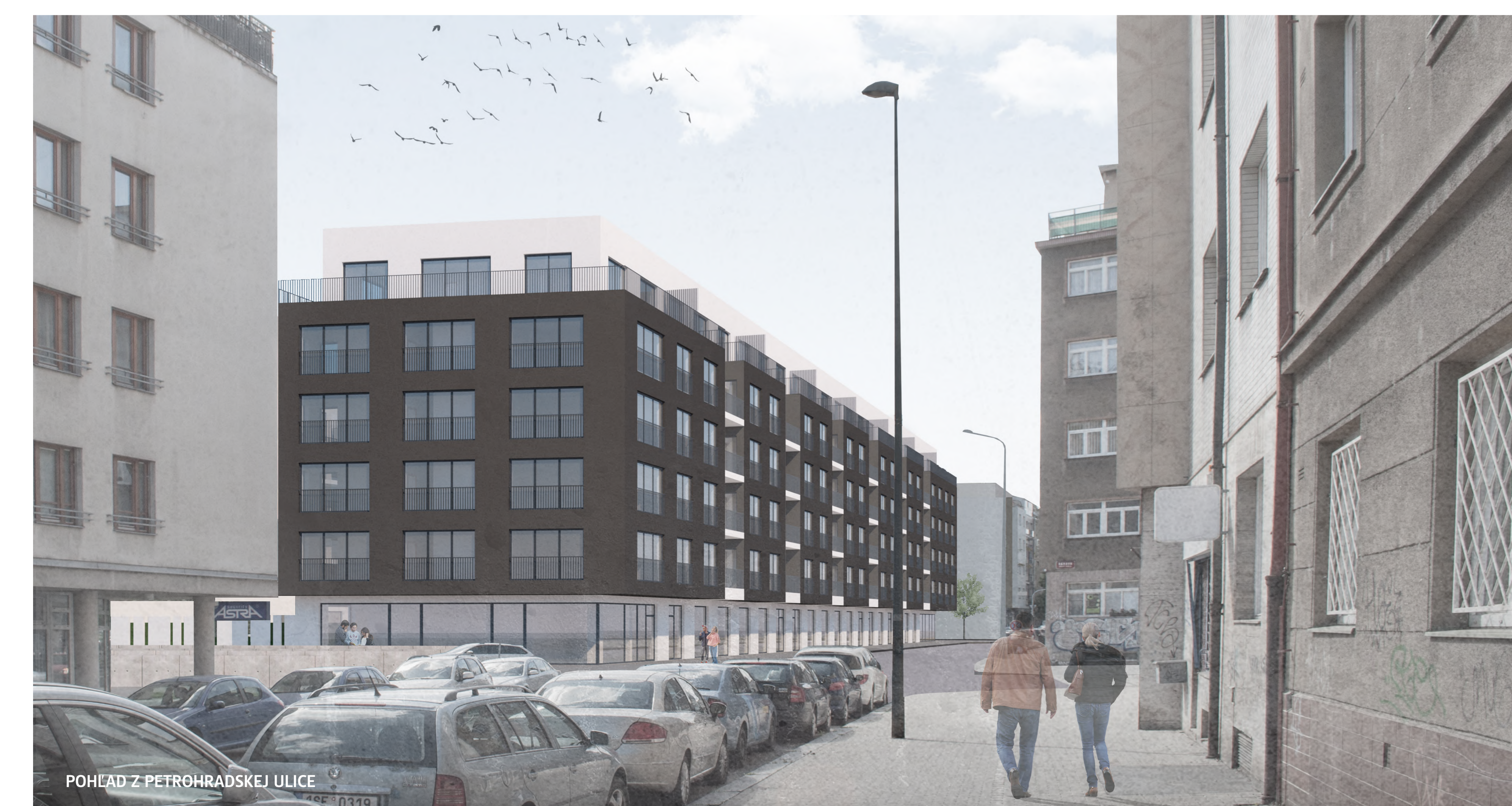
POHLED Z PETROHRADSKÉ ULICE