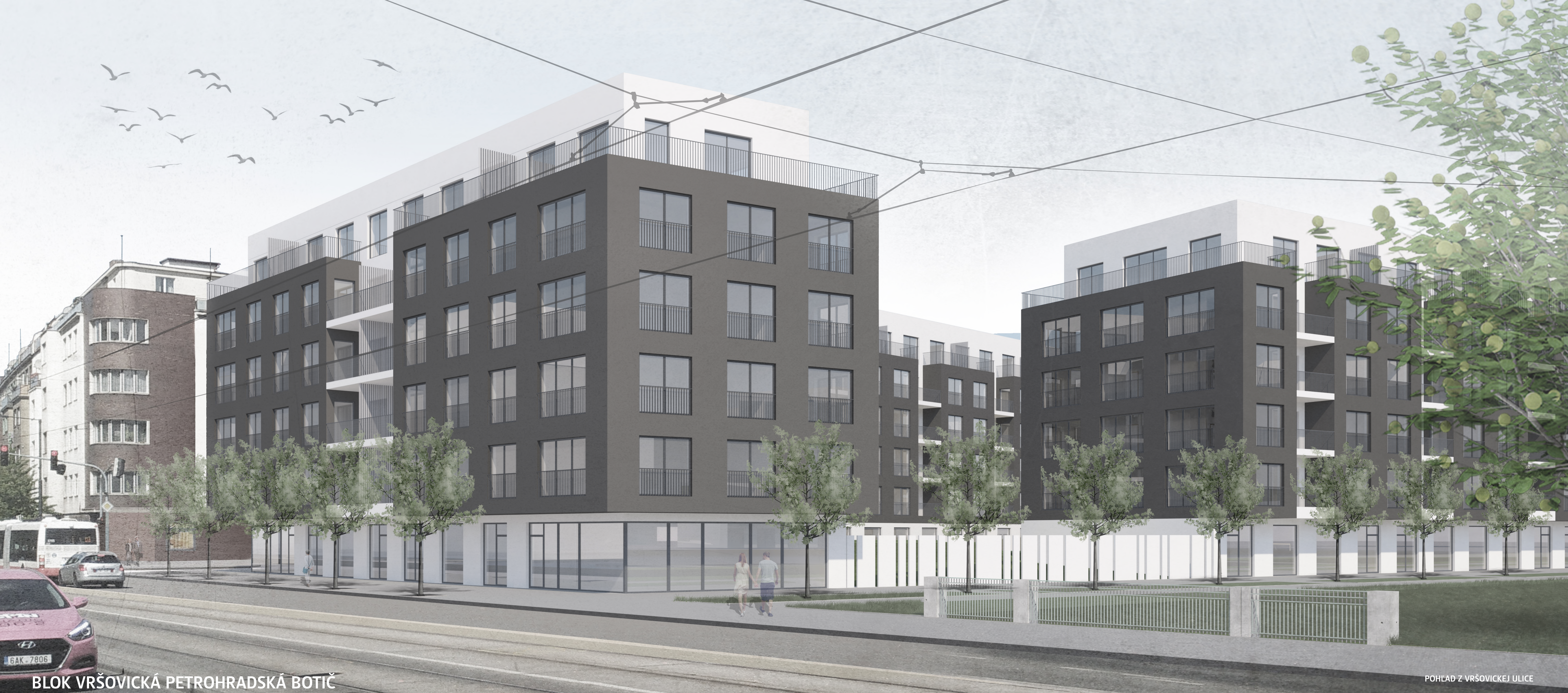
BLOK VRŠOVICKÁ PETROHRADSKÁ BOTIČ