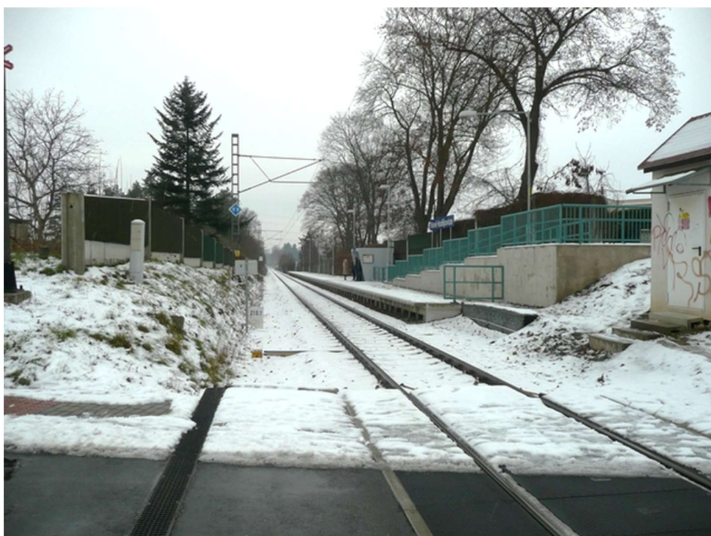
Obrázek B.6 – Zast. Nové Hodějovice