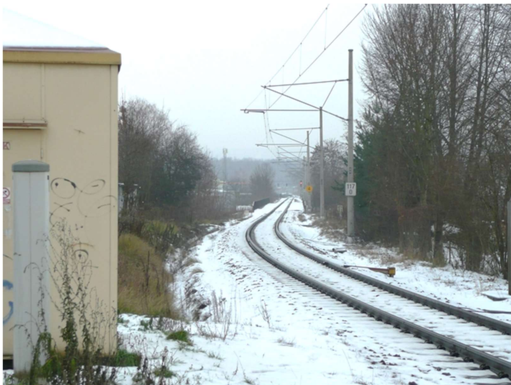
Obrázek B.1 – Pohled směrem od zast. Č. Budějovice Jižní zastávka k mostu přes řeku Malši