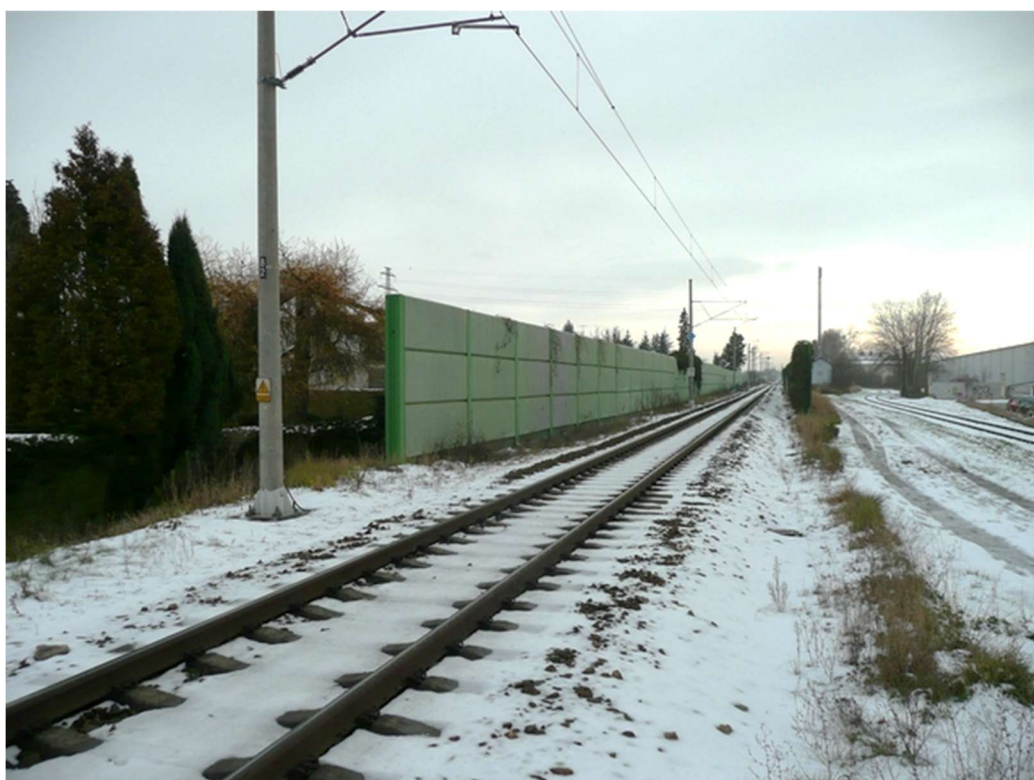
Obrázek B.4 – Trať č. 706A v městské části Rožnov