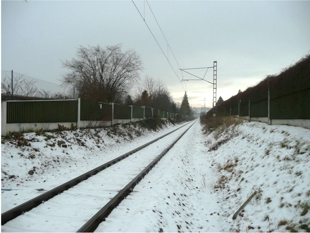
Obrázek B.7 – Trať č. 705A v Nových Hodějovicích