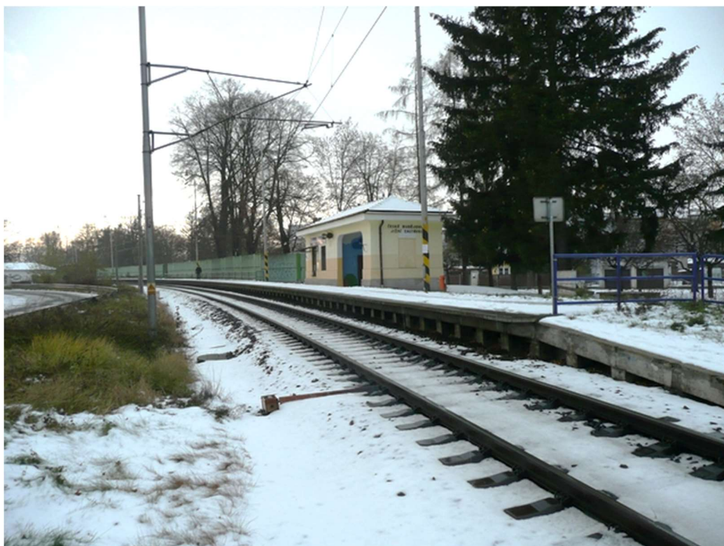
Obrázek B.2 – České Budějovice Jižní zastávka