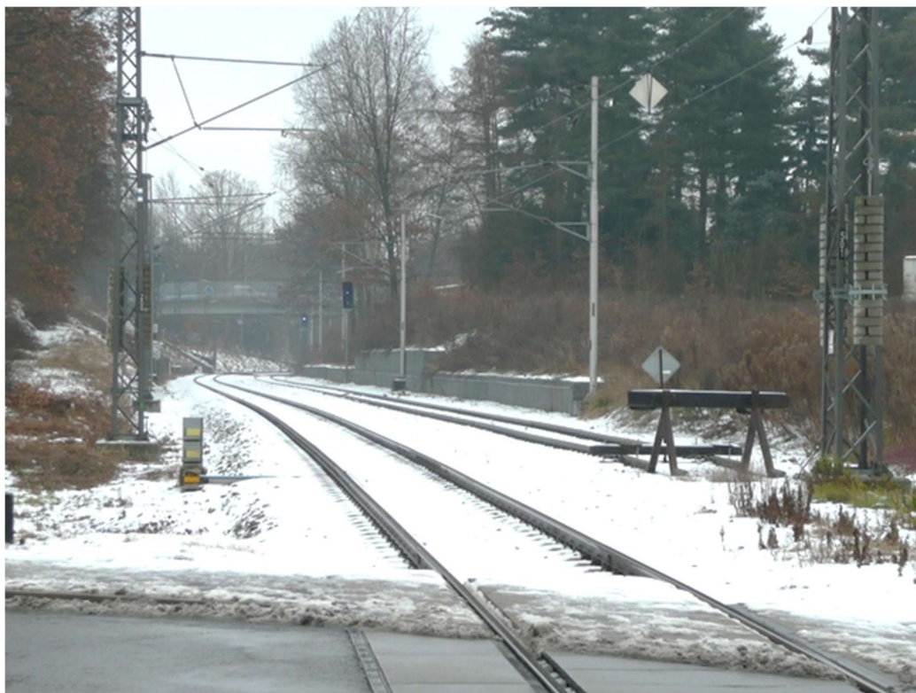
Obrázek B.5 – Pohled od křížení s ulicí Novohradská směrem k žst. České Budějovice