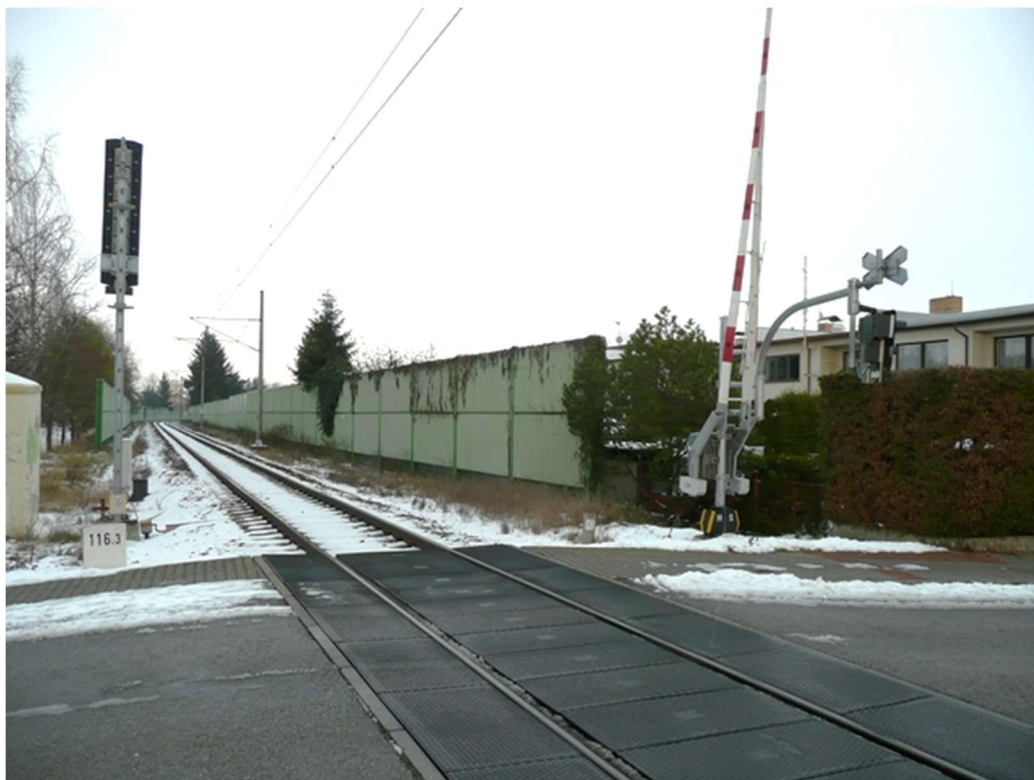
Obrázek B.3 – Trať č. 706A v městské části Rožnov