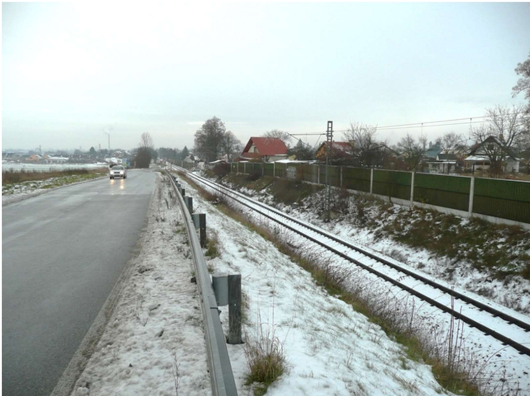
Obrázek B.8 – Trať č. 705A v Nových Hodějovicích