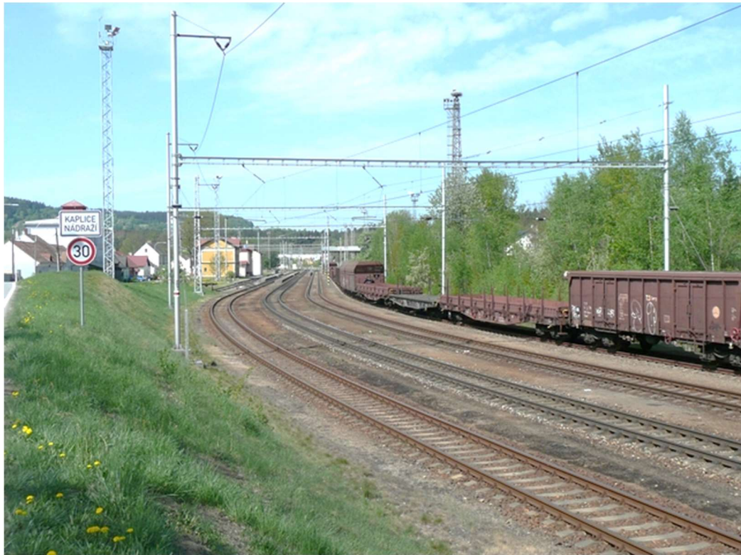
Obrázek A.7 – Žst. Kaplice