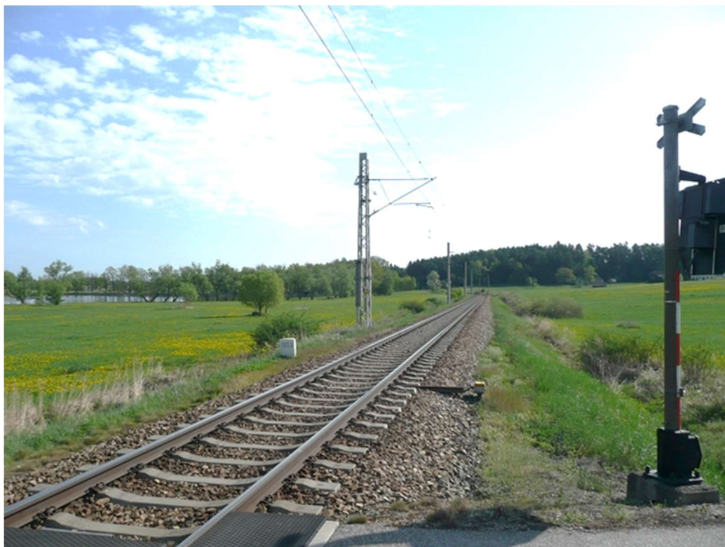
Obrázek A.1 – Trať č. 706A v blízkosti obce Milíkovice