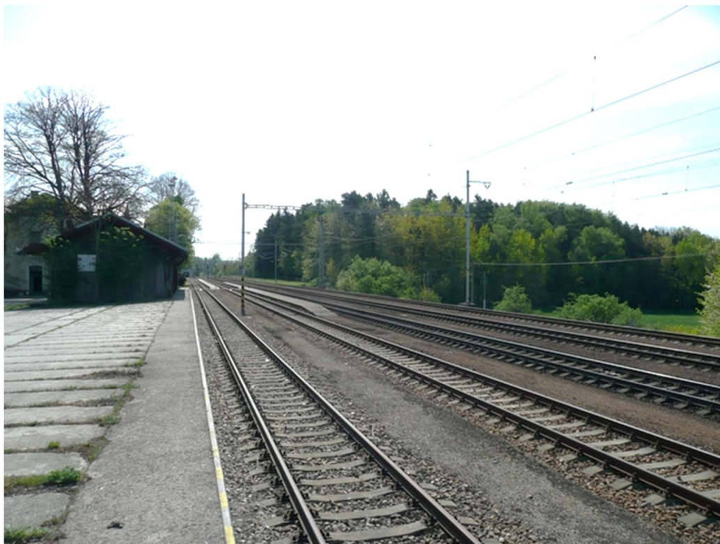
Obrázek A.5 – Žst. Velešín