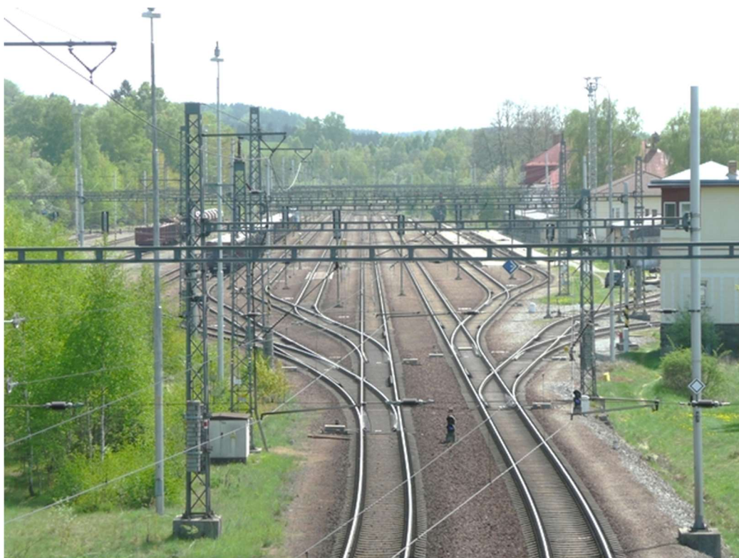
Obrázek A.10 – Žst. Horní Dvořiště