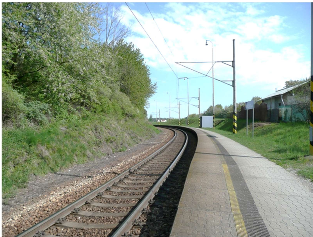
Obrázek A.3 – Zastávka Velešín město