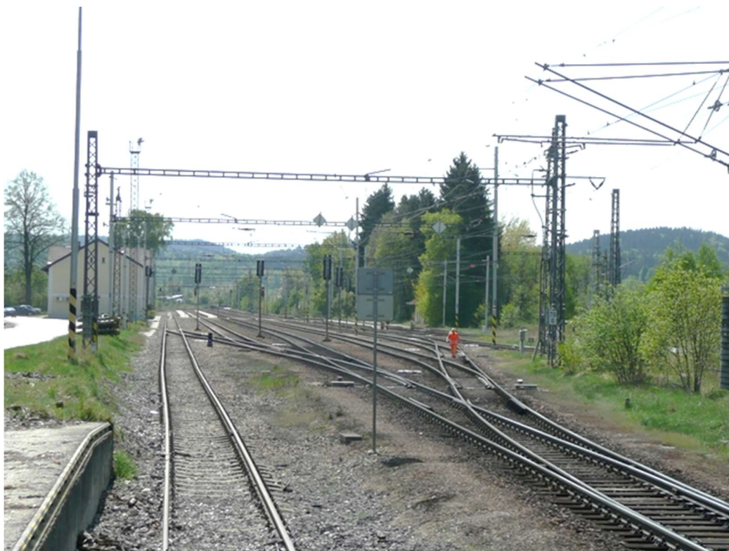
Obrázek A.9 – Žst. Rybník