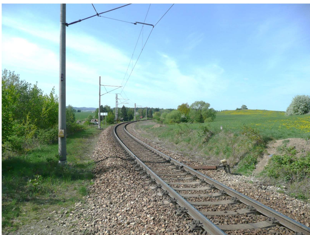
Obrázek A.4 – Trať č. 706A v blízkosti zast. Velešín město