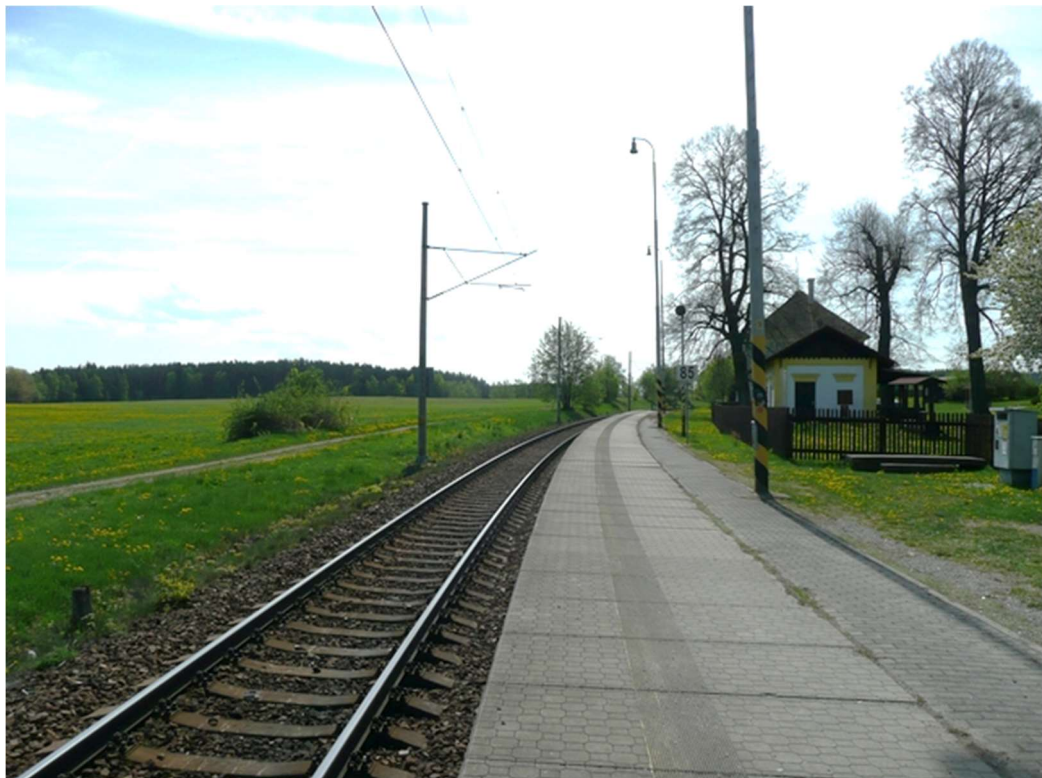
Obrázek A.8 – Zast. Bujanov