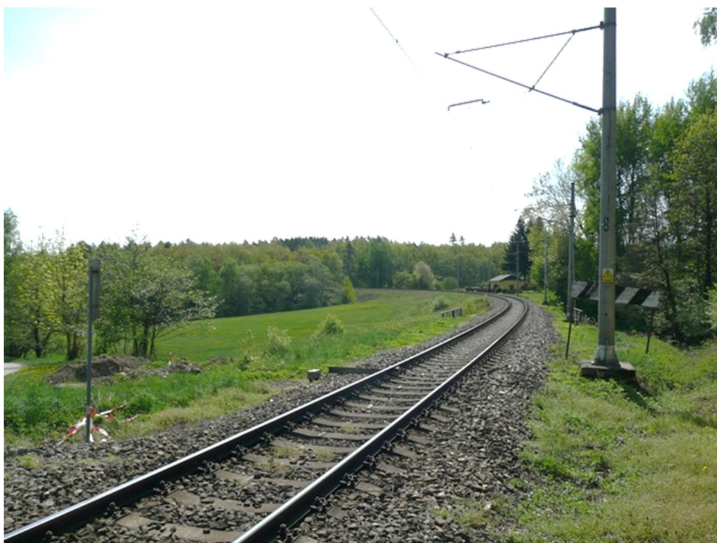
Obrázek A.6 – Trať č. 706A v blízkosti obce Netřebice