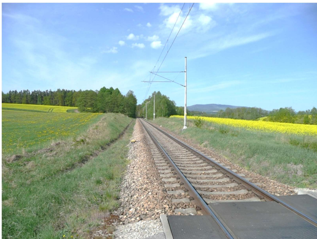
Obrázek A.2 – Trať č. 706A v blízkosti obce Milíkovice