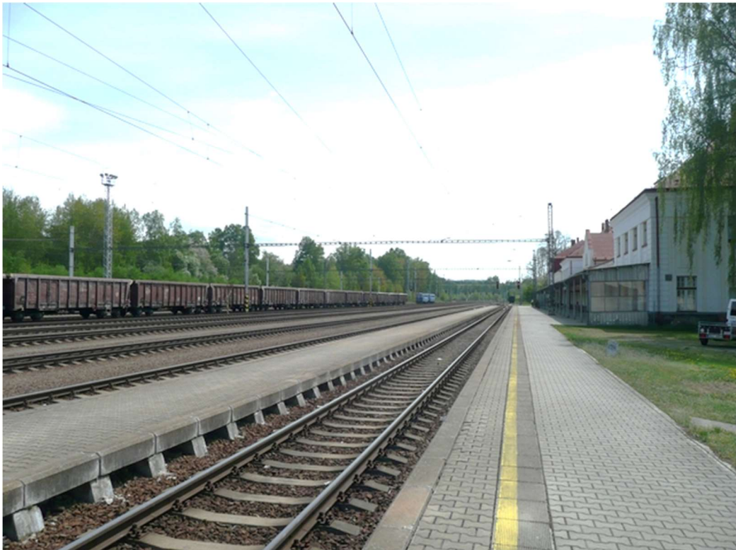
Obrázek A.12 – Žst. Horní Dvořiště