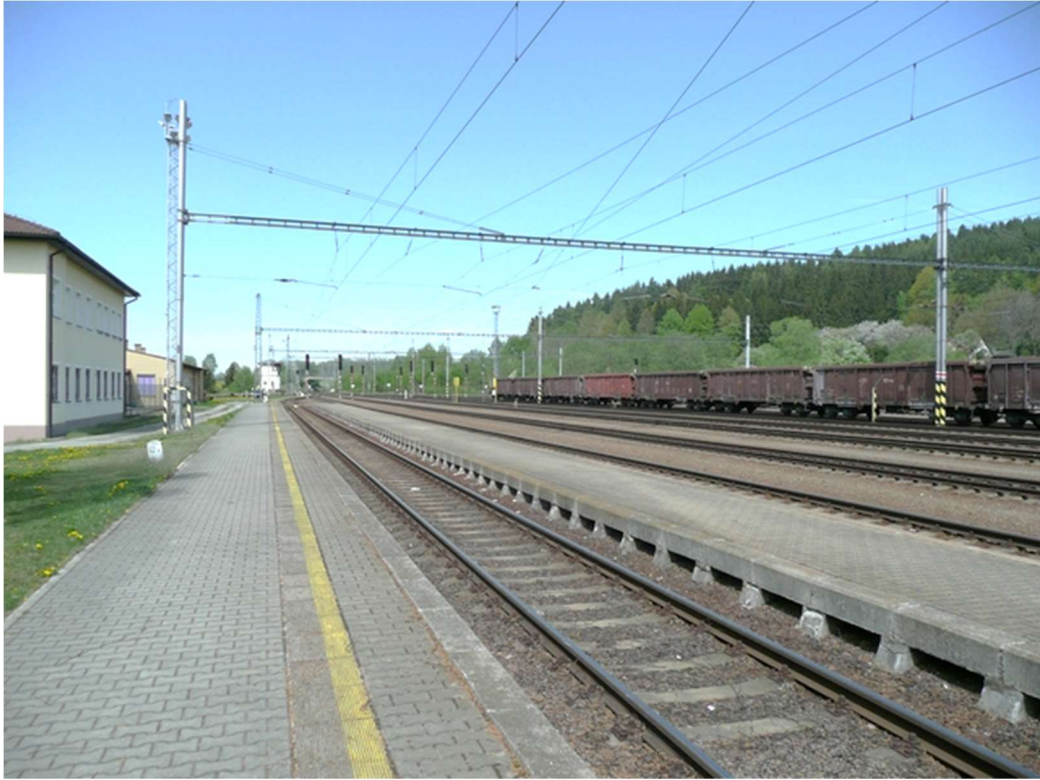
Obrázek A.11 – Žst. Horní Dvořiště