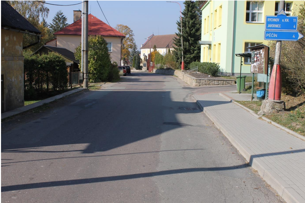
Obrázek č.17 – Pohled na autobusovou zastávku č.6a a zpevněnou plochu před ZŠ