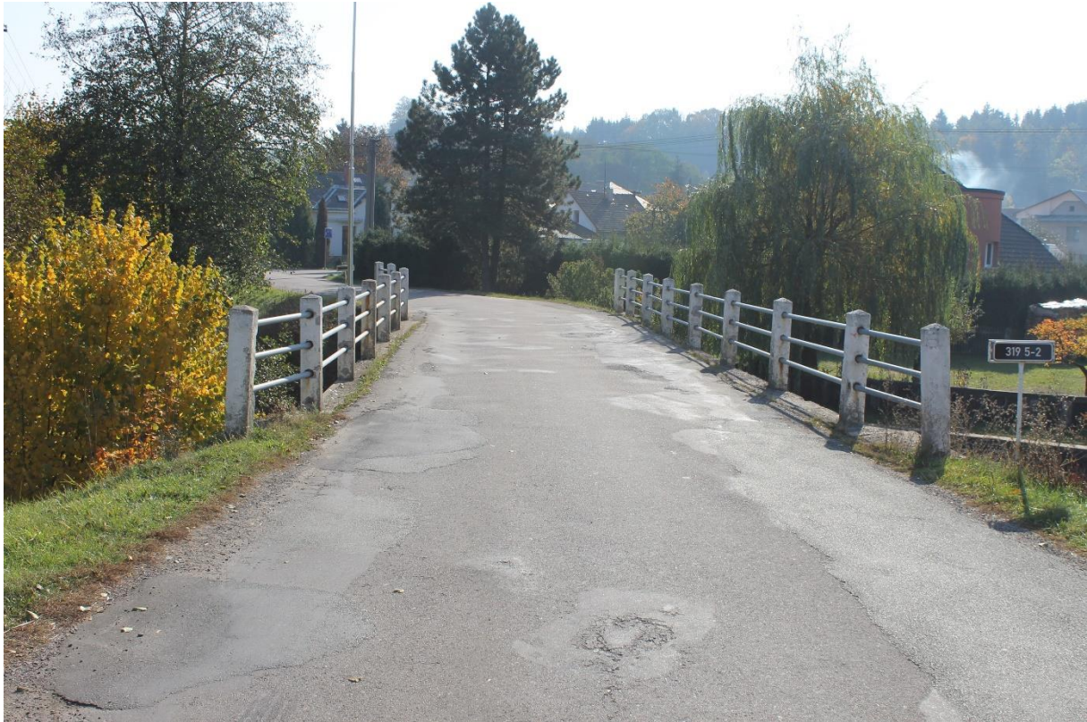
Obrázek č.21 – Pohled na most ev. č. 3195-2 proti směru staničení