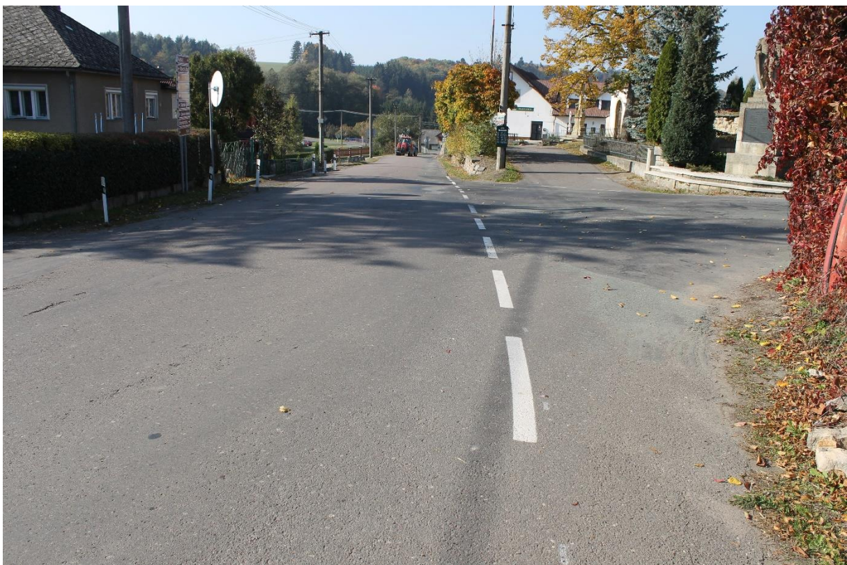
Obrázek č.18 – Pohled na křižovatku se silnicí III/3198