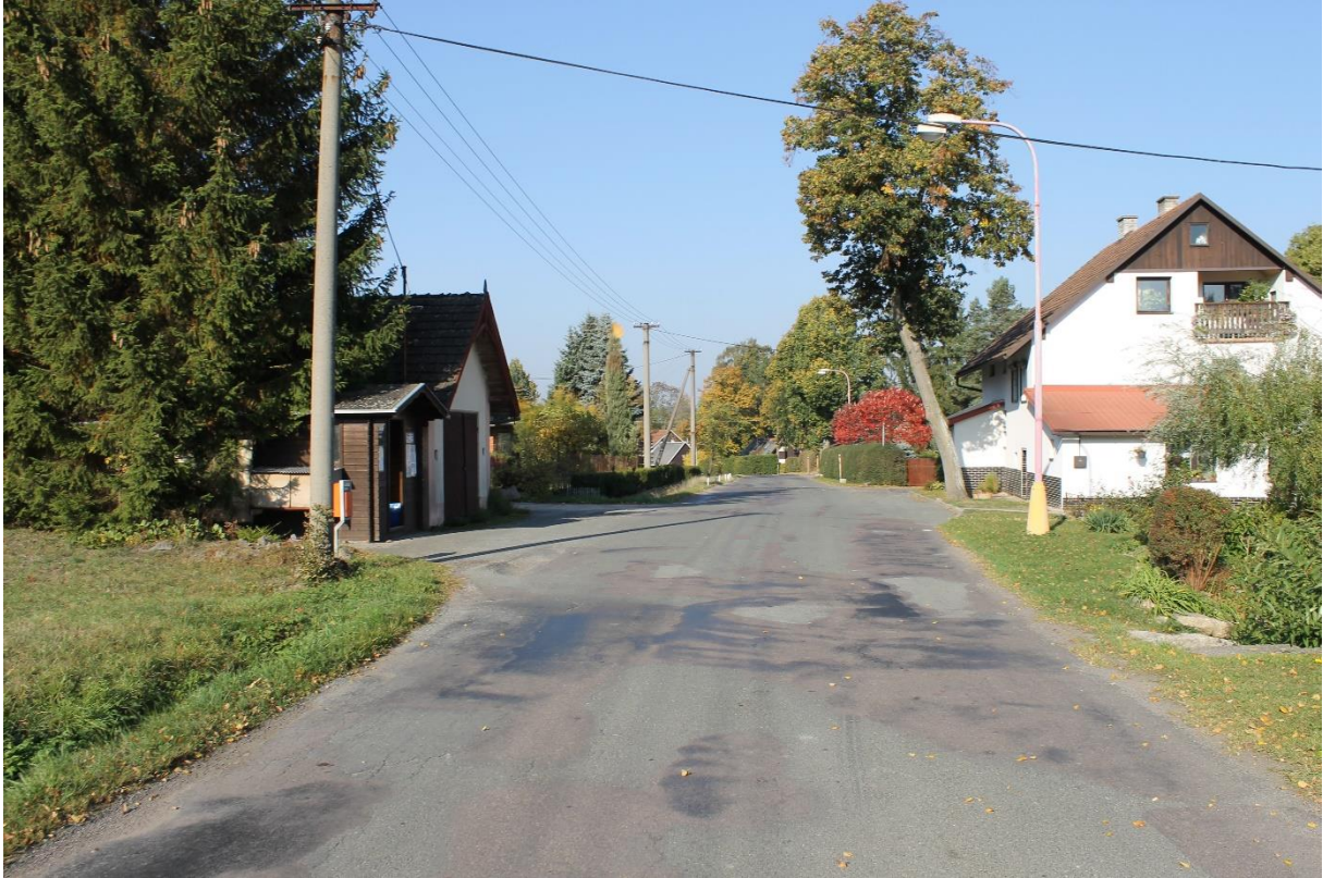
Obrázek č.7 – Pohled na autobusovou zastávku č.3 ve směru staničení