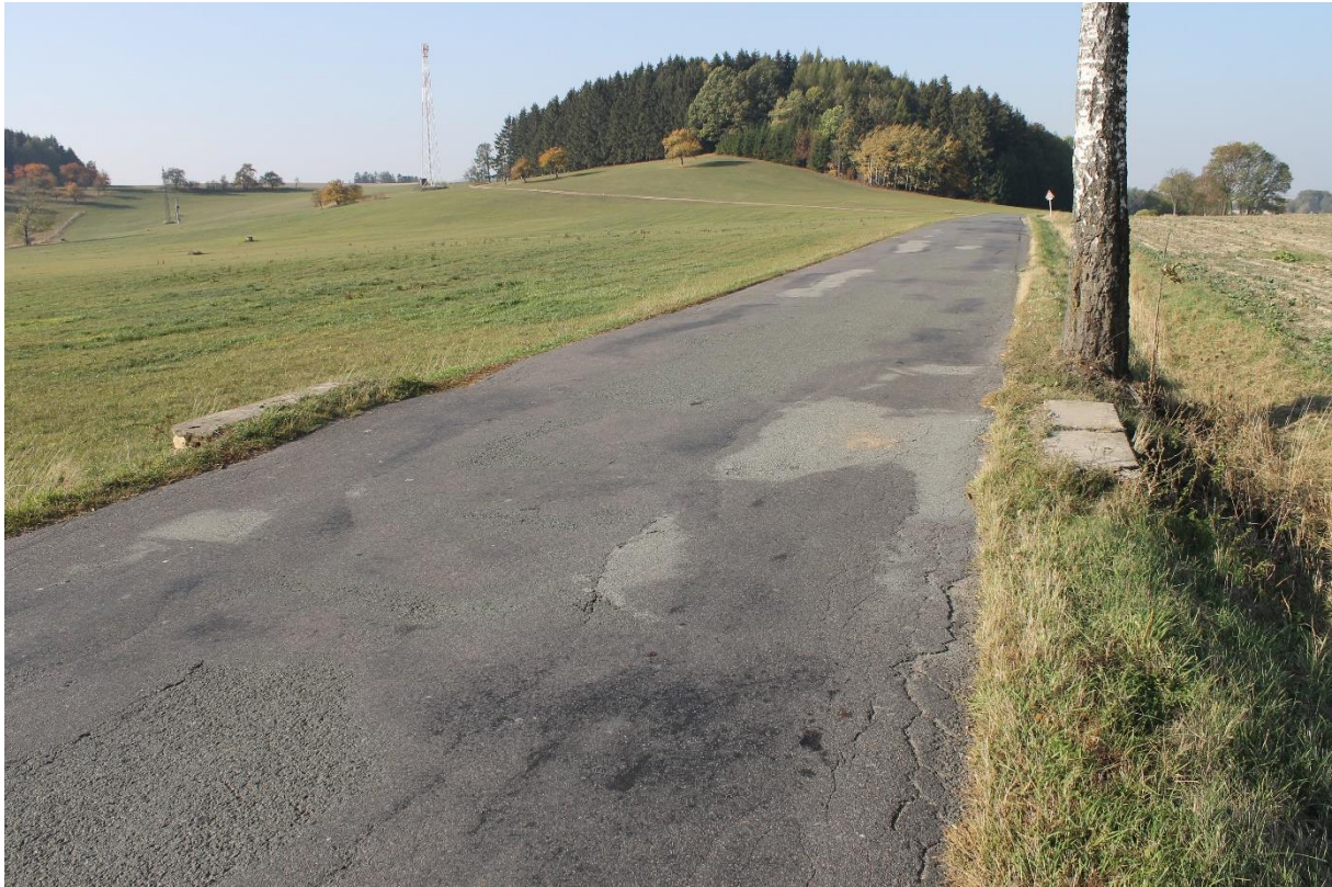
Obrázek č.3 – Pohled na propustek č.1