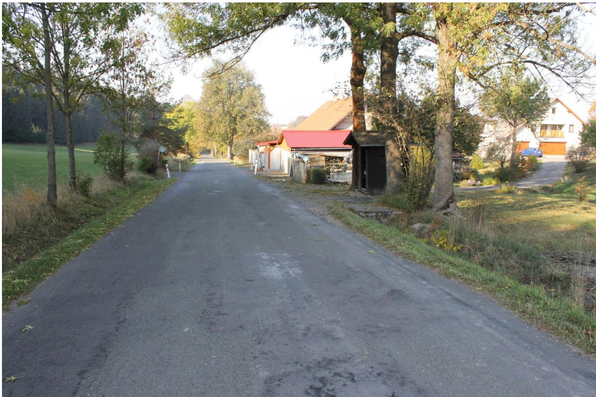
Obrázek č.4 – Pohled na autobusovou zastávku č.2 ve směru staničení