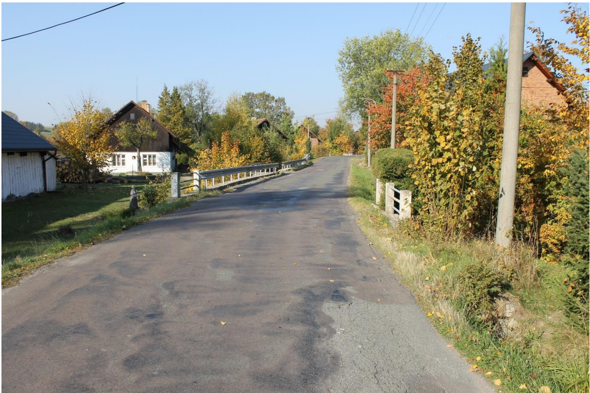
Obrázek č.8 – Pohled na propustek č.3 a opěrnou stěnu vlevo s římsou a svodidlem