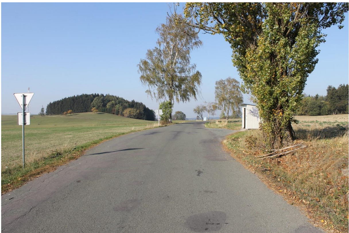
Obrázek č.2 – Pohled od křižovatky se silnicí II/310 na autobusovou zastávku č.1