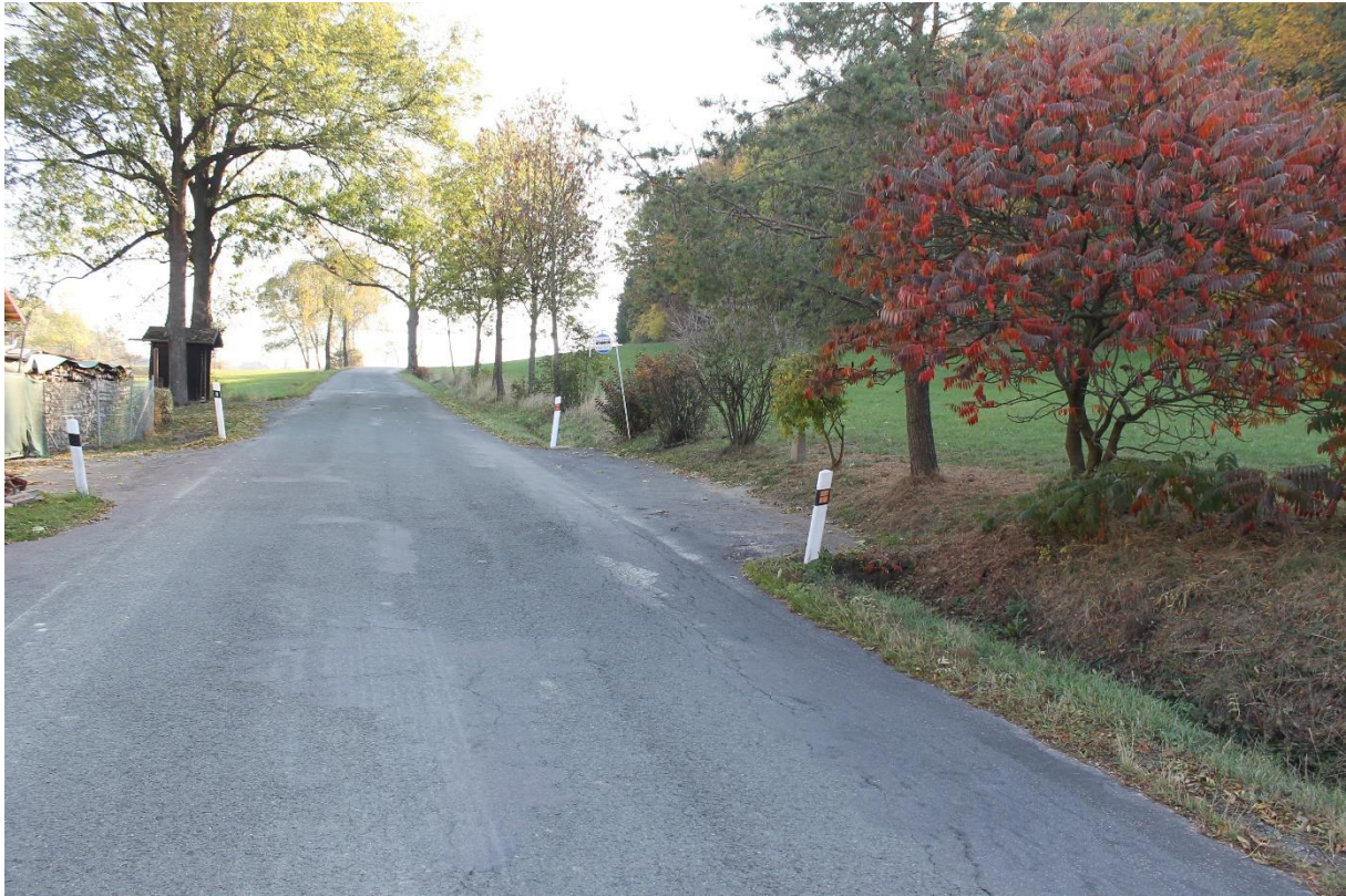
Obrázek č.5 – Pohled na autobusovou zastávku č.2 proti směru staničení