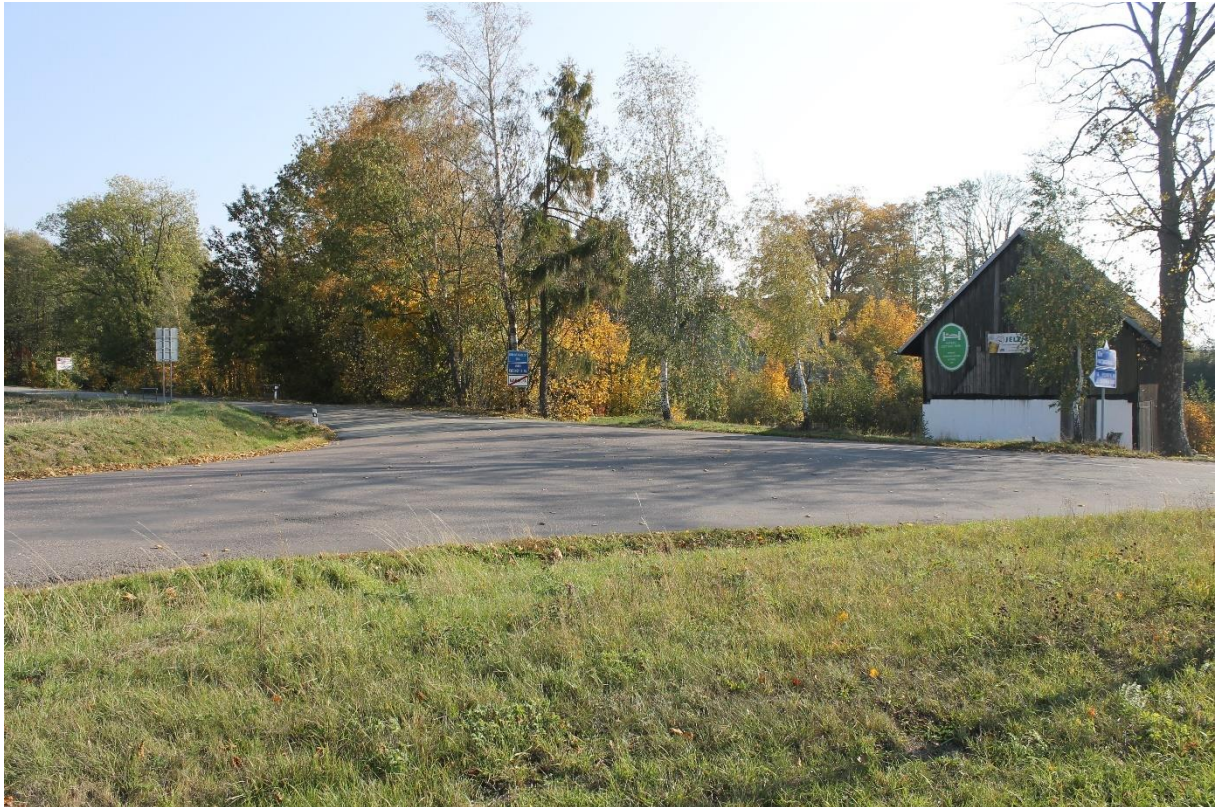
Obrázek č.1 – Pohled na křižovatku se silnicí II/310 na začátku úseku