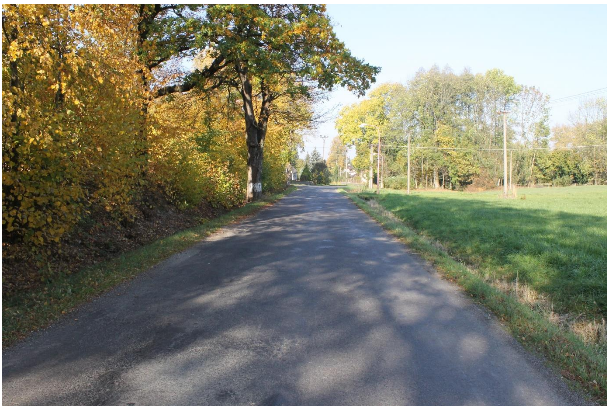
Obrázek č.6 – Pohled na komunikaci v místě začátku obce Slatina nad Zdobnicí