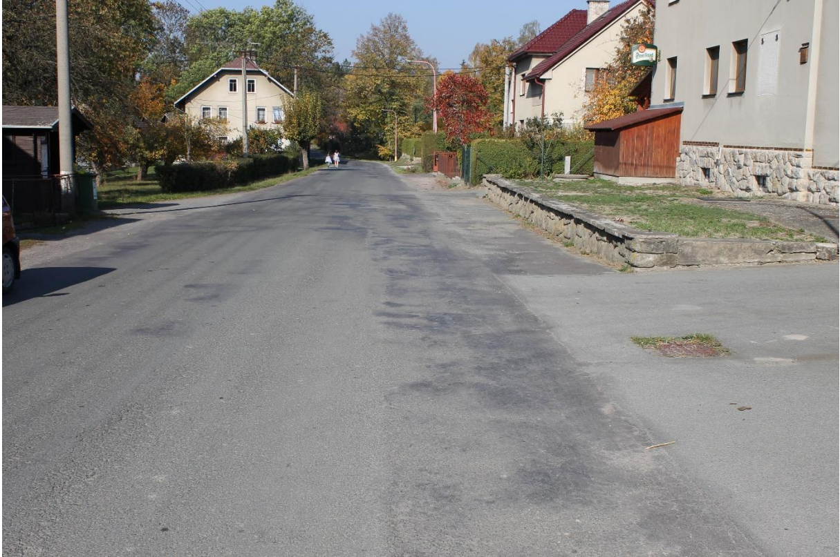
Obrázek č.13 – Pohled na autobusovou zastávku č.5a ve směru staničení