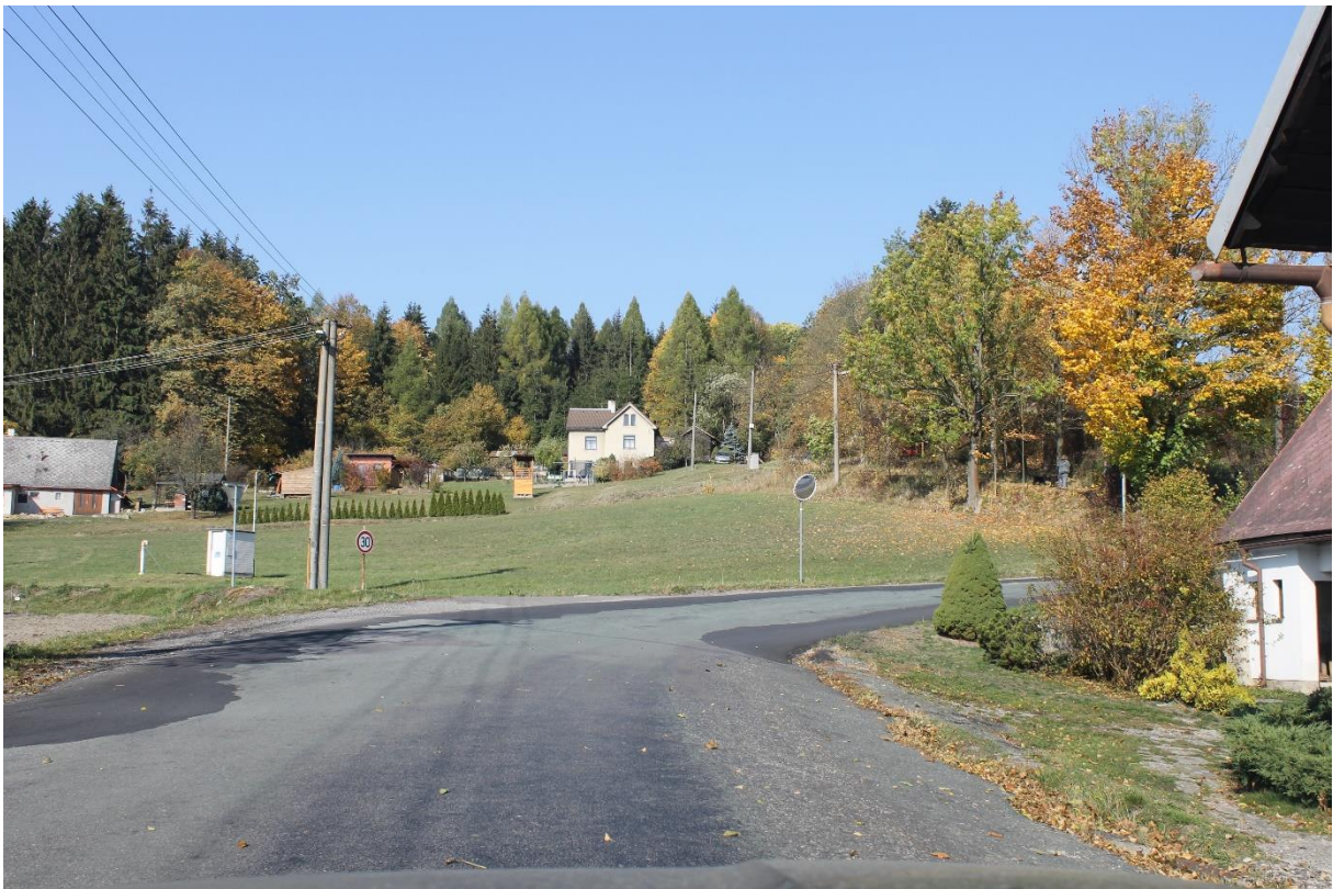
Obrázek č.24 – Pohled na poslední směrový oblouk R_{47} ve směru staničení