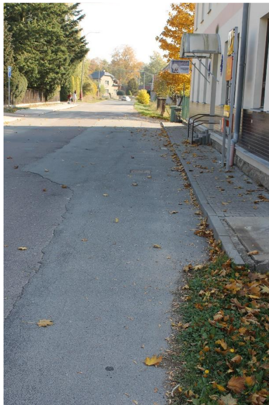
Obrázek č.16 – Pohled na stávající chodník před poštou a obecním úřadem