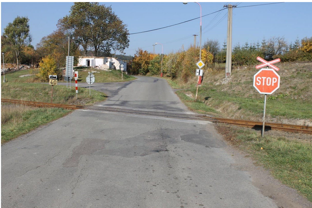
Obrázek č.22 – Pohled na železniční přejezd P4134 ve směru staničení