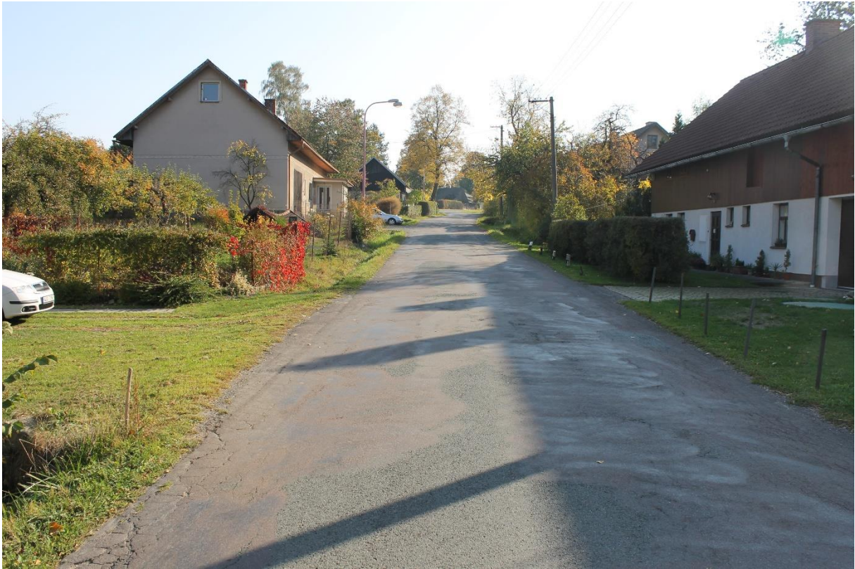
Obrázek č.9 – Pohled na komunikaci od propustku č.3 proti směru staničení