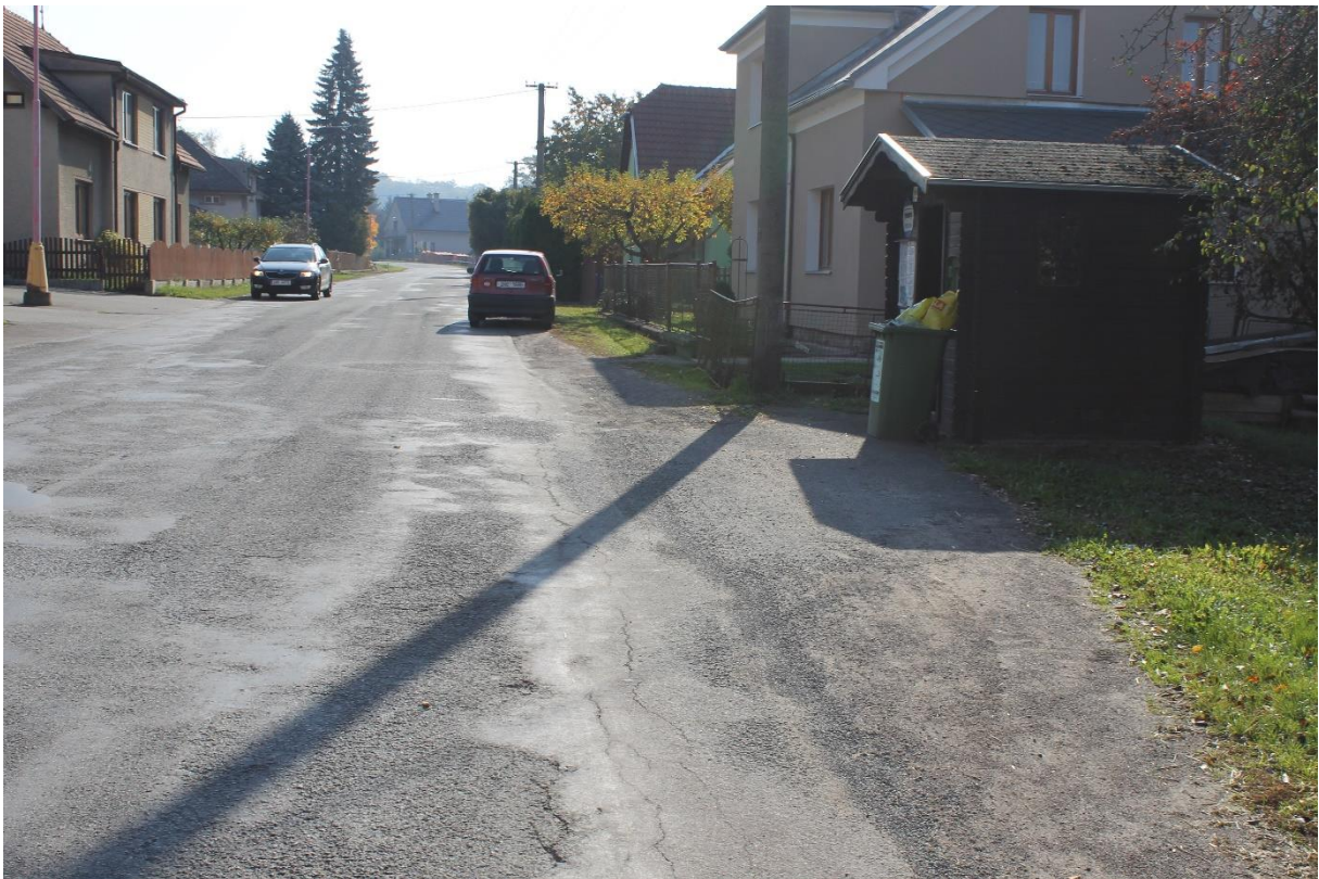
Obrázek č.14 – Pohled na autobusovou zastávku č.5b proti směru staničení