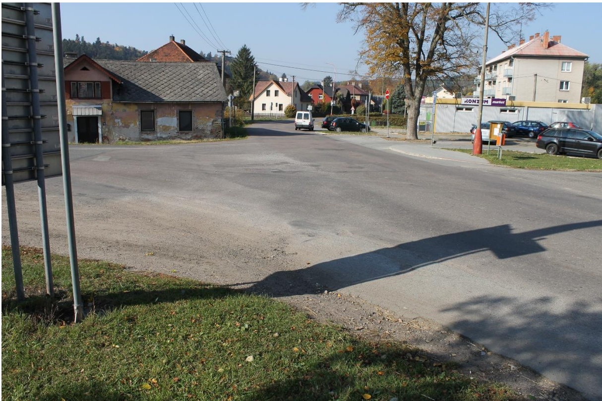
Obrázek č.20 – Pohled na křižovatku se silnicí III/3128 ve směru staničení