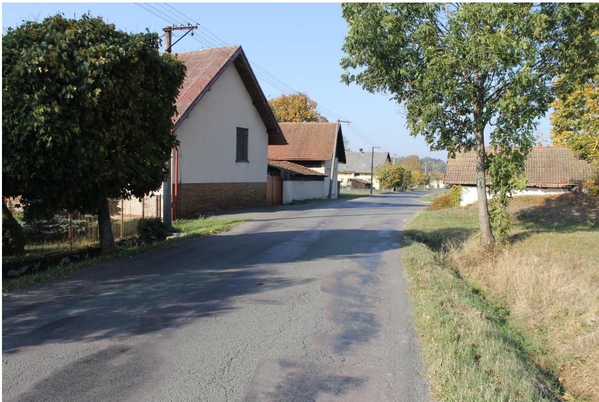
Obrázek č.11 – Pohled na autobusovou zastávku č.4 ve směru staničení