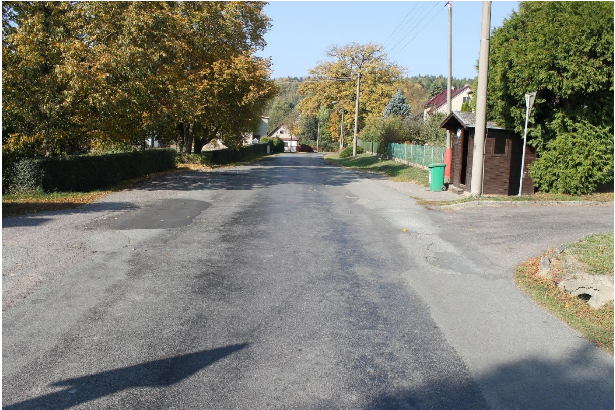
Obrázek č.23 – Pohled na autobusovou zastávku č.7 ve směru staničení