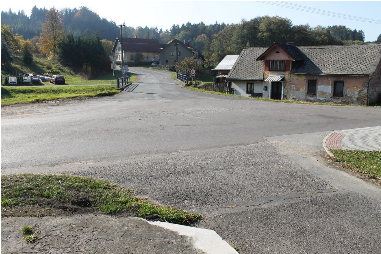
Obrázek č.19 – Pohled na křižovatku se silnicí III/3128 od parkoviště