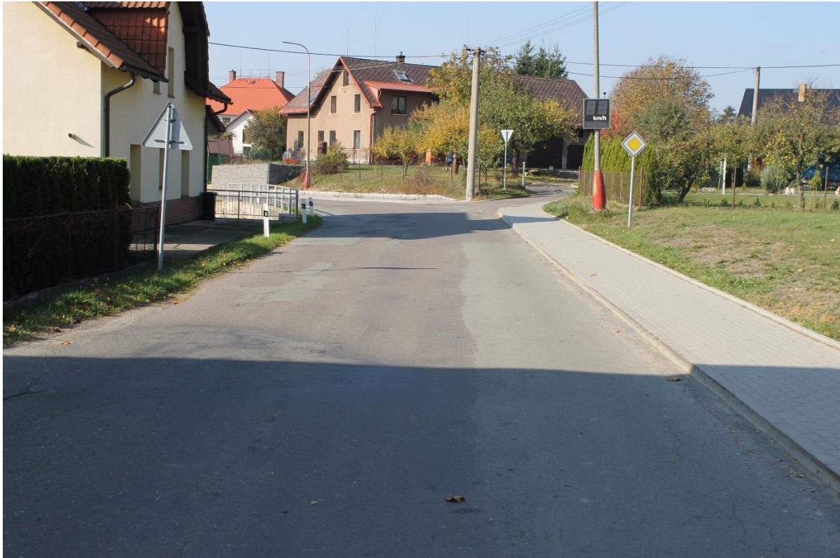
Obrázek č.15 – Pohled na komunikaci od obecního úřadu se stávajícím chodníkem