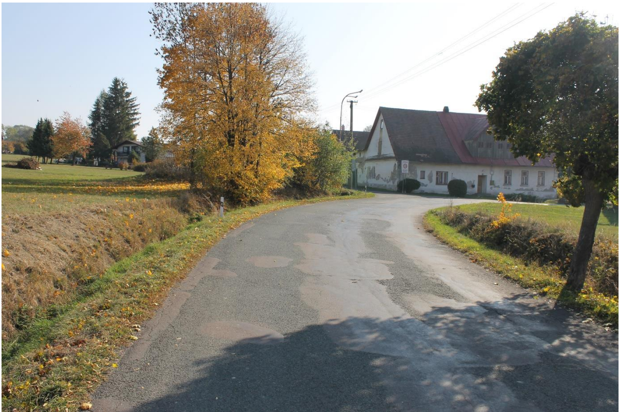
Obrázek č.10 – Pohled na směrový oblouk R_{22} proti směru staničení