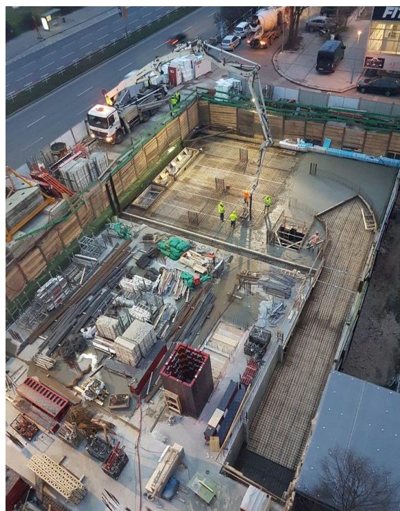
Obr. 4: Betonáž čerpadlem