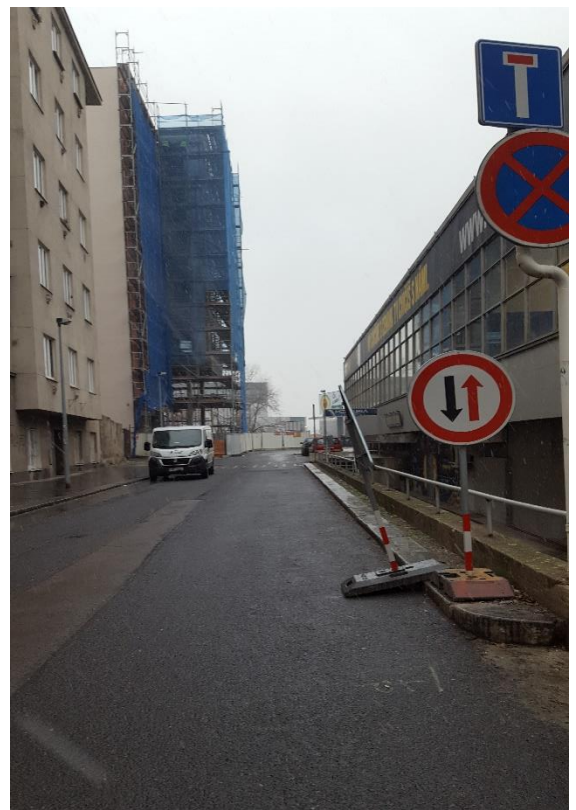
Obr. 8: Pohled do ulice V Zákoutí