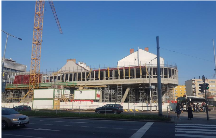
Obr. 1: Pohled z ulice Argentinská