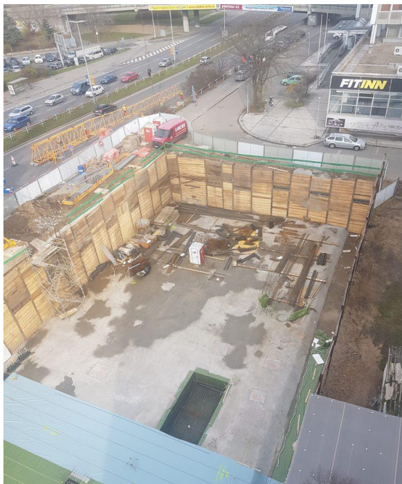
Obr. 1: Pohled do zapažené stavební jámy, záběr komunikace