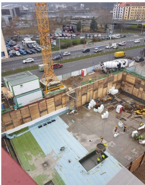
Obr. 3: Betonáž 2.PP za pomoci bádie