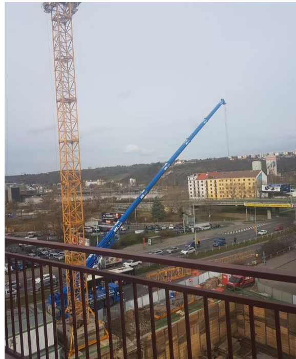
Obr. 2: Montáž věžového jeřábu, záběr komunikace