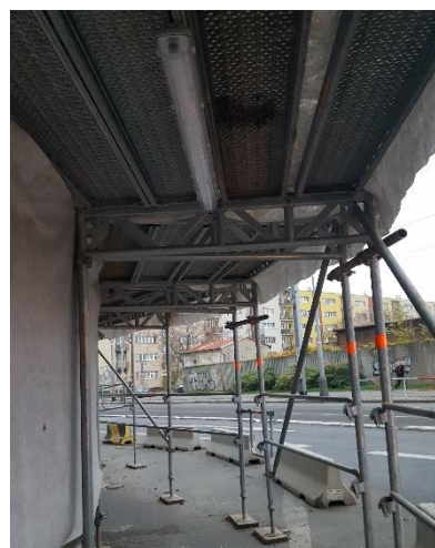
Obr. 11: Podchod pro chodce na rohu ulic Plynární a Argentinská