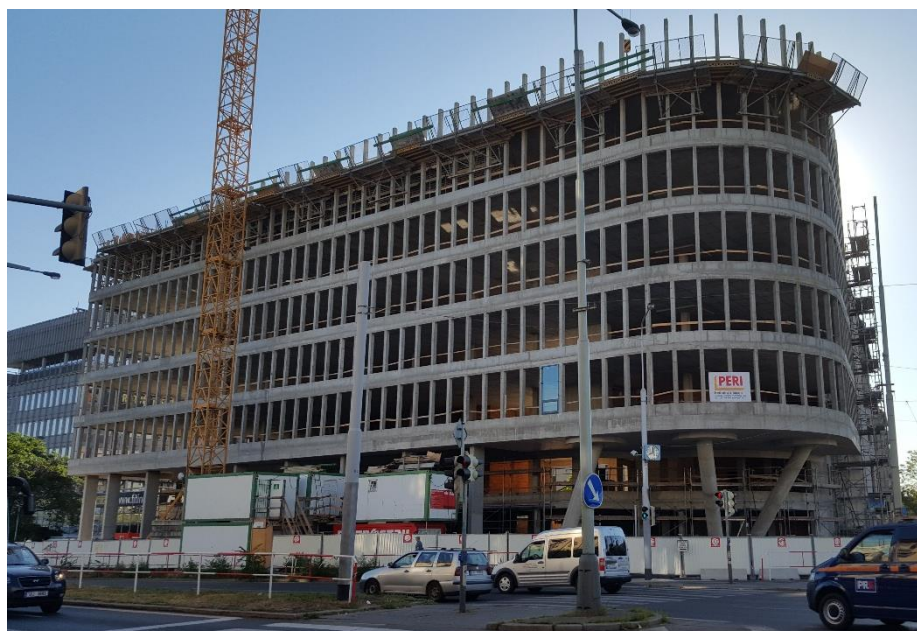
Obr. 5: Pohled z ul Argentinská, potřeba zábradlí ve všech podlažích