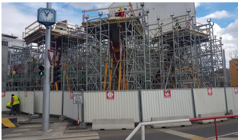
Obr. 3: Uzavření chodníku do ulice Plynární

Vypracovala: Bc. Denisa Kráčmerová Vedoucí diplomové práce: doc. Ing. Pavel Svoboda, CSc.