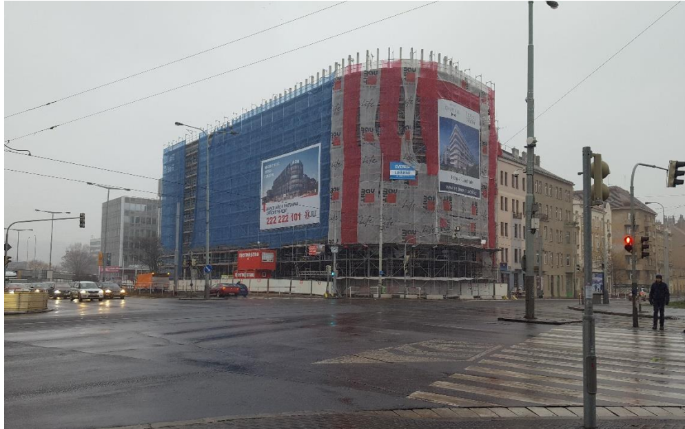
Obr. 6: Pohled od protější budovy Visionary dokončené v roce 2018