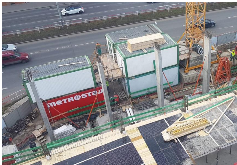
Obr. 4: Zařízení staveniště po dobu hrubé stavby