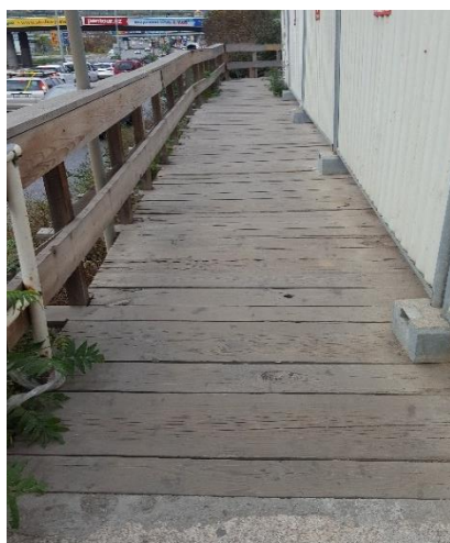
Obr. 10: Provizorní lávka pro chodce okolo staveniště do ul. V Zákoutí