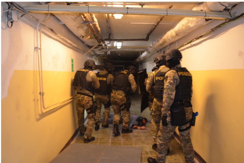
Foto - Součinnostní cvičení IZS ve Věznici Vinařice ze dne 23. 11. 2017(interní zdroj)