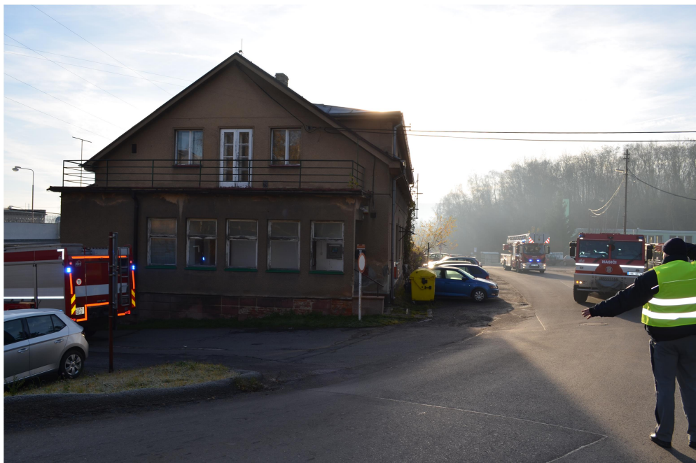
Foto - Součinnostní cvičení IZS ve Věznici Vinařice ze dne 23. 11. 2017(interní zdroj)