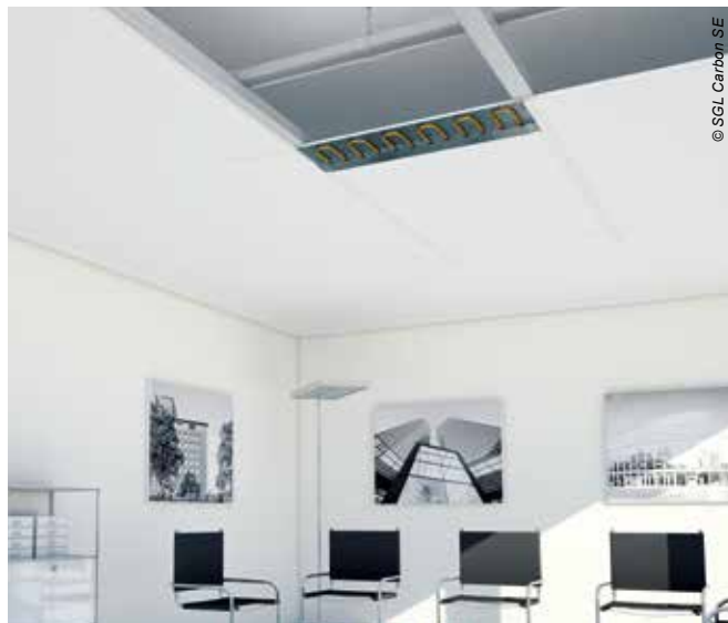
Uponor Varicool S - sálavé panely bez přiznaných spojů pro architektonicky čistý prostor

Uponor, s. r. o. Za Trati 197 196 00 Praha 9 Česká republika T +420 233 313 844 W www.uponor.cz