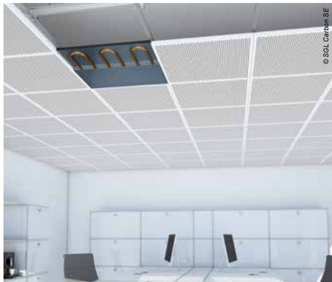
Uponor Varicool Carbon A - pohledové ocelové sálavé panely vhodné do administrativních celků

Ukládání panelů je možné do roštů anebo na závěsný systém s hmotností jen cca 10\text{ kg/m}^2 . Po připojení na rozvod chladicího/otopného média a následném hydraulickém vyregulování dosahují stropy v chladicím režimu až 120\text{ W/m}^2 a ve vytápěcím režimu až 133\text{ W/m}^2 ( \Delta\theta = 15\text{ K} ).