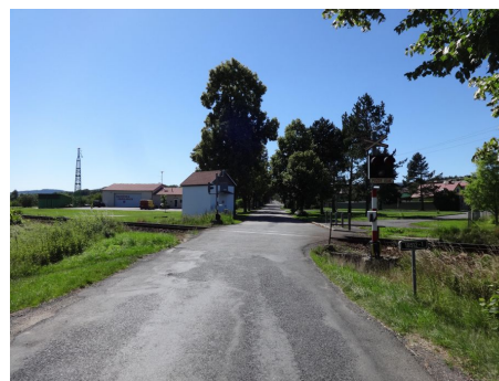
Absence retroreflexního podkladu SDZ A 32a "Výstražný kříž pro železniční přejezd jednokolejný"