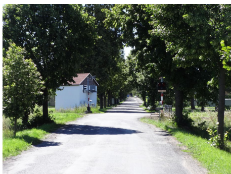
Zanikající výstražník PZS na pozadí neudržované zeleně