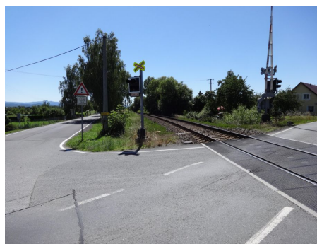
Pohled na křižovatku v bezprostřední blízkosti přejezdu