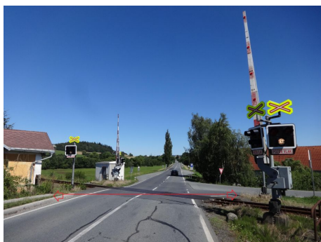
Vyznačení trajektorie "živelného přejíždění" přejezdu cyklisty