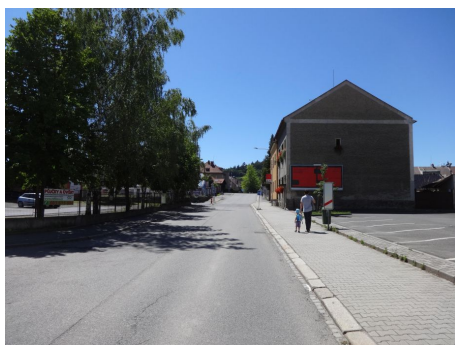
Pohled na celkově nevýrazný přejezd a absenci VDZ