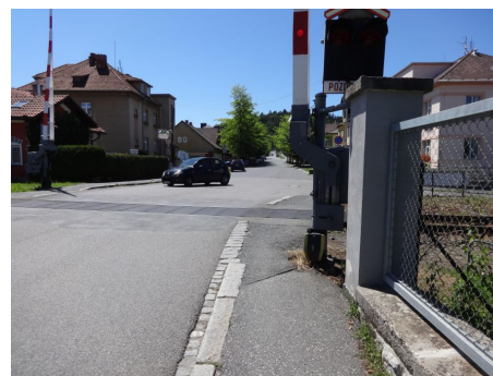
Nedostačující šířka chodníku spolu s absencí navigačních prvků pro osoby se sníženou schopností pohybu a orientace