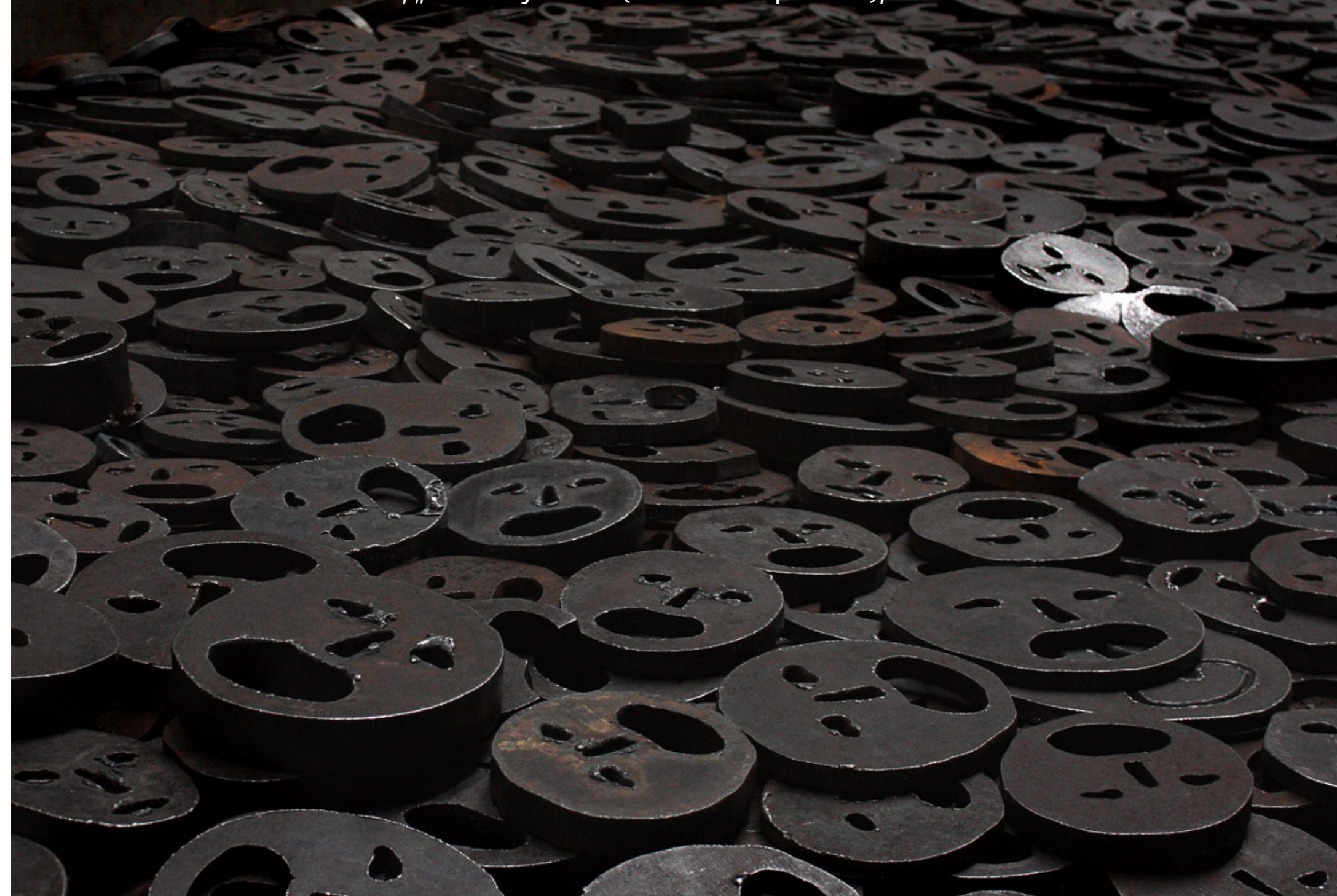
Židovské muzeum v Berlíně, „Memory Void“ (Prázdnota paměti), instalace Menashe Kadishmana