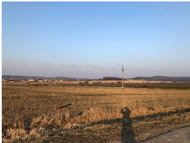
Začátek trasy a napojení ze silnice I/35