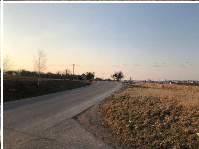
Přemostění silnice III/3182