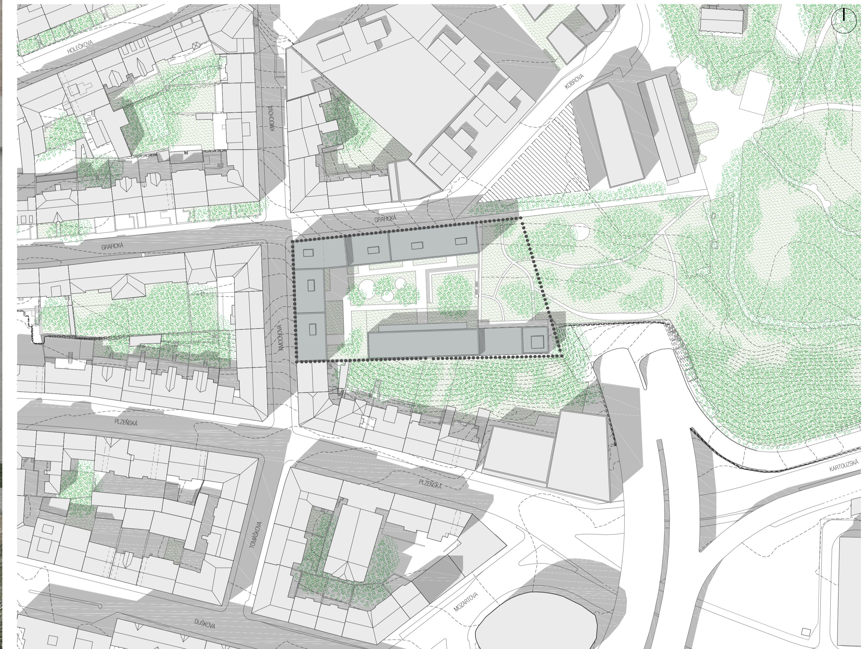
AREÁL BÝVALÉ NEUBERTOVY TISKÁRNY - BYTOVÝ DŮM S ATELIERY -