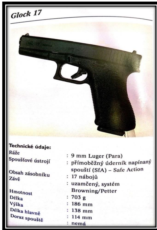
Fotografie a technická data část první pistole GLOCK 17 [14, str. 132]