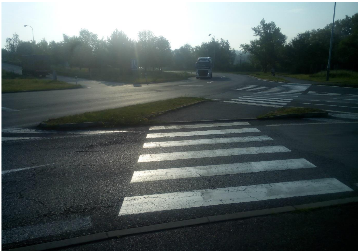
Obr.19 – Pohled na přechod pro chodce