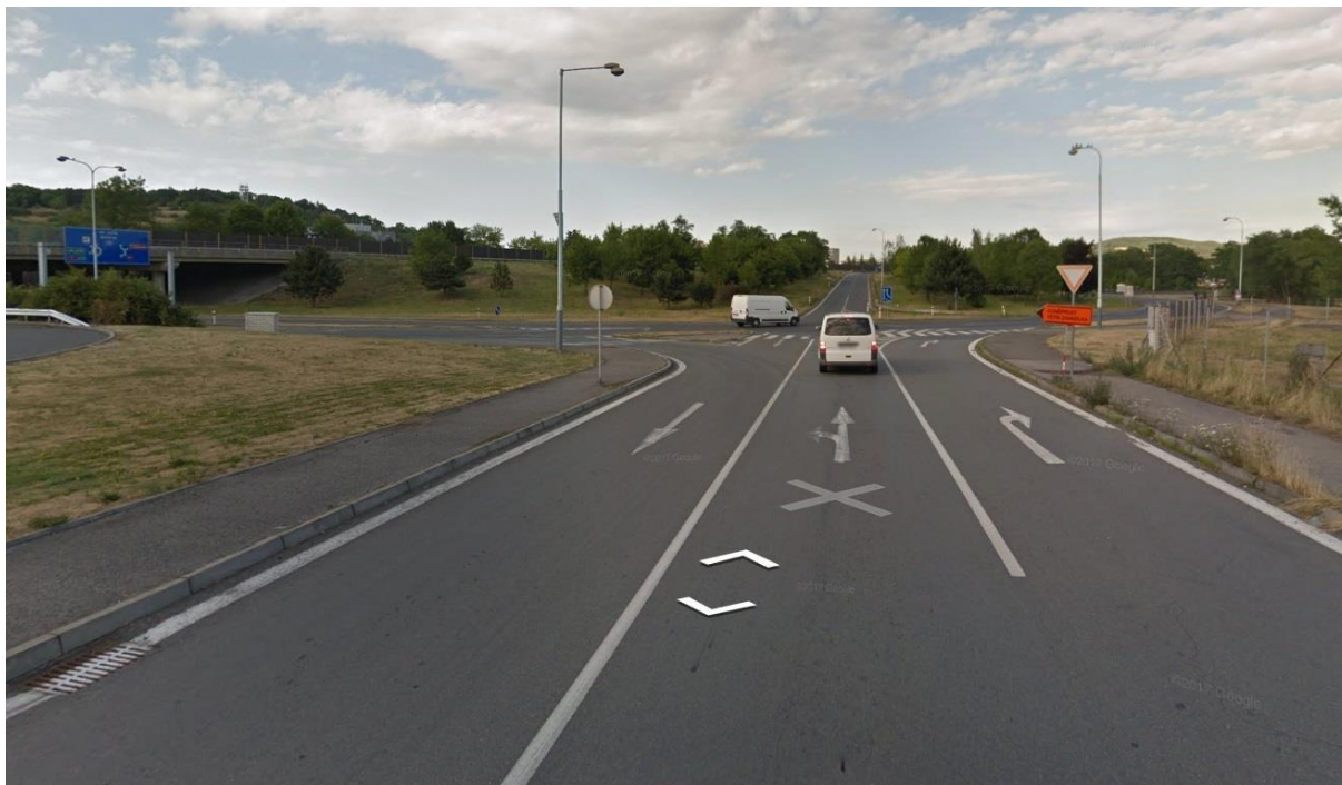
Obr.3 – Pohled na křižovatku ze směru Plzeň sjezdové rampy dálnice D5