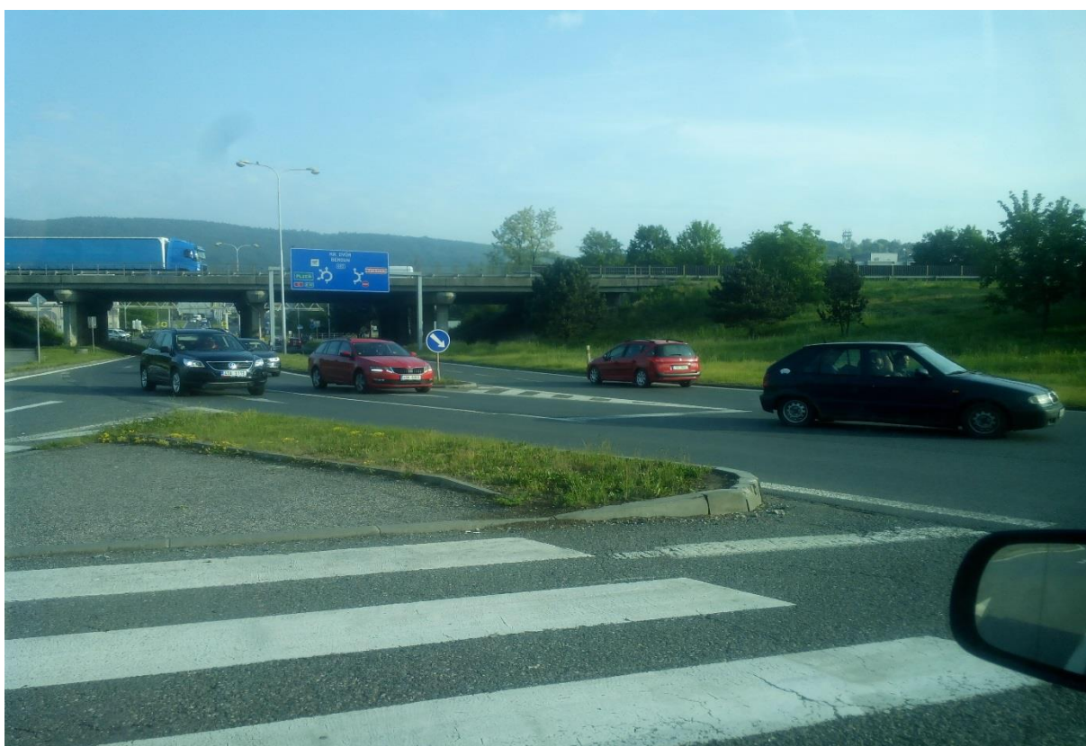
Obr.20 – Pohled ze sjezdu dálnice D5 směru Plzeň v místě napojení do křižovatky