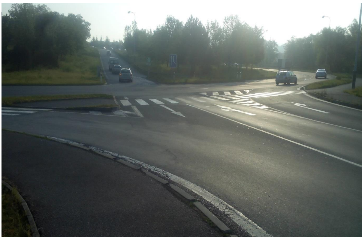
Obr.8 – Pohled na křižovatku ze sjezdu dálnice D5