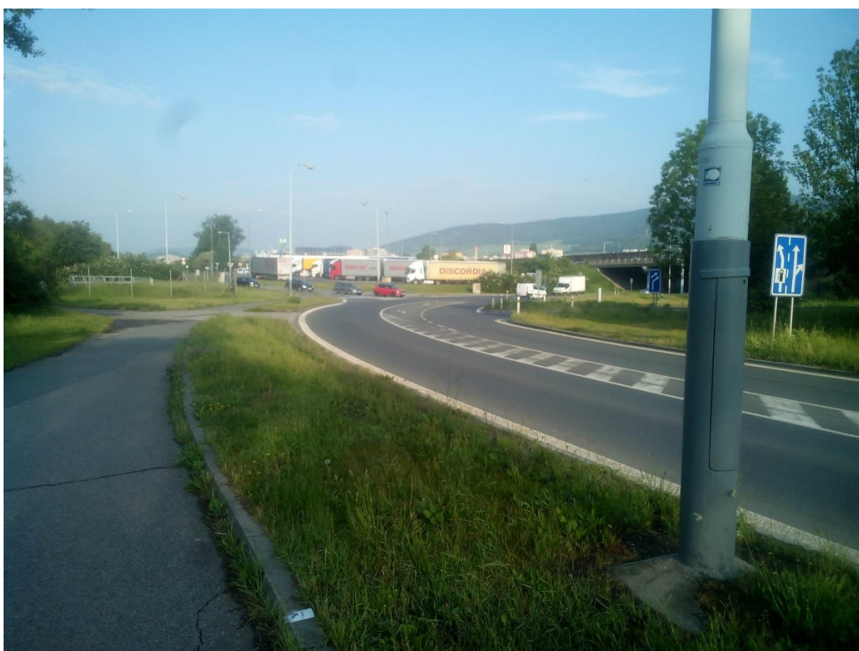
Obr.12 - Pohled na křižovatku z chodníku ze směru Beroun – nádraží