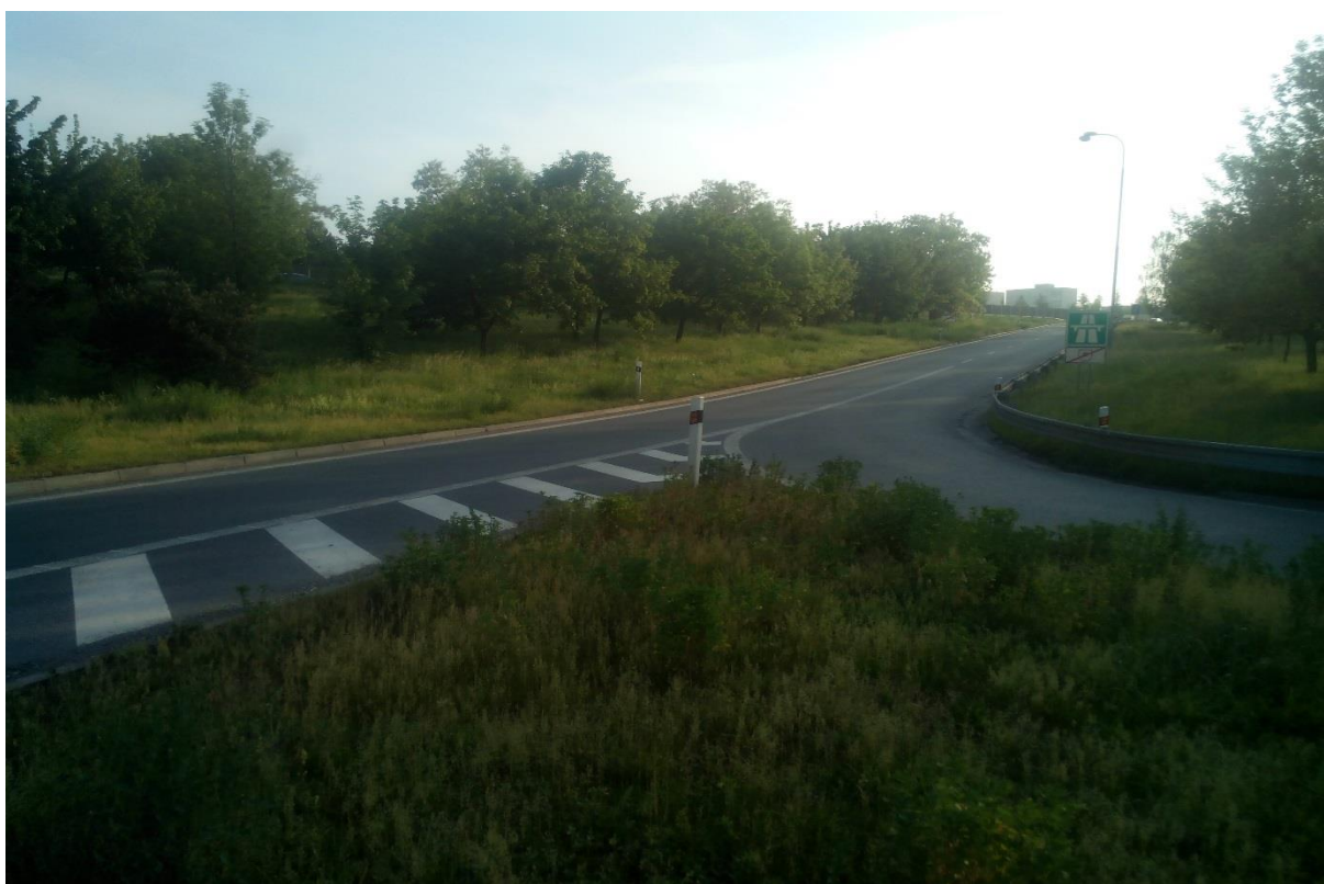
Obr.14 - Pohled na nájezdovou rampu dálnice D5 z dopravního ostrůvku ze směru Beroun – nádraží