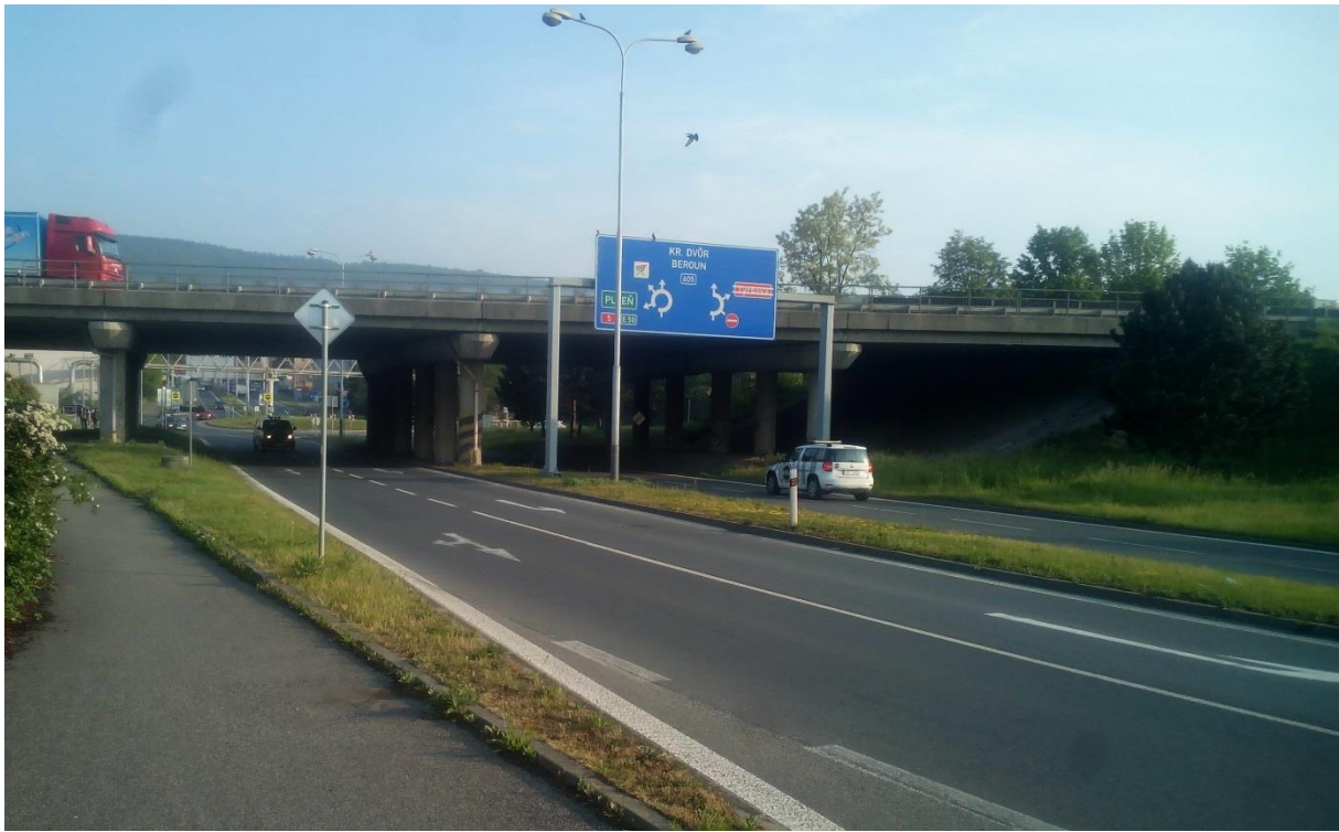
Obr.9 – Pohled na mostní konstrukci dálnice D5