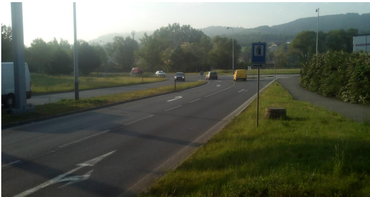
Obr.10 - Pohled na křižovatku ze směru Beroun – centrum