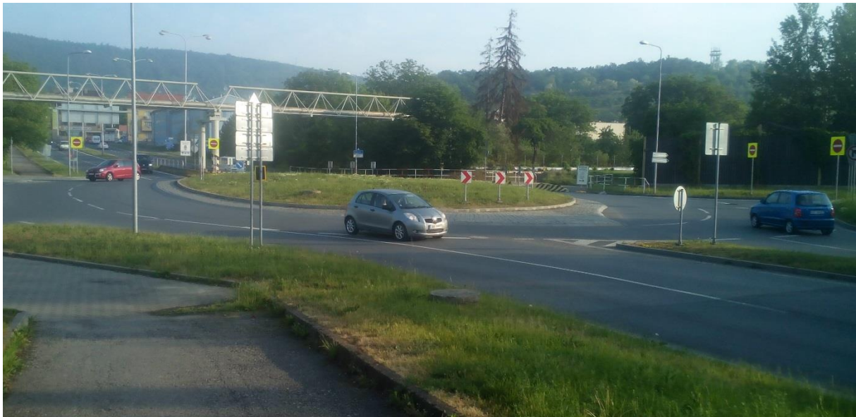
Obr.17– Pohled na přilehlou stávající spirálovitou okružní křižovatku