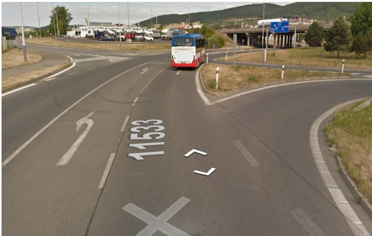
Obr.5 - Pohled na křižovatku ze směru Beroun – nádraží, silnice 11533, ulice Koněpruská