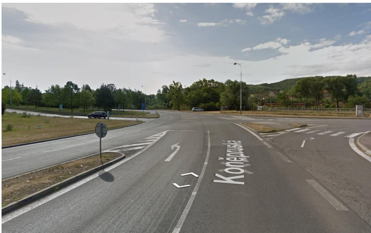
Obr.4 - Pohled na křižovatku ze směru Beroun – centrum, silnice 11533, ulice Koněpruská