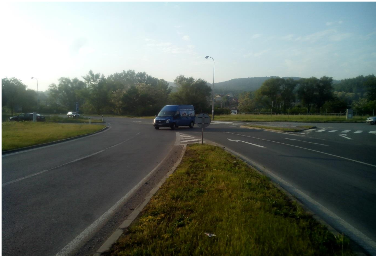
Obr.16 – Pohled na křižovatku ze směru Beroun - centrum