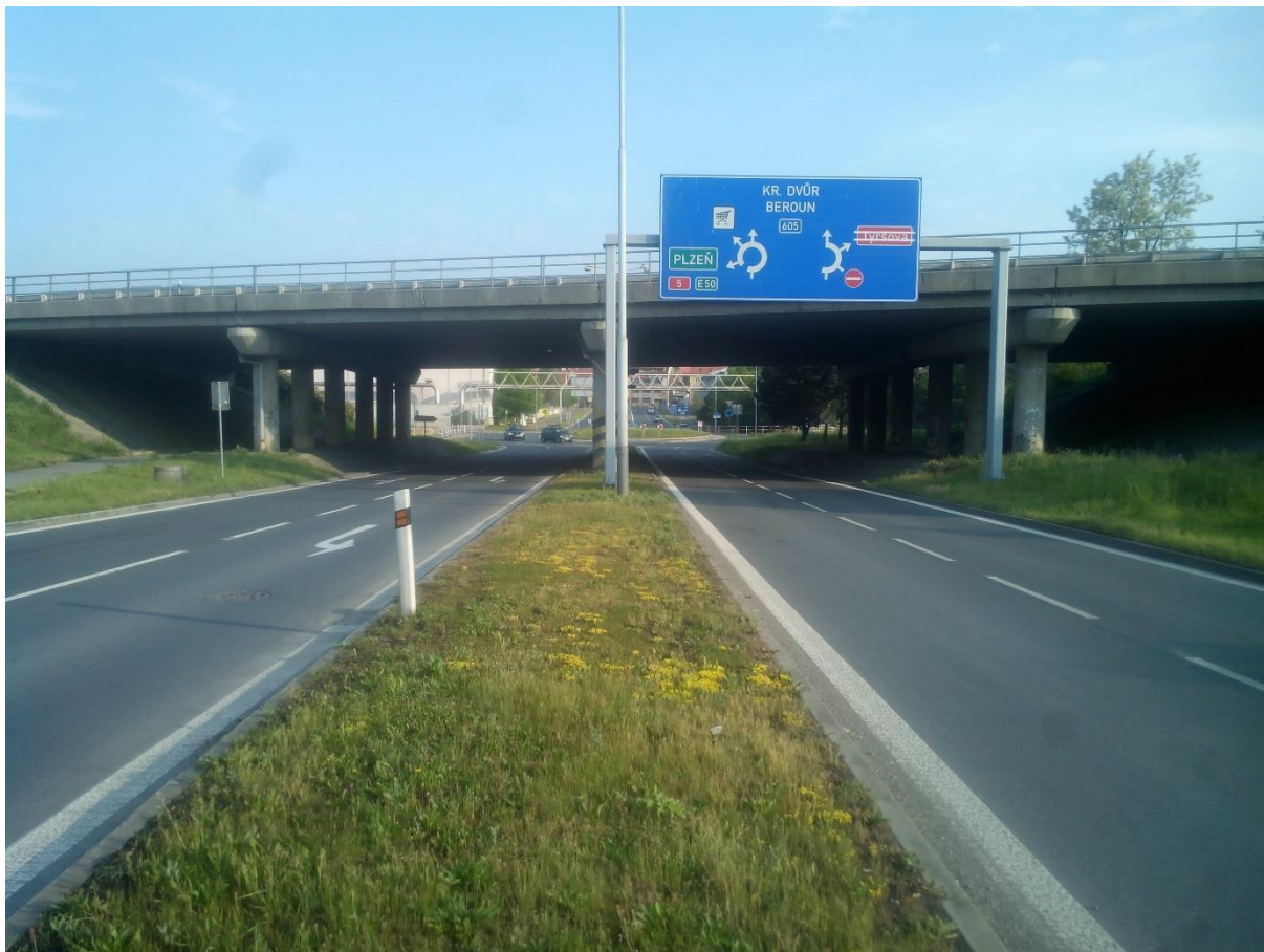
Obr.15 – Pohled na přilehlou spirálovitou křižovatku ze směru Beroun - nádraží