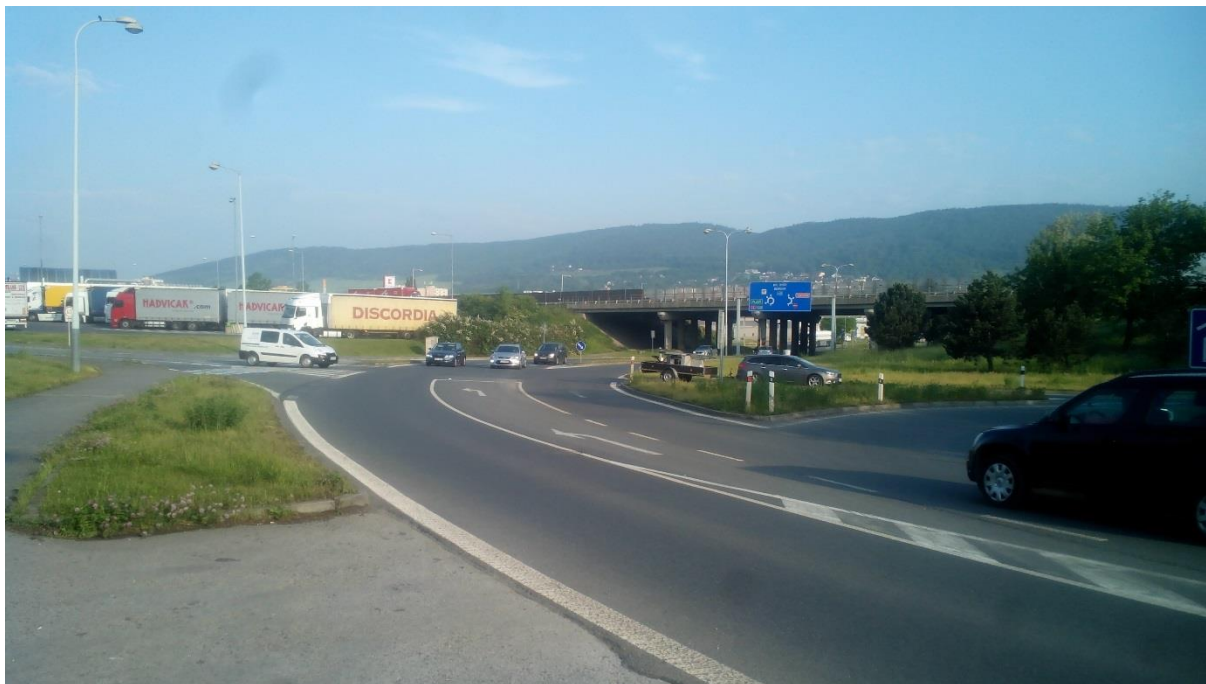
Obr.11 - Pohled na křižovatku ze směru Beroun – nádraží