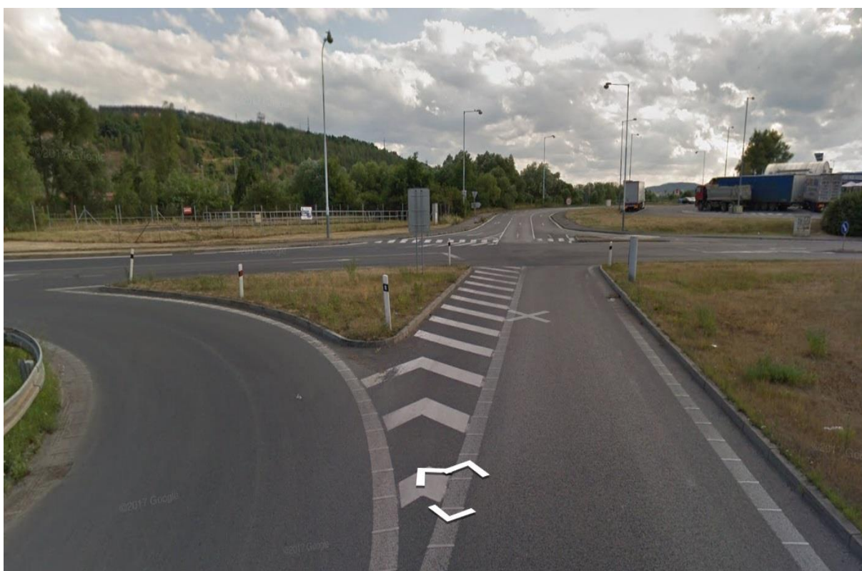
Obr.6 - Pohled na křižovatku ze směru Praha nájezdové rampy dálnice D5