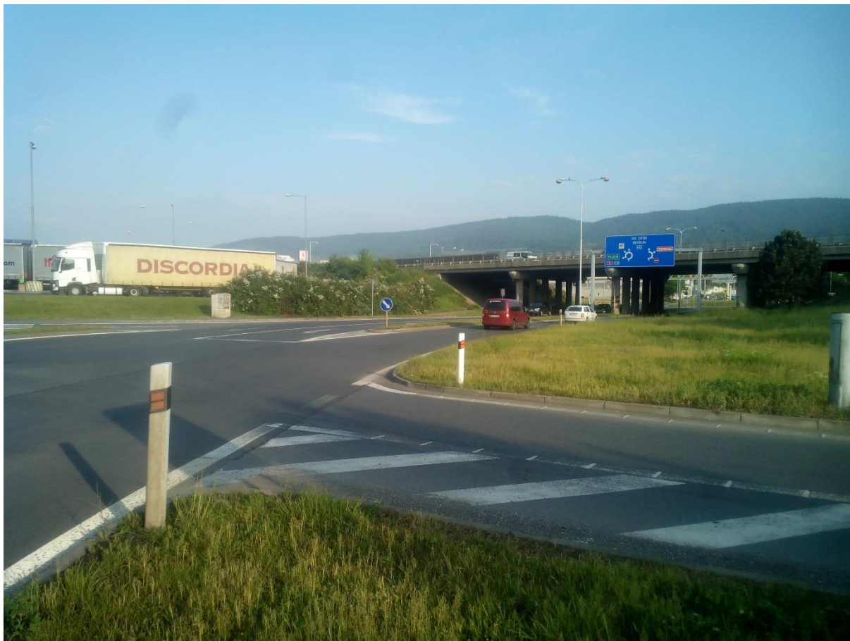
Obr.13 - Pohled na křižovatku z dopravního ostrůvku ze směru Beroun – nádraží