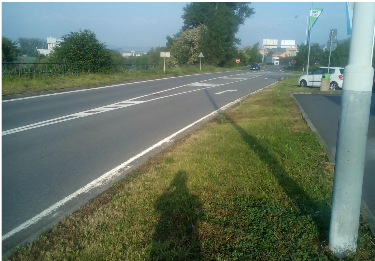
Obr.7 – Pohled na sjezdovou rampu ze směru Plzeň dálnice D5