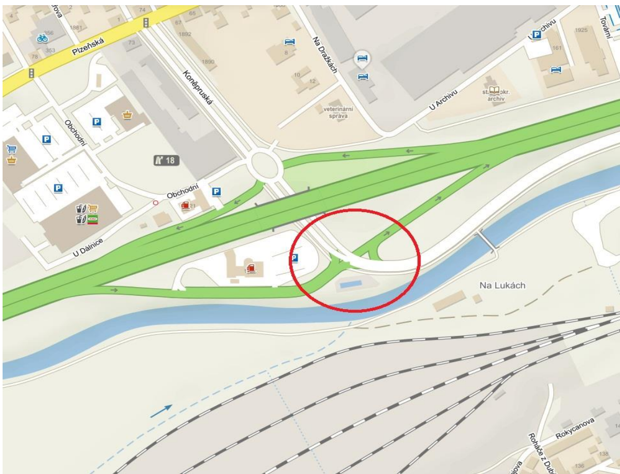
Obr.2 – Detail posuzované křižovatky