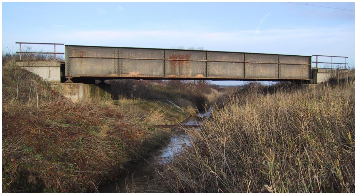
Obr. 2 Železniční most v obci Sadská, ř.km 2.13 [1]