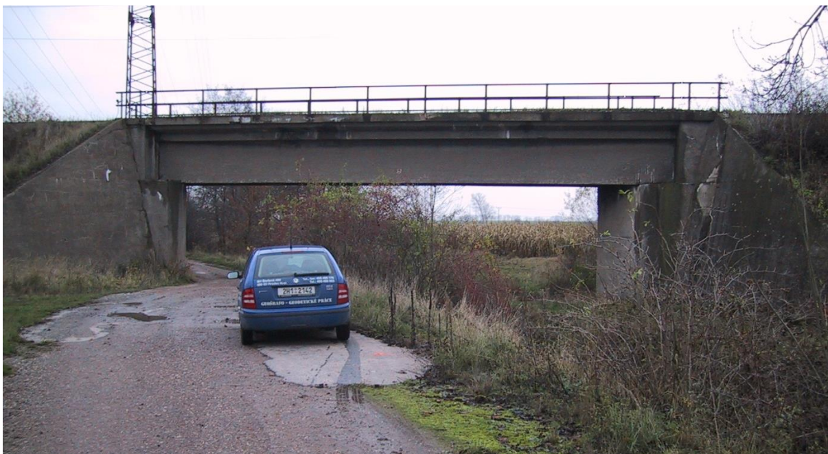
Obr. 7 Železniční most v obci Poříčany, ř.km 7.86 [1]