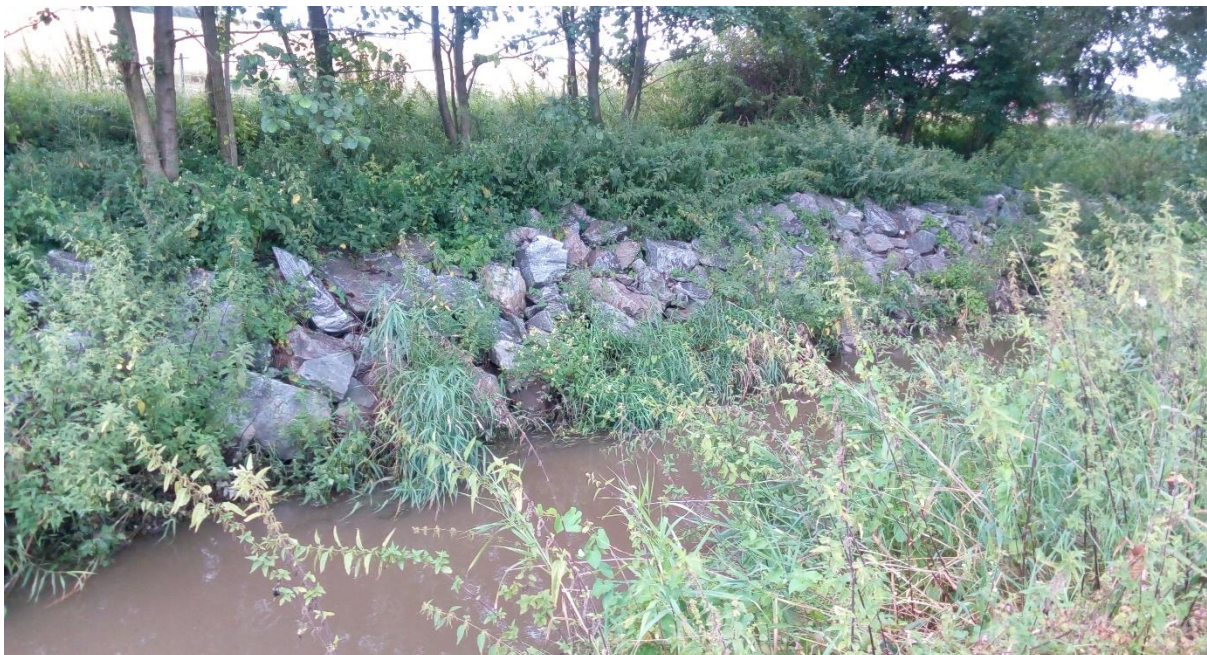
Obr. 9 Koryto řeky Šembery s opevněním břehů [2]