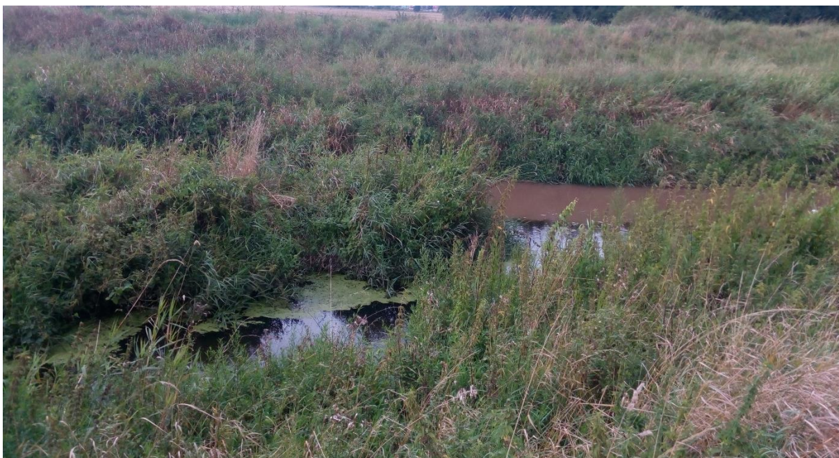
Obr. 10 Soutok řeky Šembery a Milčického potoka [2]