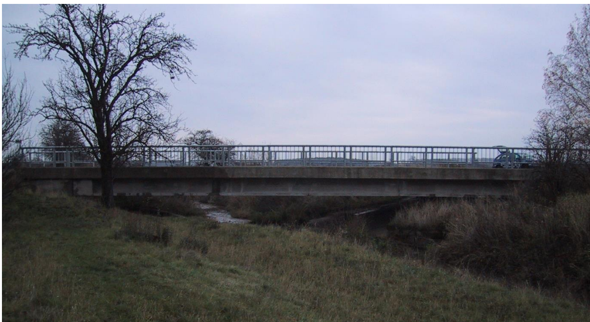
Obr. 4 Silniční most na komunikace Sadská – Milčice č. 334, ř.km 4.42 [1]