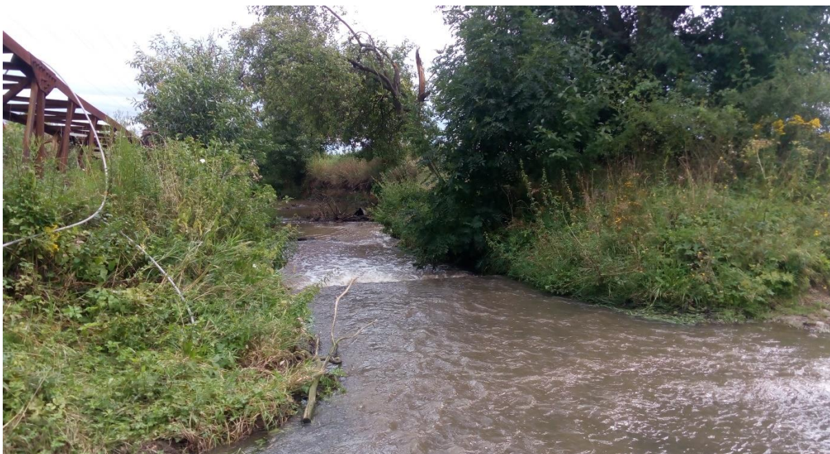
Obr. 8 Koryto řeky Šembery [2]