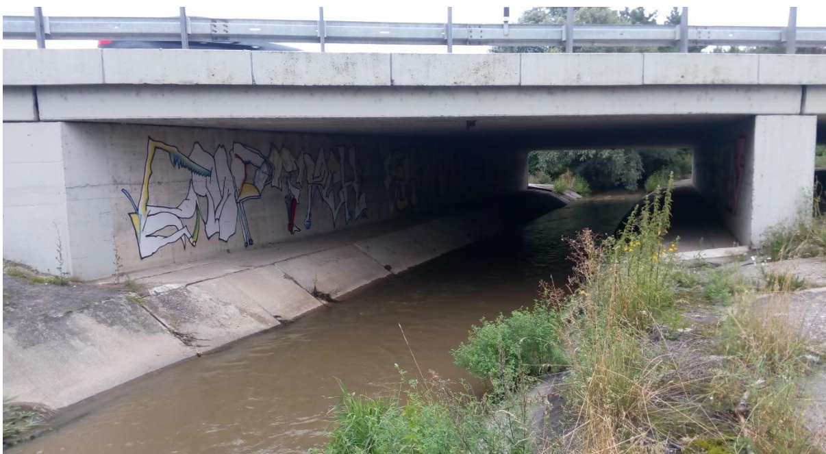
Obr. 6 Koryto v profilu pod dálnicí D11, ř.km 6.56 [2]