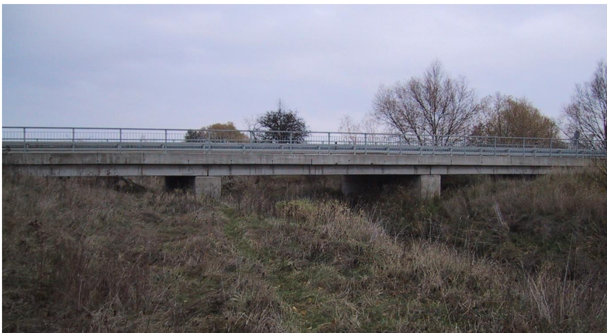
Obr. 5 Silniční most na komunikaci Sadská – Milčice, ř.km 5.68 [1]