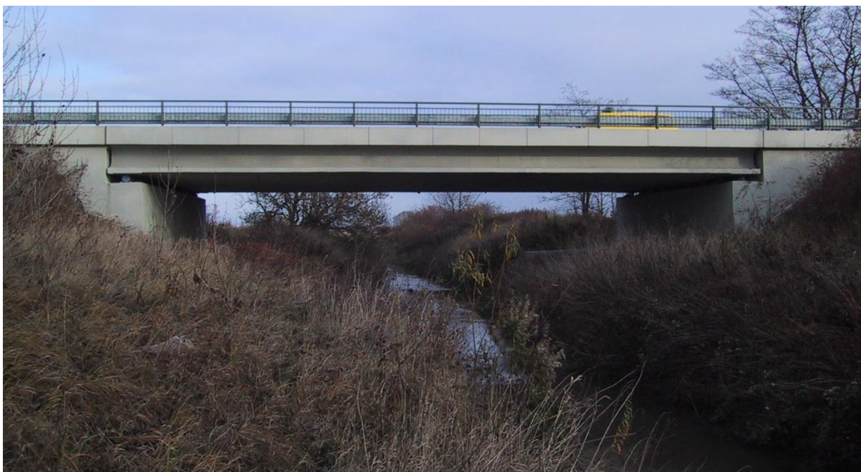
Obr. 3 Silniční most na komunikaci Sadská – Kostelní Lhota č. 611, ř.km 2.74 [1]