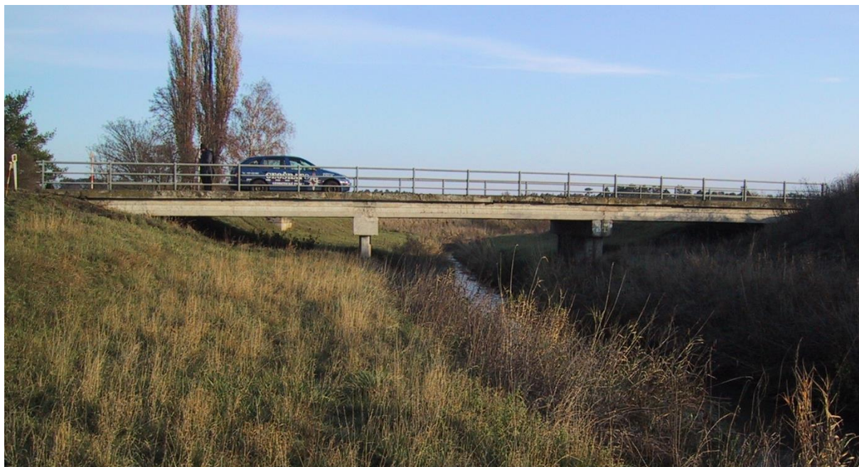
Obr. 1 Silniční most v obci Zvěřínek, ř.km 0.43 [1]