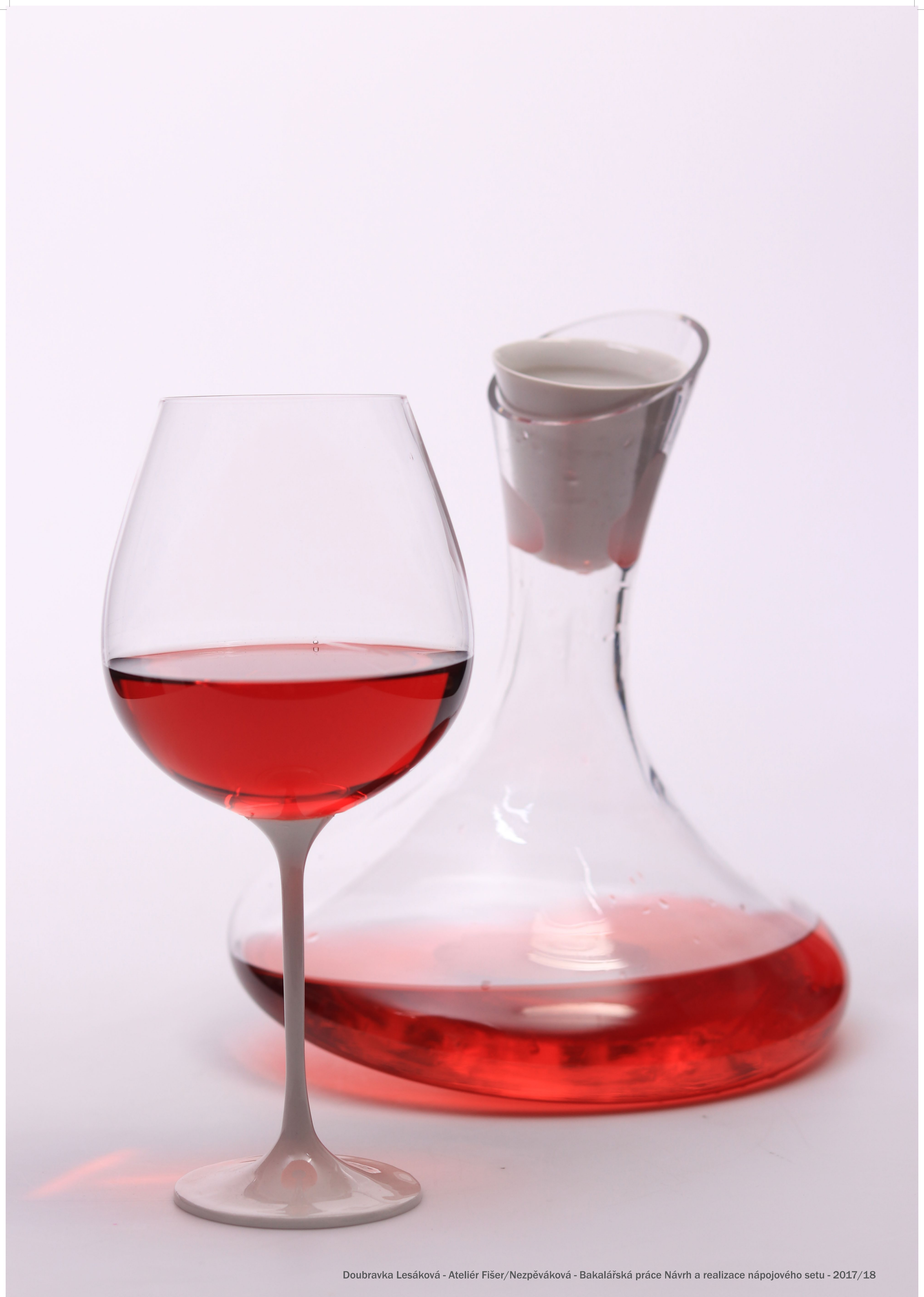
Doubravka Lesáková - Ateliér Fišer/Nezpěvákova - Bakalářská práce Návrh a realizace nápojového setu - 2017/18