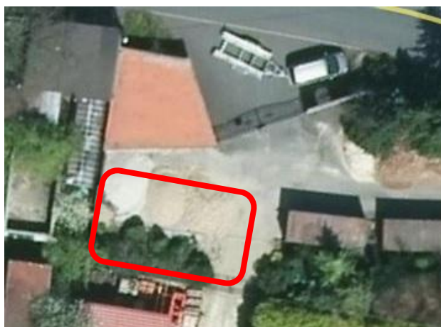
Obrázek - Umístění plánovaného obchodu

V budoucnu je v areálu plánovaná výstavba prodejny pro naše elektromotocykly. Umístění prodejny je vyznačeno na obrázku červenou barvou a je naproti vjezdu do areálu firmy.