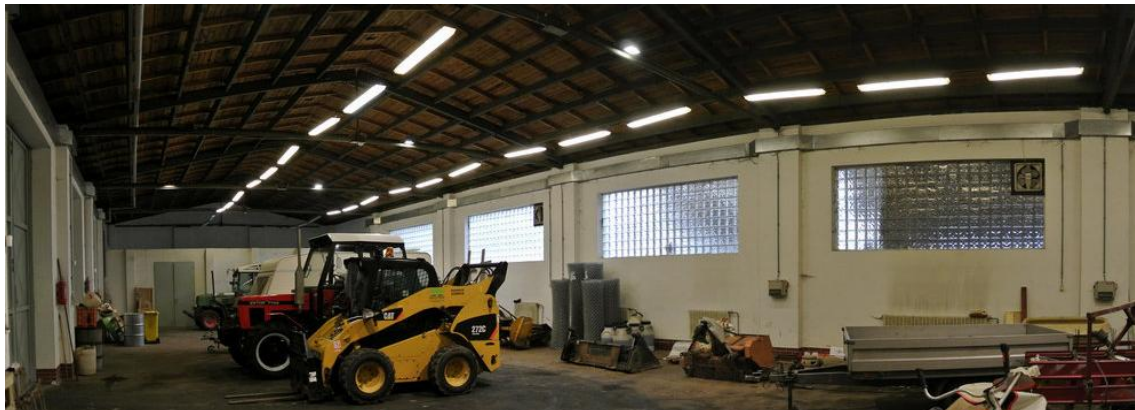
Obrázek - Skladová hala

mytí. Podlahu tvoří asfaltobeton, který má odkanalizování. Skladová hala je s opravárenskou halou komunikačně propojena.