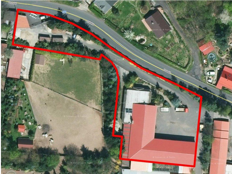
Obrázek - Areál sídla společnosti

Jedná se o areál, který lze využít jako sídlo firmy. Výměra pozemku je 3 100 m 2 , z toho zastavěná plocha tvoří 872 m 2 . Cena celého areálu, který můžete vidět na obrázku, je 257 681 €. Nemovitosti neleží v žádném záplavovém území a vjezd do areálu je přímo z Dubské ulice.