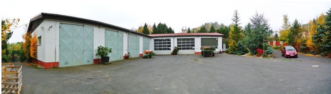
Obrázek - Manipulační a parkovací plochy

Administrativní a sociální budova má plochu cca 160 m 2 . V budově se nachází velká kancelář, která má rozlohu 43 m 2 a je možné jí rozdělit na dvě menší kanceláře s vlastním vstupem z chodby. Další je kancelář vedení společnosti o velikosti 19 m 2 . V budově jsou dvě sociální zázemí. První pro kanceláře se 2 WC a umývárnu, druhé pro dílnu, která zahrnuje 2 WC, 3 sprchy, umývárnu, šatnu a jídelnu s kuchyňkou. V objektu je také trezor, kotelna a obslužné chodby. Veškerá podlaha je pokryta keramickou dlažbou.