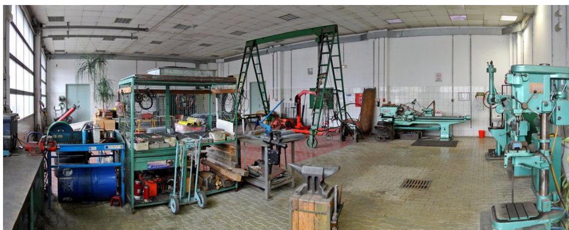
Obrázek - Oprávérenská hala

Oprávérenská hala je přízemní, vytápěná a její rozměry jsou 18,3 x 12,5 m, což tvoří 229 m 2 zastavěné plochy. Výška haly je 4,4 m a součástí jsou 2 vrata s elektropohonem. Podlahu pokrývá zámková dlažba, která má záchytné jímky pro kapaliny. Komunikačně je oprávérenská hala propojena i se skladovou halou a administrativní budovou. Hala je vybavena portálovým jeřábem 3,2 t, soustruhem, sloupovou vrtačkou, pákovým lisem, bruskou, univerzální frézku, pracovními stoly a ponky. Veškeré vybavení využijeme a snížíme tak náklady. Za halou se nachází přístřešek venkovního skladu dřeva pro kotelnu.