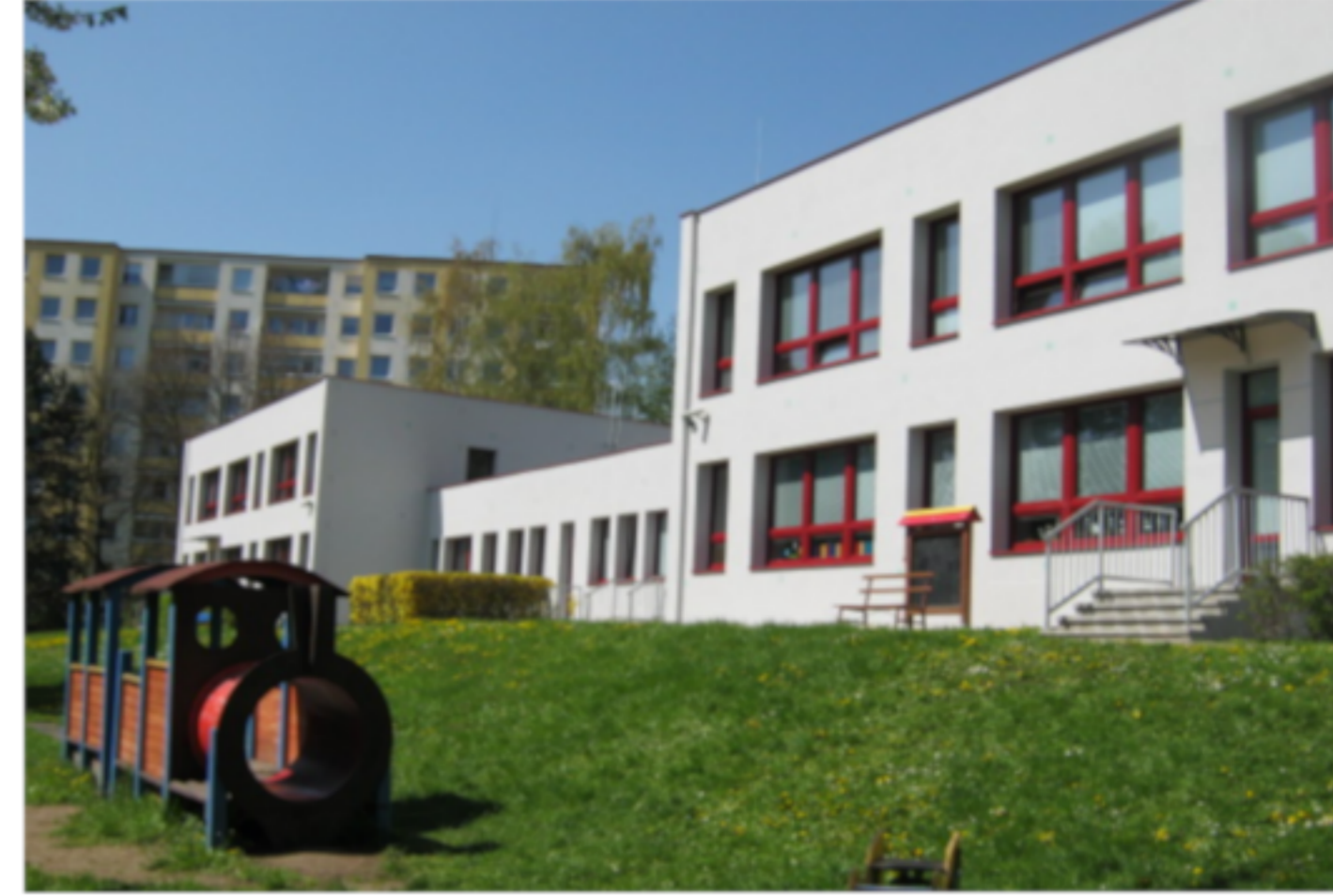
Fotografie Mateřské školy Vojanova v Ústí nad Labem před rekonstrukcí a po rekonstrukci.

Současná čistá hodnota je jeden z nejdůležitějších ukazatelů pro návratnost investic v soukromém i veřejném sektoru. V rámci výpočtů obsažených v bakalářské práci došlo k výpočtu čisté současné hodnoty před a po zahrnutí externalit podle následujícího vzorce: