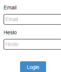
Obrázek A.1: Přihlašování