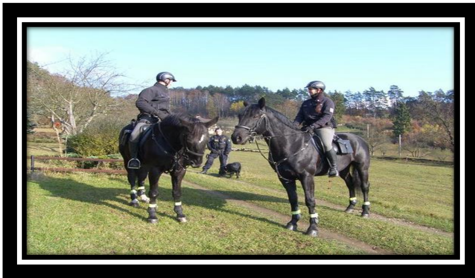
Obr. 2 - Společná činnost policistů služební hipologie a služební kynologie při pátrací akci v terénu.