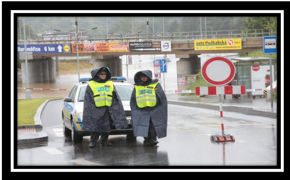
Obr. 1 - Zabezpečení vjezdu do povodňové oblasti policisty služby pořádkové policie.