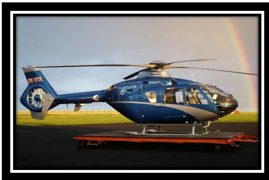
Obr. 6 - Vrtulník EC-135T2