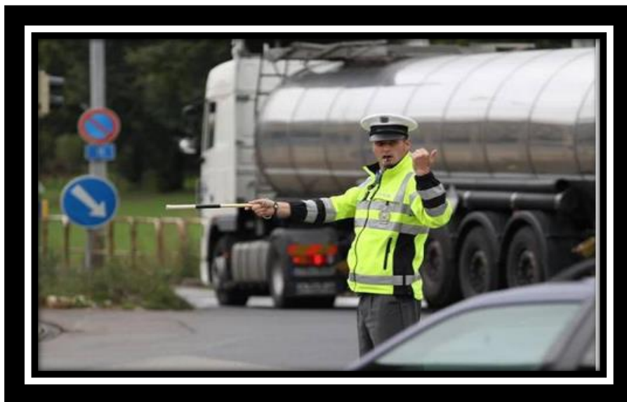
Obr. 3 - Regulace dopravy policistou služby dopravní policie.