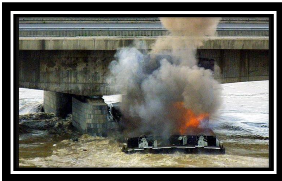
Obr. 4 - Odstřel lodi policejním zásahovým pyrotechnikem.