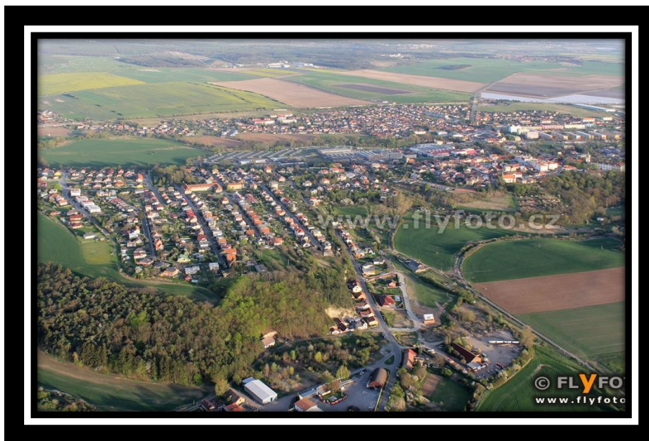
Obr. 7 - Letecký snímek města Benátky nad Jizerou.

Zdroj: http://www.flyfoto.cz/2012/04/benatky-nad-jizerou.html