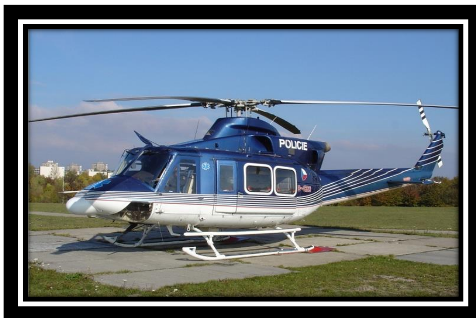
Obr. 5 - Vrtulník Bell 412

Letecká služba dnes provozuje dva druhy vrtulníků, jeden typ lehké a jeden typ střední hmotnostní kategorie.