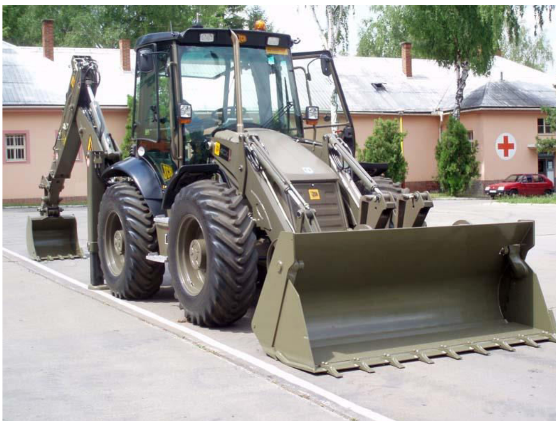
Obrázek 14: Nakladač-rýpadlo JCB 4CXSM APC TL PS