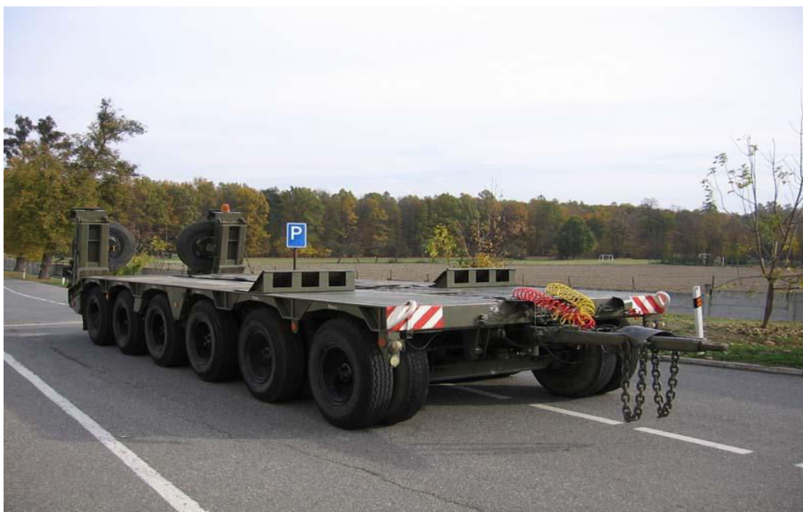
Obrázek 4: Podvalník P-50 N