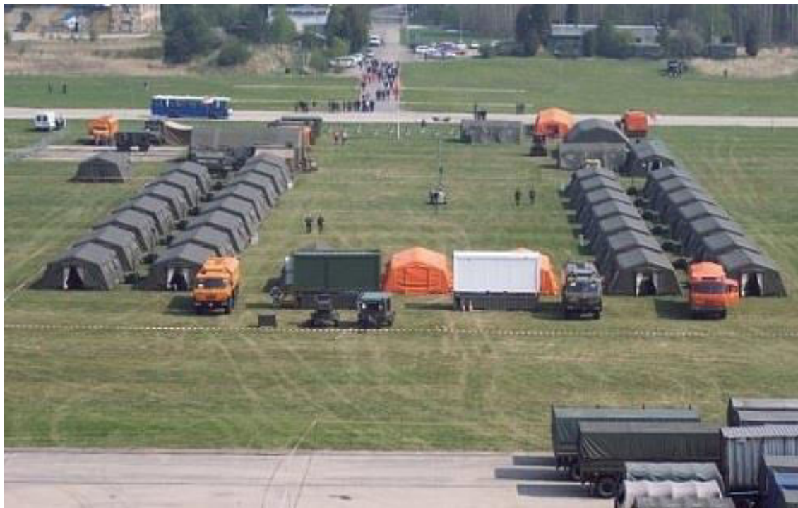
Obrázek 1: Humanitární základna