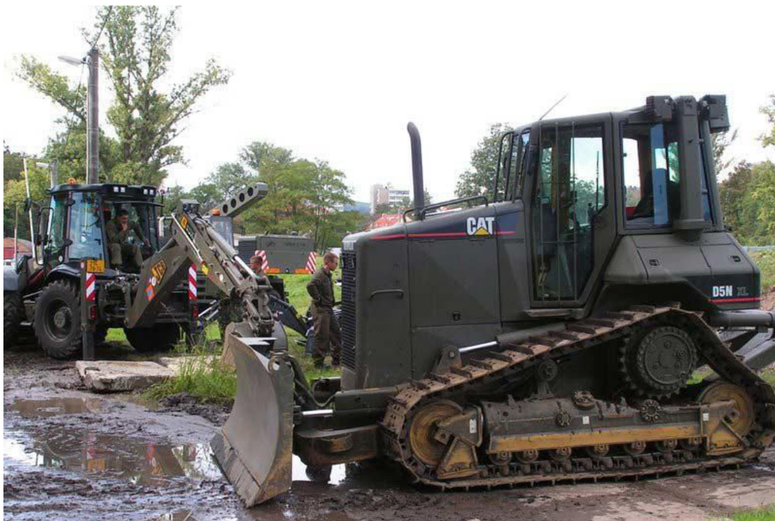
Obrázek 13: Buldozer Caterpillar D5N