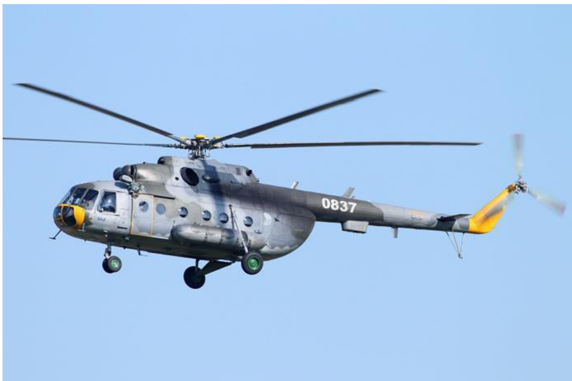
Obrázek 15: Vrtulník Mi-17