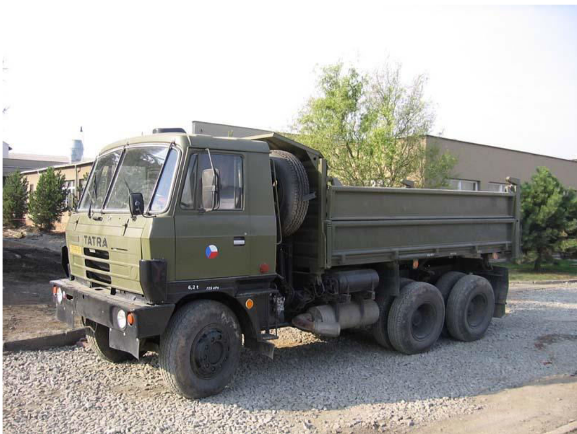
Obrázek 10: Sklápěcí automobil T-815 6x6