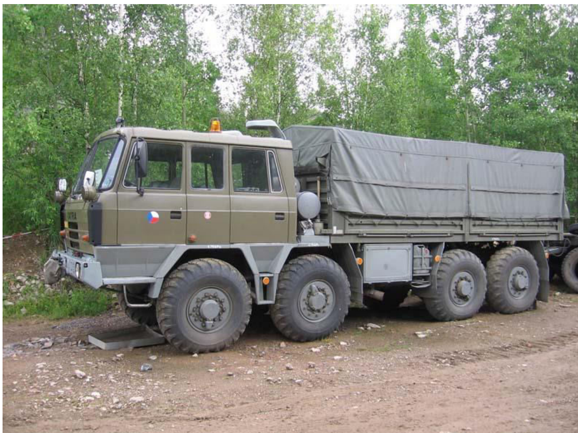
Obrázek 3: Tatra T-815 8x8 tahač přívěsů