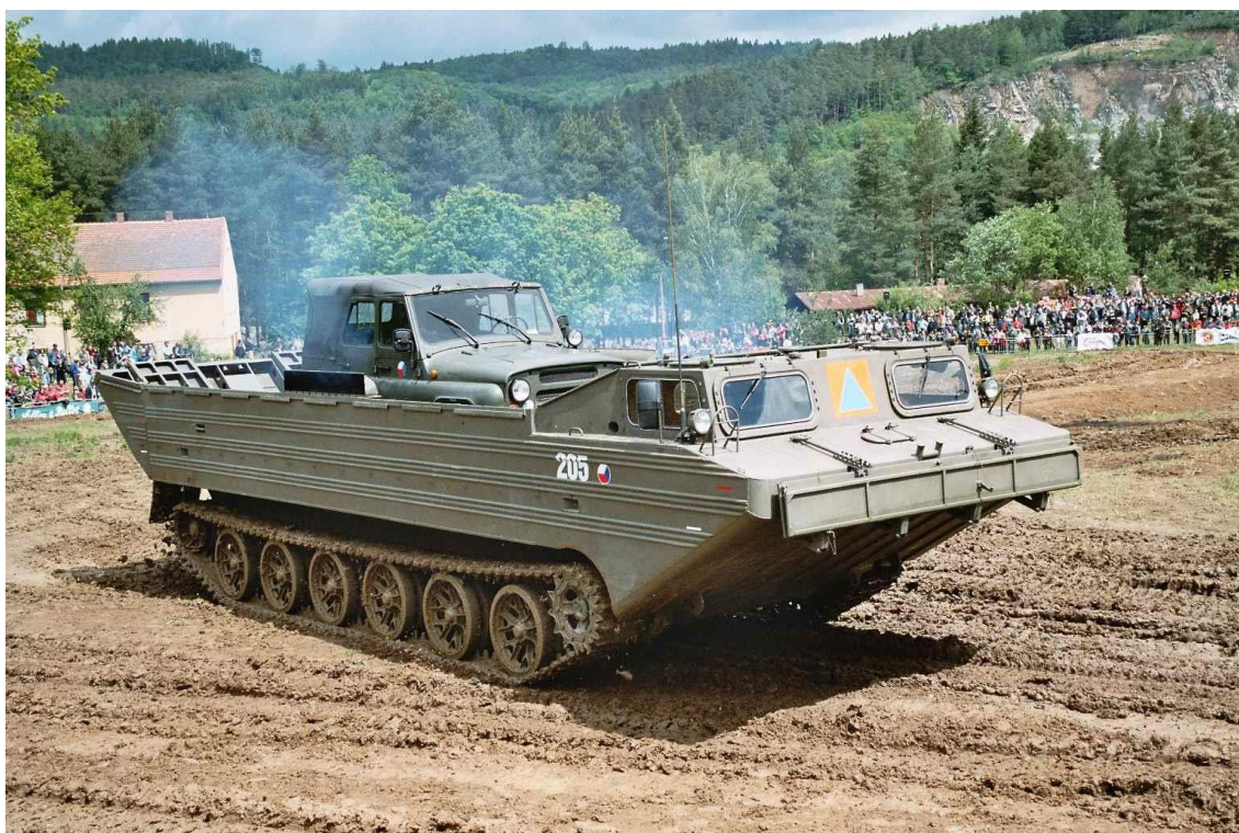
Obrázek 2: Pásový obojživelný transportér PTS-10