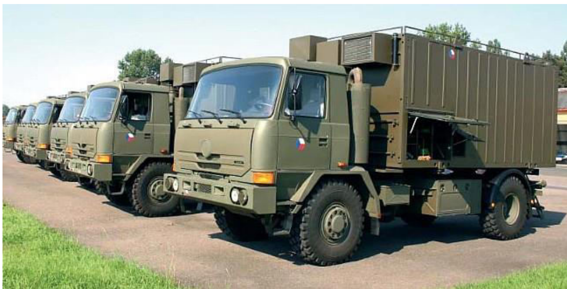
Obrázek 5: Velitelská vozidla