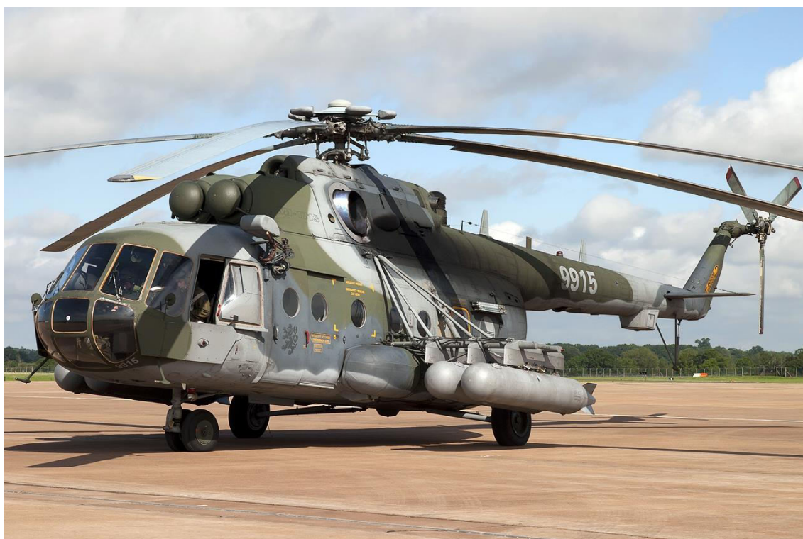
Obrázek 16: Vrtulník Mi-171Š