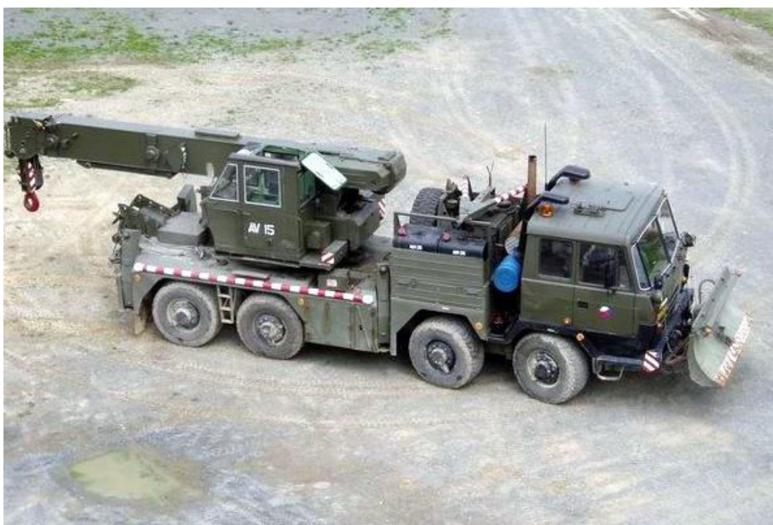
Obrázek 8: Vyprošťovací automobil AV-15 T-815