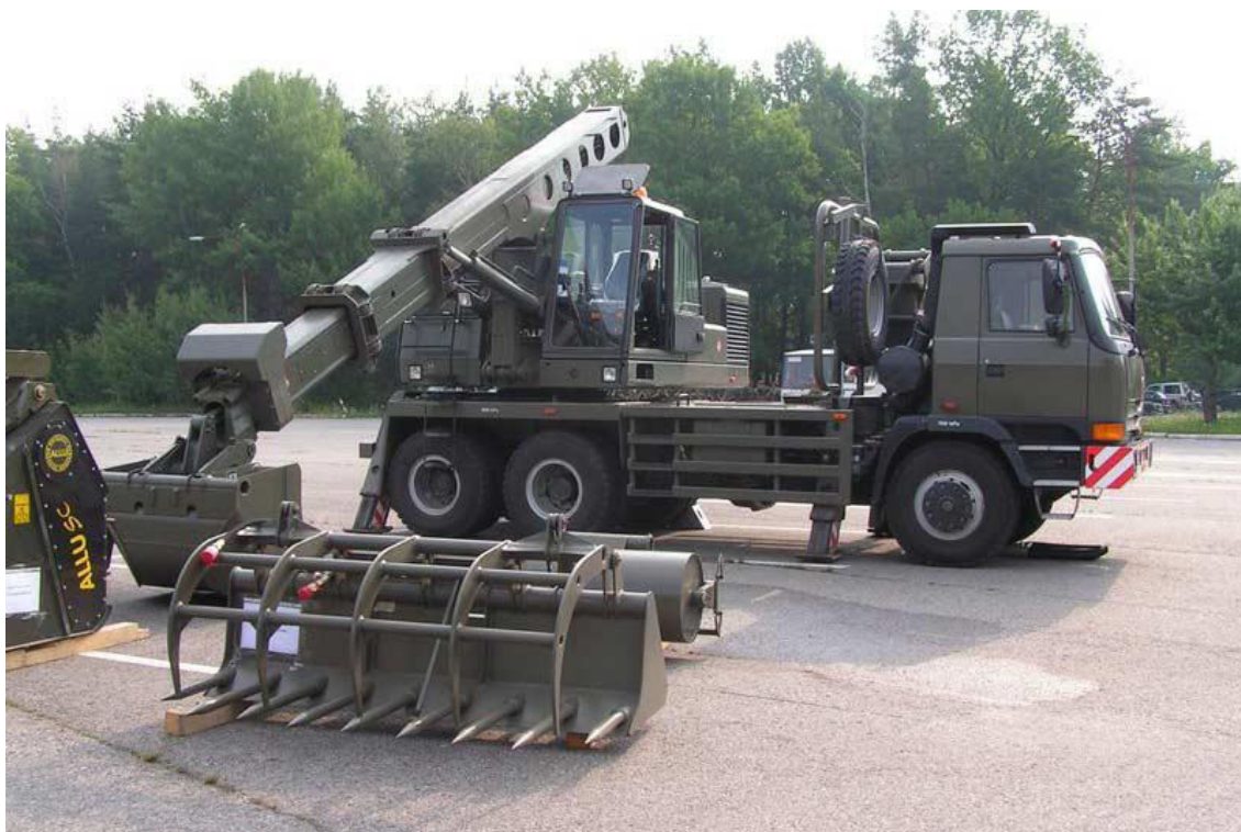
Obrázek 12: Autorýpadlo UDS