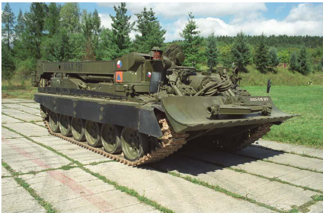
Obrázek 7: Vyprošťovací tank VT 72