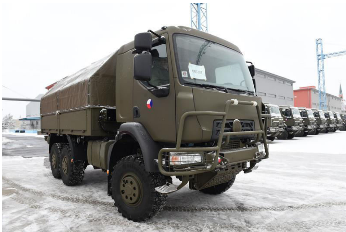
Obrázek 6: Nákladní automobil Tatra T-810