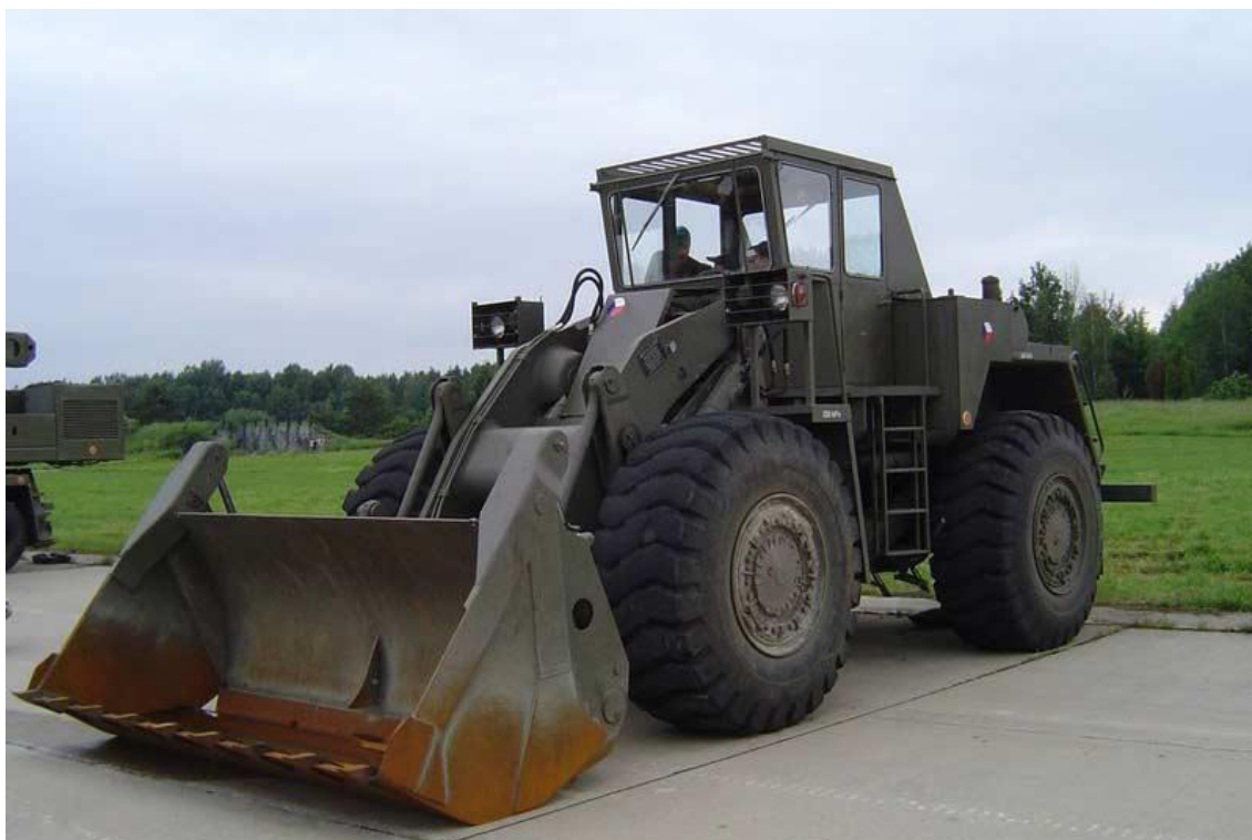
Obrázek 9: kolový nakladač KN-251