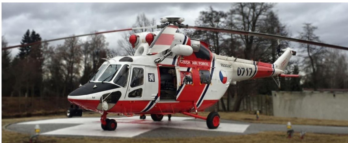
Obrázek 17: Vrtulník W - 3A Sokol