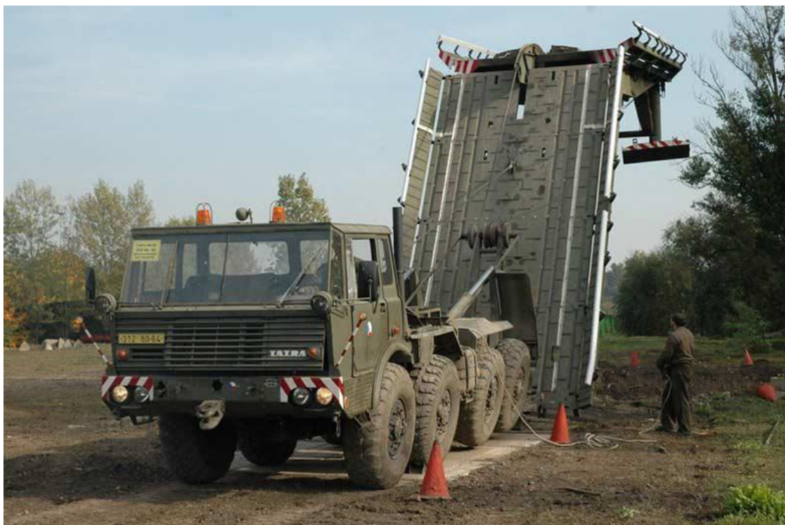
Obrázek 11: Mostní automobil AM 50