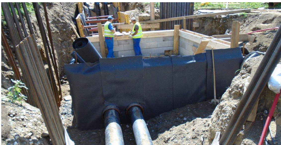
Obrázek 31: Ochrana hydroizolace šachty nopovou fólií