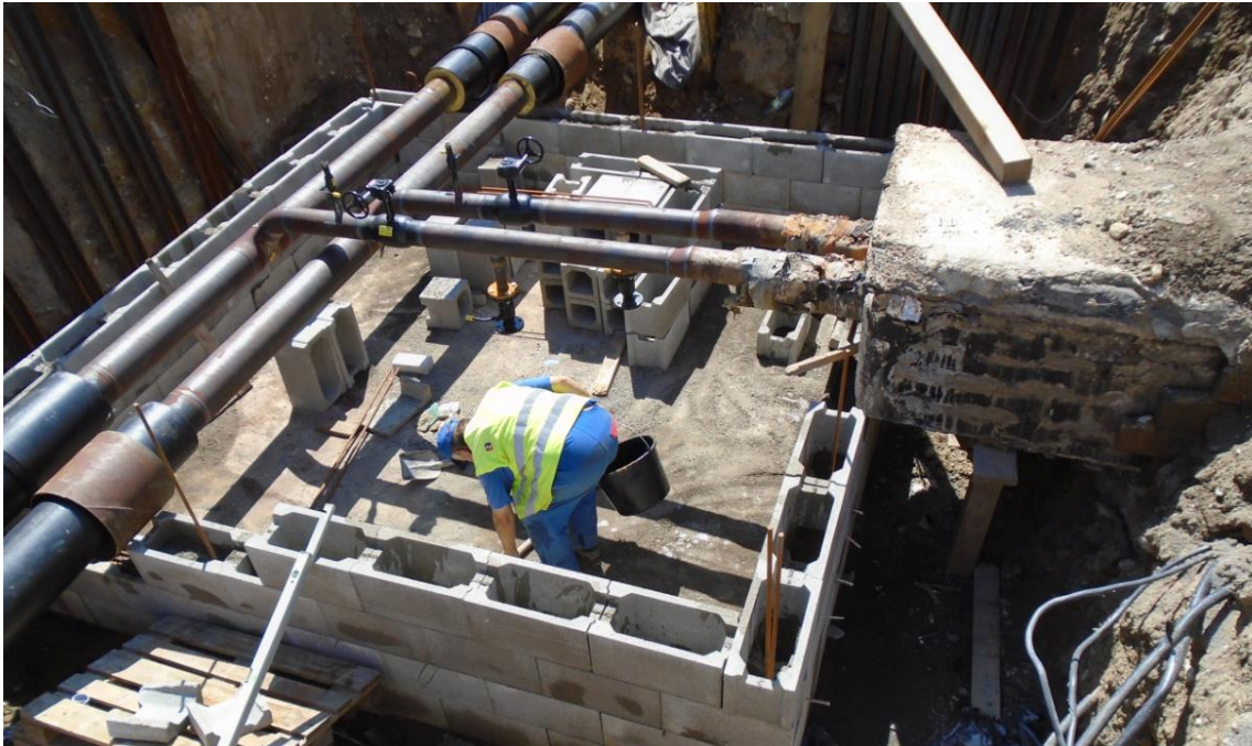
Obrázek 29: Nevhodně podepření stávajícího kanálu