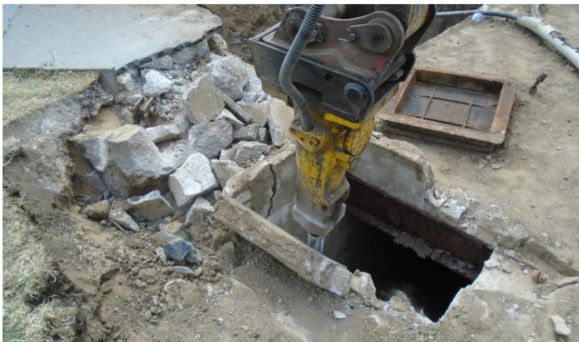
Obrázek 18: Demolice šachty BRA09ZEP