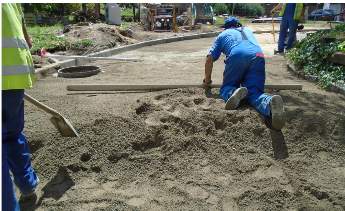
Obrázek 41: Obnova povrchu komunikací