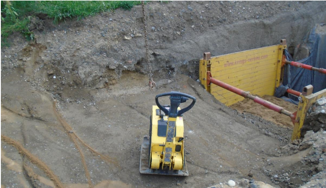
Obrázek 35: Hutnění zásypu