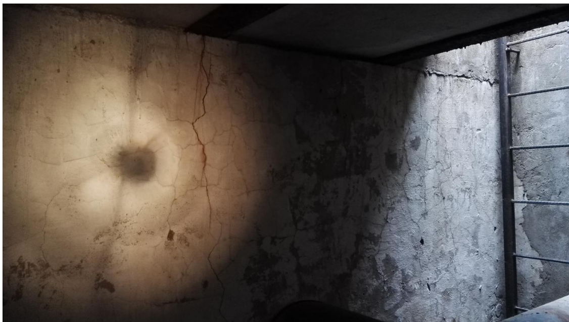
Obrázek 9: Úvodní prohlídka šachty BRA09ZEP