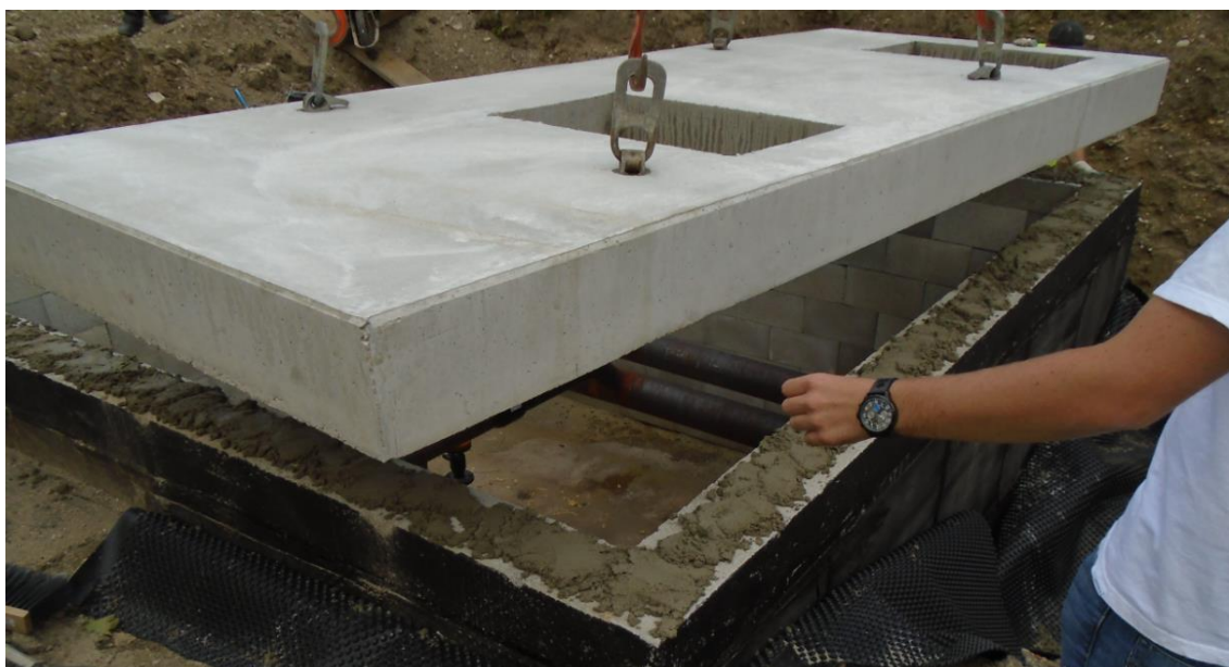
Obrázek 37: Záklop šachty BRA09ZEP stropními panely