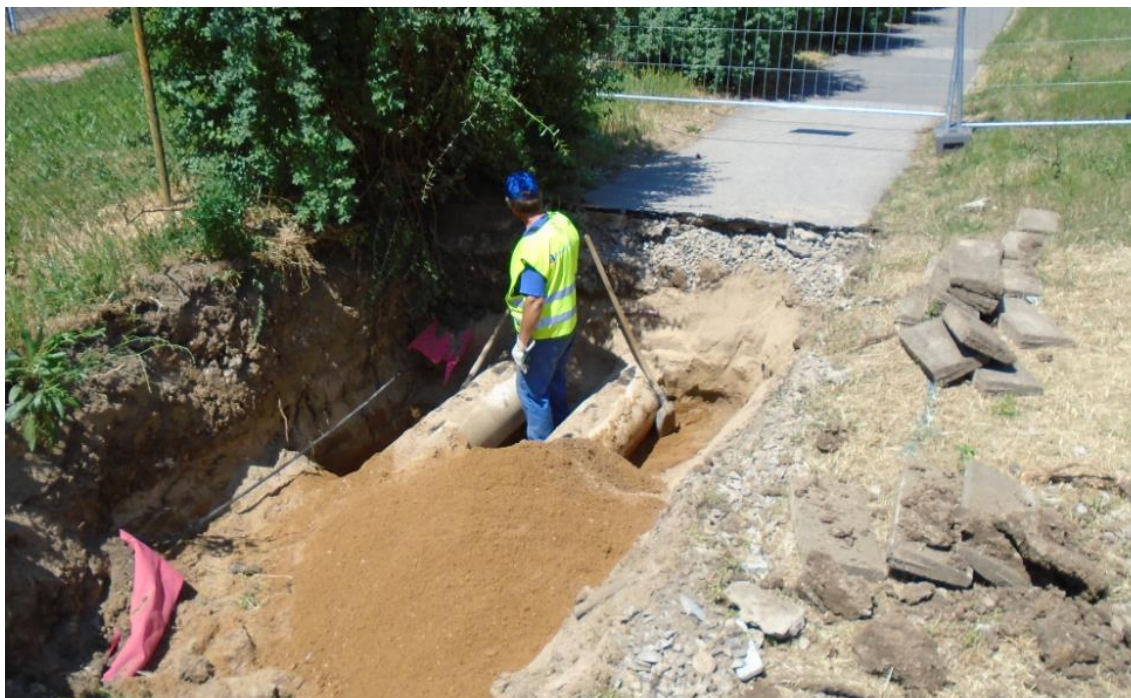
Obrázek 23: Odhalení potrubí