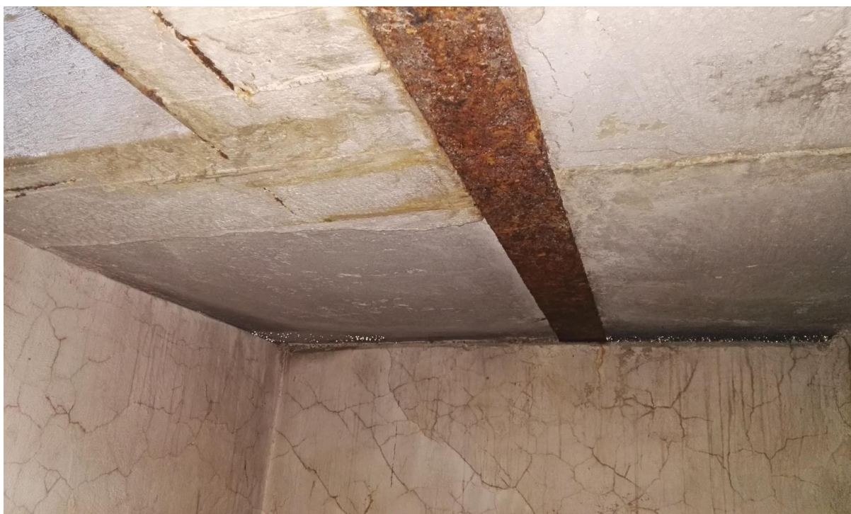
Obrázek 12: Úvodní prohlídka šachty BRA05ZEP