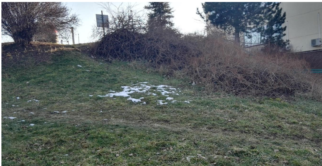
Obrázek 4: Úvodní prohlídka trasy