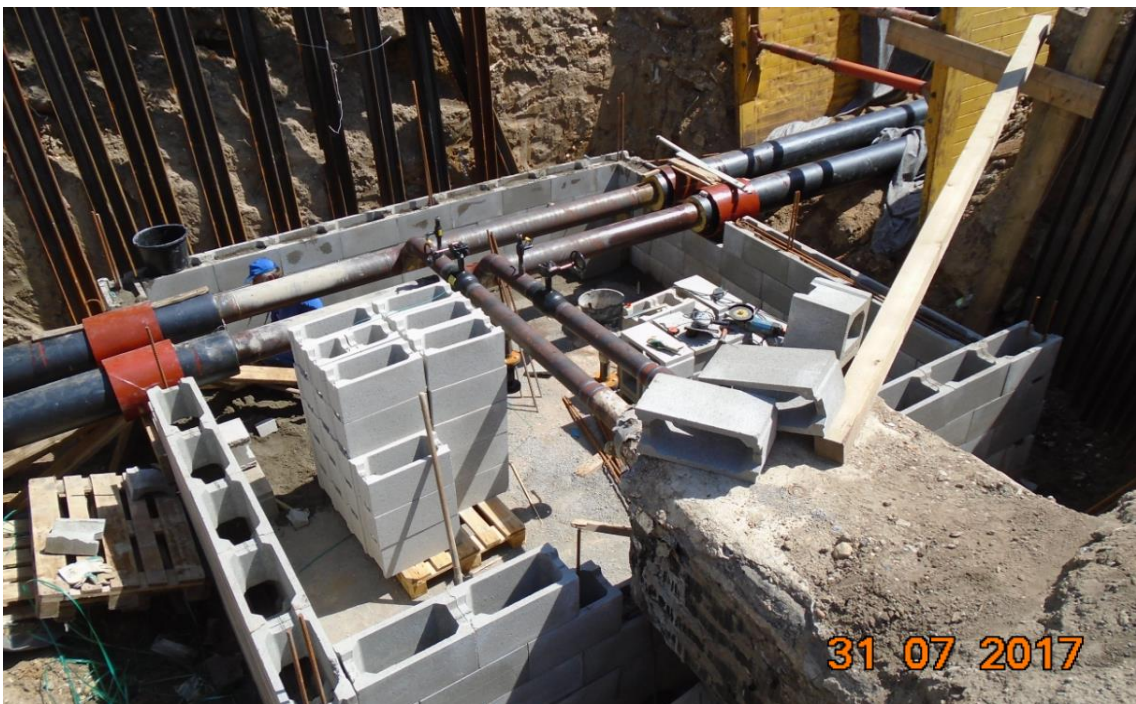
Obrázek 30: Výstavba šachty BRA09ZEP