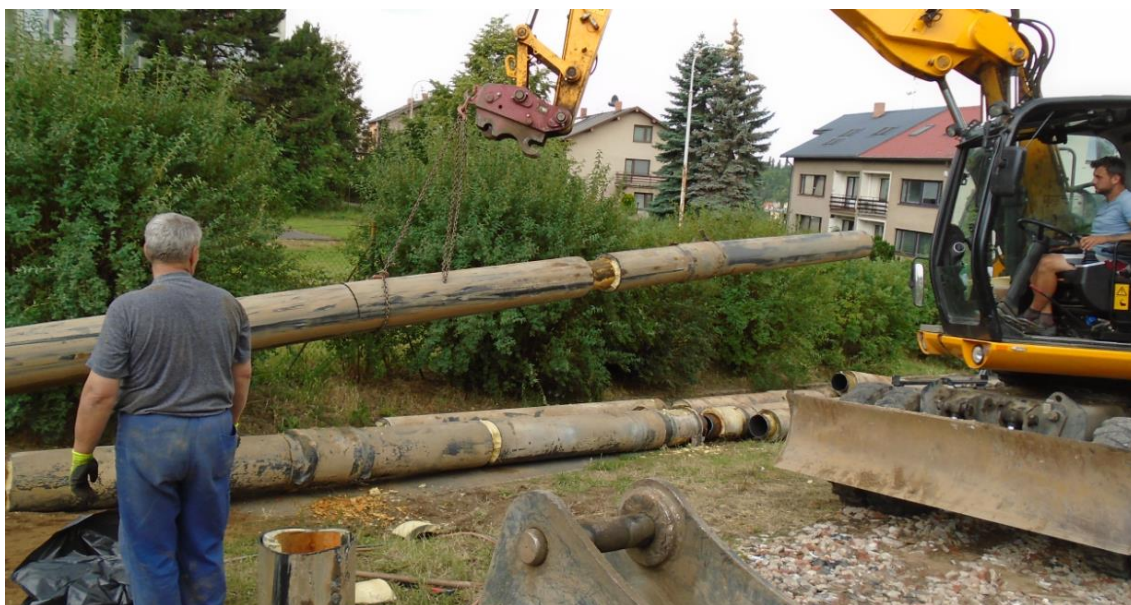
Obrázek 25: Vytažení starého potrubí