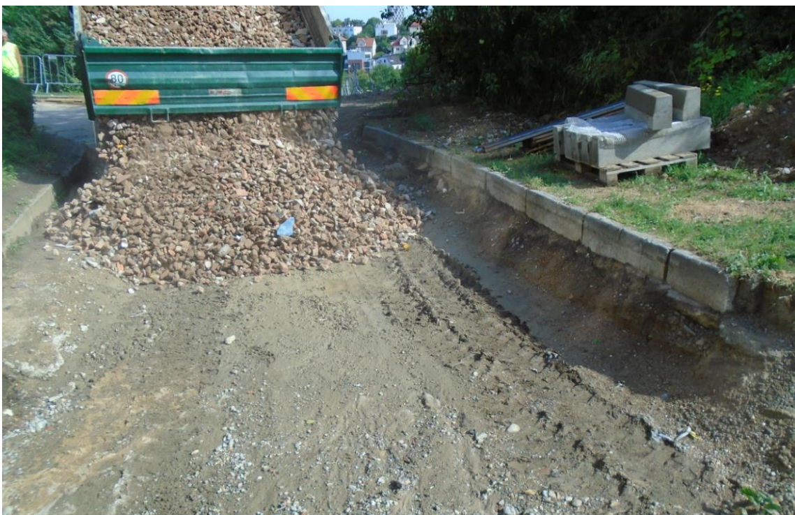
Obrázek 40: Obnova povrchu komunikací