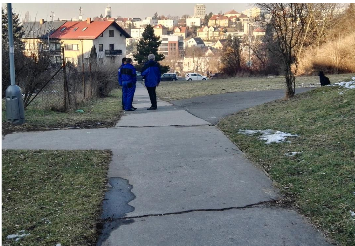
Obrázek 8: Úvodní prohlídka trasy