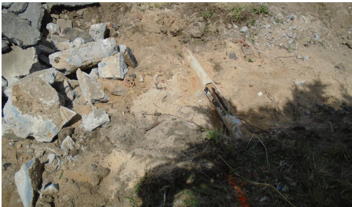
Obrázek 17: Poničená chránička silového vedení