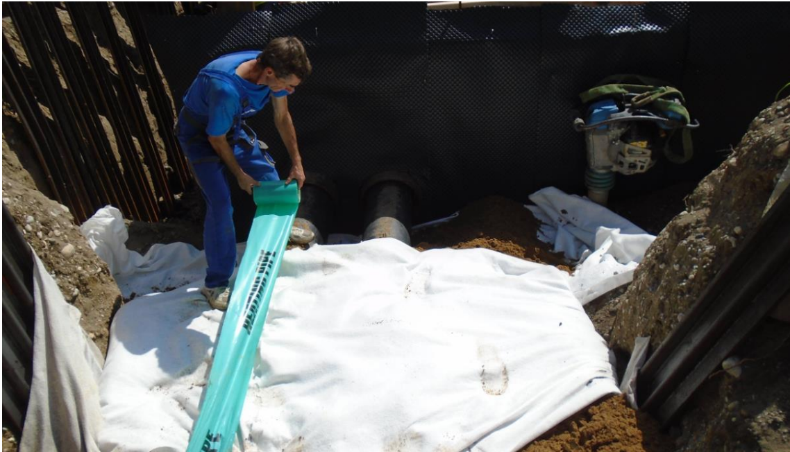
Obrázek 33: Zásyp a ochrana geotextilí nového potrubí