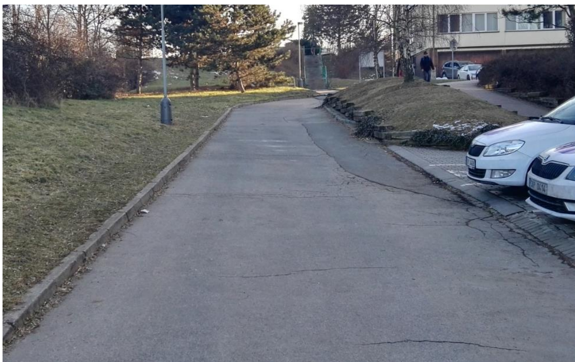
Obrázek 7: Úvodní prohlídka trasy