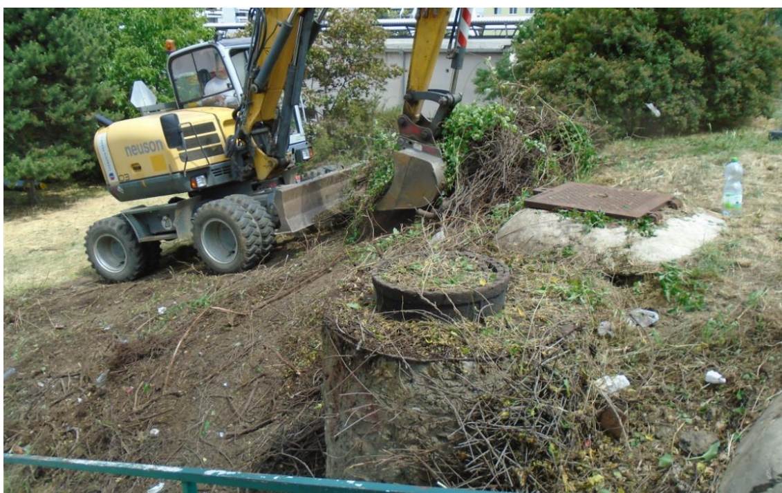
Obrázek 16: Odhalení konstrukce šachty BRA05ZEP