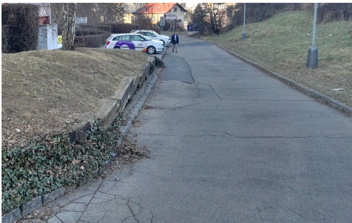
Obrázek 6: Úvodní prohlídka trasy