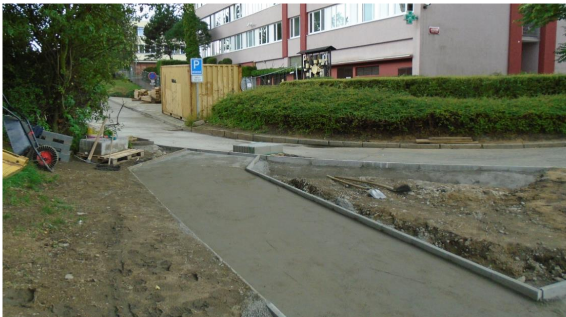
Obrázek 43: Obnova povrchu chodníků