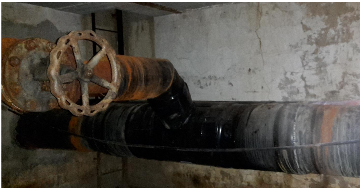
Obrázek 13: Úvodní prohlídka šachty BRA05ZEP