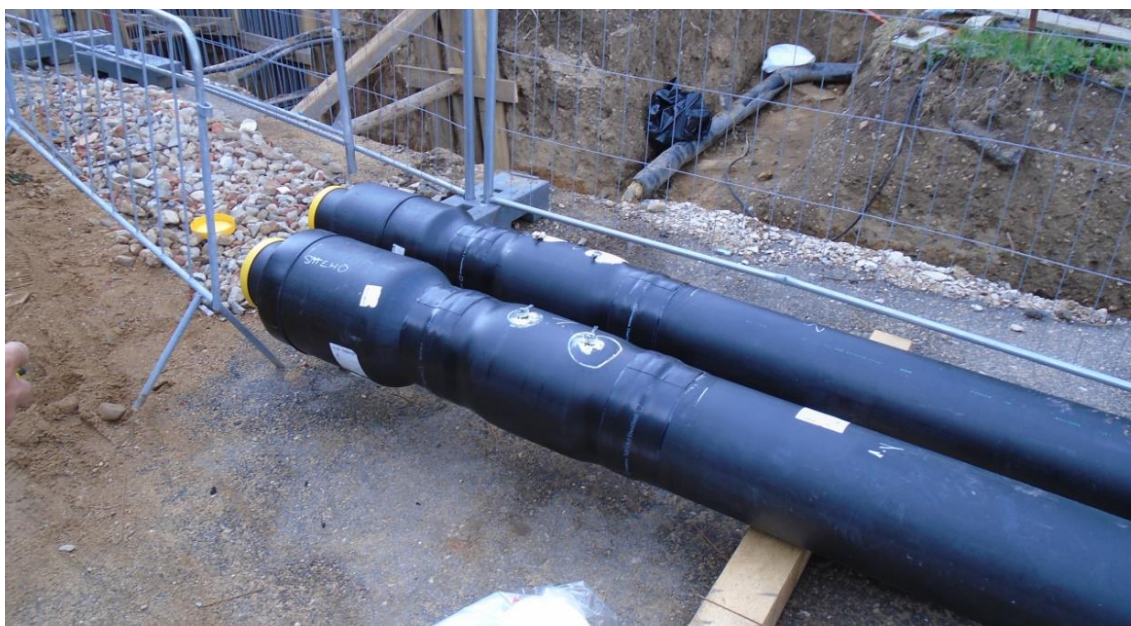
Obrázek 26: Připravené nové potrubí