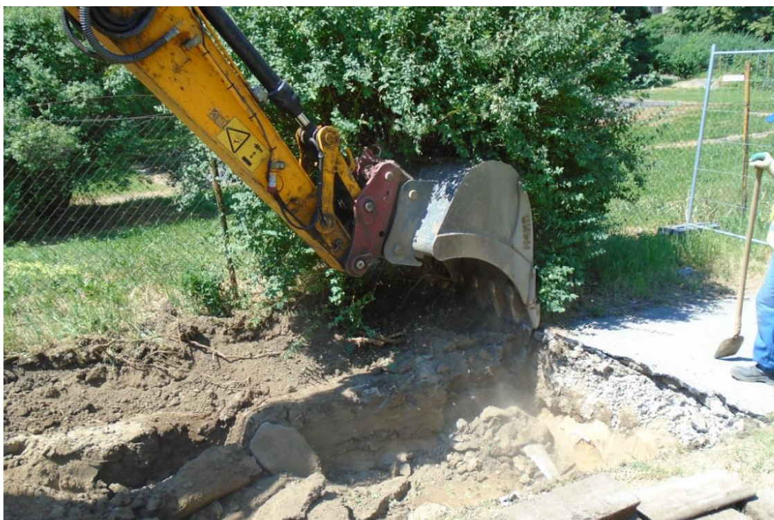
Obrázek 14: Zahájení zemních prací