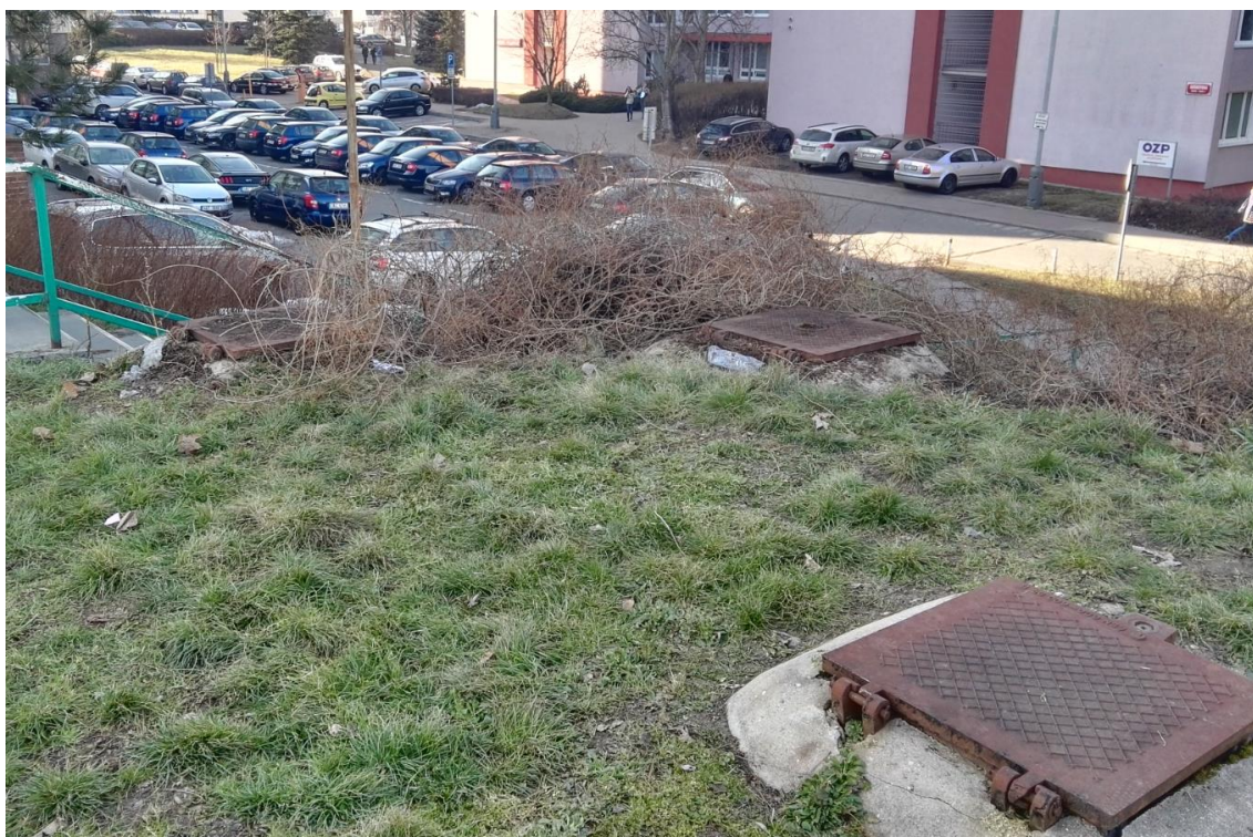
Obrázek 1: Úvodní prohlídka trasy