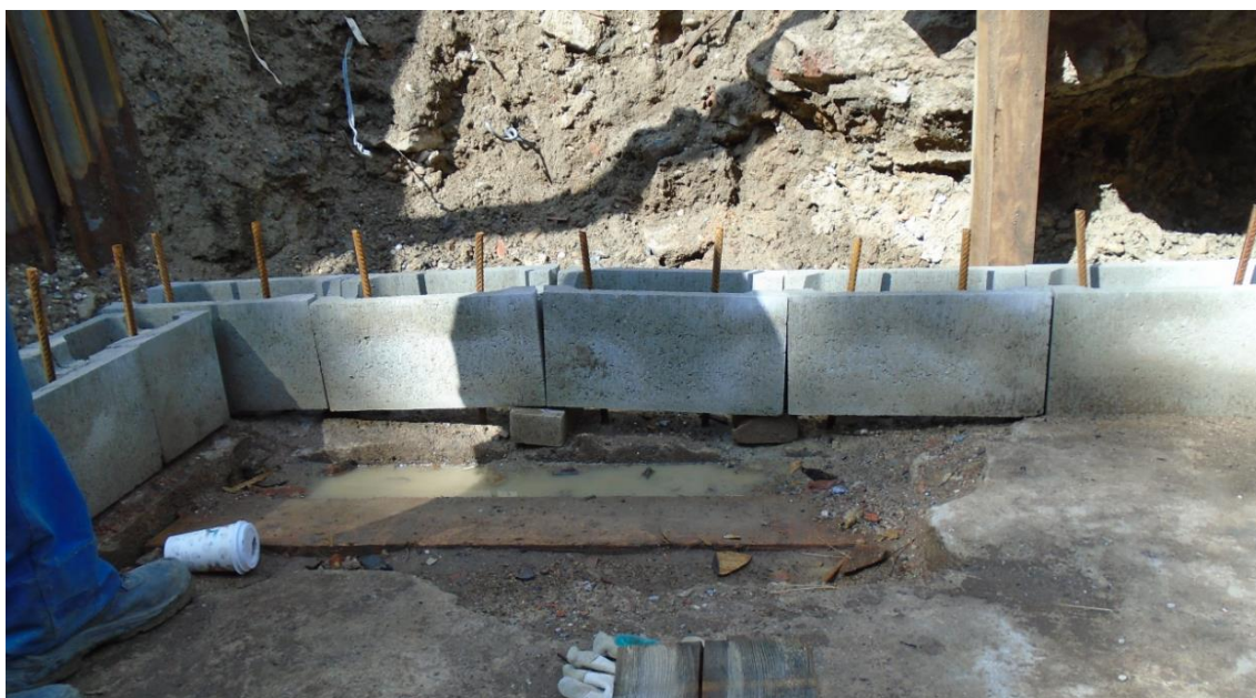
Obrázek 28: Nesprávně založení zdiva šachty BRA09ZEP