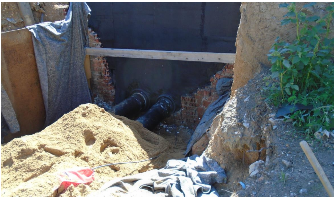
Obrázek 36: Prostup potrubí do šachty BRA05ZEP