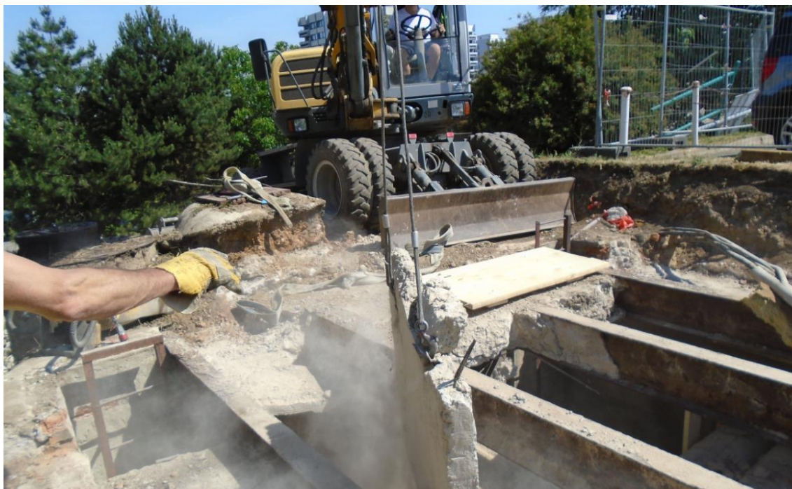
Obrázek 20: Demolice stropní konstrukce šachty BRA05ZEP