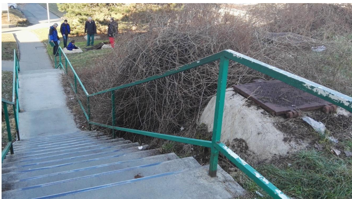
Obrázek 2: Úvodní prohlídka trasy