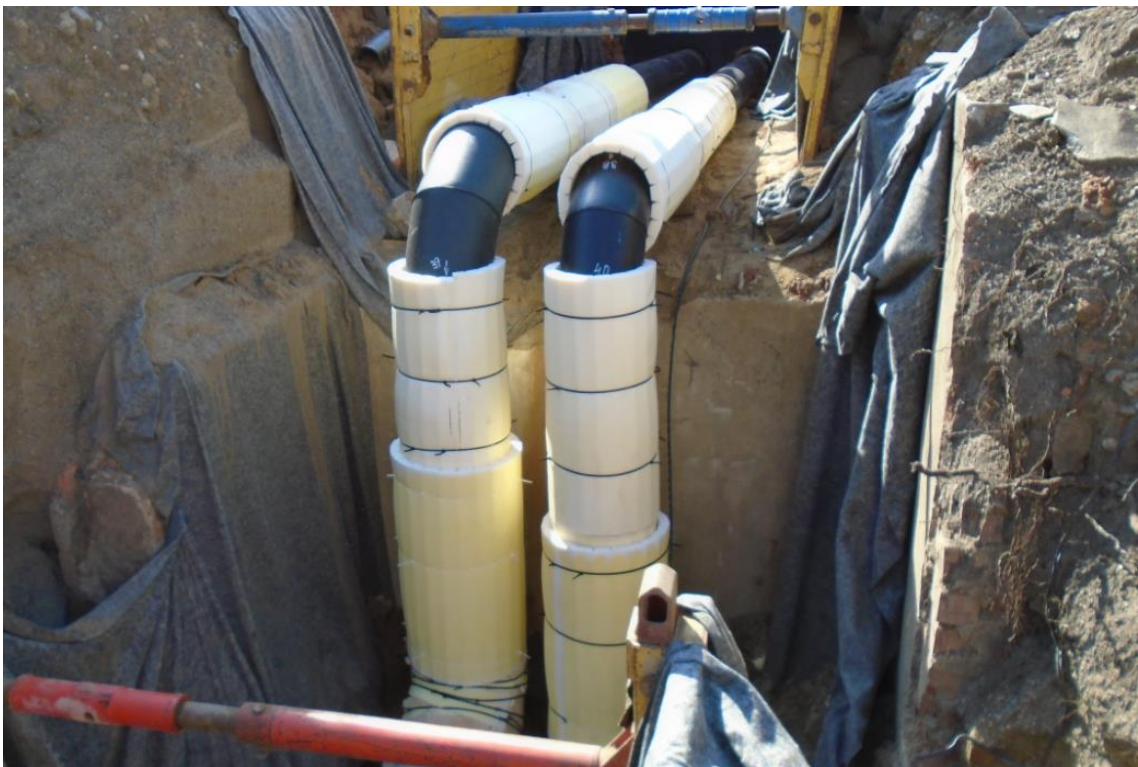
Obrázek 34: Polštářové obložení etáže