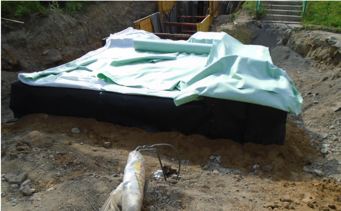
Obrázek 39: Použití ochranné geotextílie na strop šachty