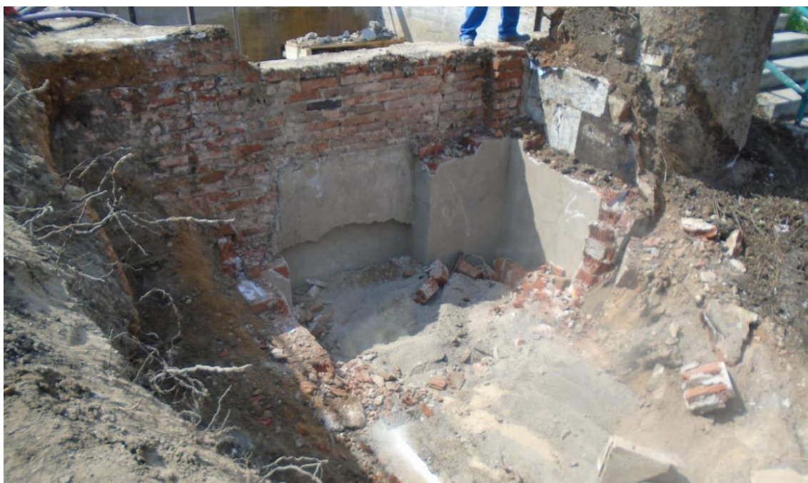
Obrázek 21: Demolice nahlížecího otvoru