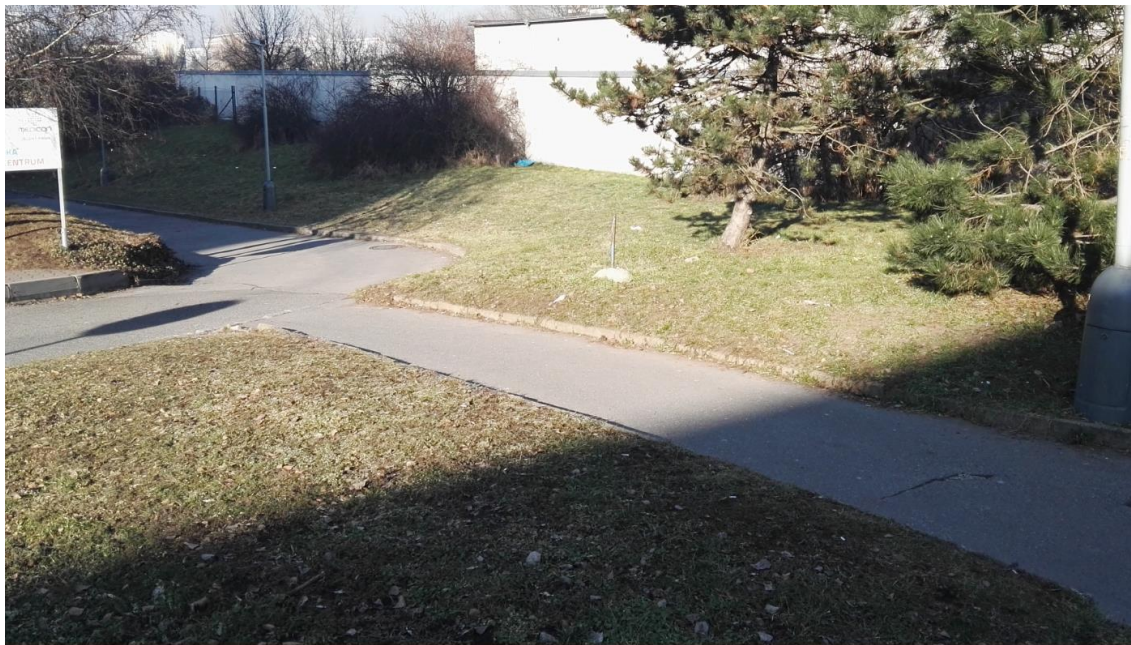
Obrázek 3: Úvodní prohlídka trasy