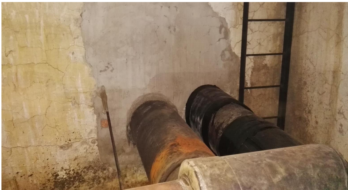
Obrázek 11: Úvodní prohlídka šachty BRA05ZEP