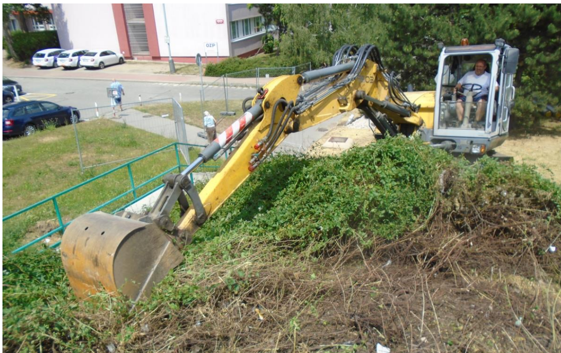
Obrázek 15: Odstraňování křovin v ochranném pásmu horkovodu