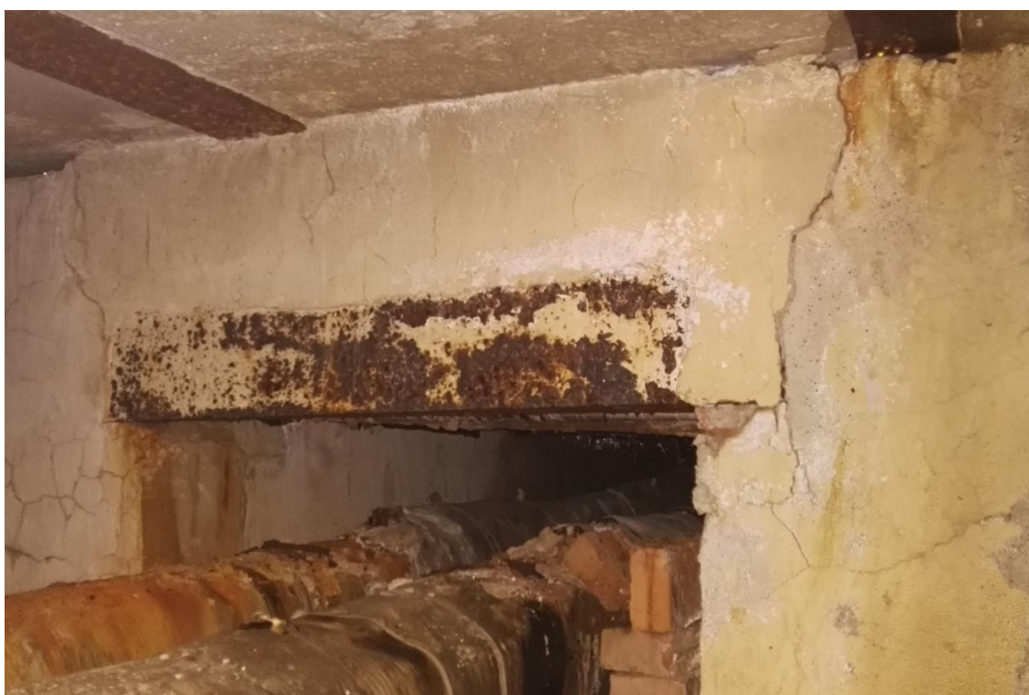
Obrázek 10: Úvodní prohlídka šachty BRA09ZEP