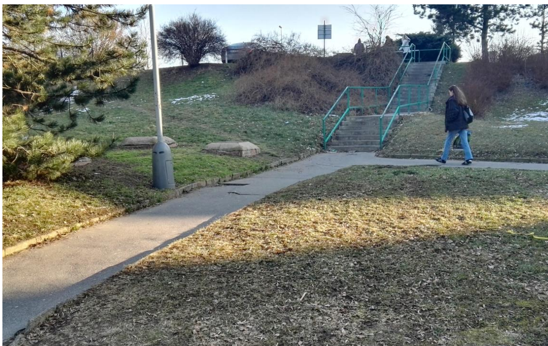
Obrázek 5: Úvodní prohlídka trasy