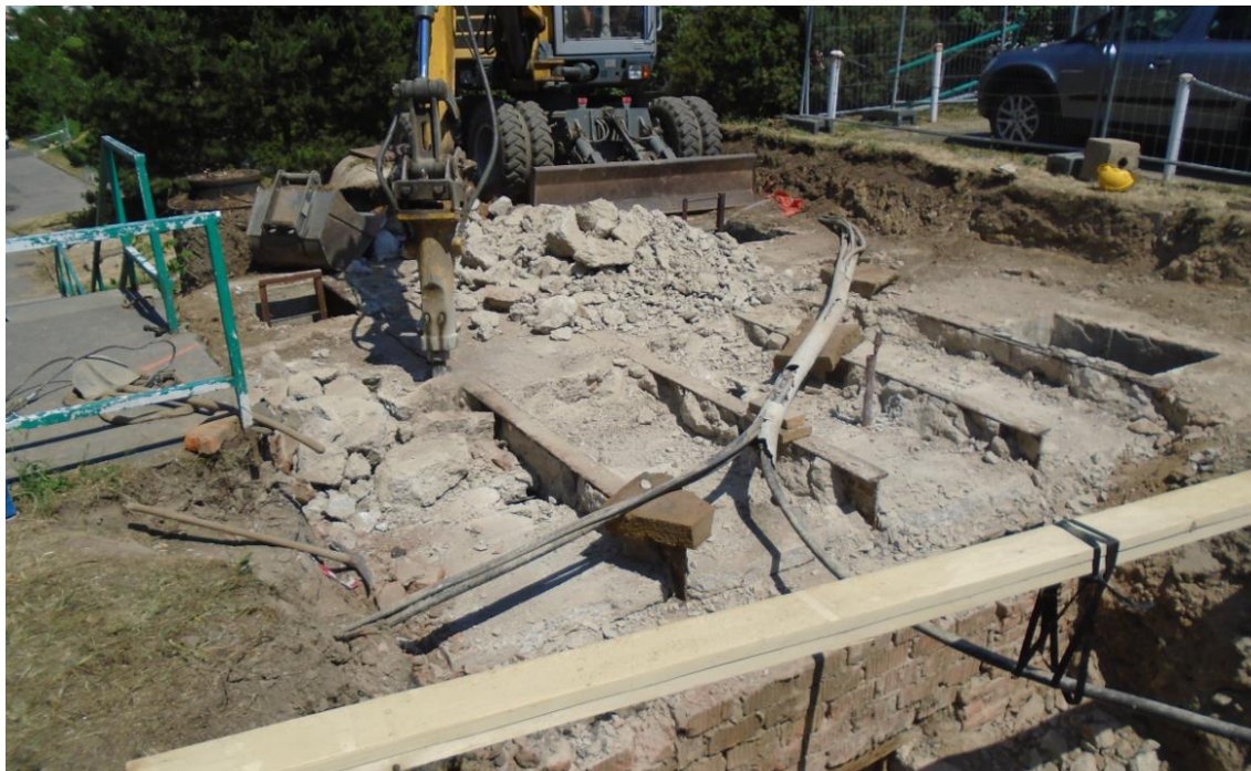
Obrázek 19: Demolice stropní konstrukce šachty BRA05ZEP