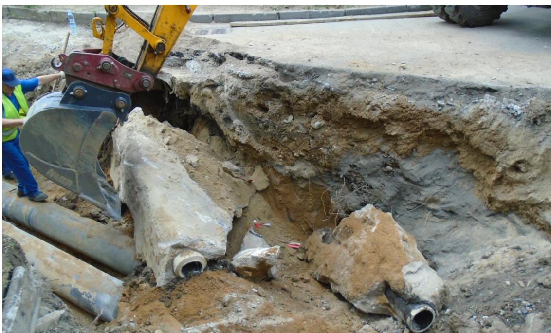
Obrázek 22: Poničené kanalizační potrubí