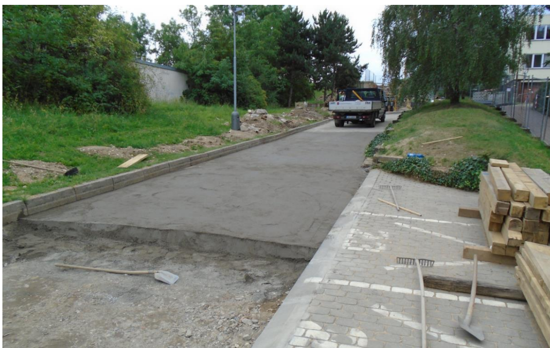
Obrázek 42: Obnova povrchu komunikací