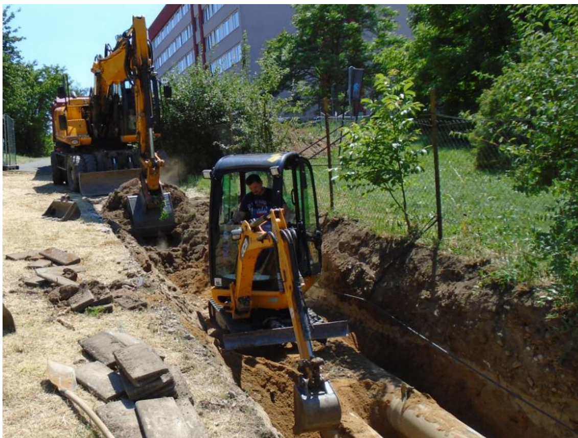
Obrázek 24: Odhalení potrubí