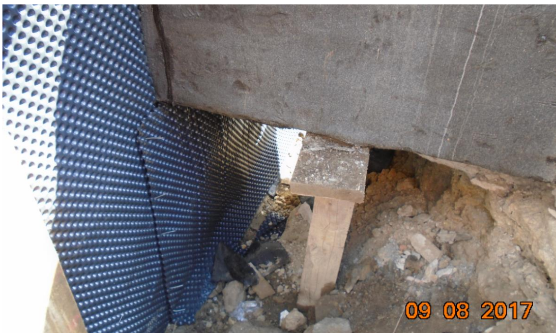
Obrázek 32: Detail nevhodně podepřeného stávajícího kanálu