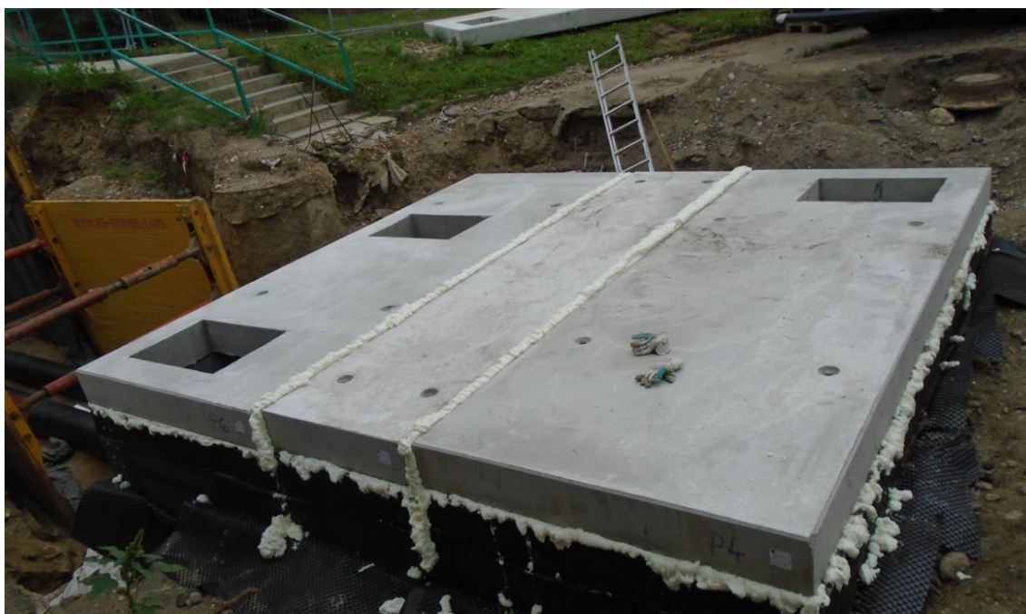
Obrázek 38: Nevhodné vyplnění spár mezi stropními panely PUR pěnou