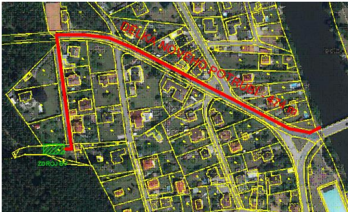
Obr. 1 MP 3 - Výstavba nové dešťové kanalizace