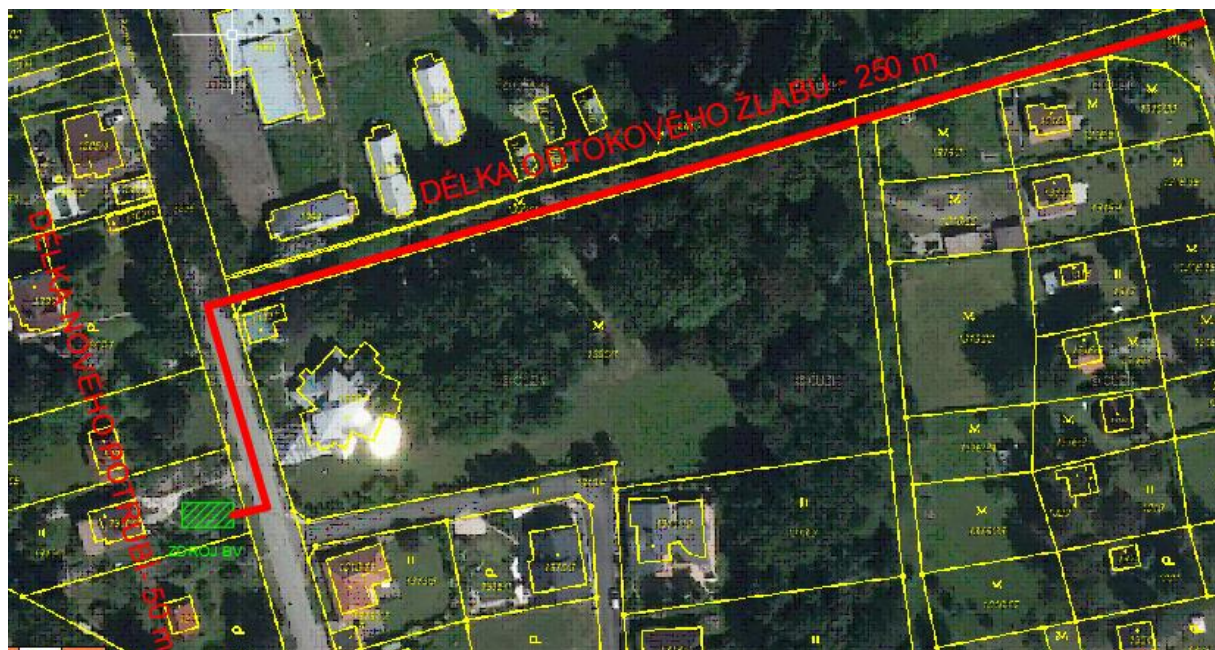
Obr. 2 MP 4 - Výstavba nové dešťové kanalizace a odtokového žlabu