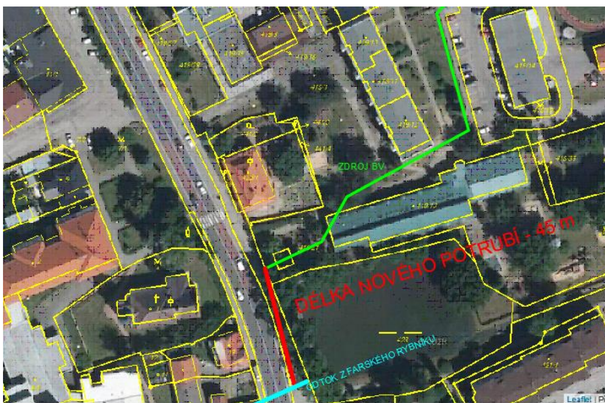
Obr. 4 MP 6 - Výstavba nového úseku dešťové kanalizace