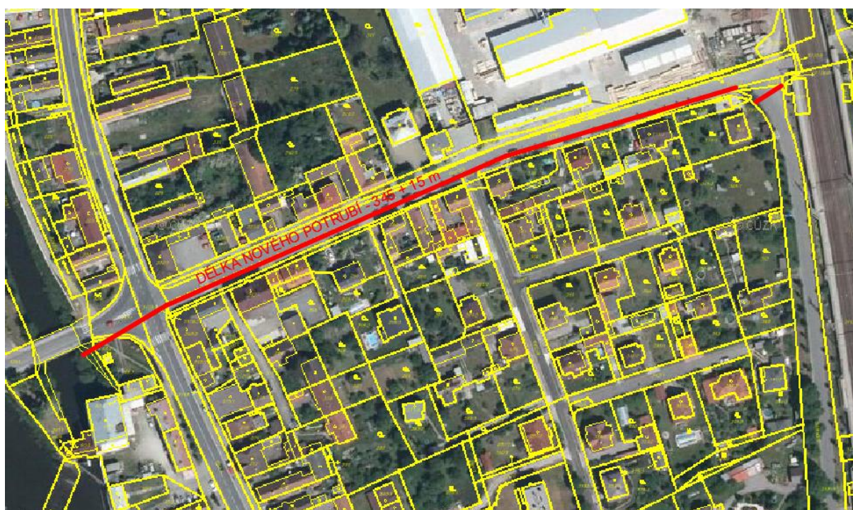
Obr. 6 MP 7 - Výstavba nového potrubí