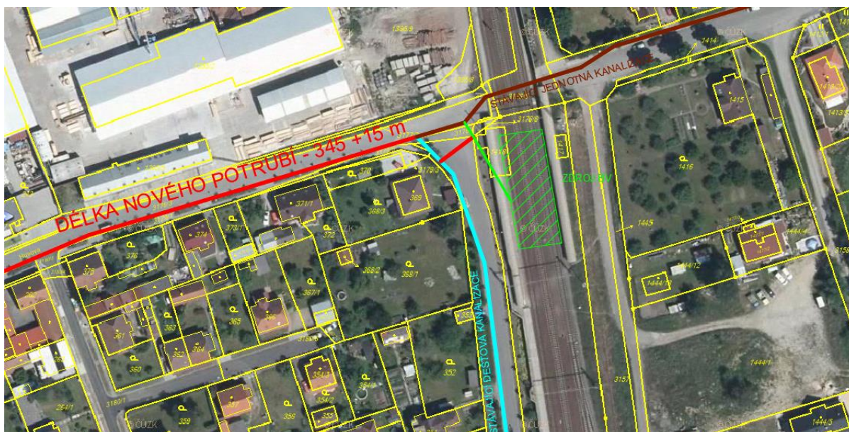
Obr. 5 MP 7 - Výstavba nového úseku