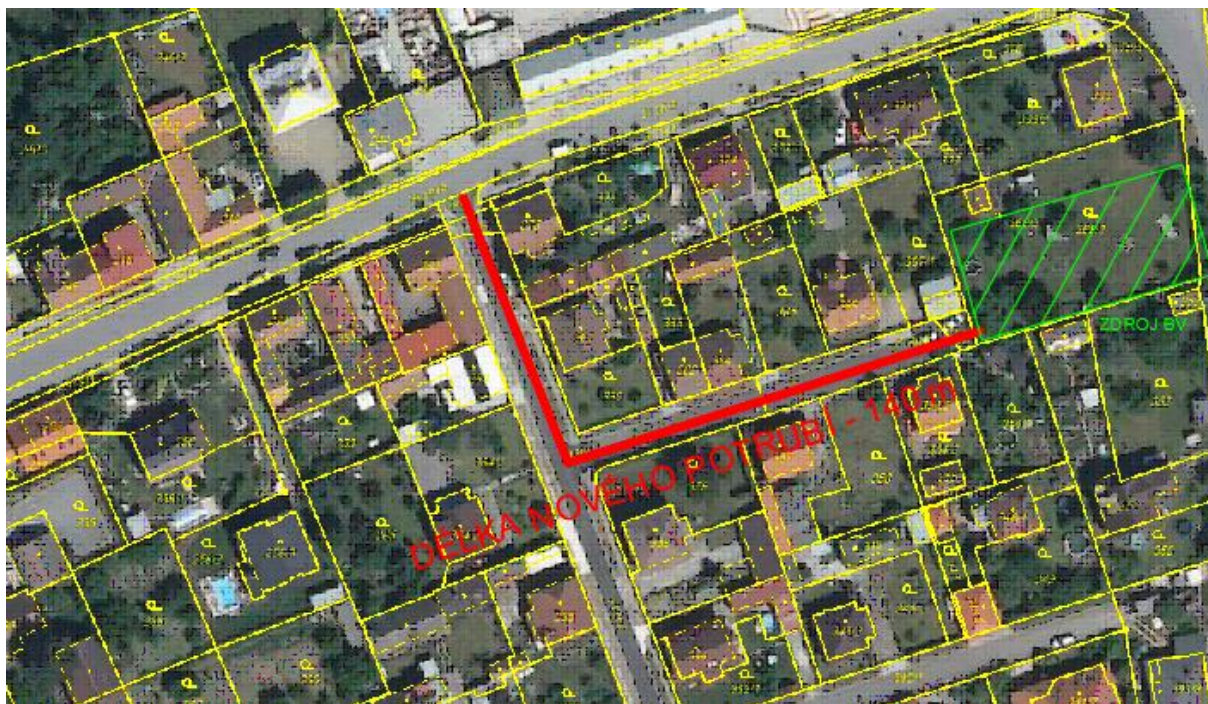
Obr. 3 MP 5 – Výstavba nové dešťové kanalizace