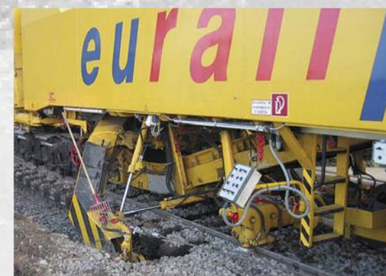
Schotteraushubkette der AHM 800-R