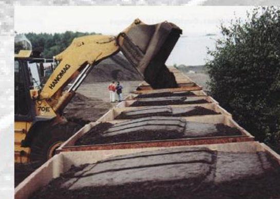
Laden der BA 255 – Container