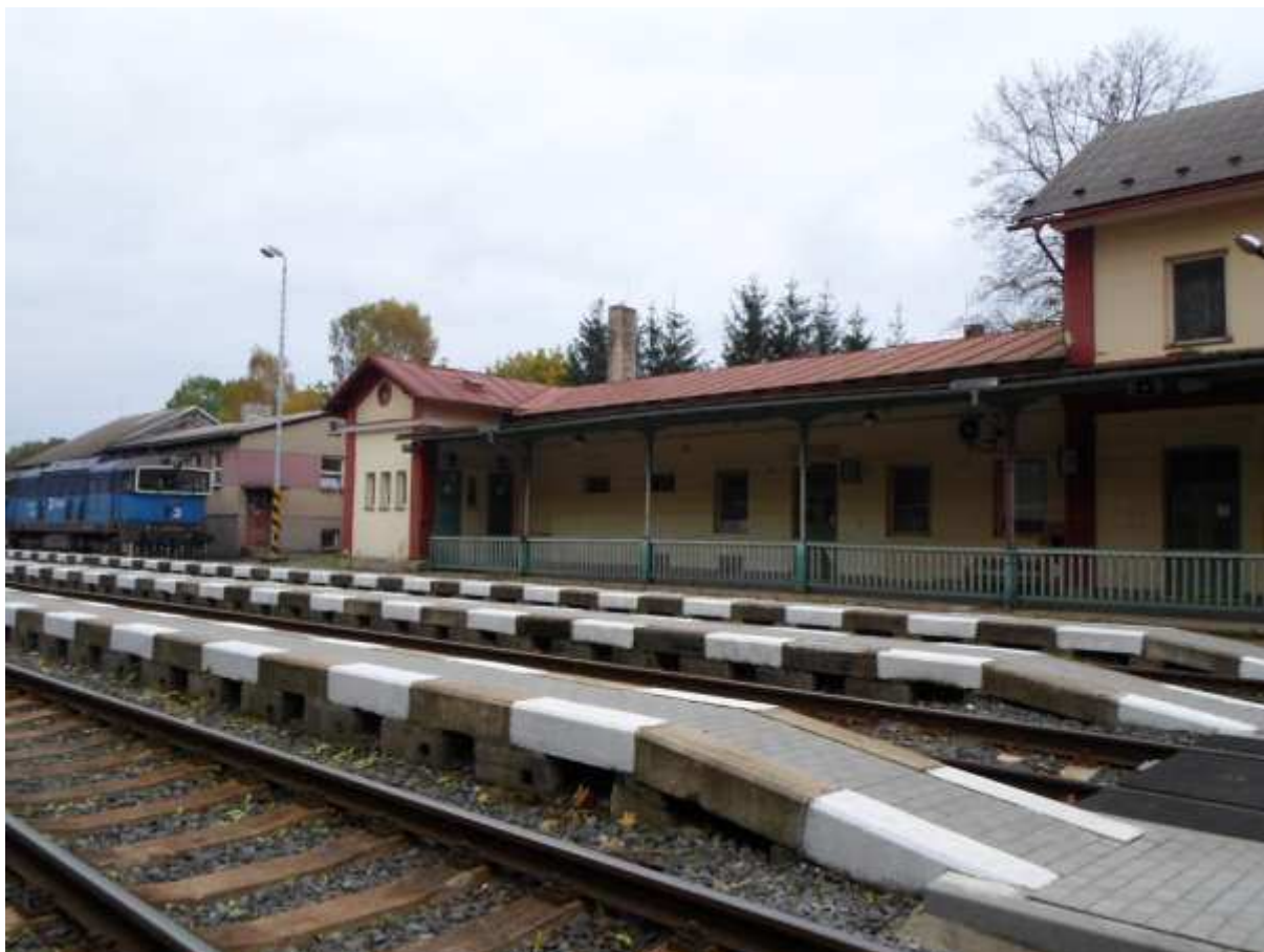
Obr. 13 Pohled na výpravní budovu žst. Lipová Lázně