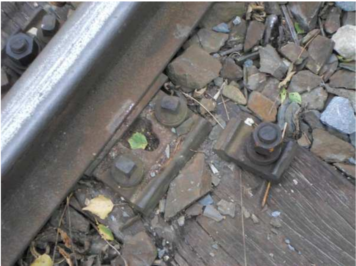
Obr. 9 Již nefunkční upevnění K