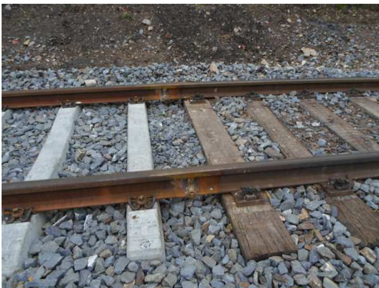
Obr. 8 Přechod zrekonstruovaného úseku na stávající trať