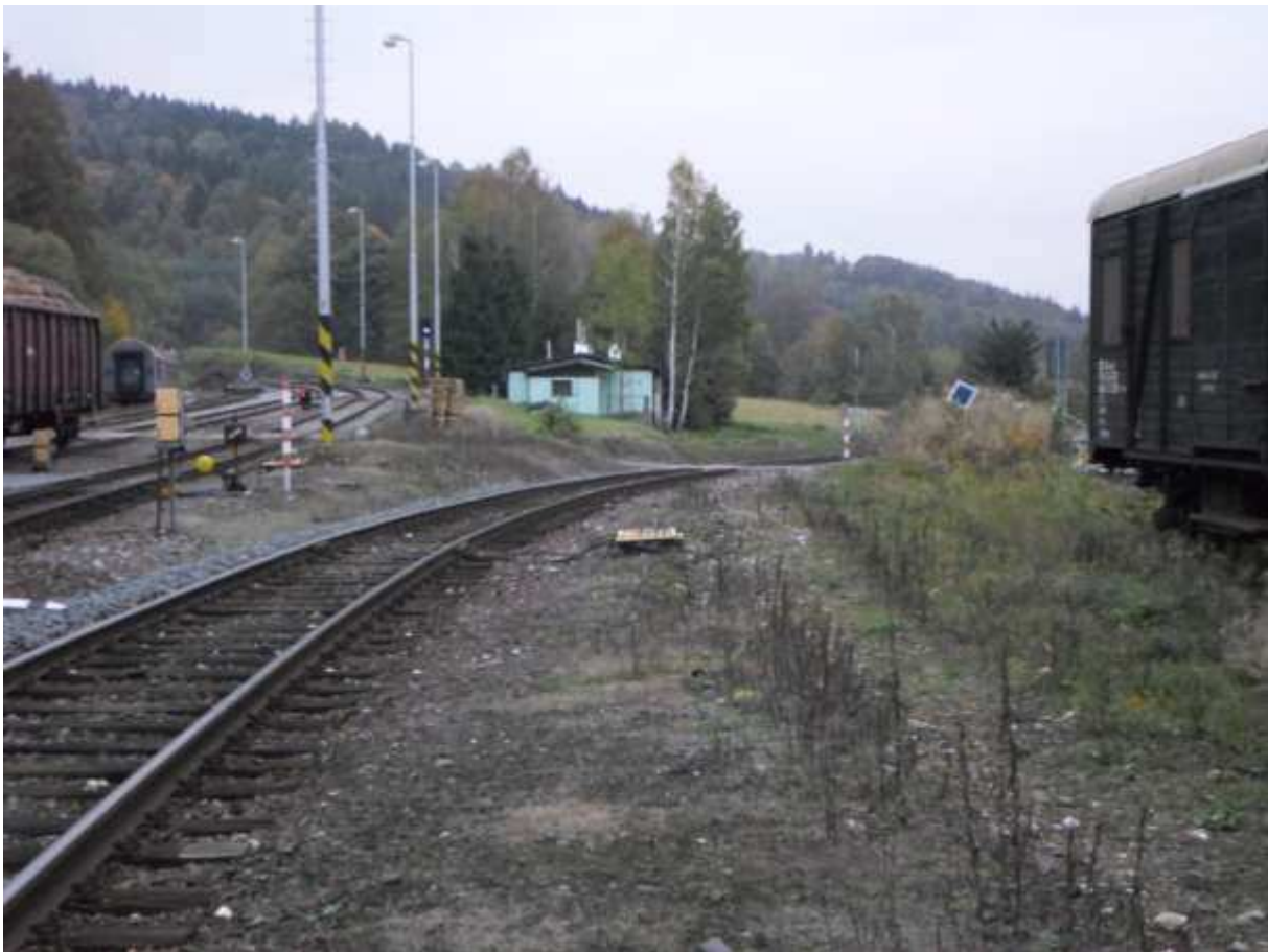
Obr. 15 Výjezd ze stanice směrem na Jeseník a Vápennou