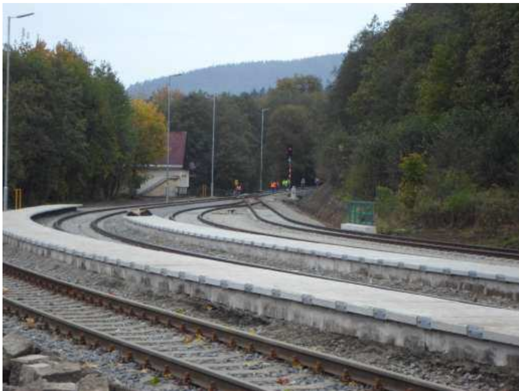
Obr. 1 Pohled na zhlaví v žst. Horní Lipová