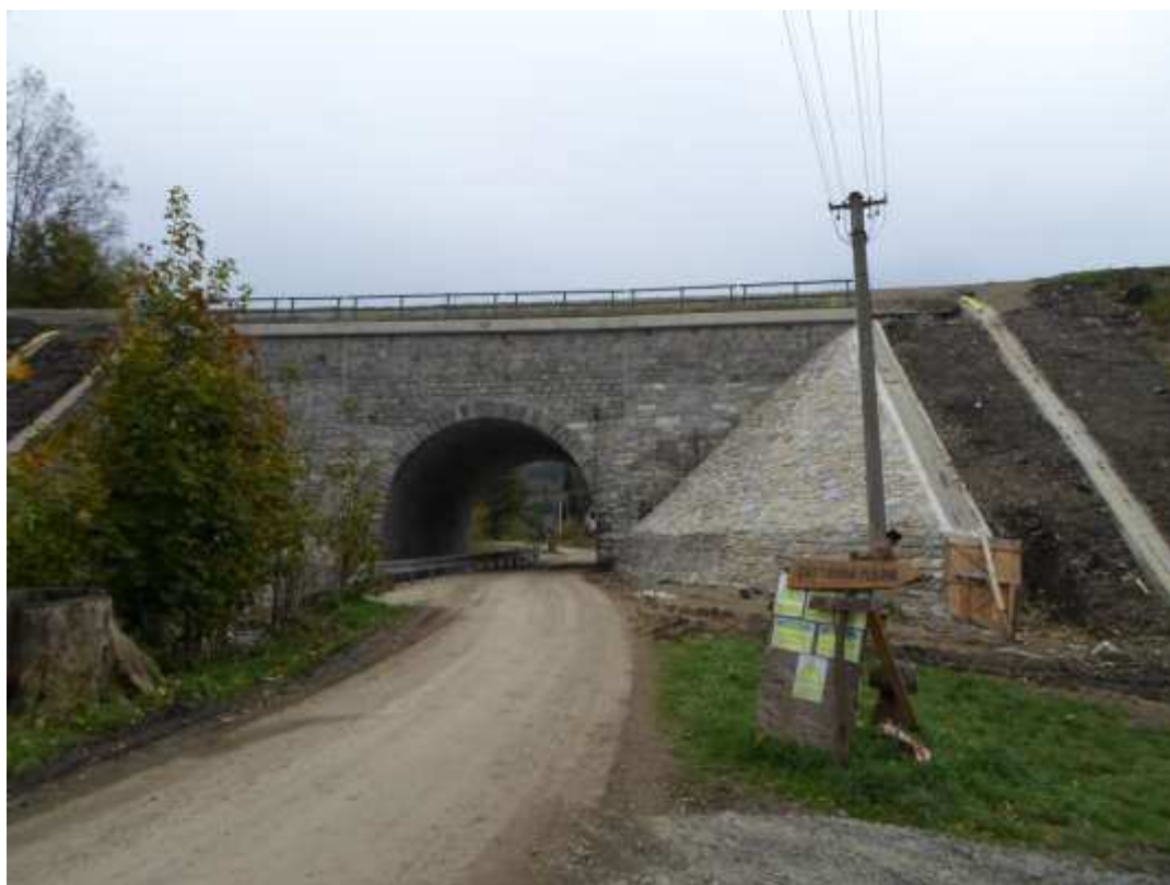
Obr. 2 Pohled na železniční most vedoucí před údolí