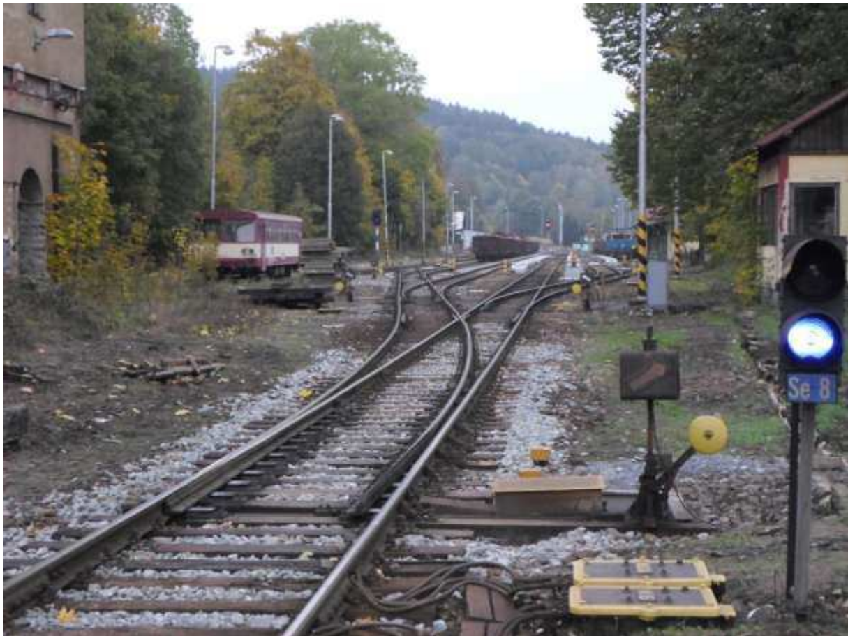
Obr. 11 Pohled do žst. Lipová Lázně