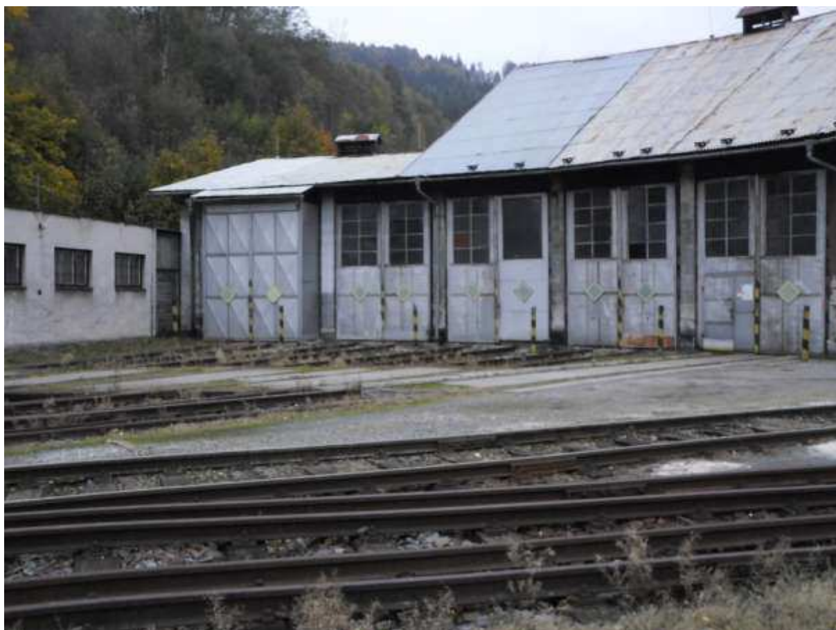
Obr. 17 Pohled na depo v žst. Lipová Lázně