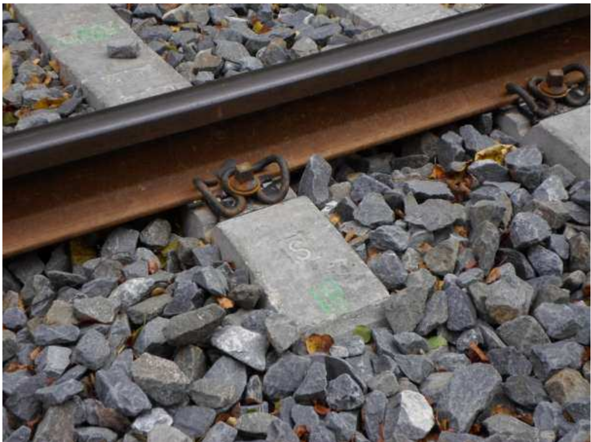
Obr. 4 Sestava železničního svršku