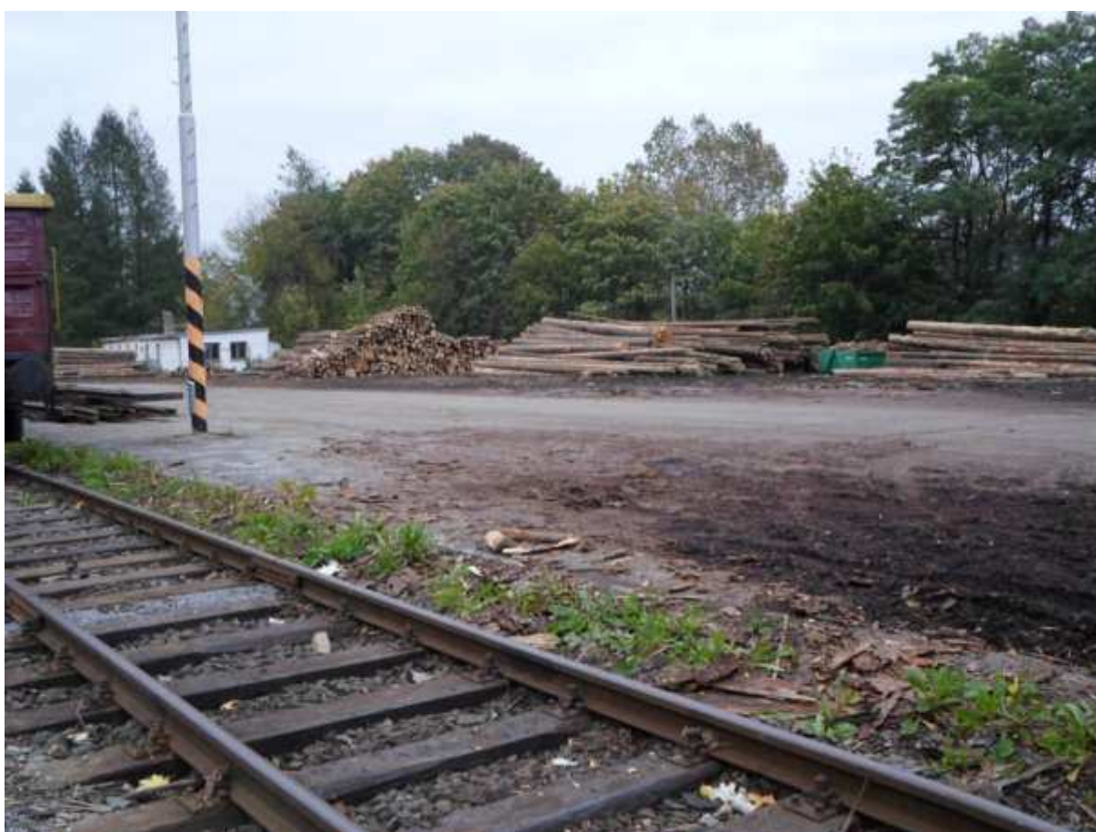
Obr. 14 Manipulační plocha podél kusé koleje č. 5