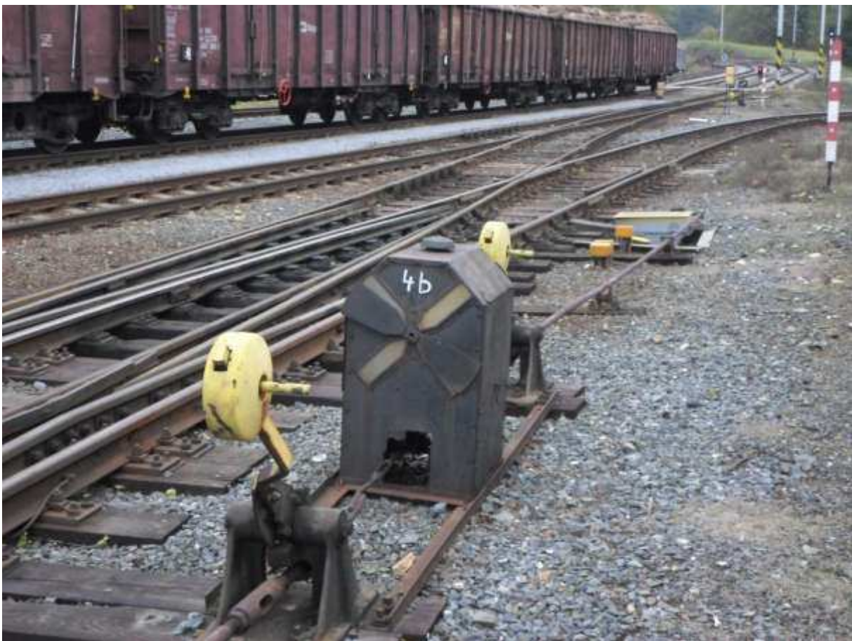
Obr. 16 Křižovatková výhybka