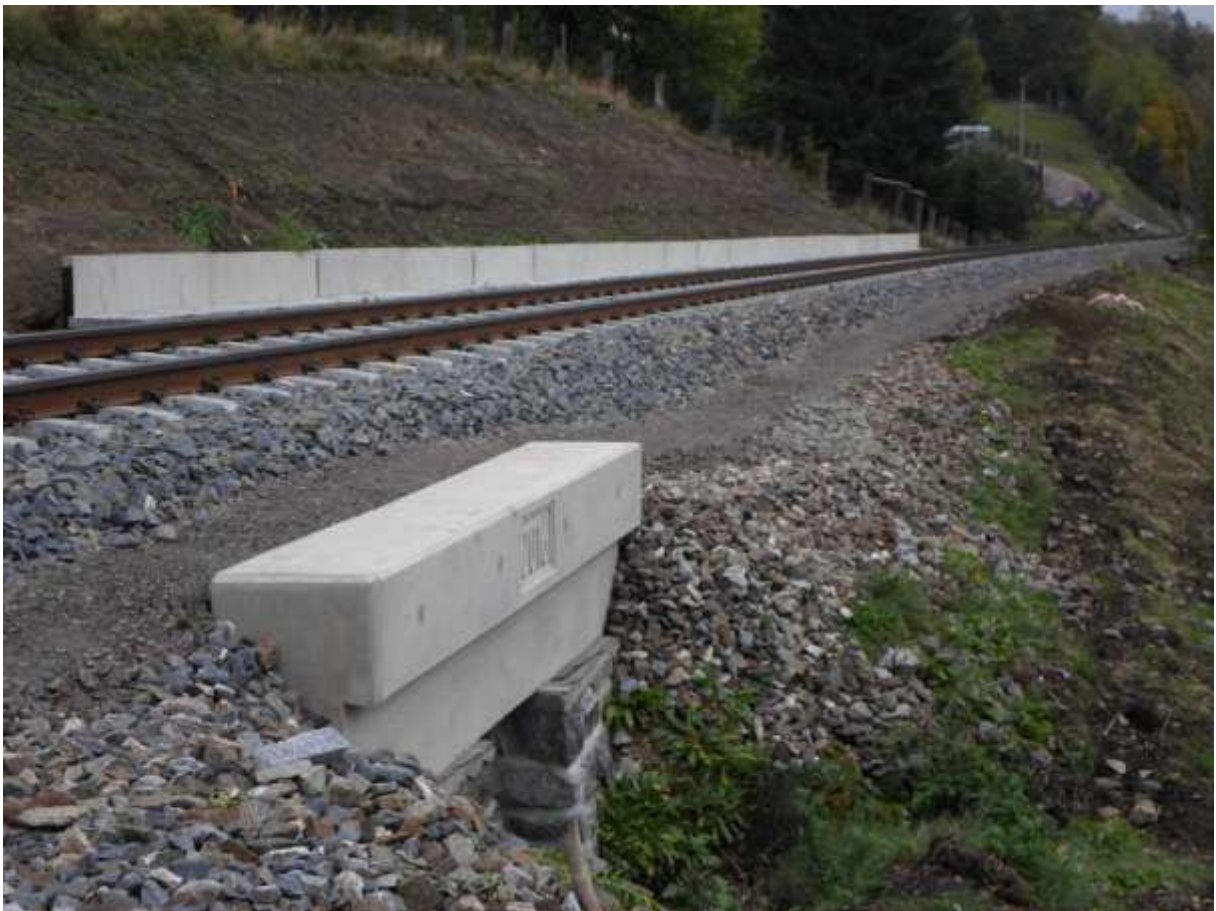
Obr. 6 Propustek