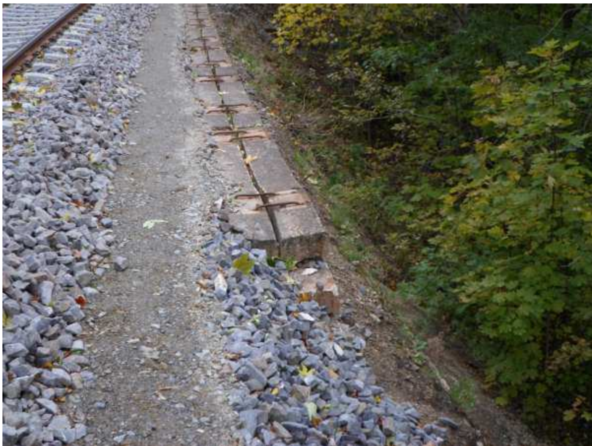
Obr. 7 Rozšíření stezky