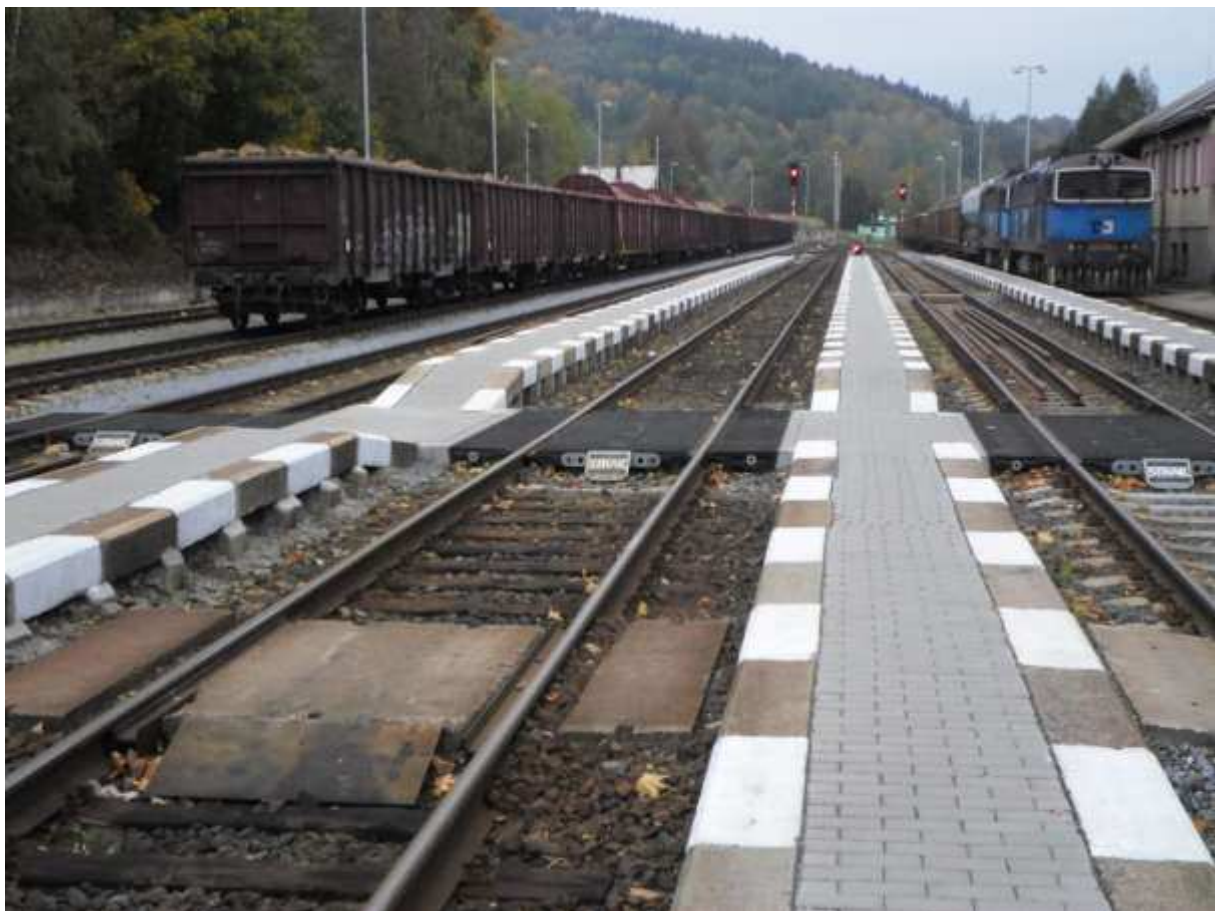
Obr. 12 Přístup k nástupišti