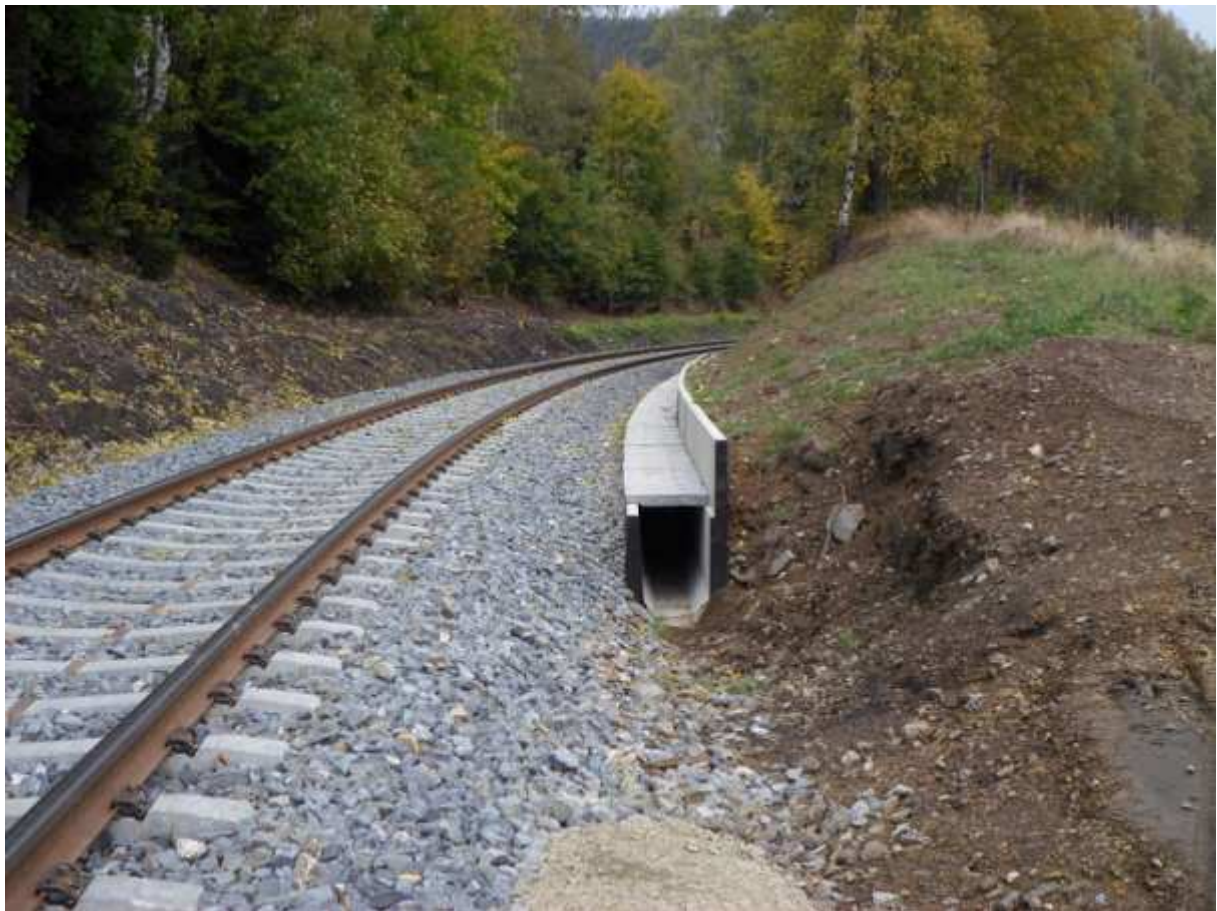
Obr. 3 Odvodnění trati