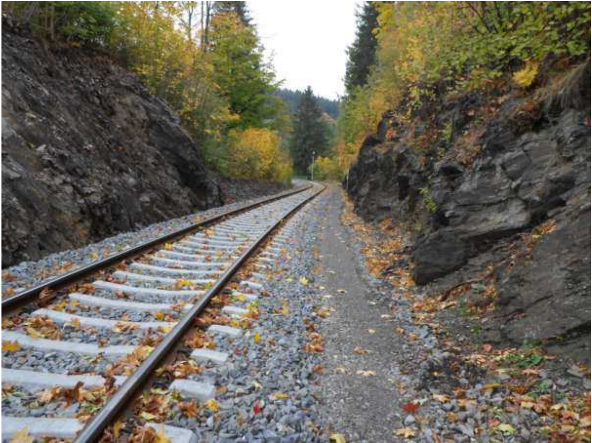
Obr. 5 Pohled na trať