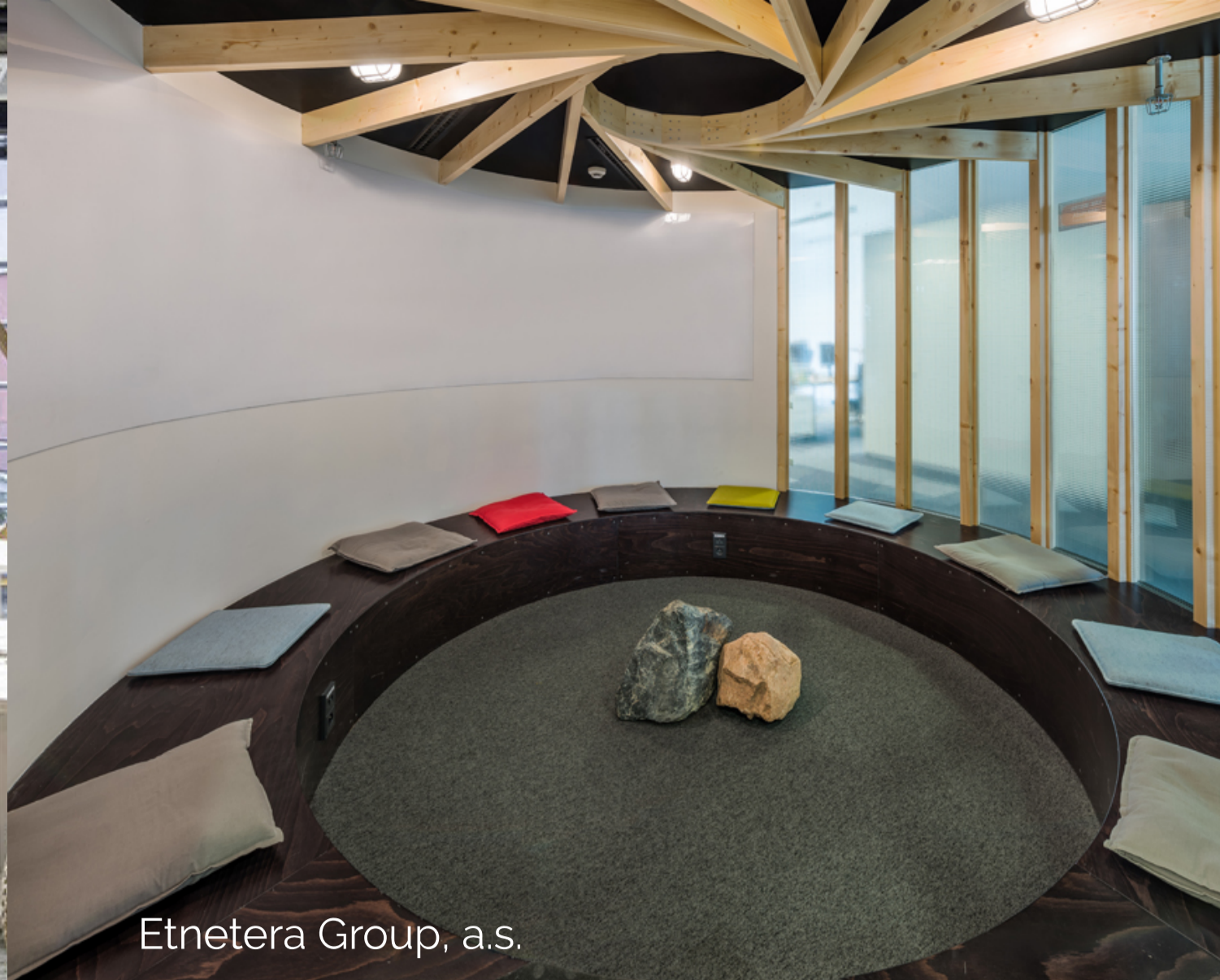
Etnetera Group, a. s.