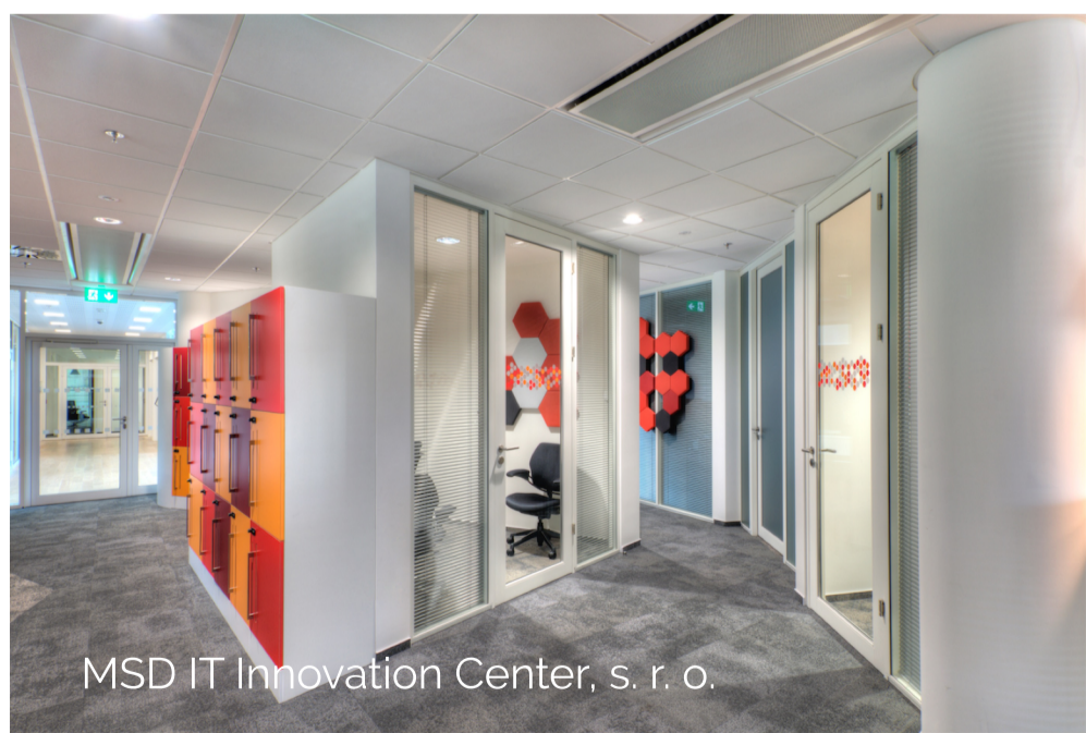
MSD IT Innovation Center, s. r. o.