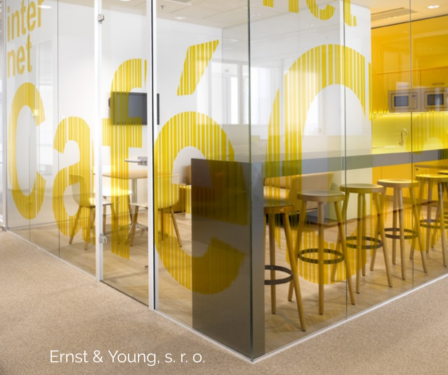
Ernst & Young, s. r. o.