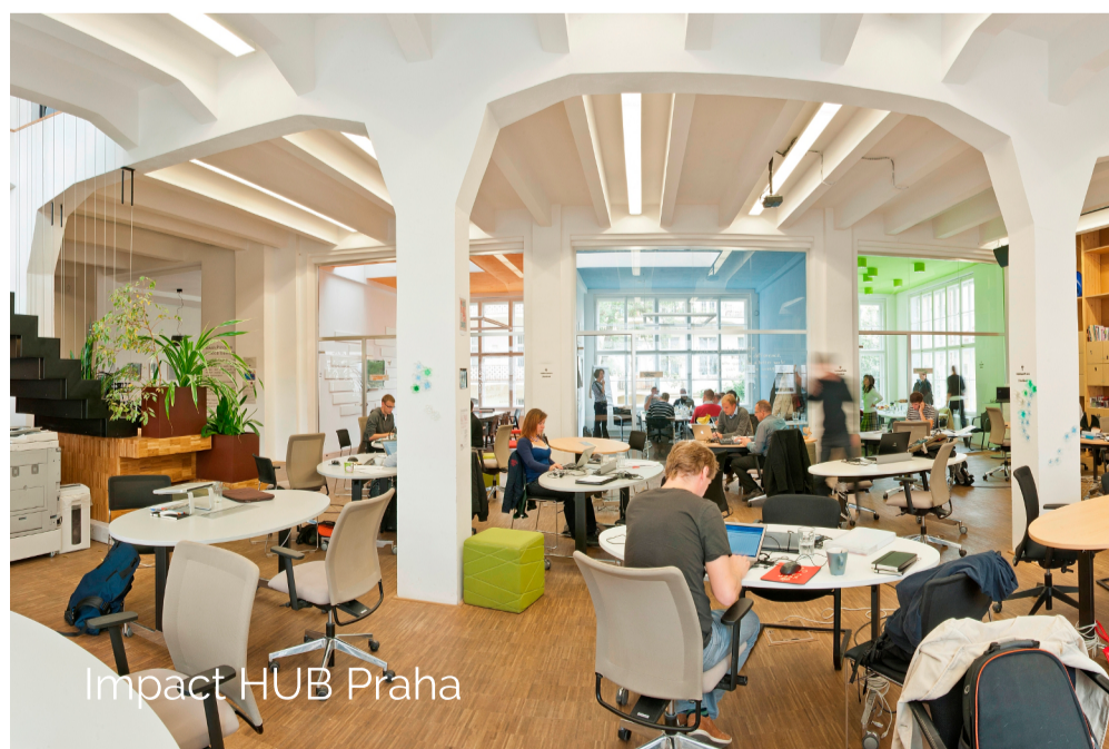
Impact HUB Praha