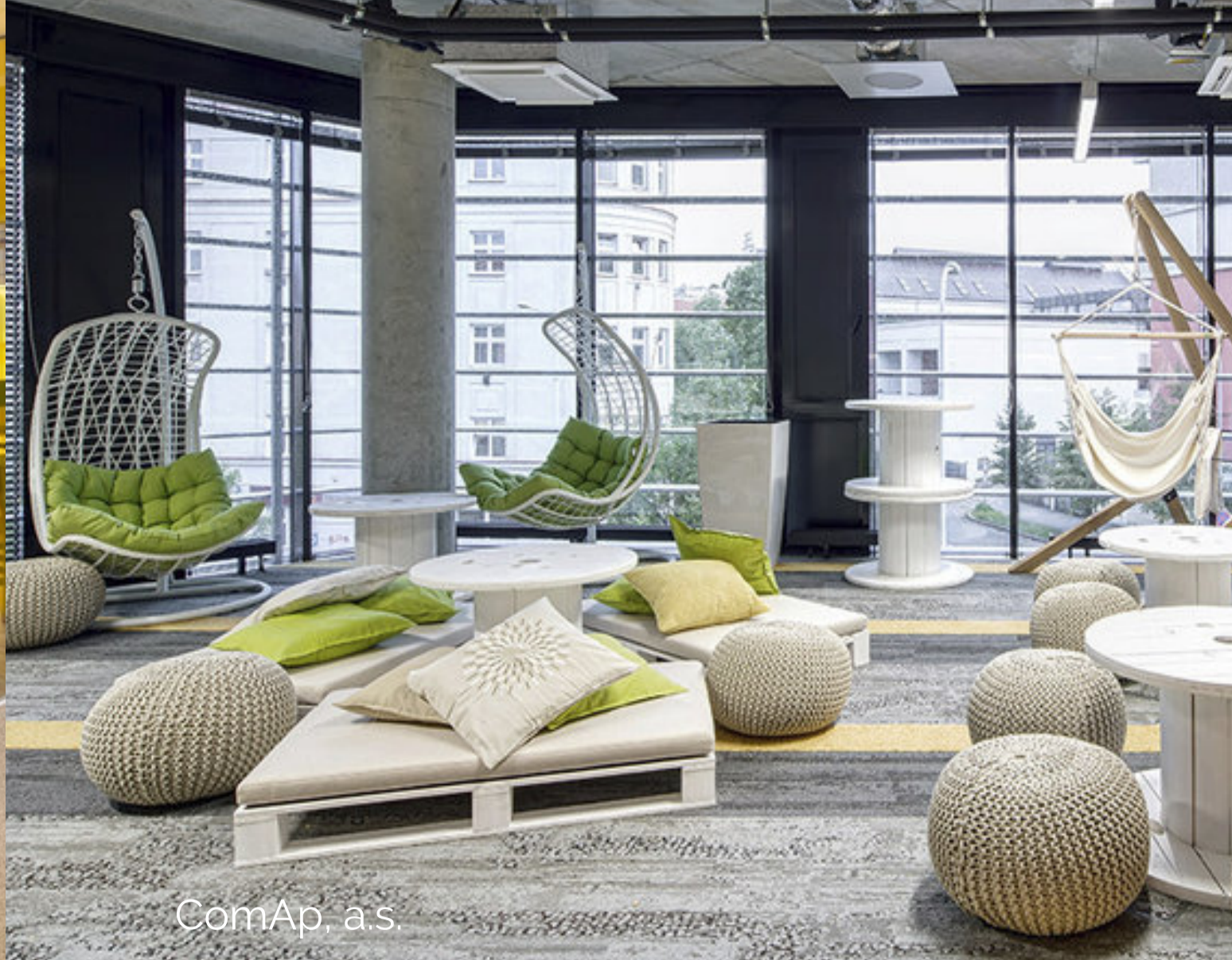
ComAp, a. s.