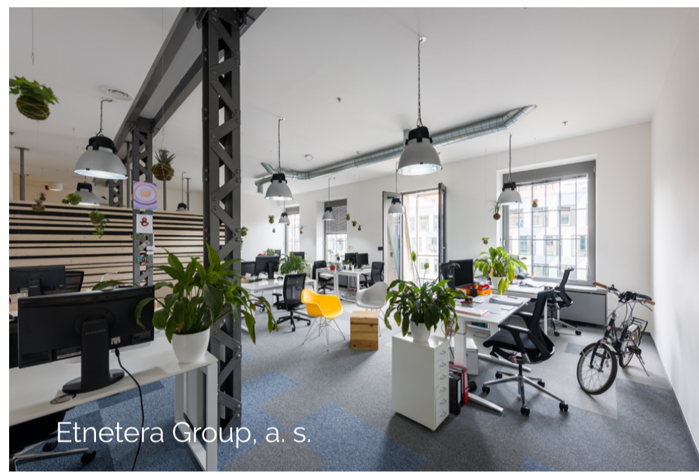
Etnetera Group, a. s.

Práce seznamuje s pracovním prostředím, jeho faktory a vlivem na pracovníky, shrnuje vývoj kancelářského pracovního prostředí a uvádí determinanty, které na něj mají v současnosti největší vliv. S novými trendy v pracovním prostředí práce seznamuje pomocí případových studií. Dále práce obsahuje výčet indikátorů inovativního pracovního prostředí, jejichž prostřednictvím jsou případové studie hodnoceny. Cílem práce je formulace doporučení pro personální a facility management s ohledem na udržitelnost lidských zdrojů ve společnosti. Metodami práce jsou rešerše odborné literatury a dostupných informačních zdrojů a analýza inovativního pracovního prostředí ve vybraných společnostech.