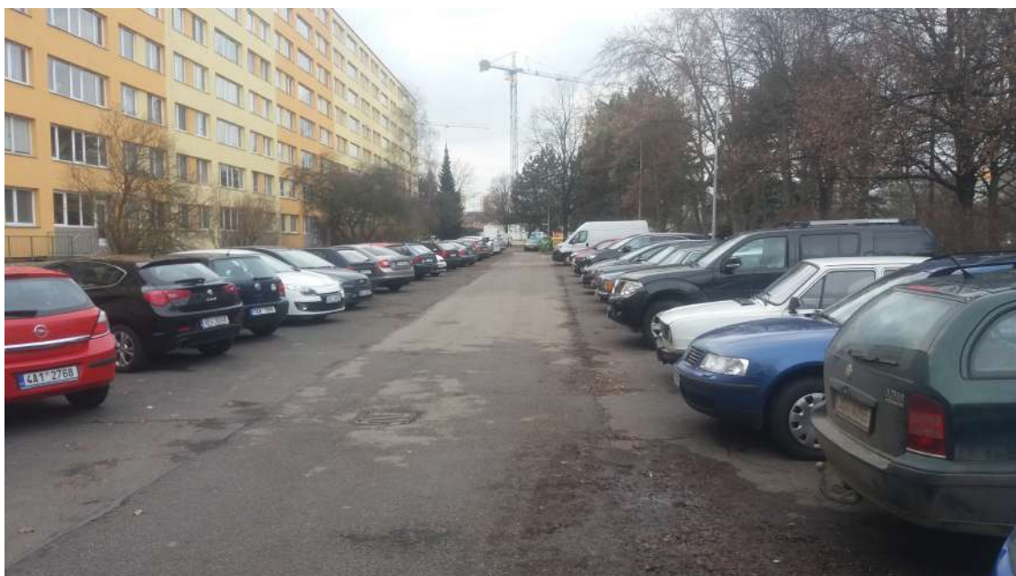
Obrázek 10: Ulice Žandovská