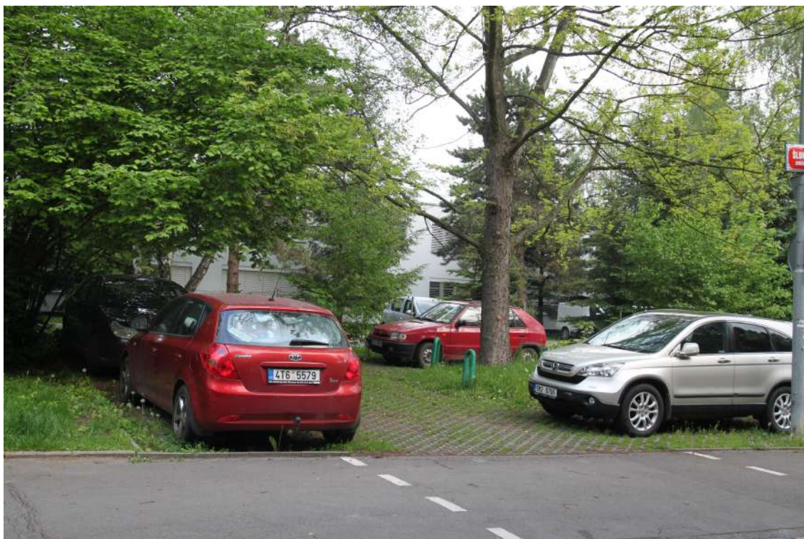
Obrázek 9: Parkovací plocha v ulici Šluknovská