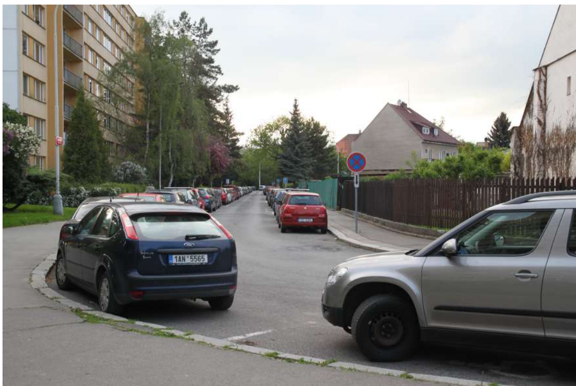
Obrázek 2: Ulice Ctěnická