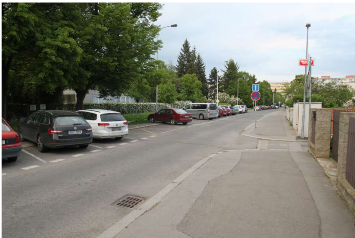
Obrázek 3: Ulice Měšická