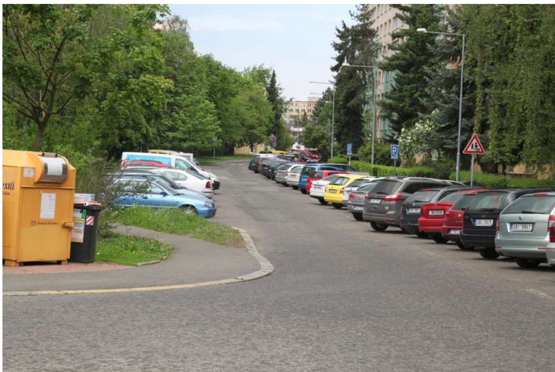
Obrázek 5: Jižní část ulice Novoborská