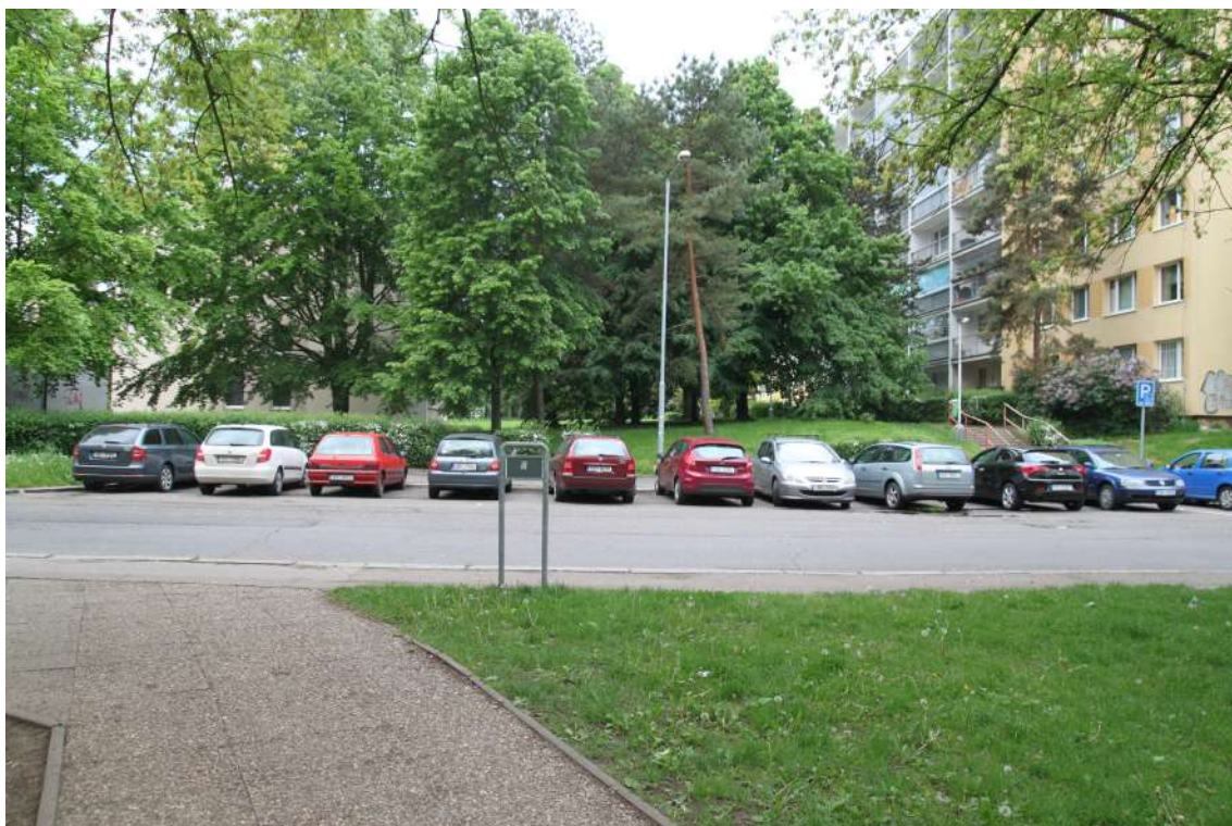
Obrázek 7: Parkovací pás před základní školou Novoborská