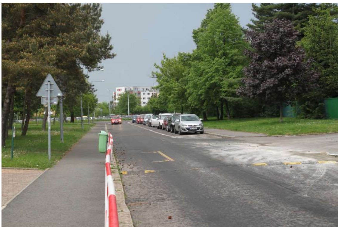
Obrázek 4: Neřešená část ulice Českolipská