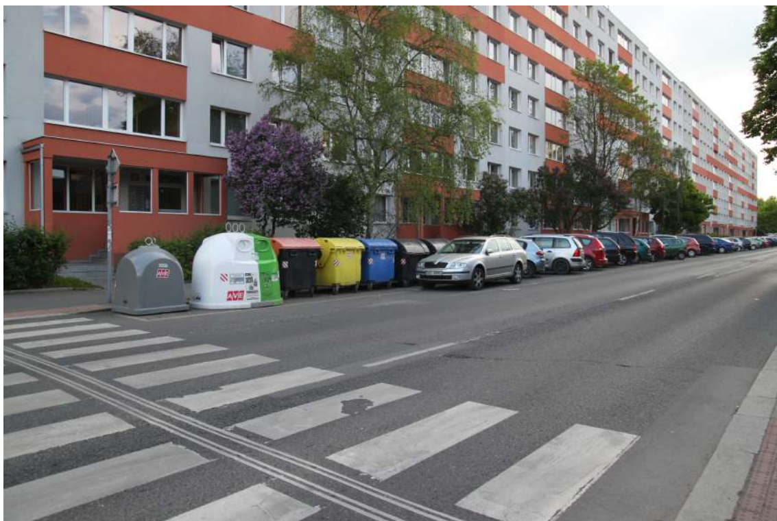
Obrázek 1: Ulice Lovosická