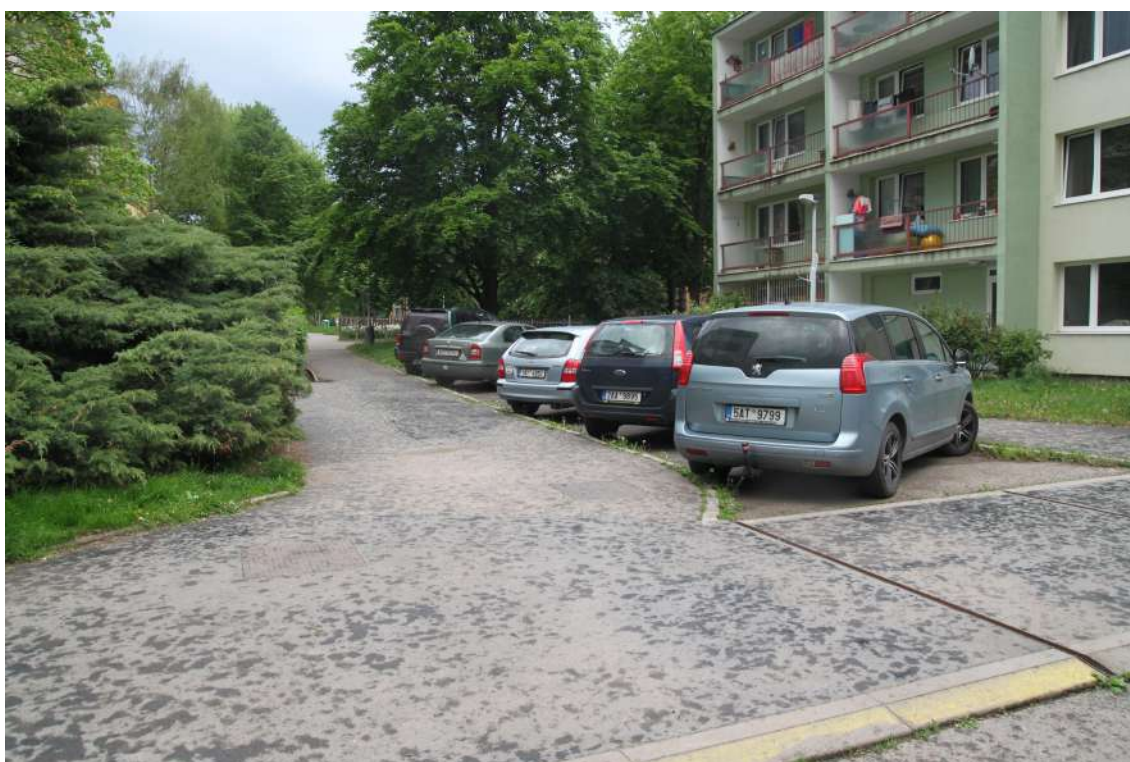
Obrázek 6: Kuriózní stav v ulici Novoborská