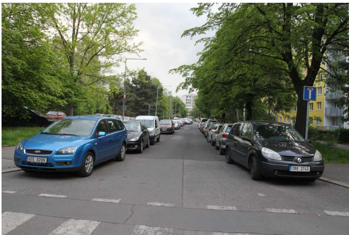
Obrázek 8: Ulice Šluknovská