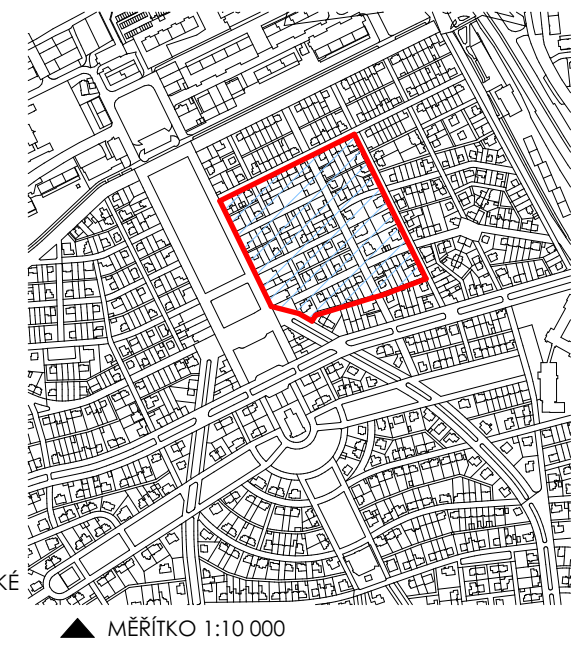
DIAGRAM KATEGORIZACE OBJEKTŮ