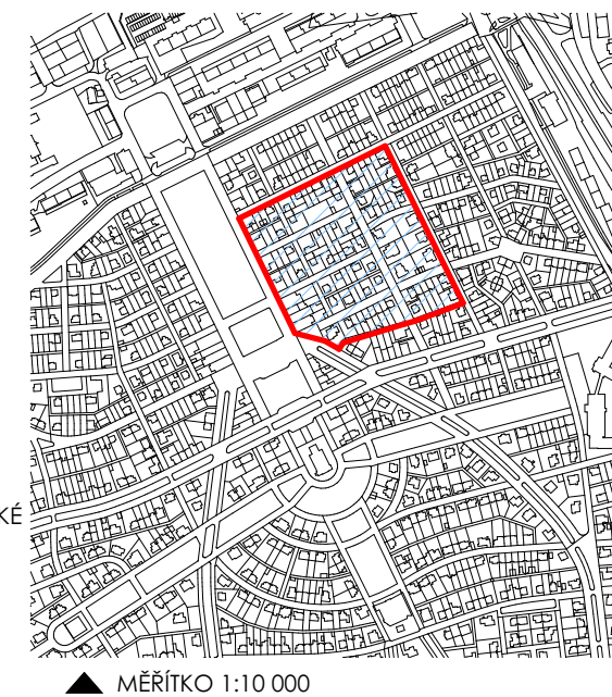
DIAGRAM KATEGORIZACE OBJEKTŮ