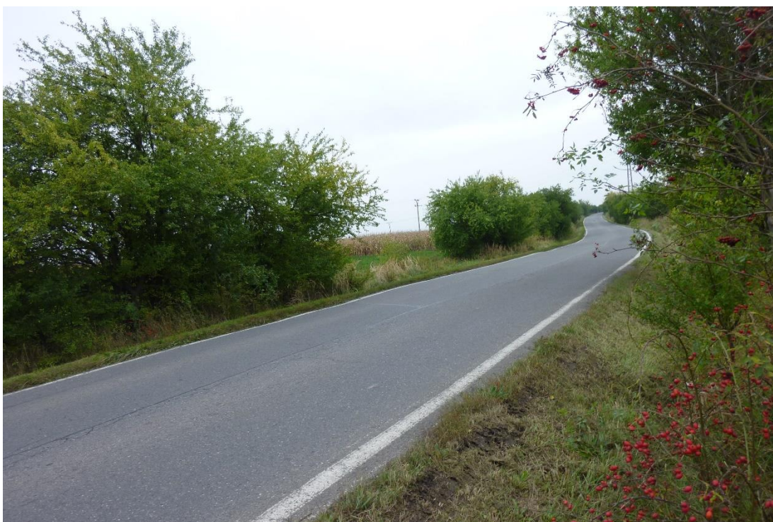
Obr. 13 – Pohled na směrové vedení silnice III/33313 proti směru staničení