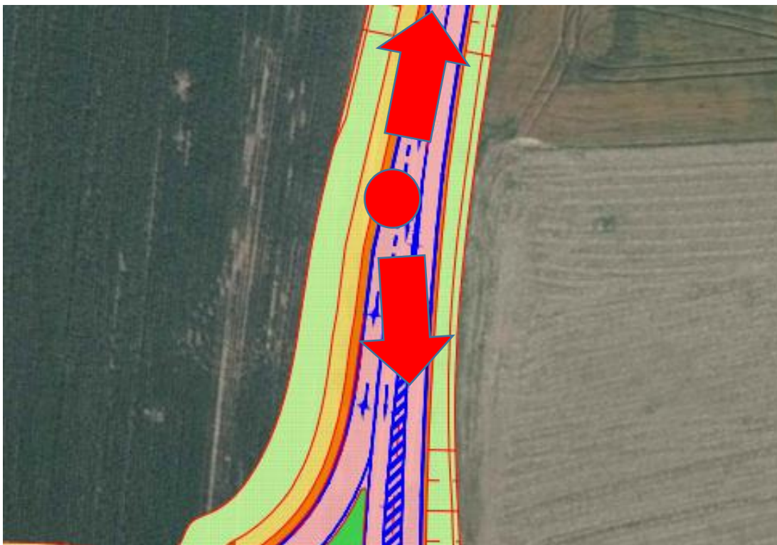
Obr. 14 – Místo vyřazovacího úseku severní stykové křižovatky