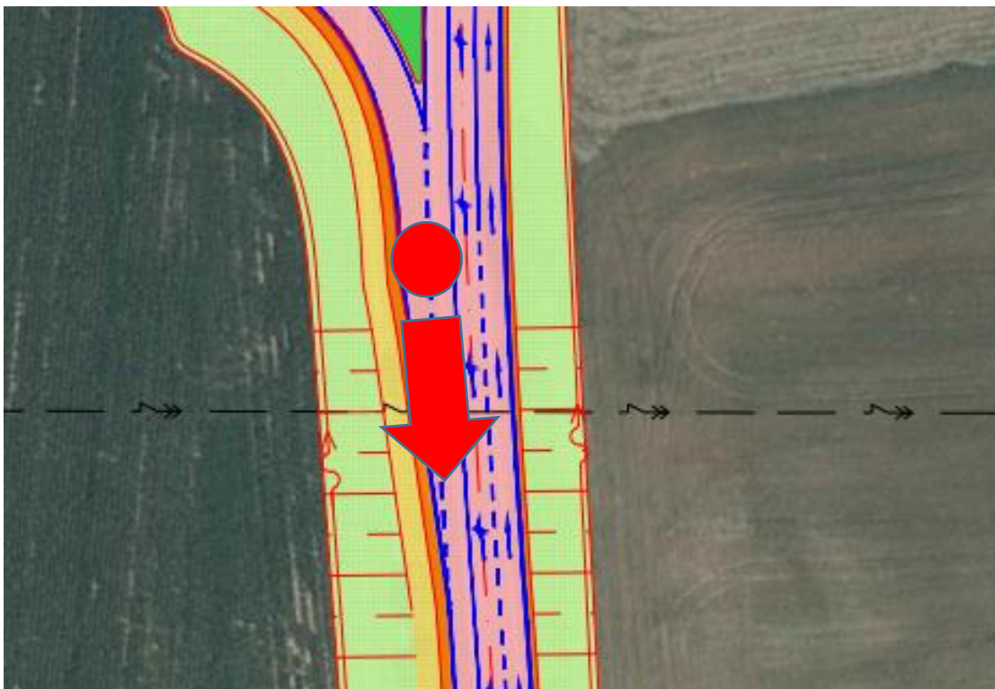
Obr. 12 – Místo připojovacího pruhu severní stykové křižovatky