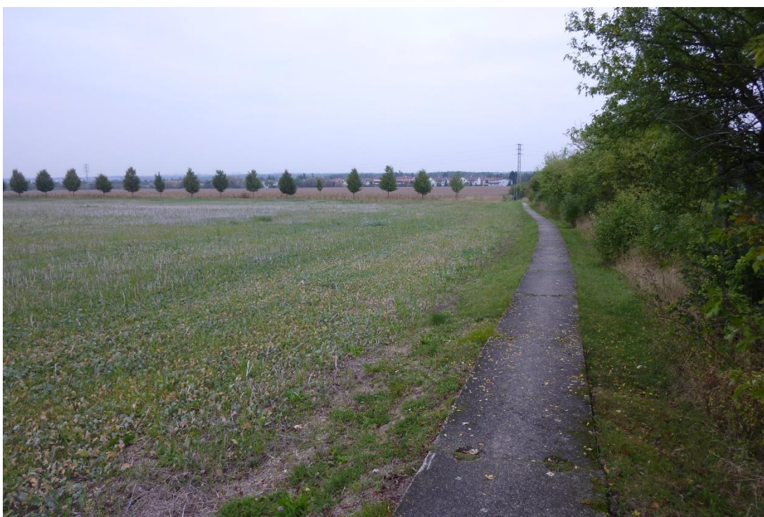
Obr. 4 - Pohled na stezku ve směru staničení silnice III/33313