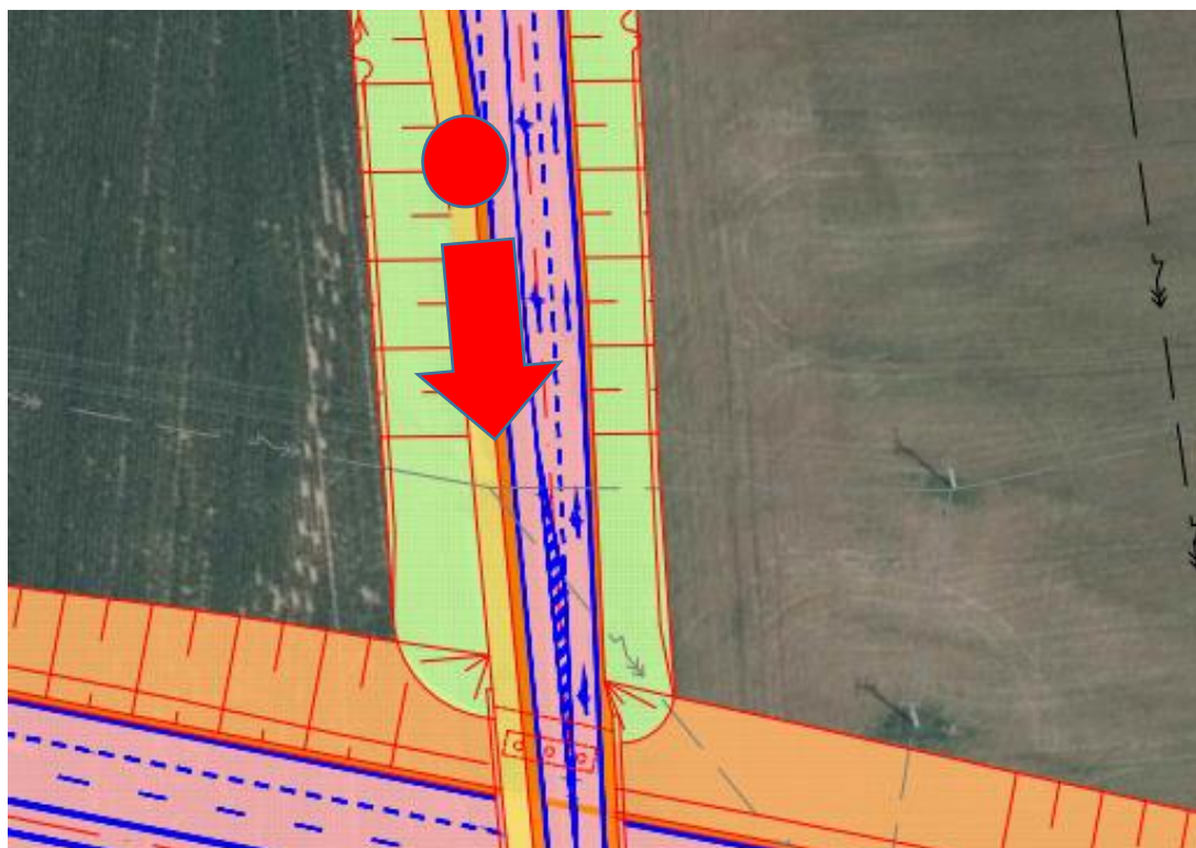
Obr. 10 – Místo konce připojovacího pruhu severní stykové křižovatky