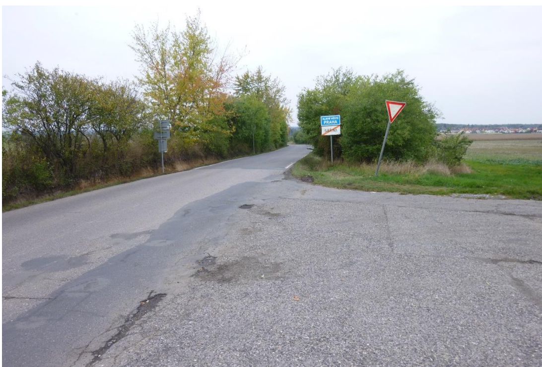
Obr. 2 – Pohled na začátek úseku sil. III/33313 ve směru staničení