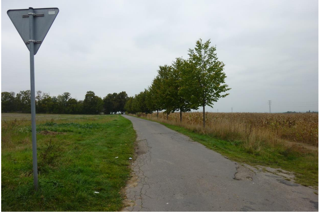
Obr. 8 – Pohled z polní cesty směrem ke hřbitovu