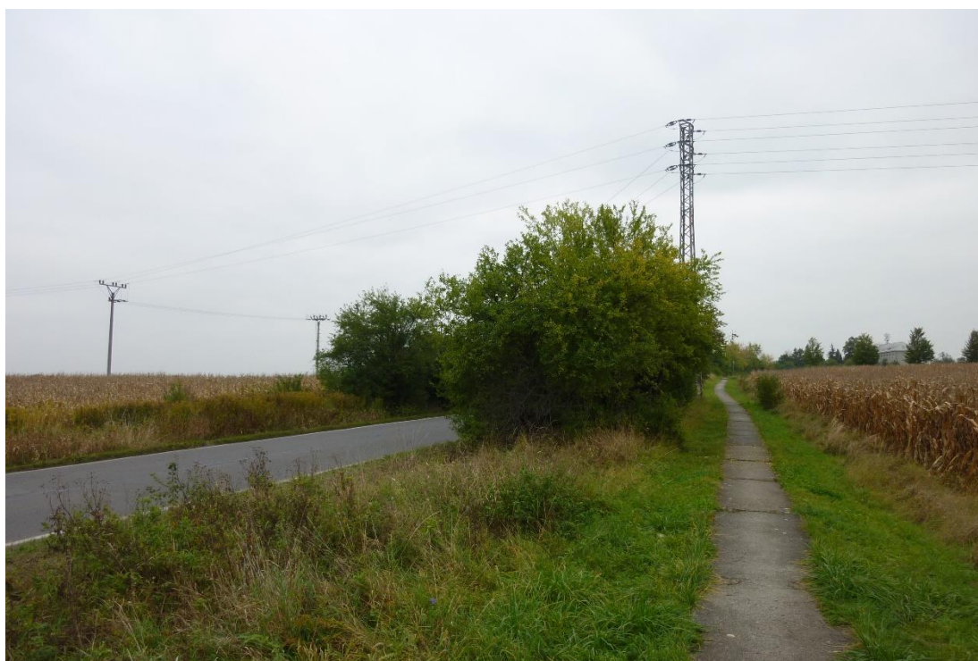
Obr. 11 – Pohled na vedení VN proti směru staničení silnice III/33313