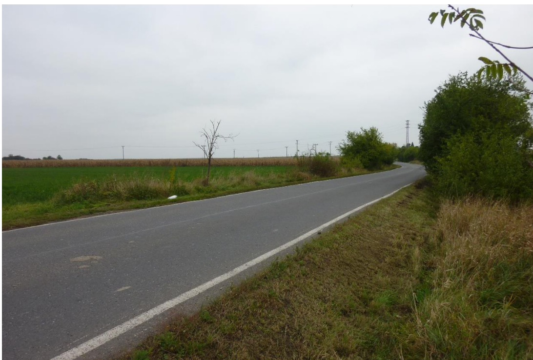
Obr. 15 – Pohled na úsek silnice III/33313 proti směru staničení