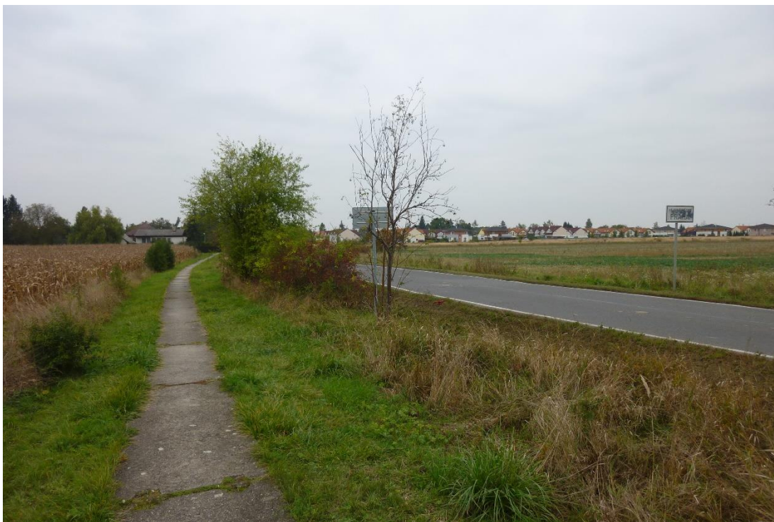
Obr. 16 – Začátek městské části Praha 21