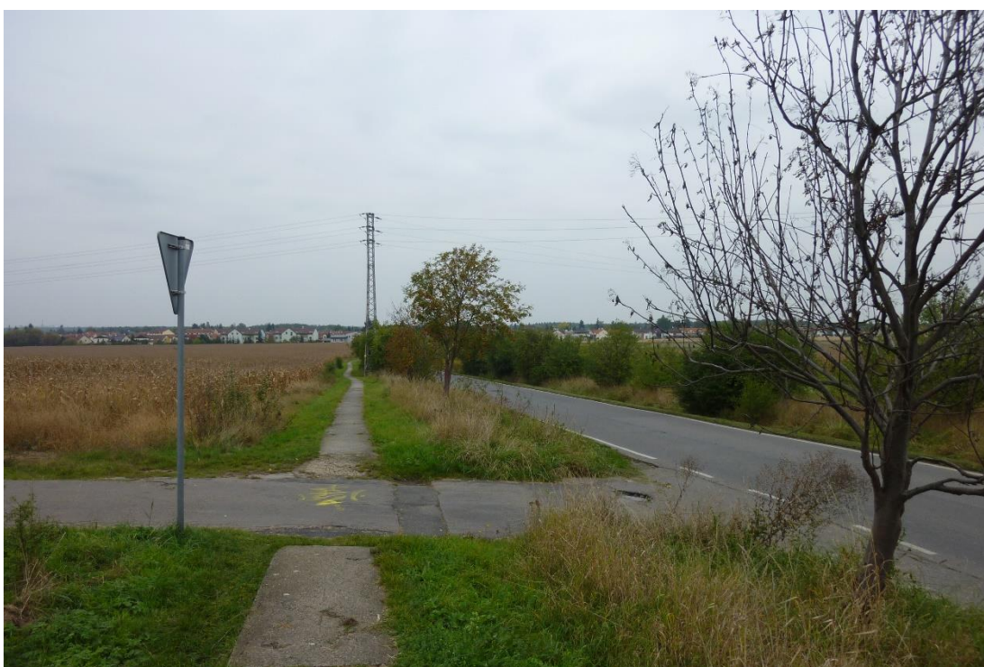
Obr. 7 – Pohled na připojení polní cesty ve směru staničení silnice III/33313