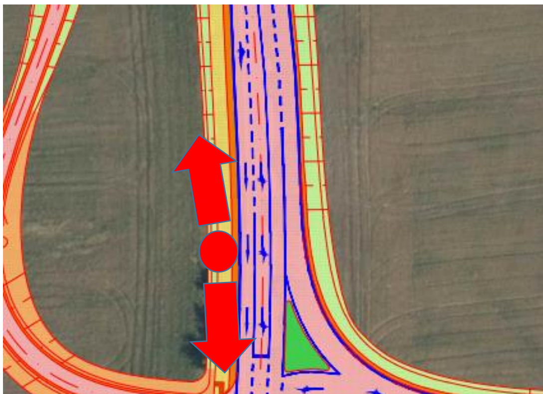
Obr. 3 – Společný pás pro chodce a cyklisty