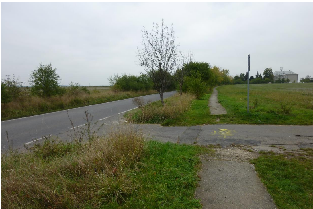
Obr. 9 – Pohled napojení polní cesty proti směru staničení silnice III/33313