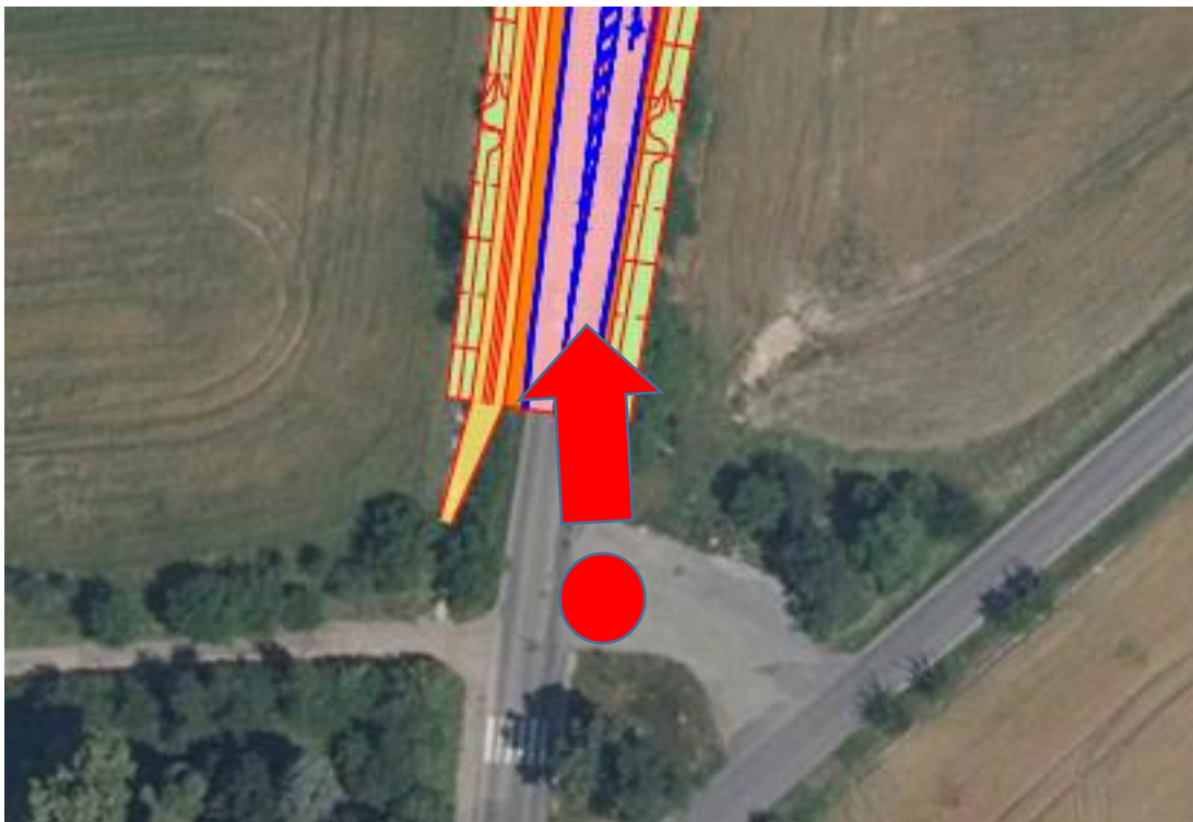
Obr. 1 – Začátek úseku silnice III/33313