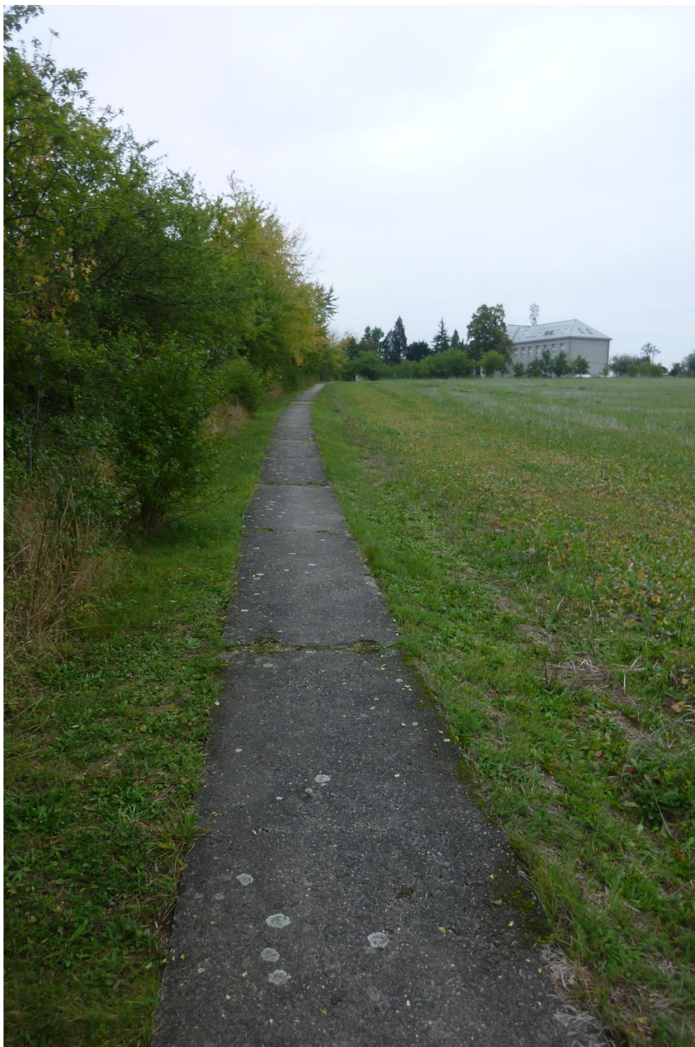
Obr. 5 - Pohled na stezku proti směru staničení silnice III/33313