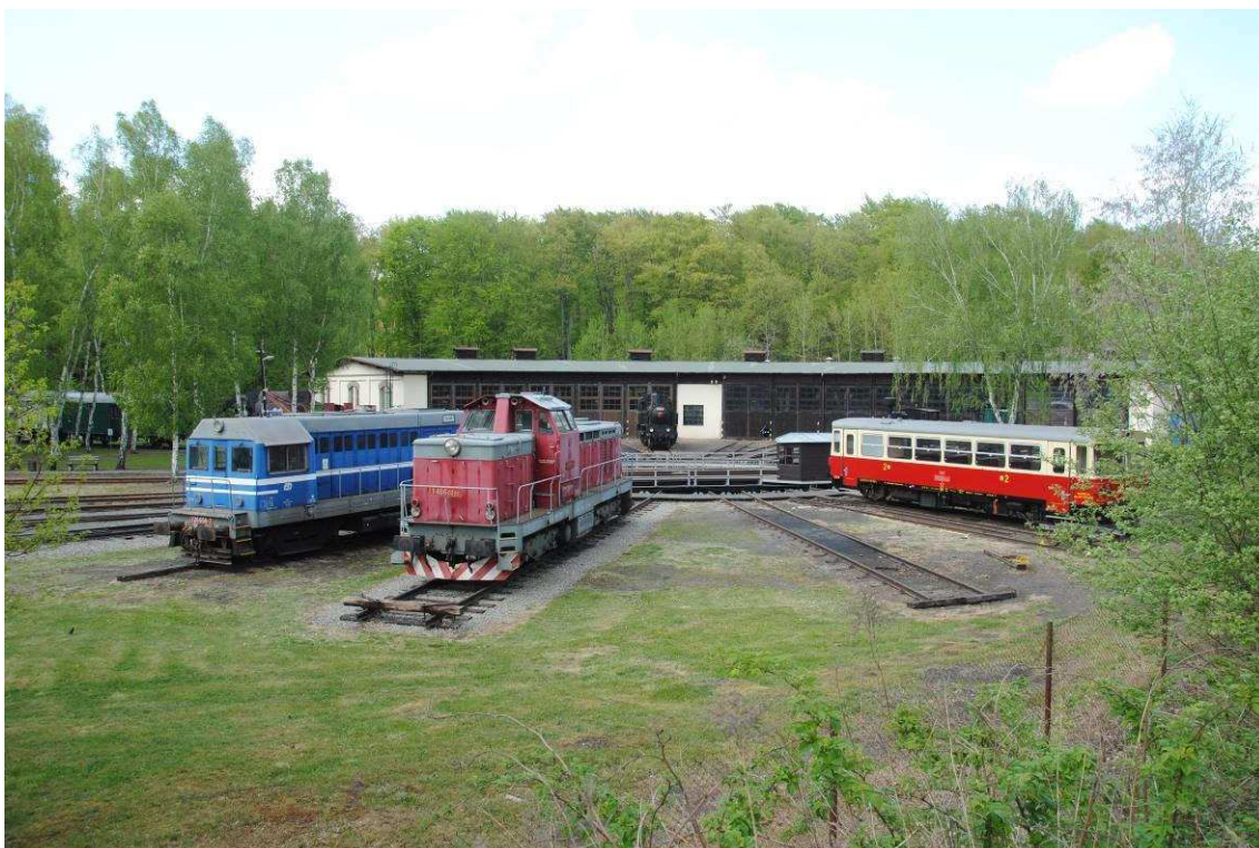
Obrázek 2: Železniční muzeum při pohledu z tratě