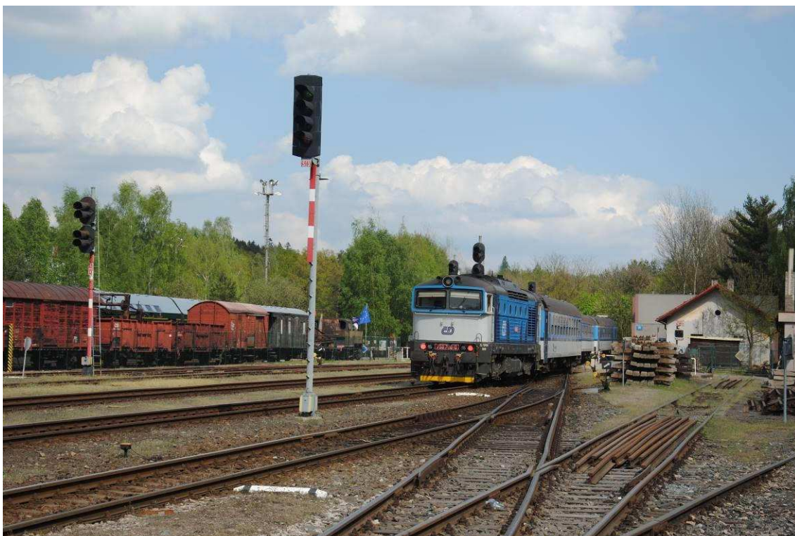
Obrázek 5: Pražské zhlaví s rychlíkem do Prahy, vpravo koleje traťového okrsku