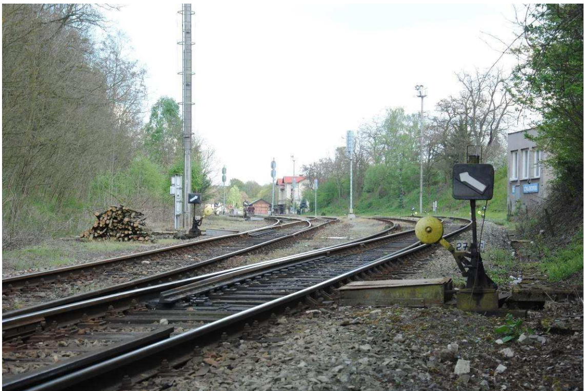
Obrázek 14: Vjezd do stanice od Žatce, výhybka č. 27, patrný je lom nivelety