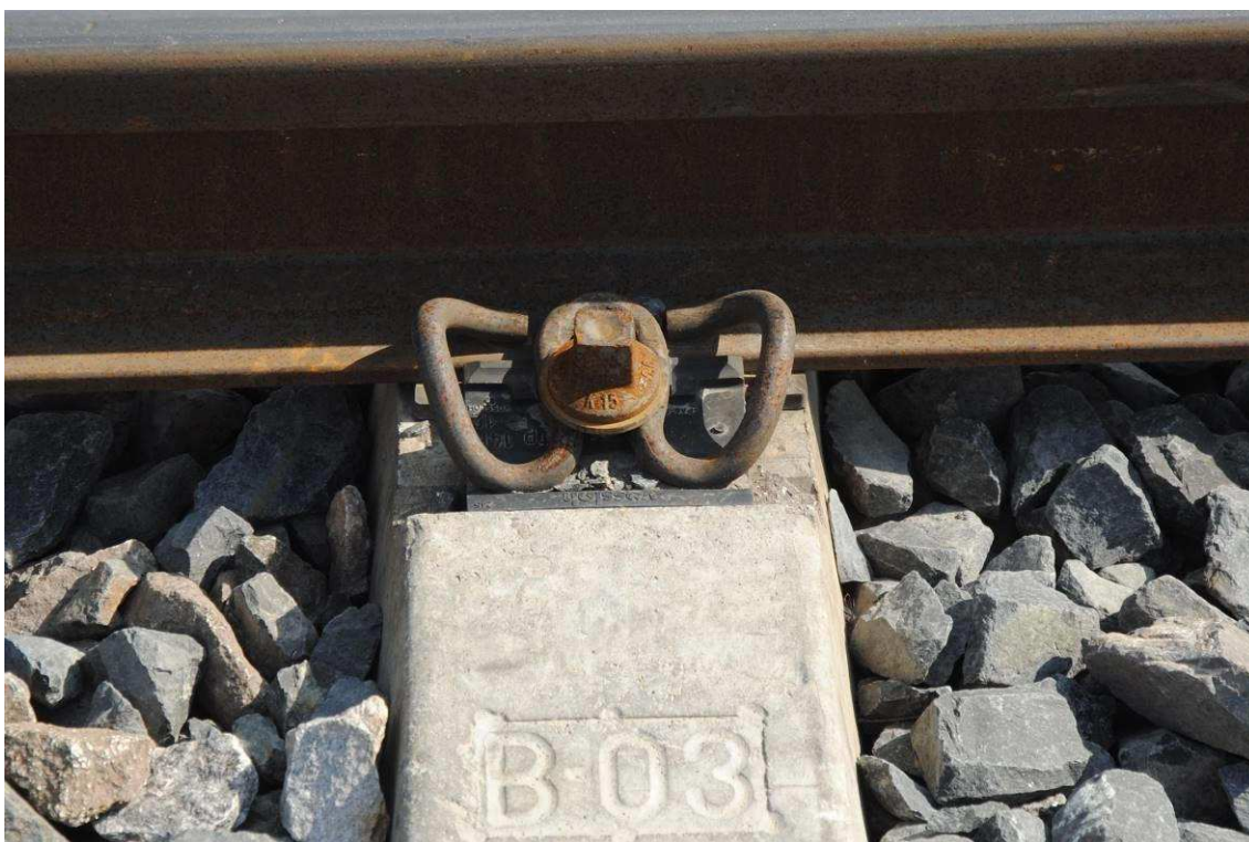
Obrázek 18: Detail upevnění W14 s pružnými svěrkami Sk14 na pražci B 03