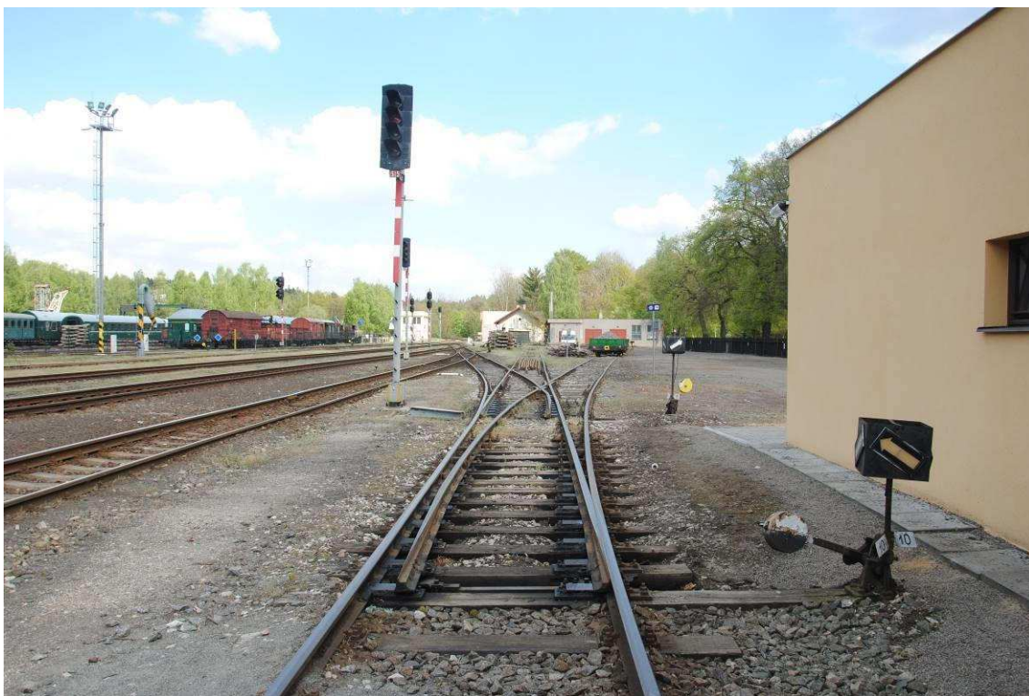
Obrázek 7: Trojcestná výhybka s přestavníky č. 9 a 10