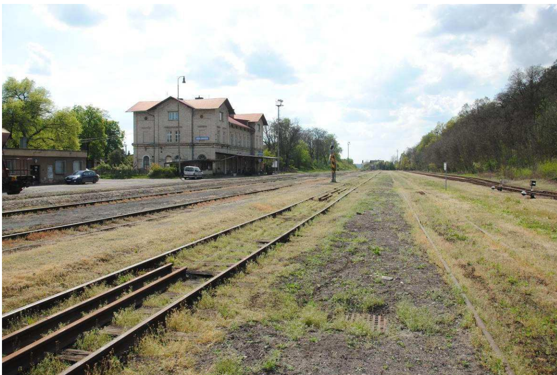
Obrázek 10: Výpravní budova z prostoru mezi kolejemi č. 2 a 4