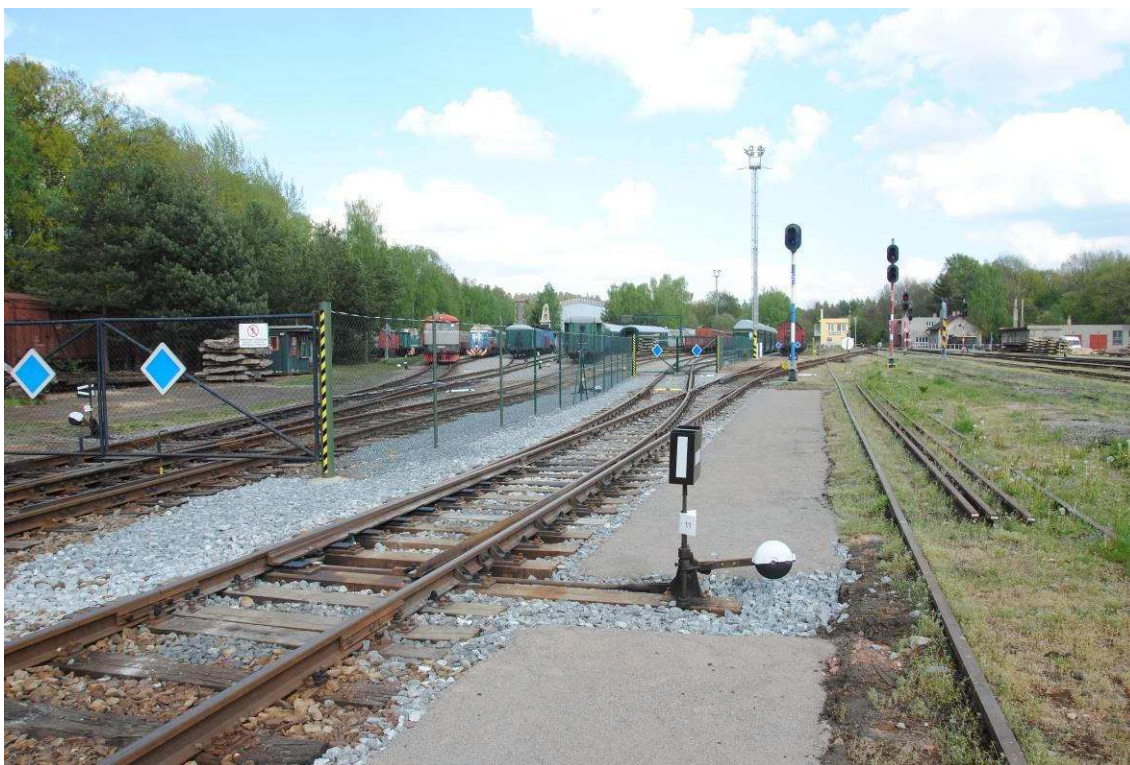
Obrázek 9: Výhybka č. 11 vložená 2 týdny před odevzdáním práce, v projektu není uvažována