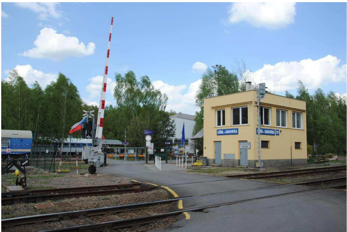
Obrázek 4: Přejezd P42, stavědlo č. 1 a vstup do železničního muzea