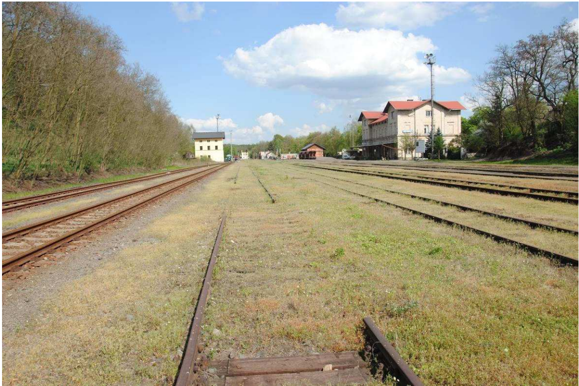
Obrázek 13: Chybějící kolejnice v koleji č. 6