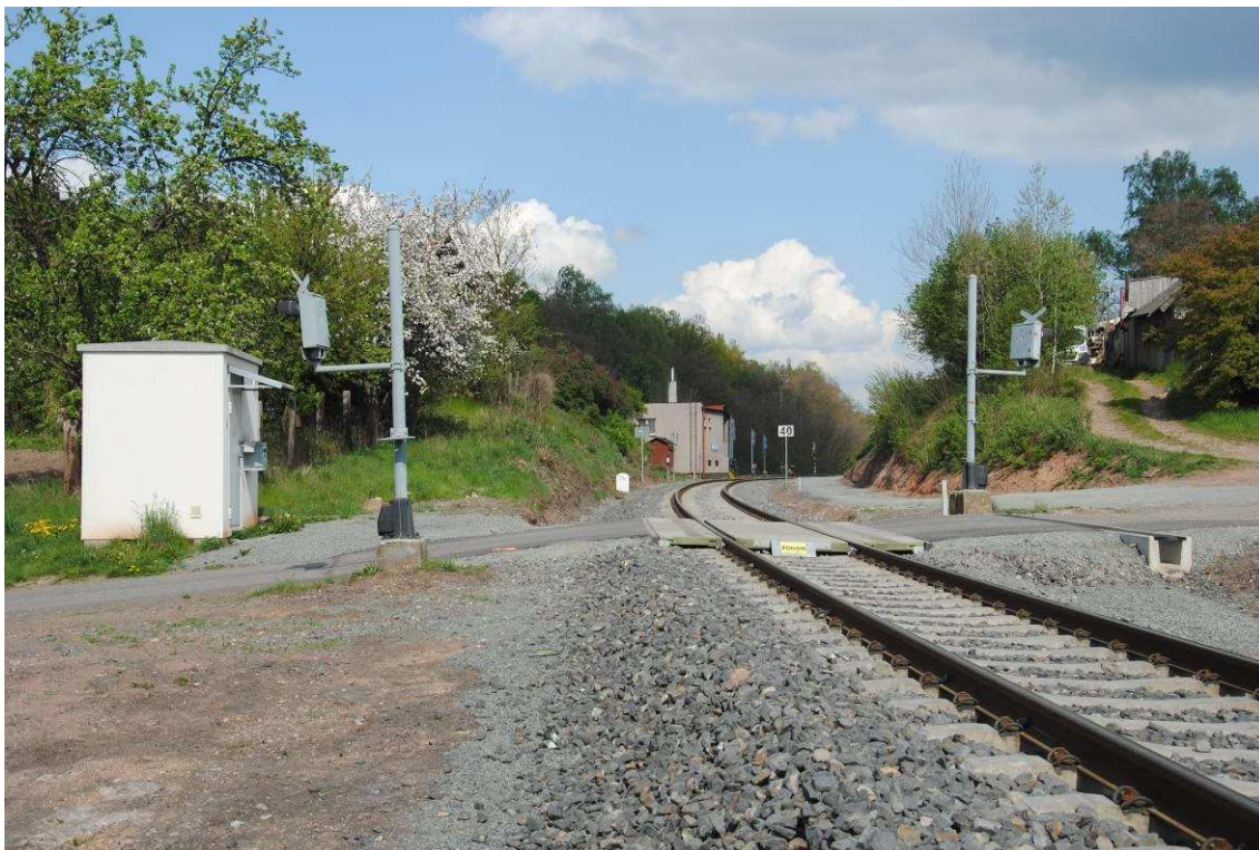
Obrázek 17: Vjezd do stanice od Rakovníka, přejezd P243