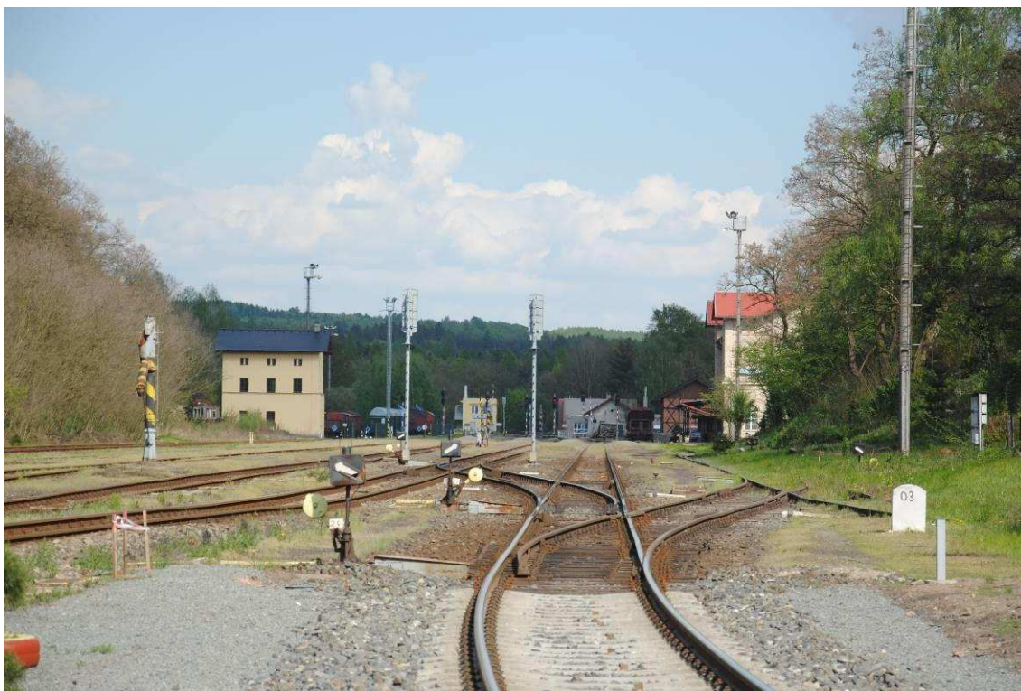
Obrázek 19: Vjezd do stanice od Rakovníka, vpředu výchybka č. 24