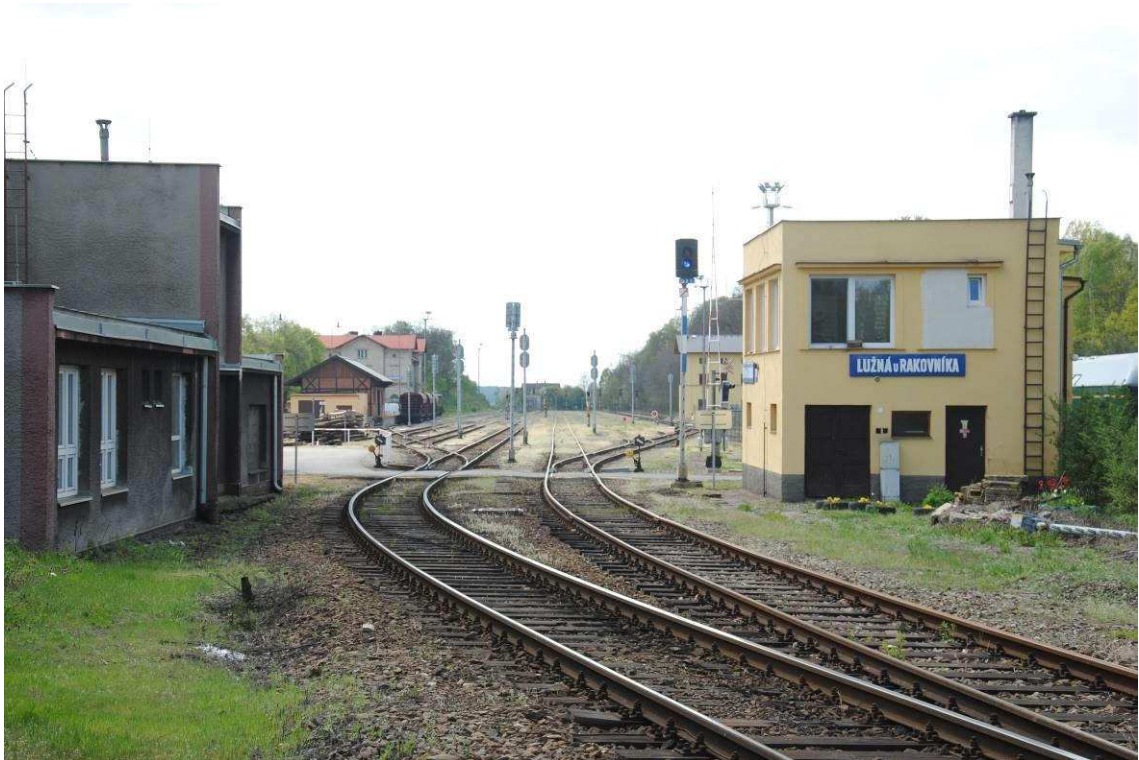
Obrázek 3: Pražské zhlaví stanice a stavědlo č. 1