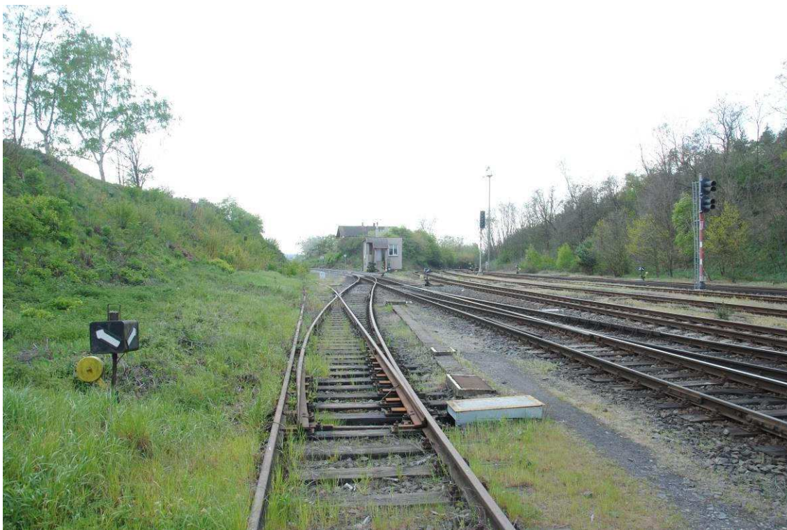
Obrázek 20: Rakovnicko-Žatecké zhlaví, vlevo nepoužívaná kolej č. 7b