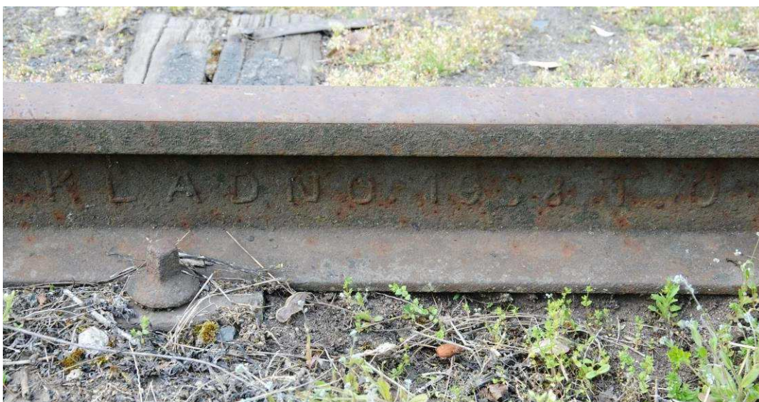
Obrázek 22: Kolej č. 7, patrně nejstarší kolejnice – Kladno 1938, tvar T