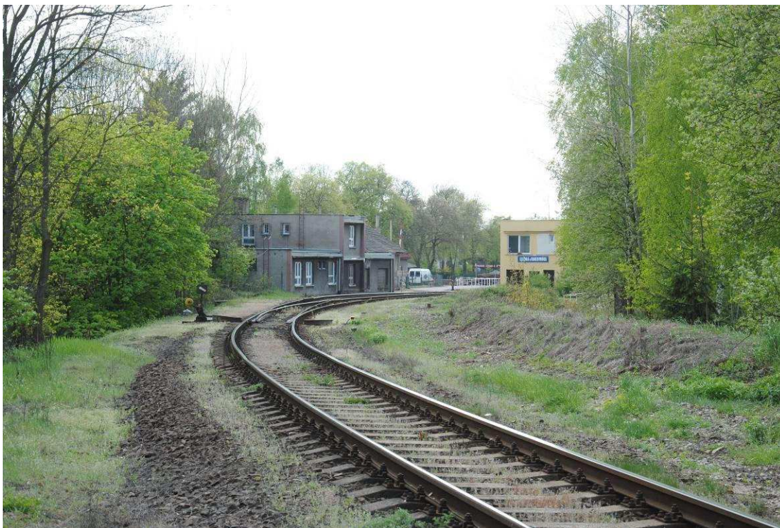
Obrázek 1: Vjezd směrem od Prahy, výhybka č. 1

Fotodokumentace byla pořízena dne 10. 5. 2016 při osobní návštěvě stanice.