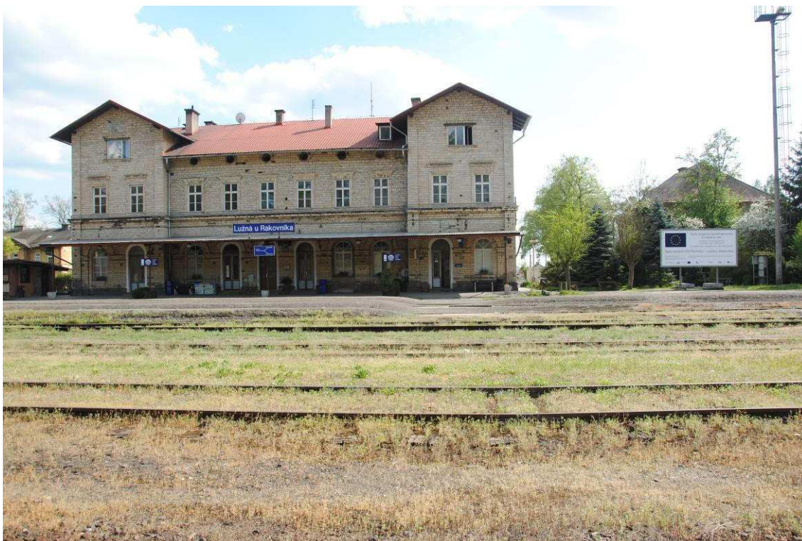
Obrázek 11: Pohled na výpravní budovu v ose navrženého centrálního přechodu