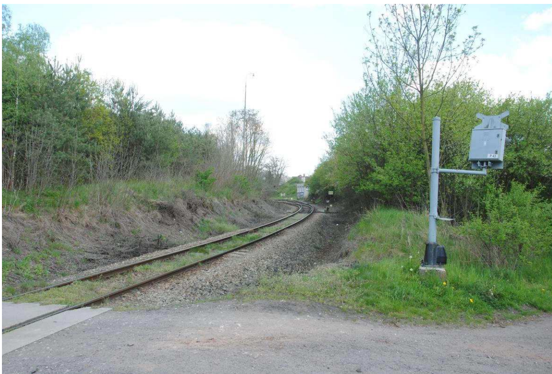
Obrázek 15: Vjezd do stanice od Žatce, přejezd P43