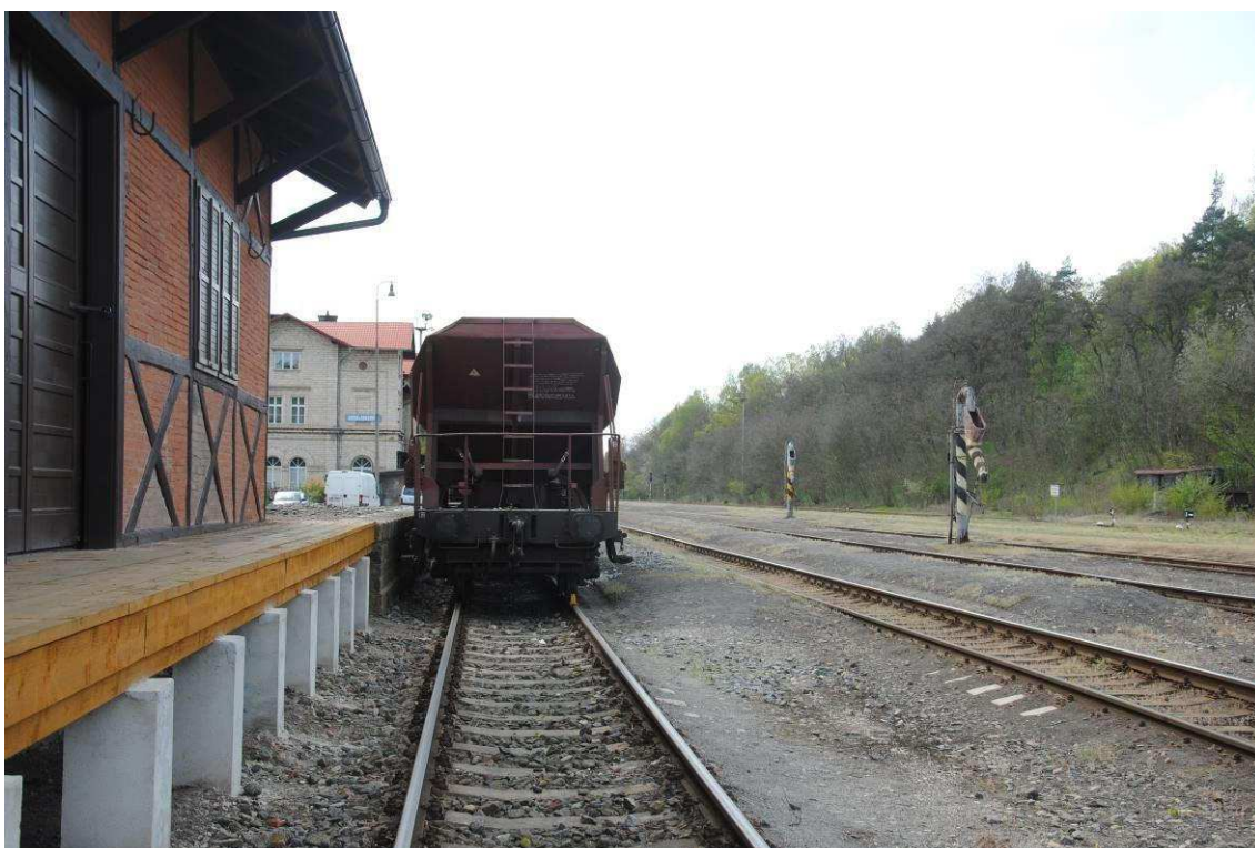
Obrázek 6: Boční rampa u koleje č. 7 s odstavenými vozy