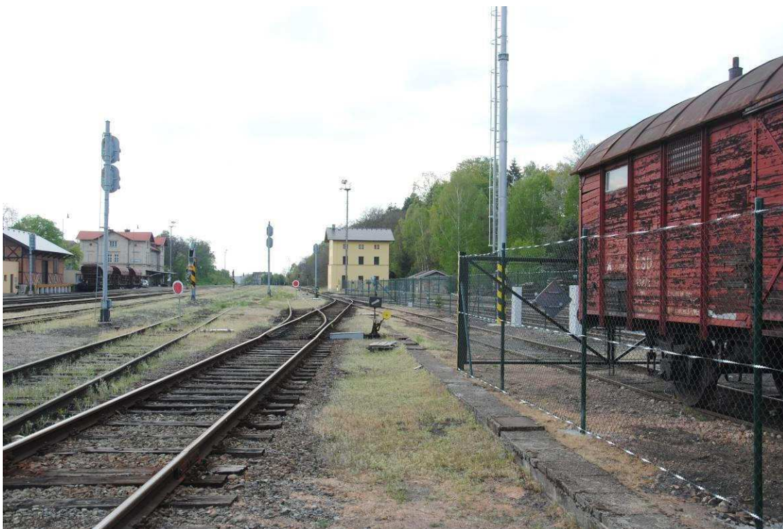
Obrázek 8: Sudá kolejová skupina, vyloučené koleje č. 4 a 6, vpravo areál muzea