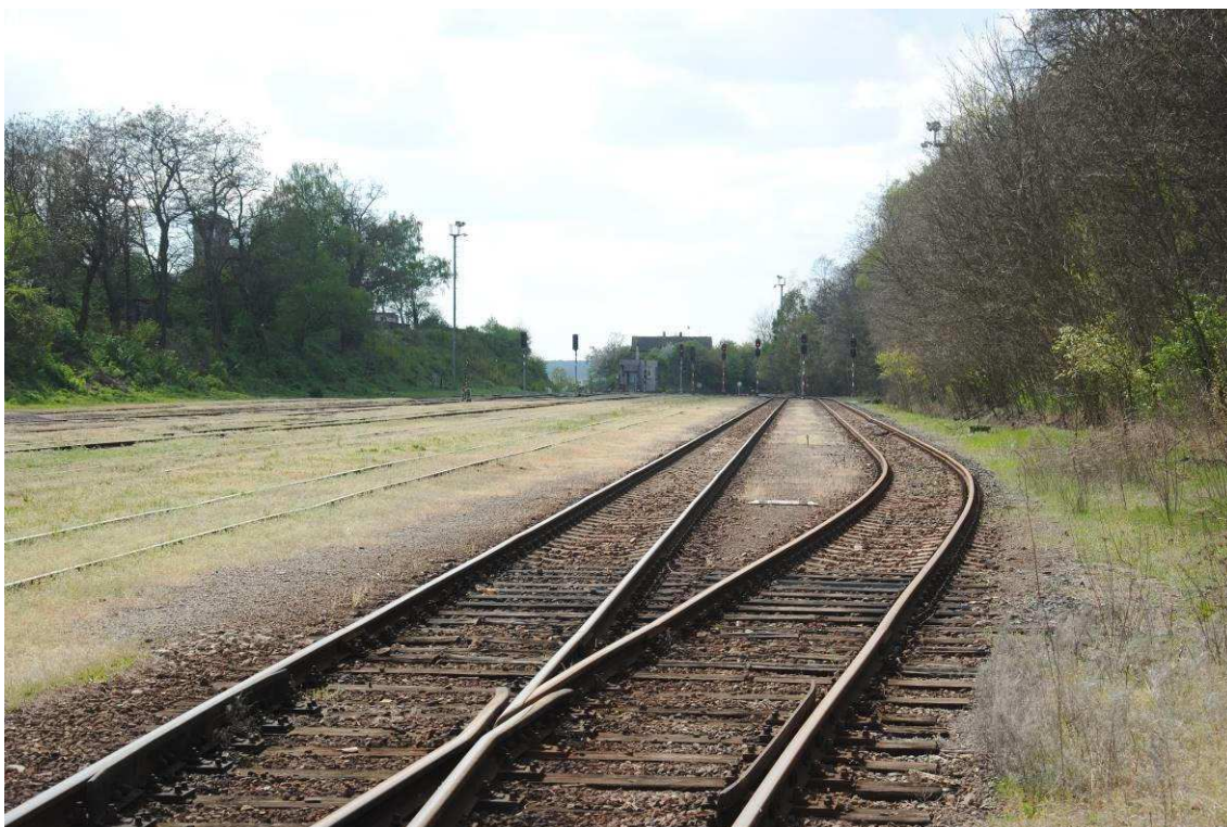
Obrázek 12: Koleje č. 8 a 10 využívané především muzeálními vlaky