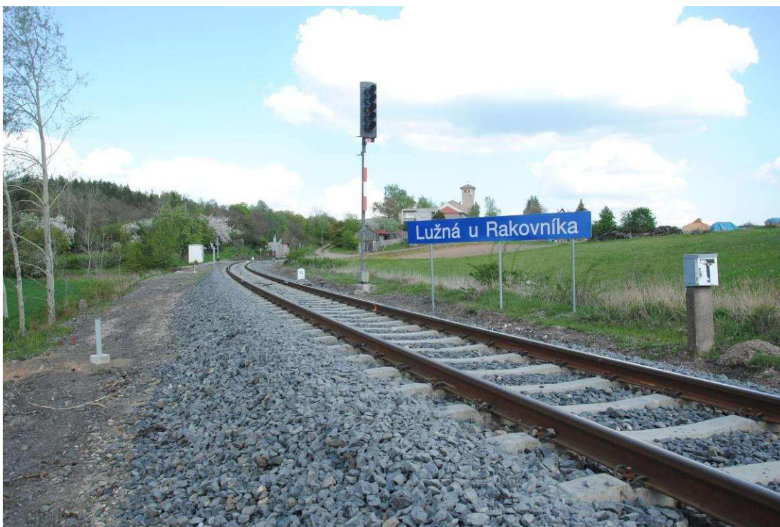
Obrázek 16: Vjezd do stanice od Rakovníka, rekonstruovaná kolej