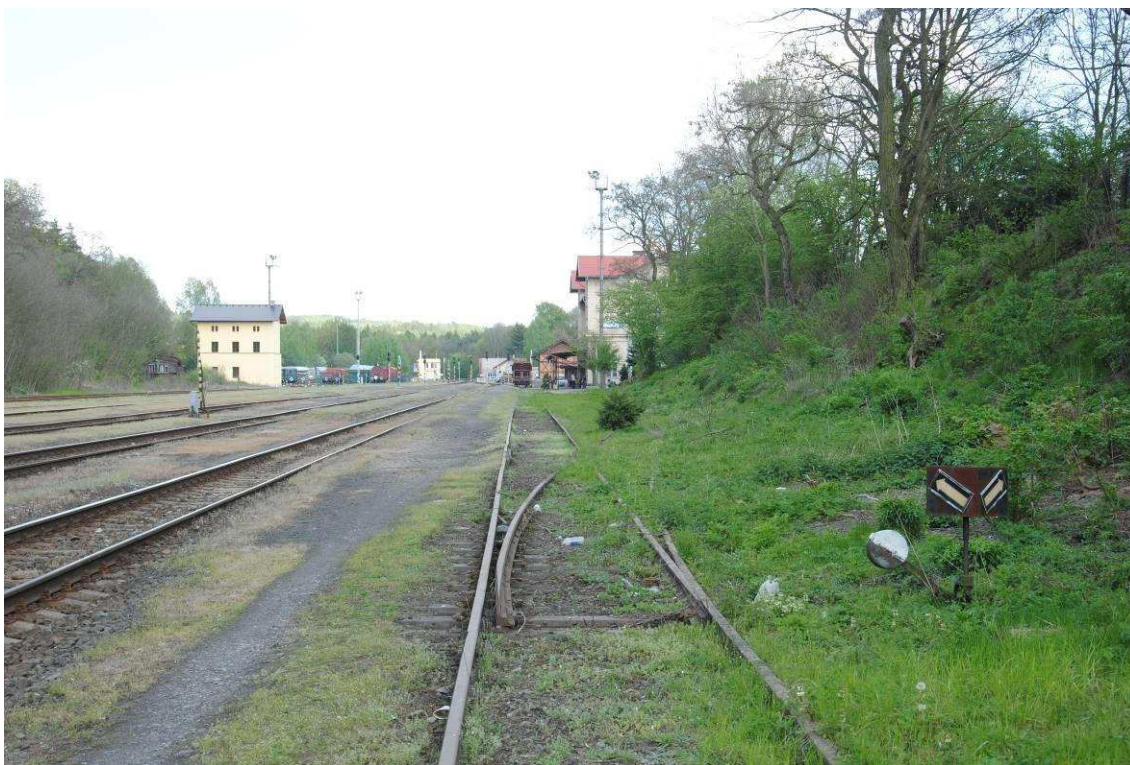
Obrázek 23: Manipulační koleje č. 7 a 9 ve špatném stavu