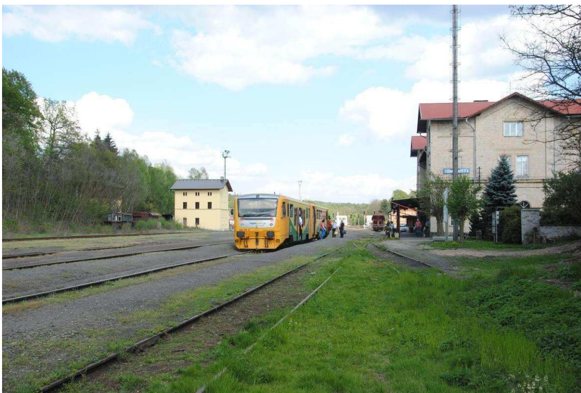
Obrázek 24: Osobní vlak do Kladna na koleji č. 5