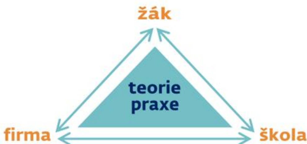
Obr. č. 1 Princip stipendijního program ČéDés

Společnost České dráhy nabízí žákům základních škol a partnerských středních škol Stipendijní program ČéDés. Žák, který podepíše smlouvu o stipendiu, získá během studia finanční podporu. Po absolvování studia se stipendijním programem se žák zaváže nastoupit do firmy České dráhy a pracovně zde působit minimálně po dobu 5 let. Společnost mu zajistí jisté pracovní místo odpovídající jeho kvalifikaci. Stipendijní program je prioritně nabízen žákům 9. ročníku základních škol. Kromě nich se mohou do stipendijního programu přihlásit také žáci 1., 2. a 3. ročníku, kteří již na partnerské střední škole vybraný maturitní obor studují. Společnost České dráhy tak podporuje studium a rozvoj odborných dovedností žáků, kteří mají zájem uplatnit se v profesi zaměřené na železniční dopravu. Jak dokládá obrázek 1 přejatý z webových stránek společnosti České dráhy, uvědomuje si tento národní dopravce, jak je důležité spojení teorie a praxe na základě spolupráce firmy a školy prostřednictvím odborné spolupráce a podpoře a motivaci konkrétního žáka.