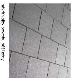
návrh volby povrchu pěší zóny

Příčný řez profilem pěší zóny - Kaprova ulice současný stav: cca 20 m široká komunikace, z toho cca 12 m pro IAD, silná pěší vazba náměstí Jana Palacha - Staroměstské náměstí návrh: vytvoření pěší zóny s povoleným výjezdem cyklistů, výrazné zlepšení kvality vazby Staroměstské náměstí - náměstí Jana Palacha - Klárov - Pražský hrad pro bezmotorovou dopravu doplnění: možné vytvořit koridor pro průjezd cyklistů, volba optimálního povrchu, zeleně, mobiliář, osvětlení