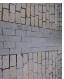
návrh volby povrchu pěší zóny s úpravou pro provoz cyklistů