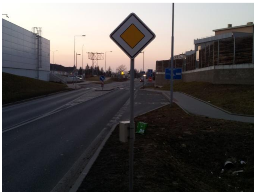
Obr. 1 - Umístění statistického radaru před přechodem, "u křižovatky"