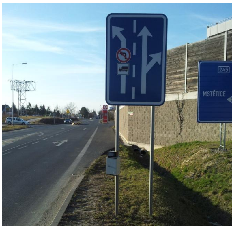
Obr. 2 - Umístění statistického radaru u přechodu pro chodce