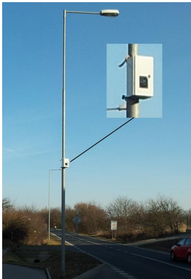
Obr. 3 - Umístění videodetekce na sloupu VO