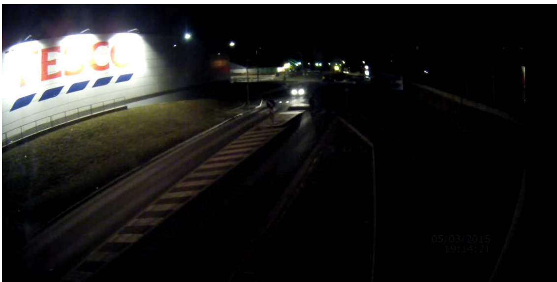
Obr. 7 - Špatně identifikovatelný výskyt chodce na neosvětleném přechodu