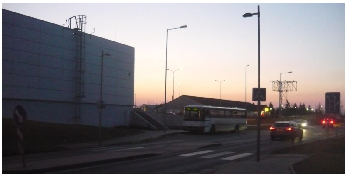
Obr. 8 – Zastavení autobusu před přechodem pro chodce