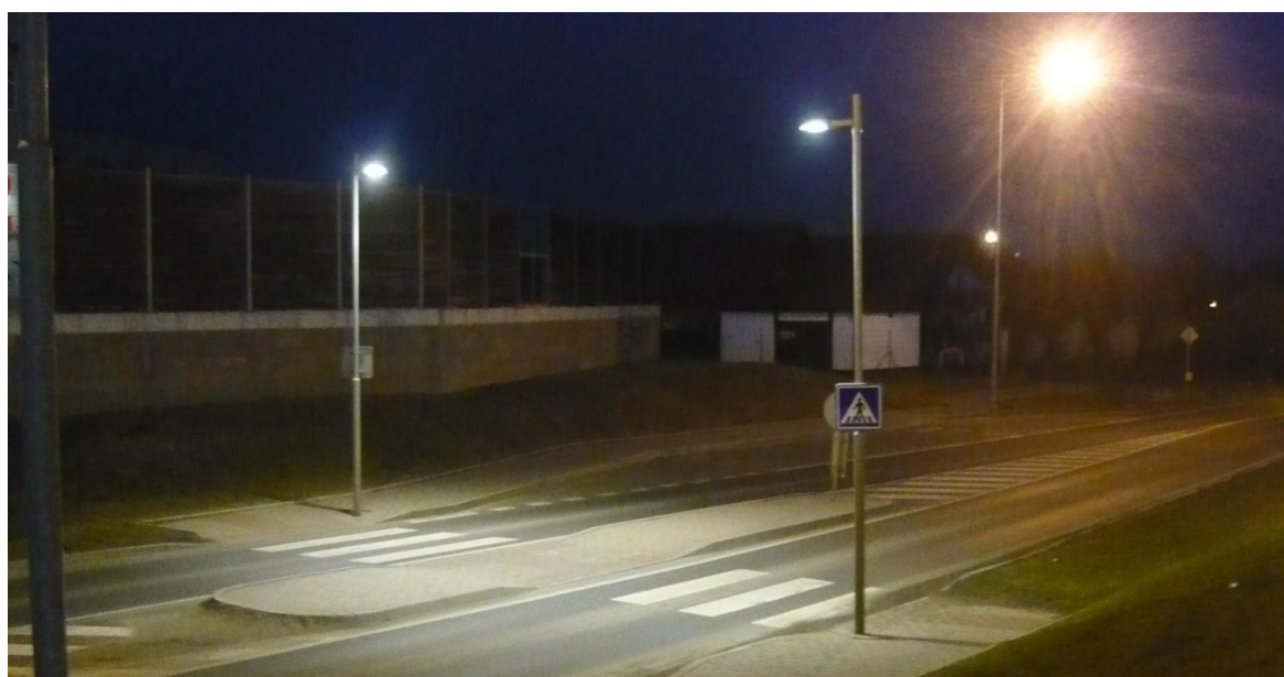
Obr. 4 - Svítidlo s vysokotlakou halogenidovou výbojkou