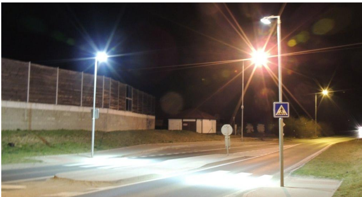
Obr. 5 - Svítidlo s LED