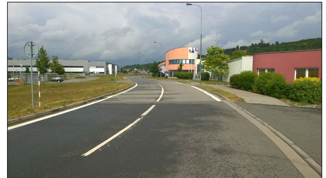
Navazující úsek místní komunikace Jaktáře