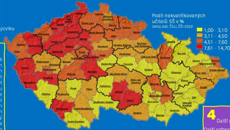
Podíl nekvalifikovaných učitelů ŠŠ v %

In the profession of a vocational training teacher and practical teaching, the type of further education has two directions, which are interconnected. One direction is expertise in their profession, the other direction is pedagogical competence. The theoretical part of the bachelor's thesis aims to process and comprehensively present the prescribed and required qualifications and competencies from both directions. It also lists and analyzes legislative requirements that need to be met to perform the teacher of vocational training and practical teaching, and also determines what salary classification these teachers belong to. In the practical part, a qualitative survey was conducted using the method of semi-structured interview with the aim of finding out what view and attitude to further education has a selected group of surveyed teachers. The investigation took place at two secondary vocational schools of technical focus in the Karlovy Vary region. Partial goals were to find facts that help them or hinder further development of education and whether there is an effort to support further education from the school management and school institutions. Based on the facts found and the hypotheses set, a conclusion is formulated with a practical proposal and recommendation for improving the possibilities for further education.