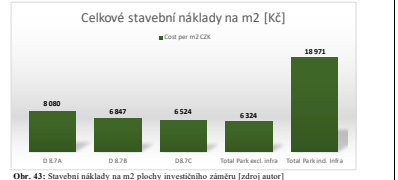
Obr. 43: Stavební náklady na m2 plochy investičního záměru