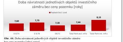
Obr. 44: Doba návratnosti jednotlivých objektů investičního záměru bez ceny pozemku