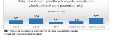
Obr. 45: Doba návratnosti jednotlivých objektů investičního záměru včetně ceny pozemku