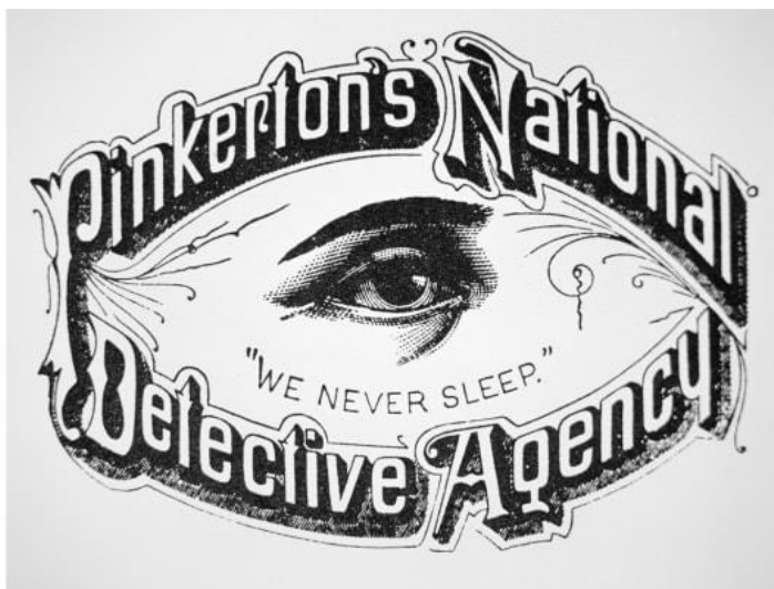
Obrázek 1 - Logo Pinkerton's National Detective Agency. Zdroj: HISTORY. "10 Things You May Not Know About the Pinkertons." [online]. [cit. 4. ledna 2023]. Dostupné z: https://www.history.com/news/10-things-you-may-not-know-about-the-pinkertons

Jedním z nejznámějších úspěchů této společnosti je bezpochyby záchrana tehdejšího amerického prezidenta Abrahama Lincolna. Allan v roce 1861 vyšetřoval fámy o spiknutí jižanských přívrženců, které mělo sabotovat železnici a pokusit se o atentát na prezidenta. Tehdy Lincolna Pinkerton varoval, ten do vlaku nenasedl, a tedy nedojel do Baltimoru, kde měl celý atentát proběhnout [18].