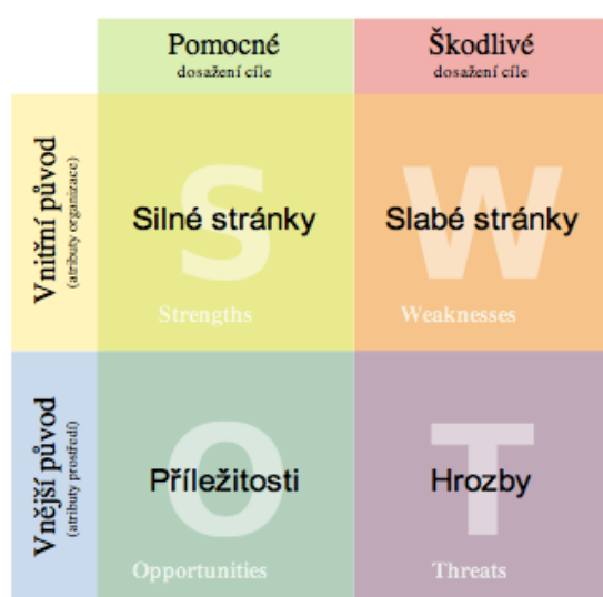
Obrázek 7 - SWOT analýza.

SWOT analýza je metoda, která se využívá k získání nových poznatků a k následné interpretaci výsledků. Tato analýza pracuje na základě interních původů (silné a slabé stránky), dále pak na základě externích původů (příležitosti a hrozby) u zkoumaného jevu. Zde byla použita na analýzu procesu výběru soukromých bezpečnostních služeb na základě stanovených kritérií, které jsou rozhodující a relevantní při výběru těchto služeb [55].