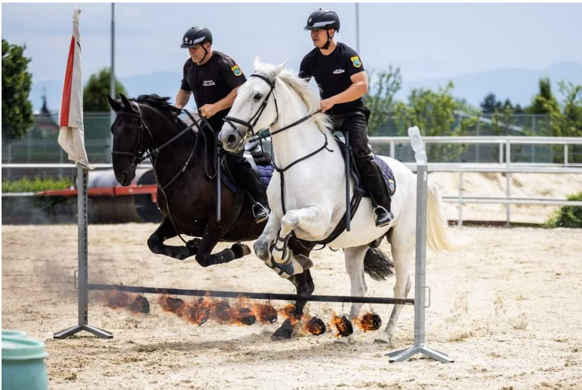
Obrázek 5: Překonání ohně [42]

strážníkovu práci s obuškem, kdy jezdec sráží obuškem v úzké uličce plastové lahve. Poslední dovedností je vytlačení davu, která se provádí ve skupině alespoň dvou koní. I když koně u MP neslouží jako donucovací prostředek, toto cvičení slouží k posílení sebevědomí koně a snižuje stresovou zátěž. Do konce druhého roku výcviku by se mladí koně v neohrazeném prostoru, z důvodu polekání či způsobení nehody, neměli zúčastňovat večerních a podvečerních akcí (lampiónové průvody, akce s hlasitou hudbou nebo s pyrotechnikou). [38]