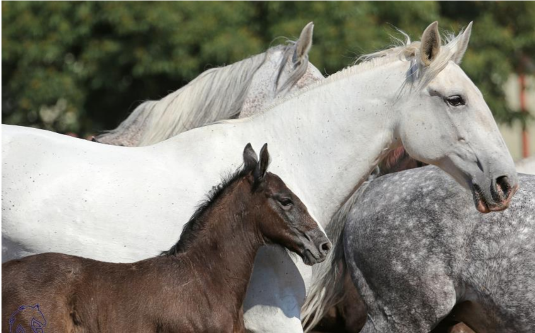
Obrázek 3: Starokladrubská klisna se svým hříbětem [31]

Od roku 1979 patří toto plemeno na seznam světového kulturního dědictví UNESCO. [25; 28; 29; 30]