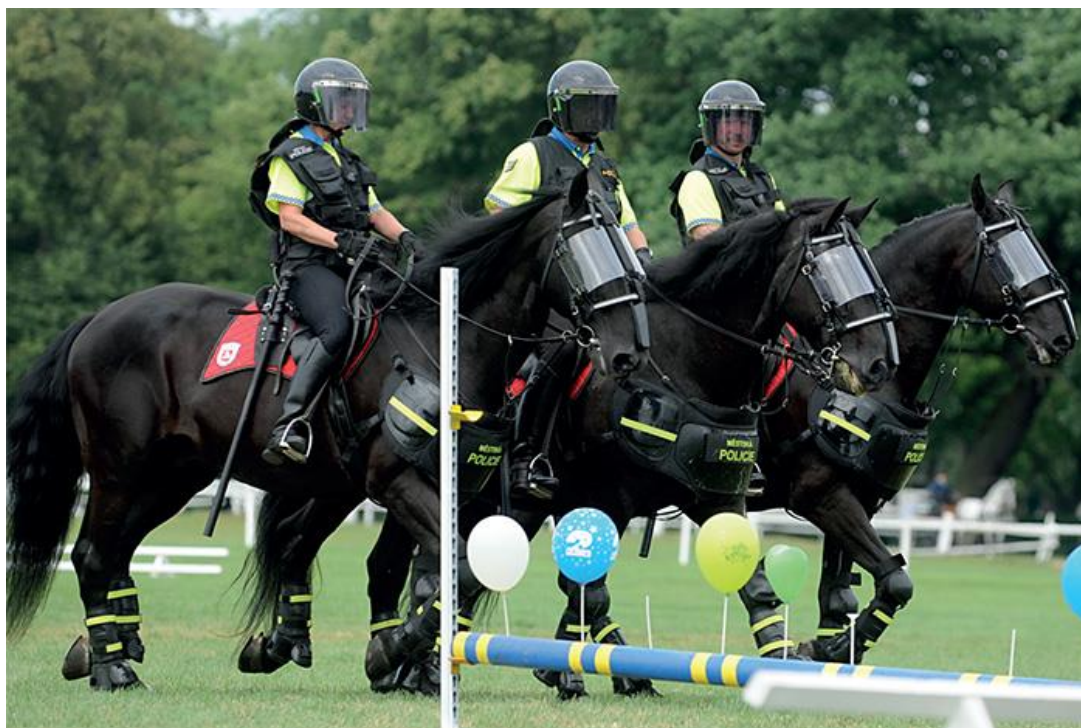
Obrázek 6: Služební ochranná výstroj [43]

Vybavení jezdců a koní závisí na daném druhu práce. Vybavení, které bude mít dvojice k dispozici, bude jiné u výcviku a jiné při hlídkové činnosti. Výstroj koně se liší dle jeho stavby těla. Základní výstroj koně by měla obsahovat chrániče šlach, zvony, podsedlovou deku, jezdecké sedlo s podbřišníkem a uzdečku včetně příslušenství, popřípadě další ochranné prvky. Do základního vybavení jezdce patří jezdecká přilba, stejnokroj nebo pracovní oděv, jezdecké kalhoty zvané rajtky, speciální obuv uzpůsobena pro jízdu na koni, rukavice a bičik. Při výcviku mladých koní nebo u skokového výcviku by jezdcům neměla chybět bezpečnostní vesta, naopak při hlídkové činnosti by měl mít jezdec k dispozici služební zbraň, služební obušek, pouta atd (viz obrázek 6). [4; 25]