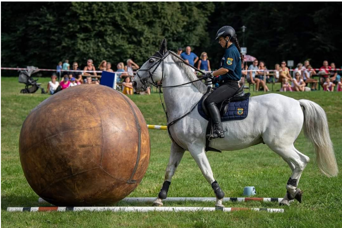
Obrázek 4: Tlačení pushballového míče [41]

pro posílení zádového svalstva. Koně by měli být schopni po roce výcviku zvládnout překonat různé neobvyklé povrchy (papírové či igelitové tašky), pohánět pushballový míč v kroku nebo klusu (viz obrázek 4), být v klidu při různých zvukových podnětech (houkání, trubení, křičící dav nebo hlasitá hudba). Kůň by měl v klidu plnit úkoly s jezdcem, který nese vlajku, procházet mezi překážkami a následně dokázat prorazit stěnu z plastových sudů. V neposlední řadě by měl projít či stát v průchodu z fátorů a chodit se zkušenějším koněm v městském provozu. Zbylé dovednosti by měly být v procesu seznamování nebo rozpracování. [38; 39]