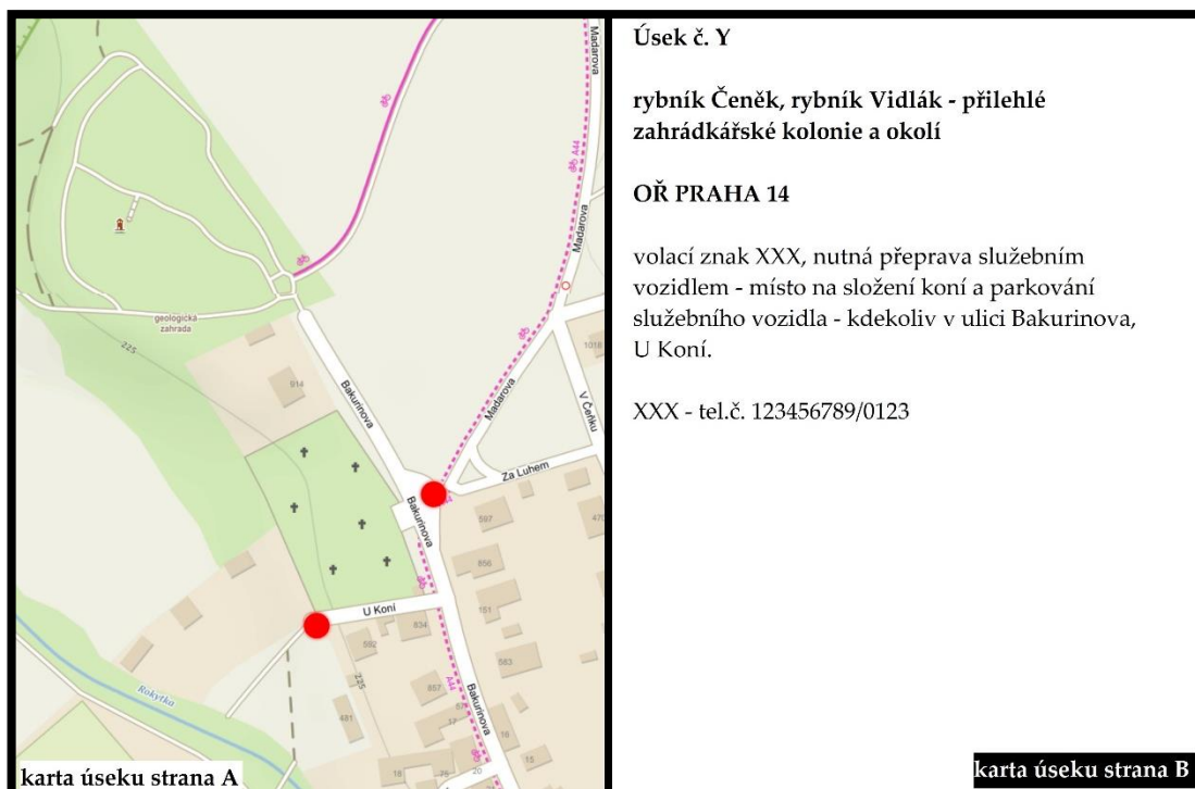
Obrázek 8: Jeden z úseků, kde JS vykonává hlídkovou činnost

Pracovní den začíná nástupem do práce, který je v 6:30. Strážníci nejprve nakrmí služební koně a zkontrolují jejich zdravotní stav. Pokud je vše v pořádku, dva koně se připraví na hlídku a zbytek je odveden do výběhů. Dopolední hlídka vyráží na svůj daný úsek v časovém rozmezí od 9:00 do 11:00. V době, kdy hlídka objíždí daný úsek, zbytek strážníků se postará o vyčištění boxů, popřípadě vezmou koně, na kterého přišla řada, na trénink, ať už na jízdárnu nebo do haly, ve které se jezdí převážně v zimě. Hala se nachází mimo zázemí JS, proto se musí koně přepravit služebním automobilem, do kterého se vejdou dva služební koně. Po návratu hlídky proběhne výměna koní. Koně, kteří byli na hlídce, jdou po ošetření do výběhu a ti z výběhu se připravují na hlídky. Odpolední hlídky jsou dvě, tzn. čtyři koně, kteří po dvojicích projdou dva další úseky. Hlídkování se za celý den zúčastní šest koní, sedmý kuň má ten den volno. Tím, že je koní u JS OŘ Praha 11 přesně sedm, vychází každému koni volno v jeden určitý den, který většinou stráví venku na čerstvém vzduchu. Odpolední hlídka má na daný úsek časové rozmezí od 14:00 do 16:00. Po návratu opět proběhne čištění koně, které proběhlo i před nasedláním do hlídky. Poté mají strážníci asi do 18:00 čas