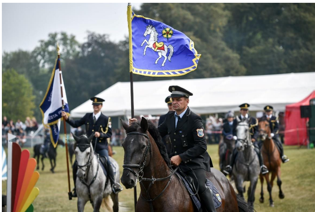
Obrázek 7: Slavnostní nástup jezdců [49]

Jízdní jednotky městské policie mají pravidelné tréninky, např. na střelnici, v tělocvičně, v autoškole nebo přímo na koni, ať už v terénu nebo na jízdárně. Dále se účastní různých akcí a událostí, kde dohlíží na samotnou akci a zajišťují tak veřejný pořádek. Konají preventivní činnosti ve školách, pořádají dny ukázek policejního výcviku, kde veřejnosti ukazují náplň jejich práce a dovednosti koní. Účastní se také Mezinárodního policejního mistrovství ČR v jezdeckví, které je pod záštitou policejního prezidenta, kde se konají limitní skokové derby, soutěž o skok mohutnosti a policejní parkur, kde je přiblížen policejní výcvik (skok přes oheň, střelba na terče atd) nebo každoročního Mezinárodní setkání jízdních policií v Ostravě (viz obrázek 7), kde se soutěží v cross-parkuru, v zrcadlovém skákání a v policejním parkuru. [38; 47; 48]