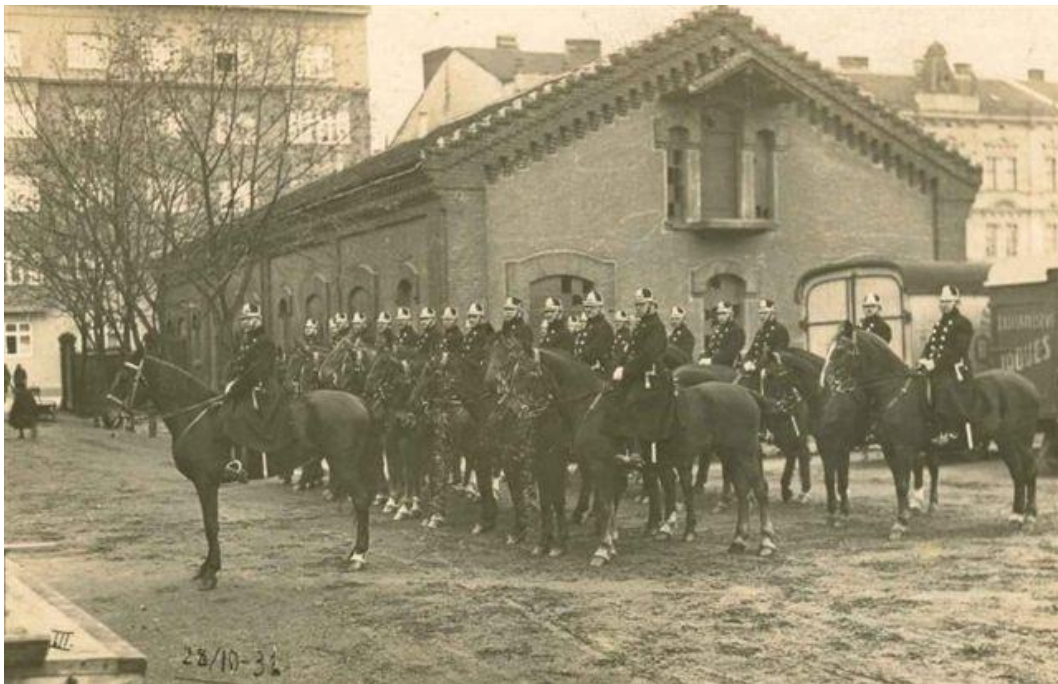
Obrázek 2: Příslušníci jízdního oddílu sboru uniformní stráže bezpečnosti v roce 1931 [18]

z bývalé monarchie, což zahrnovalo jak četnictvo, tak i částečně pěší a částečně jízdní policii (viz obrázek 2). V Praze působili policisté na koních v rámci policejního ředitelství a v Bratislavě byly založeny dva jízdní oddíly. Během druhé světové války spadaly jízdní jednotky pod armádu, avšak v poválečném období se koně v bezpečnostních složkách již příliš neuplatnili. Výjimkou byly hranice, kde koně používala pohraniční stráž až do poloviny 60. let. Poté jízdní policie upadá. Ke znovuoživení jízdní policie v ČR došlo v roce 1991 v Praze, následně vznikaly další státní jízdní jednotky ve velkých městech např. v Brně a Zlíně. V roce 2020 byla zřízena jízdní jednotka i v Liberci. [14; 15; 16; 17]