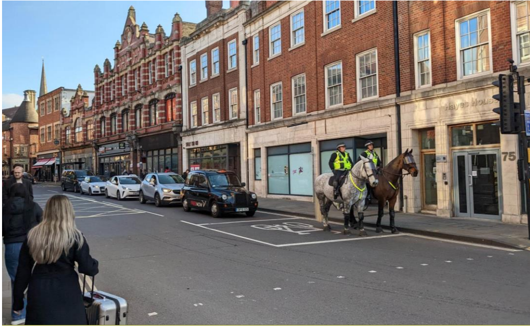
Obrázek 9: Jízdní policie v Oxfordu (autorka bakalářské práce)

Během svátků městská jízdní policie pomáhá zvyšovat kontroly i na hřbitovech, které občané navštěvují v hojném počtu, např. v období Dušiček jízdní oddíl MP Pardubice dohlížel na veřejný pořádek. Byl zde jako prevence, aby zamezil zcizení osobních věcí, které si návštěvníci hřbitova někde odloží [55]. Také během velikonočních svátků dohlížela JS MP OŘ Praha 1 společně se strážníky z Prahy 3 na Olšanských hřbitovech [56]. Městská jízdní policie plní i reprezentační úkoly ceremoniálního charakteru, ať už to jsou významné dny v roce, městské slavnosti, či městské akce, např. jízdní oddíl MP Pardubice se podílel se na rozdávání Betlémského světla a 132. ročníku Velké pardubické. Jízdní oddíl započal 132. ročník zahajovacím ceremoniálem, přičemž zkušený vlajkonoš, čtyřiatvacetiletý starokladrubský kůň jménem Ota, přinesl vlajku města před tribuny. Kůň Ota se pro tuto speciální příležitost vrátil na jeden den do služby. Jízdní oddíl MP se také zúčastnil přehlídky startujících koní [57; 58; 59]. Ceremoniálních akcí se zúčastňují jízdní oddíly i ve Spojeném království, kde jízdní jednotky dohlížely na poslední loučení s královnou Alžbětou II., které proběhlo 19. září 2022 [60]. Další velký den pro britskou jízdní policii bylo tzv. Královo procesí, které se uskutečnilo 6. května 2023.