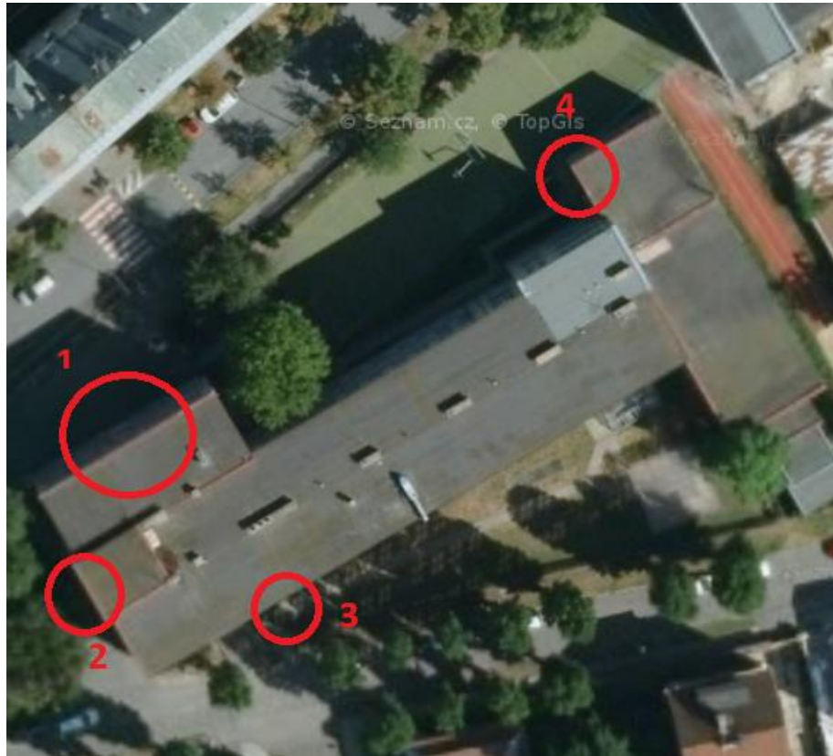
Obrázek 5- Budova školy s vyznačenými východy

slouží jako únikový. Dále je využívám personálem školy pro další účely např. při odnášení odpadků do popelnic, které se nachází za budovou školy. Poslední vchod je v přední části školy na druhé straně od hlavního vchodu, jedná se o vchod na hřiště před školu.