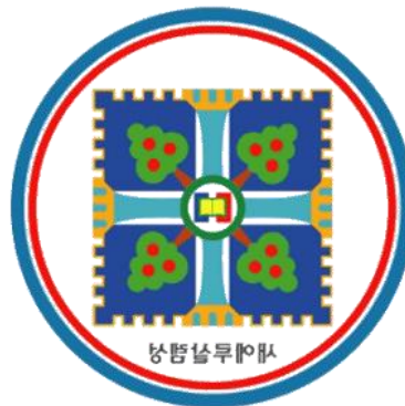
Obrázek 1 – Logo Sinčchondži [7]

Znak je tvořen dvěma kruhy, které tvoří hranici znaku. Modrý kruh představuje vesmír a kruh červený Zemi. Čtvercová podstava uvnitř kruhů má znázorňovat nový Jeruzalém, Boží Svaté město. Dva drahé kameny jaspis a rubín uprostřed emblému představují Bibli, která má vykreslit Boha a jeho věčné slovo. Kruh okolo těchto dvou drahých kamenů označuje Boží zaslíbení. Modrý kříž, který se potkává uprostřed znaku, poukazuje na ulice, kterými proudí voda života. Ta má znázorňovat Boží slovo. Čtyři stromy, které můžeme dále na znaku pozorovat, představují čtyři strany světa, každá strana má tři brány. Těchto dvanáct bran představuje dvanáct kmenů nových Izraelitů. [7]