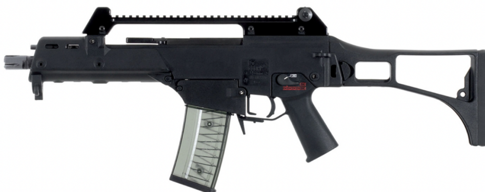
Obrázek 3 - Útočná puška G36 C [31]

Délka pušky je 716 mm s pažbou, 500 mm se sklopenou pažbou a hmotnost zbraně je 2 988 g. Zásobník standartně pojme 30 nábojů a její účinný dostřel je 200 m [9].