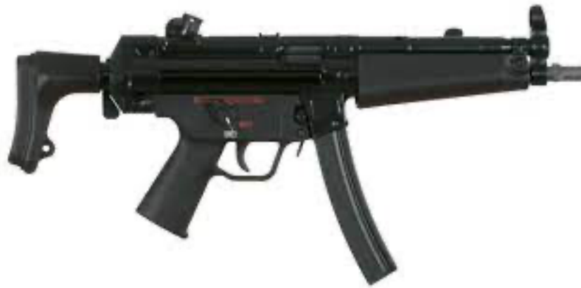
Obrázek 4 - Samopal Heckler & Koch MP5 ráže 9 x 19 mm Luger [32]

Délka samopalu je 999 mm s pažbou, 758 mm se sklopenou pažbou a hmotnost zbraně je 3 100 g. Zásobník pojme 30 nábojů a jeho účinný dostřel je až 100 m [11].