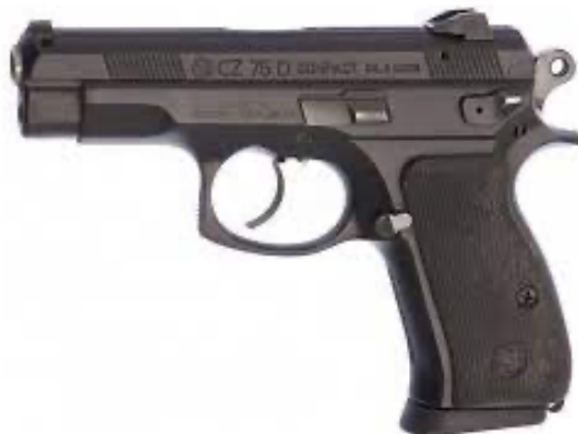
Obrázek 1 - CZ 75 D Compact cal. 9 mm Luger [29]

Zbraň je ráže 9 mm Luger, její hmotnost je 966 g a je dlouhá 183 mm. Kapacita zásobníku je 14 nábojů a účinný dostřel je 200 m [7].