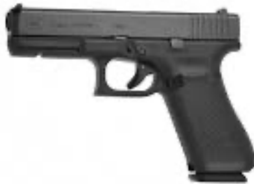
Obrázek 2 - Glock 17 pistole Gen.5 9x19 [30]

Mezi hlavní výhody patří lehkost a odolnost (tu zajišťuje polymerový rám). Díky neustálému vývoji existuje několik generací této zbraně – Policie ČR do své výzbroje zařadila model generace G5 [8].