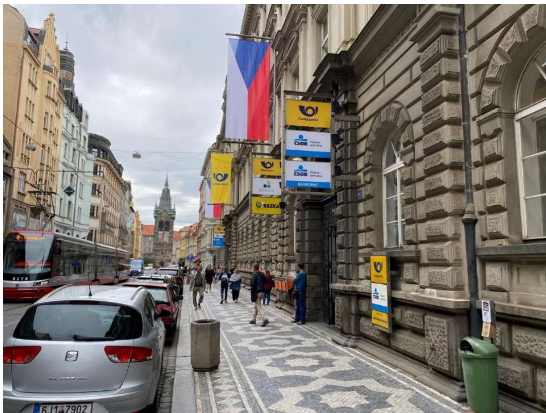
Obr. 13 Dostatečně široký chodník před budovou České pošty; nesjednocené odpadkové koše, které degradují vzhled ulice