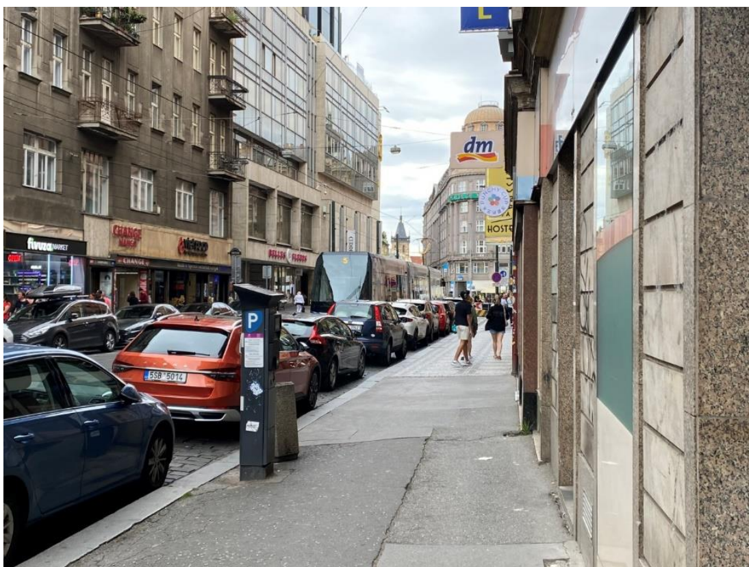
Obr. 10 Příliš úzký chodník s nerovným a neestetickým povrchem