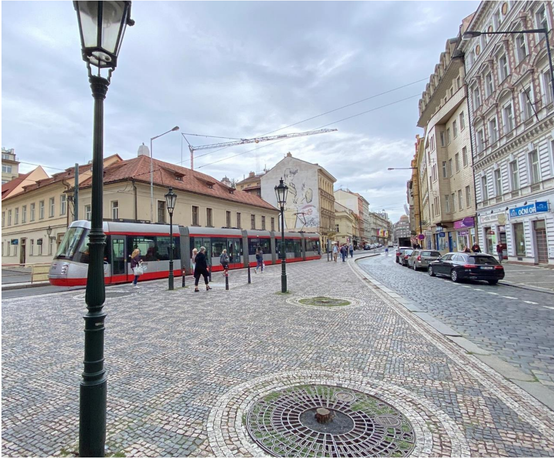
Obr. 15 Návrh na přesunutí zastávky ve směru na Václavské náměstí