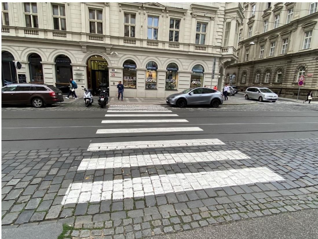
Obr. 8 Přechod pro chodce nesplňující normu