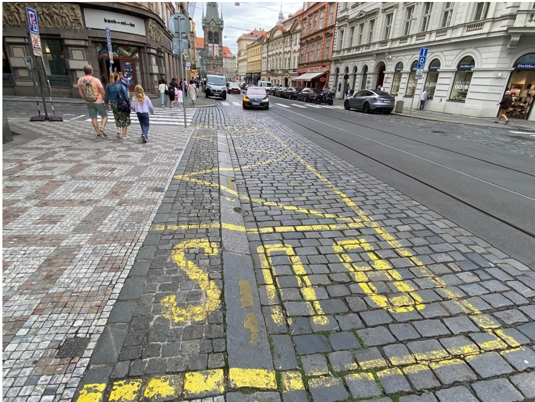
Obr. 5 Autobusové stání na 15 minut vyznačené přímo v křižovatce