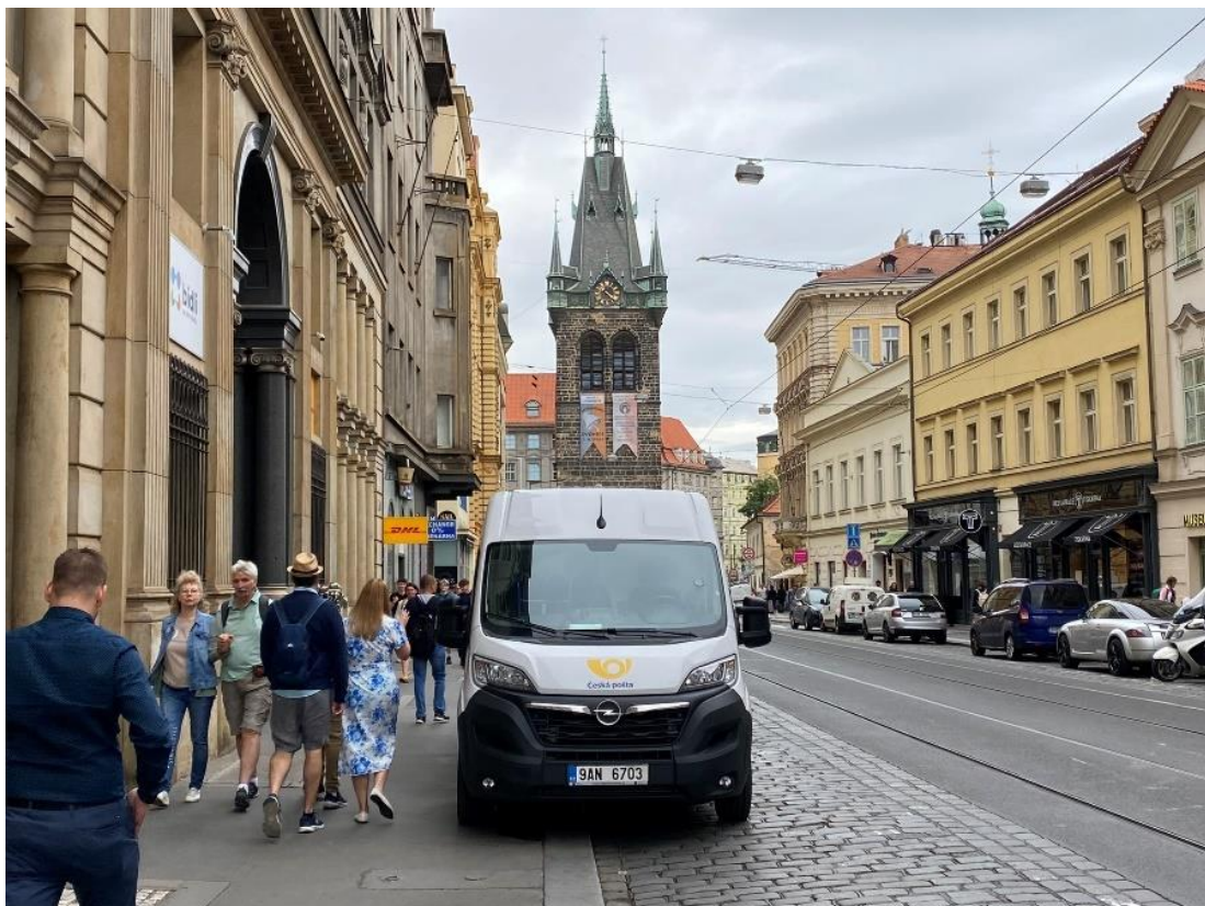
Obr. 6 Vozidlo nelegálně stojící dvěma koly na chodníku, kde brání volnému průchodu chodců