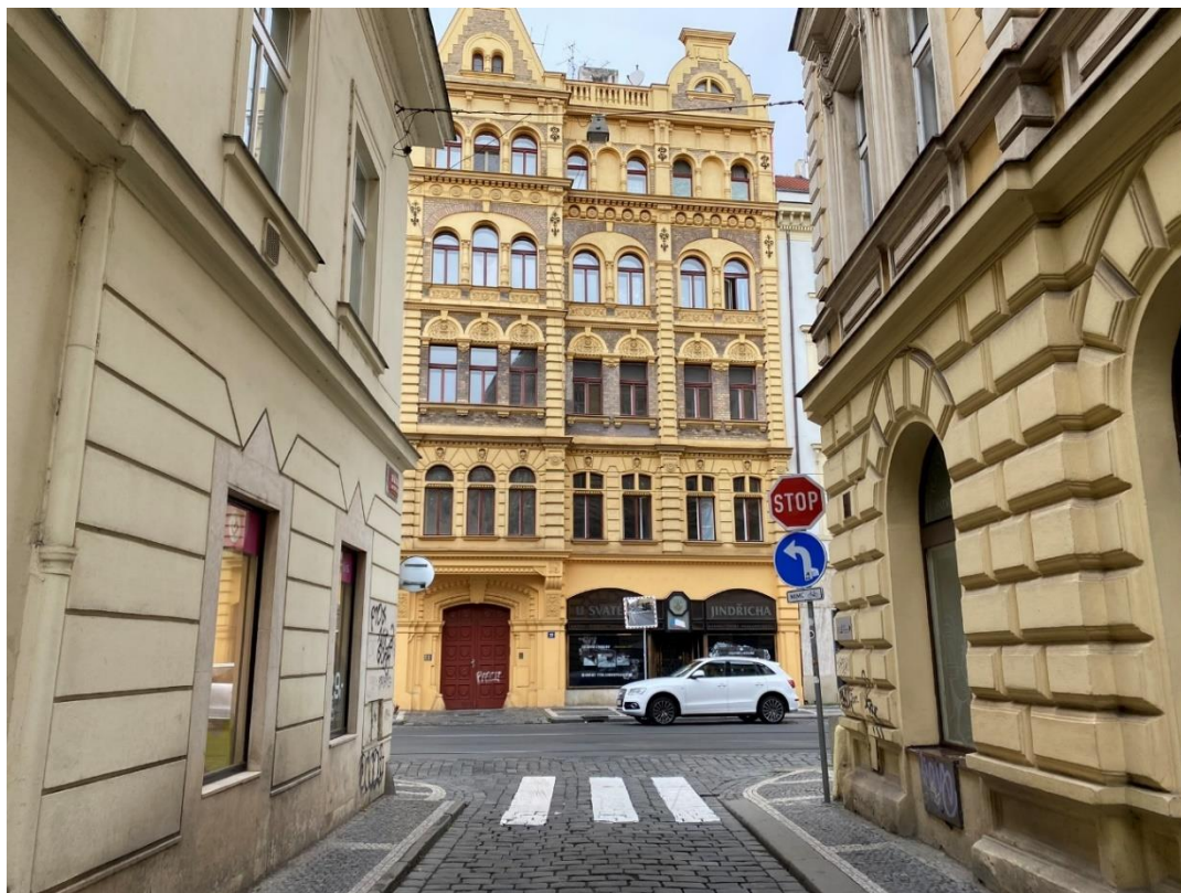
Obr. 2 Výjezd z ulice Růžová