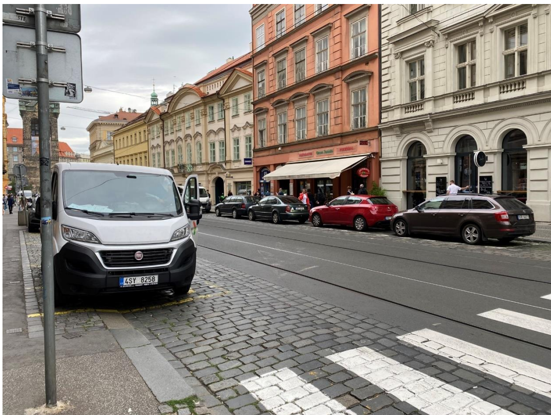
Obr. 4 Legálně stojící vozidlo zásobování, které brání v bezpečném rozhledu při přecházení komunikace po přechodu pro chodce