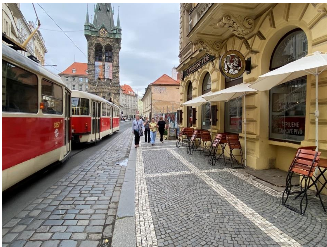
Obr. 12 Chodník s předzahrádkou, který by mohl být širší, kdyby bylo využito vydlážděné plochy ve vozovce, která v současnosti není využívána žádným uživatelem