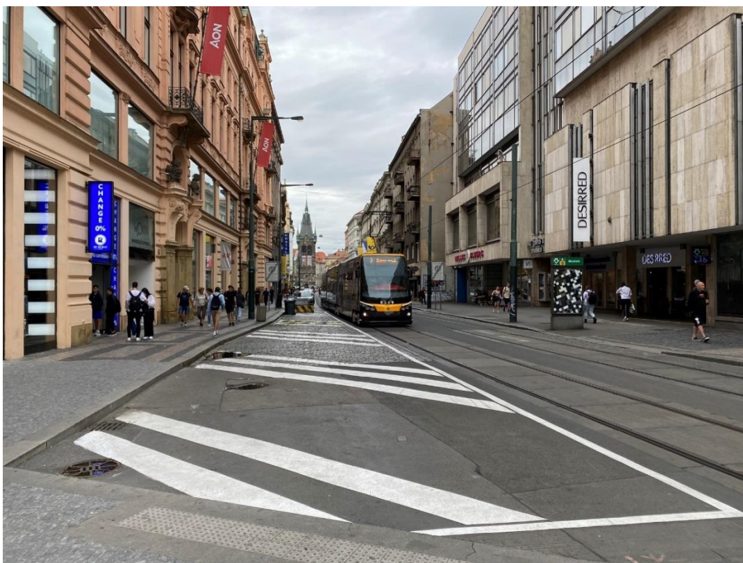
Obr. 1 Nevyužitá plocha v oblasti pěší zóny v Jindřišské ulici

Všechny níže zobrazené fotografie pocházejí z osobního archivu autorky práce.