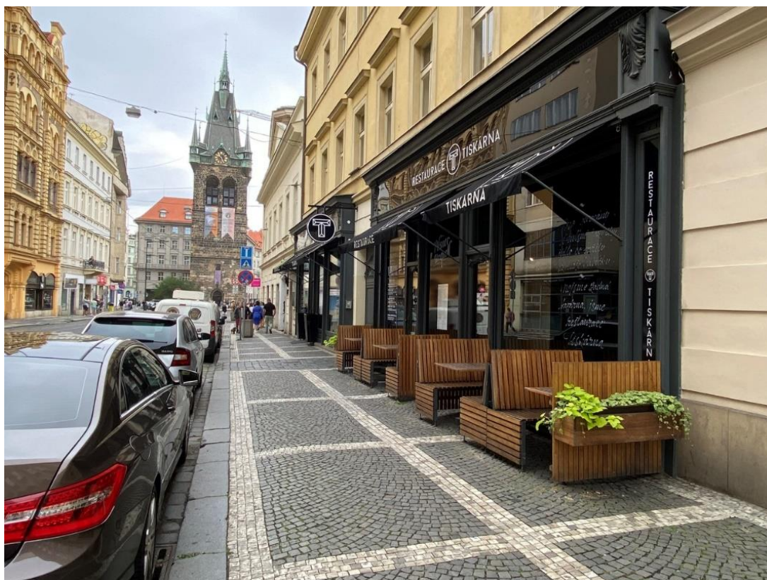
Obr. 14 Díky dostatečně širokému chodníku se může v tomto místě vyskytovat příjemná předzahrádka restauračního zařízení