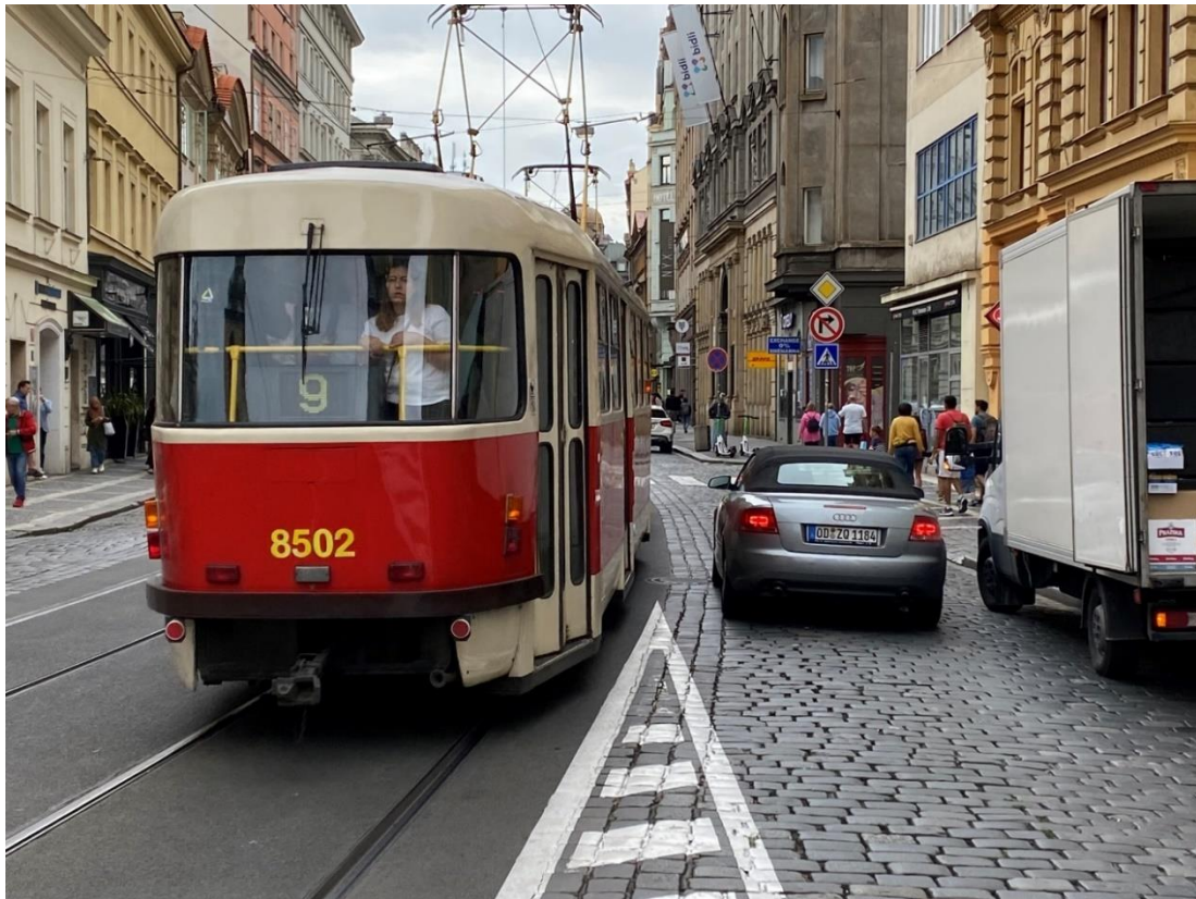
Obr. 3 Nebezpečný úhel křížení komunikace vedoucí ze Senovážného náměstí