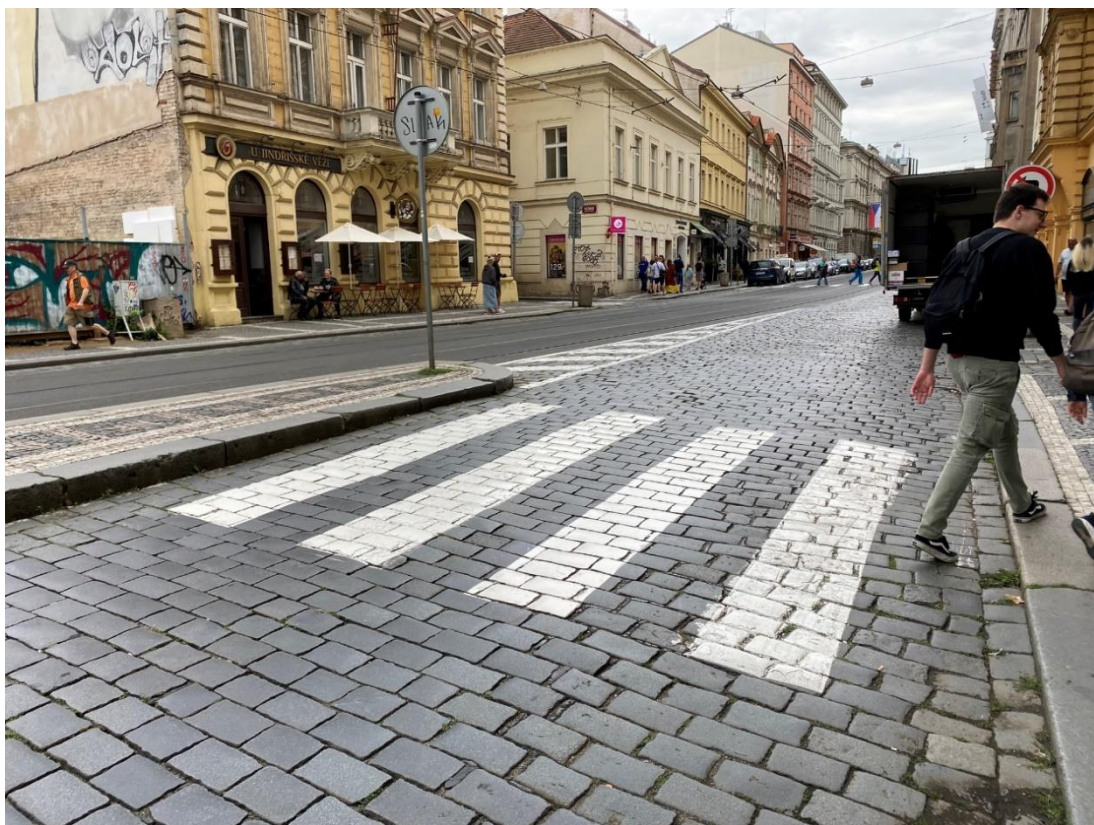
Obr. 9 Bariérový přechod pro chodce