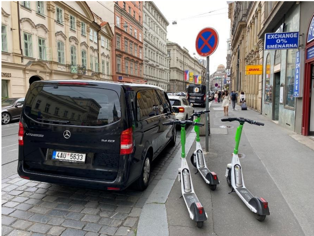
Obr. 7 Nerespektování svislého dopravního značení zakazující zastavení; odstavené sdílené koloběžky na chodníku, kde ubírají prostor chodcům