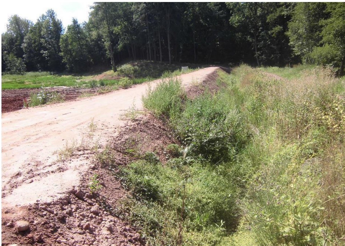
Foto č.25 – Pohled na hráz sedimentační předzdrže na toku Březnice