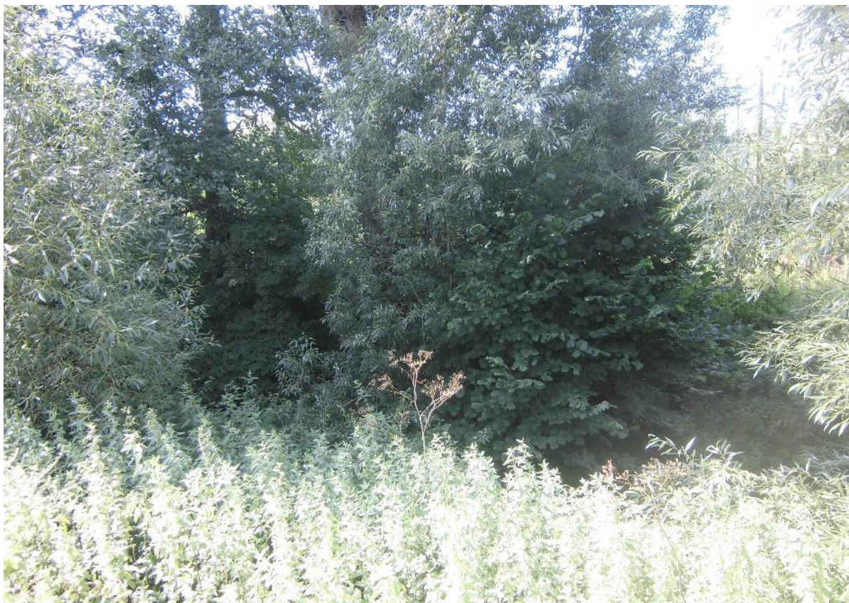
Foto č.1 - Pohled směrem na Podvinecký potok v chmelnici cca 80 m za mostem