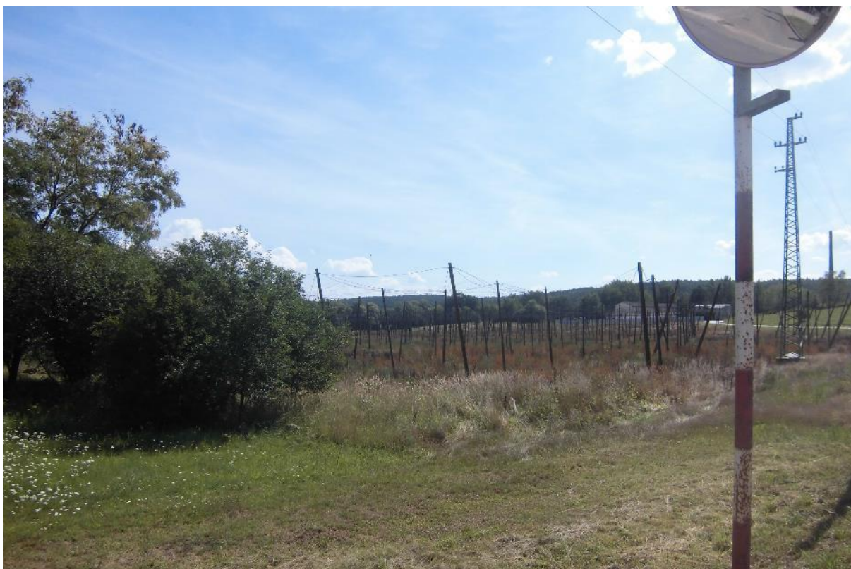
Foto č.10 - Pohled z křižovatky silnic na obec Kryry, Kryry – Březnice a Petrohrad směrem na budoucí hráz a nádrž VD Kryry