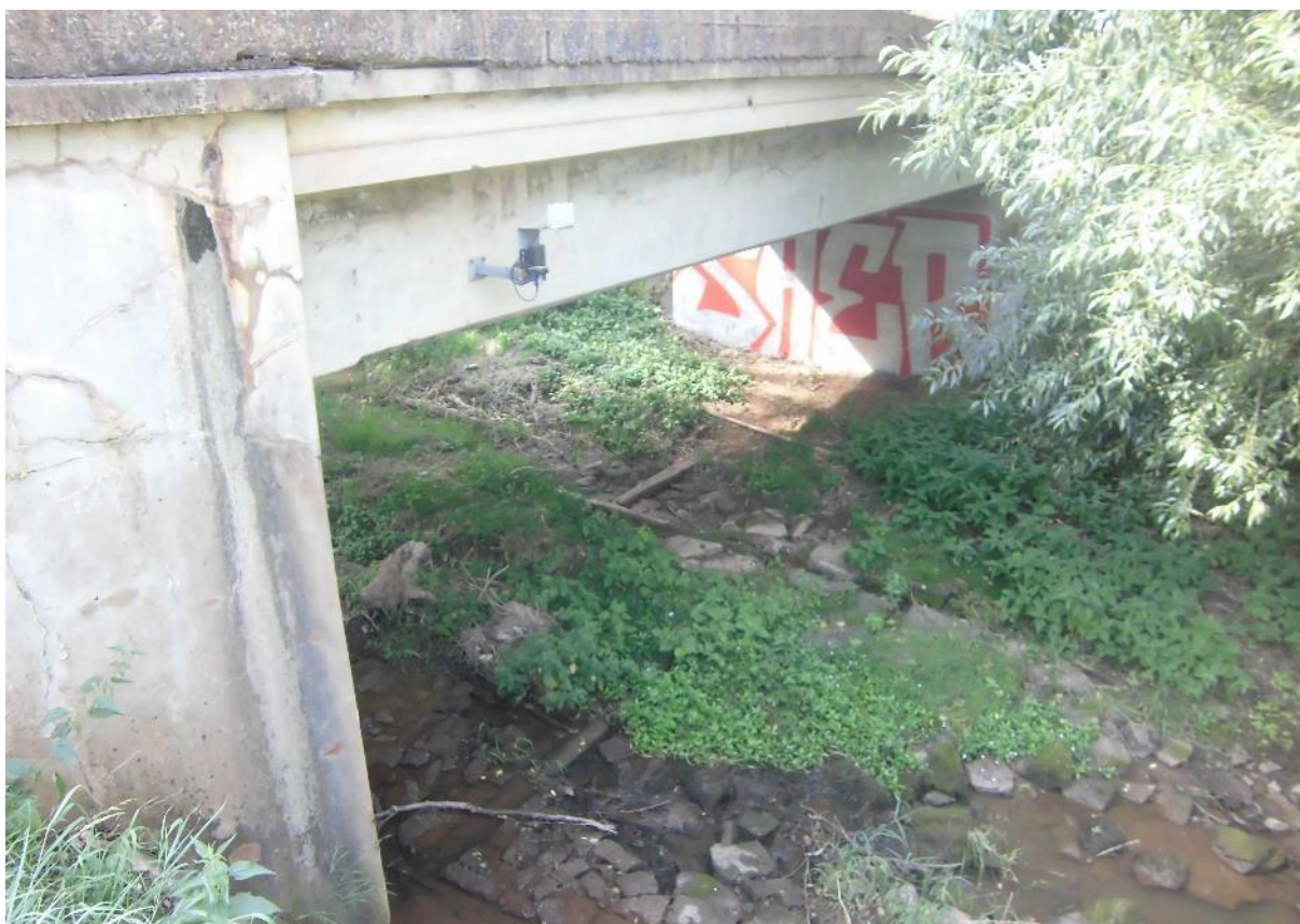
Foto č.4 - Pohled proti proudu Podvineckého potoka pod mostem