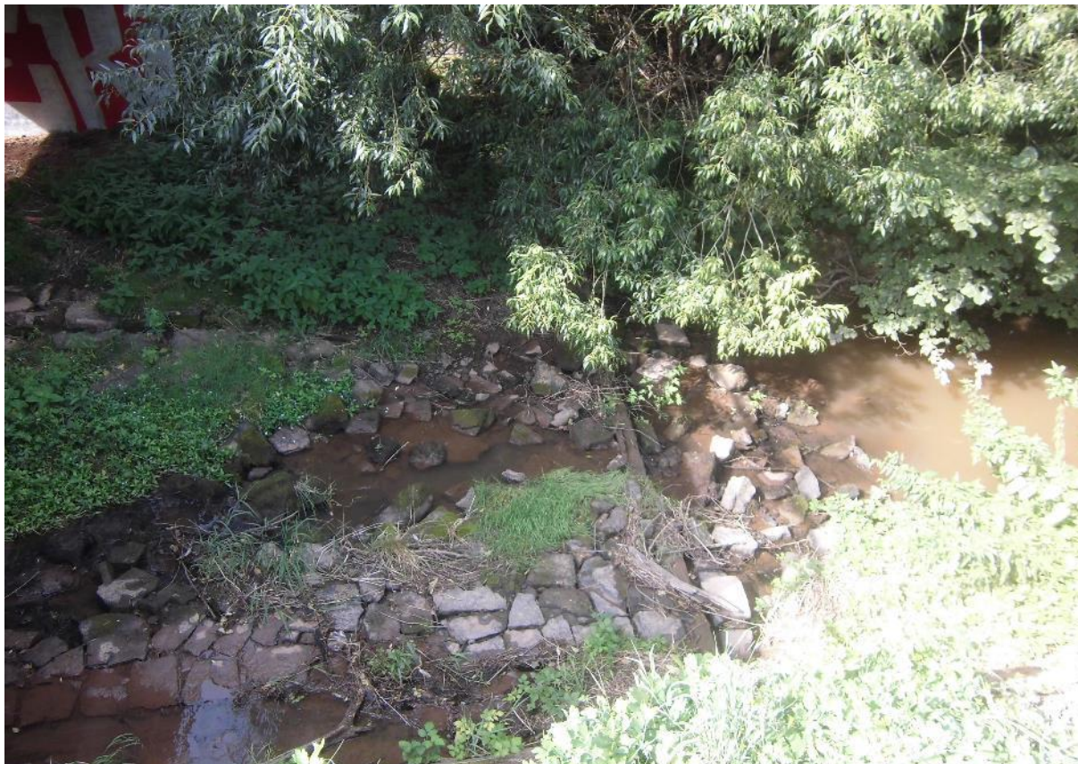
Foto č.6 - Pohled proti proudu Podvineckého potoka u mostu