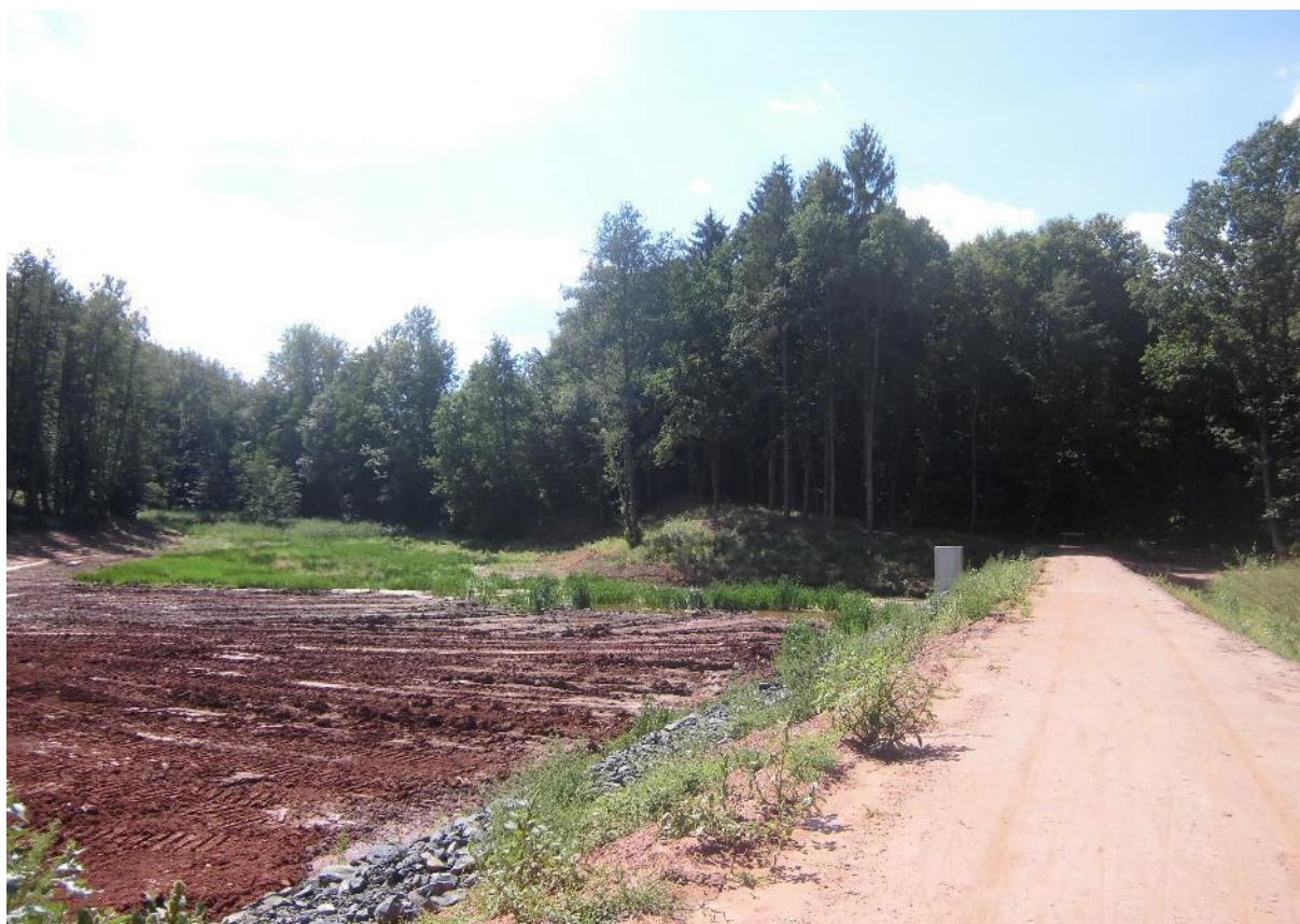
Foto č.20 – Pohled na sedimentační předzdrž na toku Březnice směrem na jihozápad na hráz