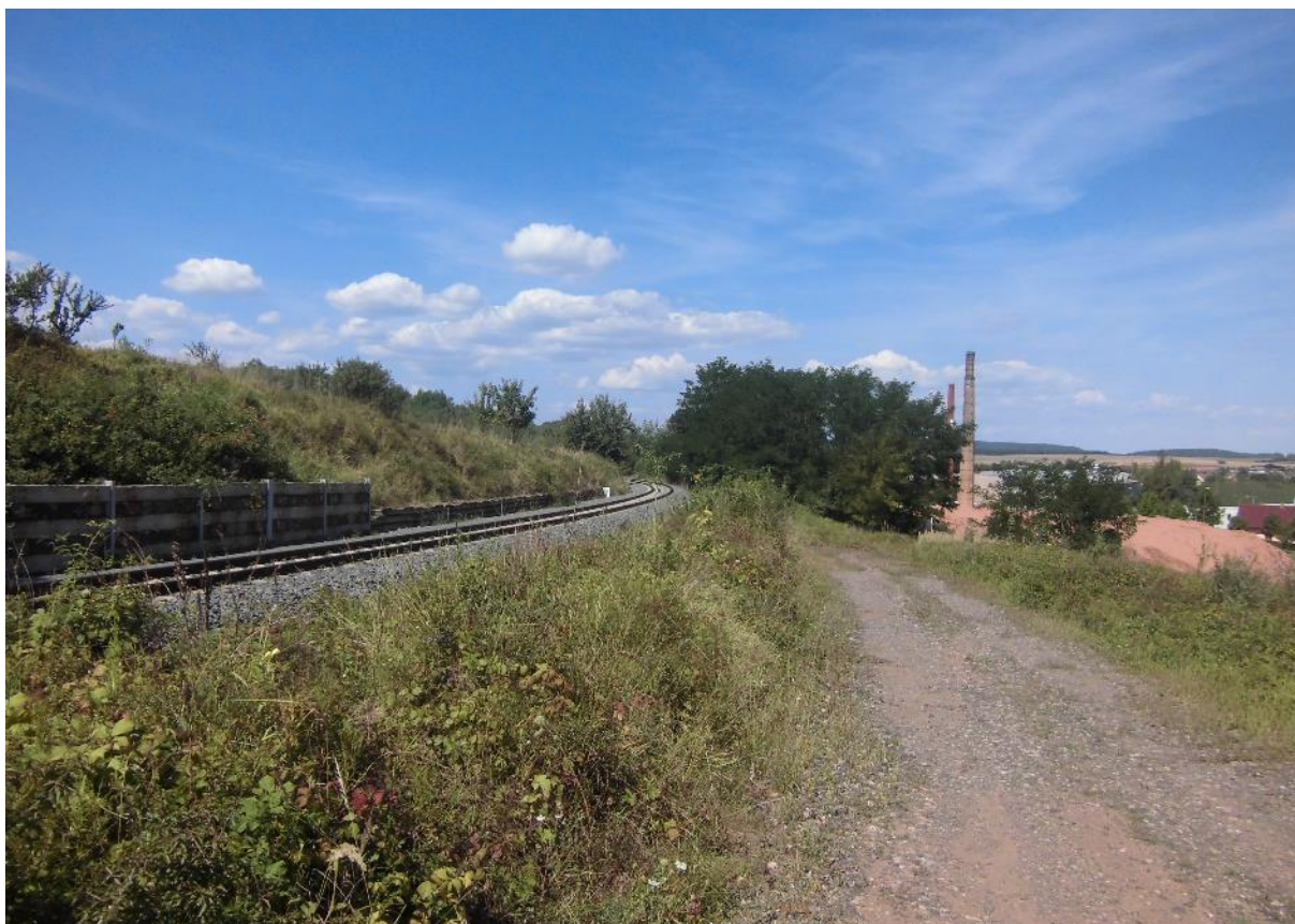
Foto č.13 - Pohled na stávající železnici v prostoru levého zavázání VD Kryry