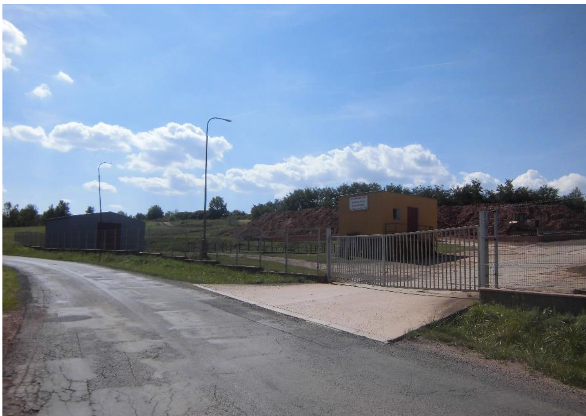
Foto č.11 - Pohled směrem od obce Kryry na budoucí hráz a nádrž VD Kryry