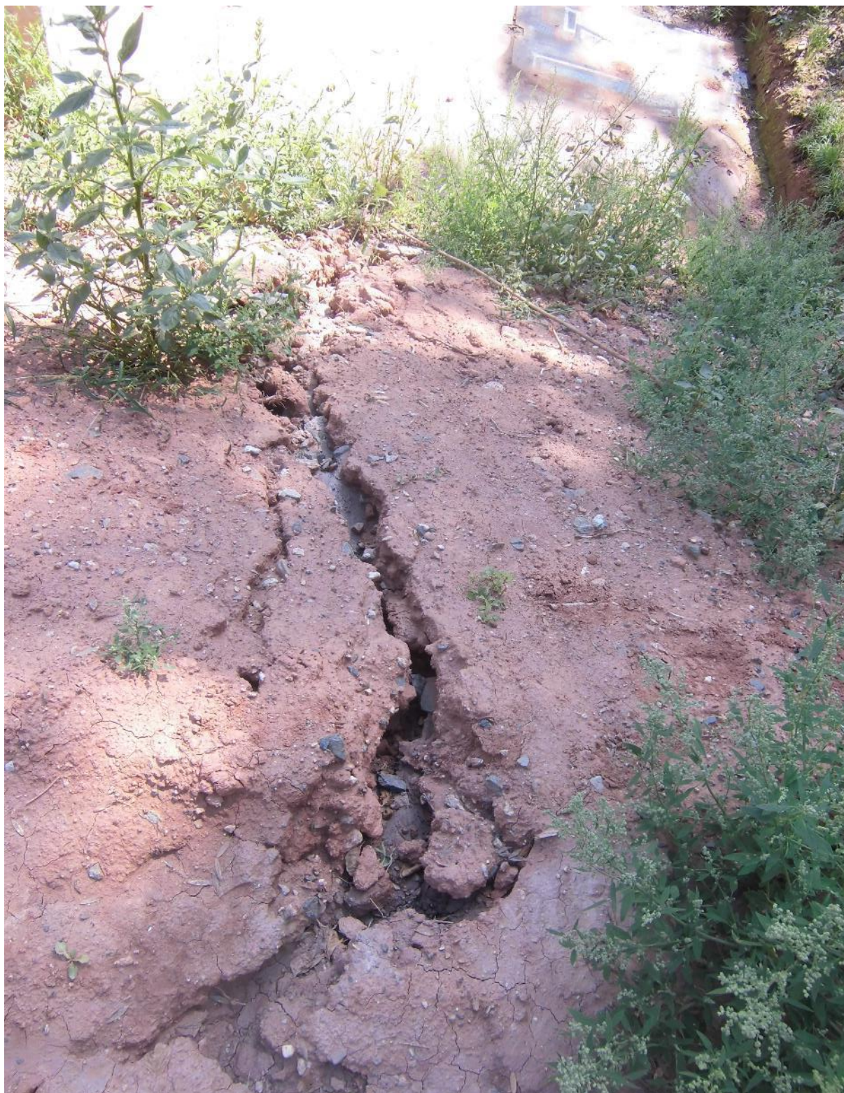
Foto č.23 – Pohled na trhlinu hráze sedimentační předzdrže na toku Březnice