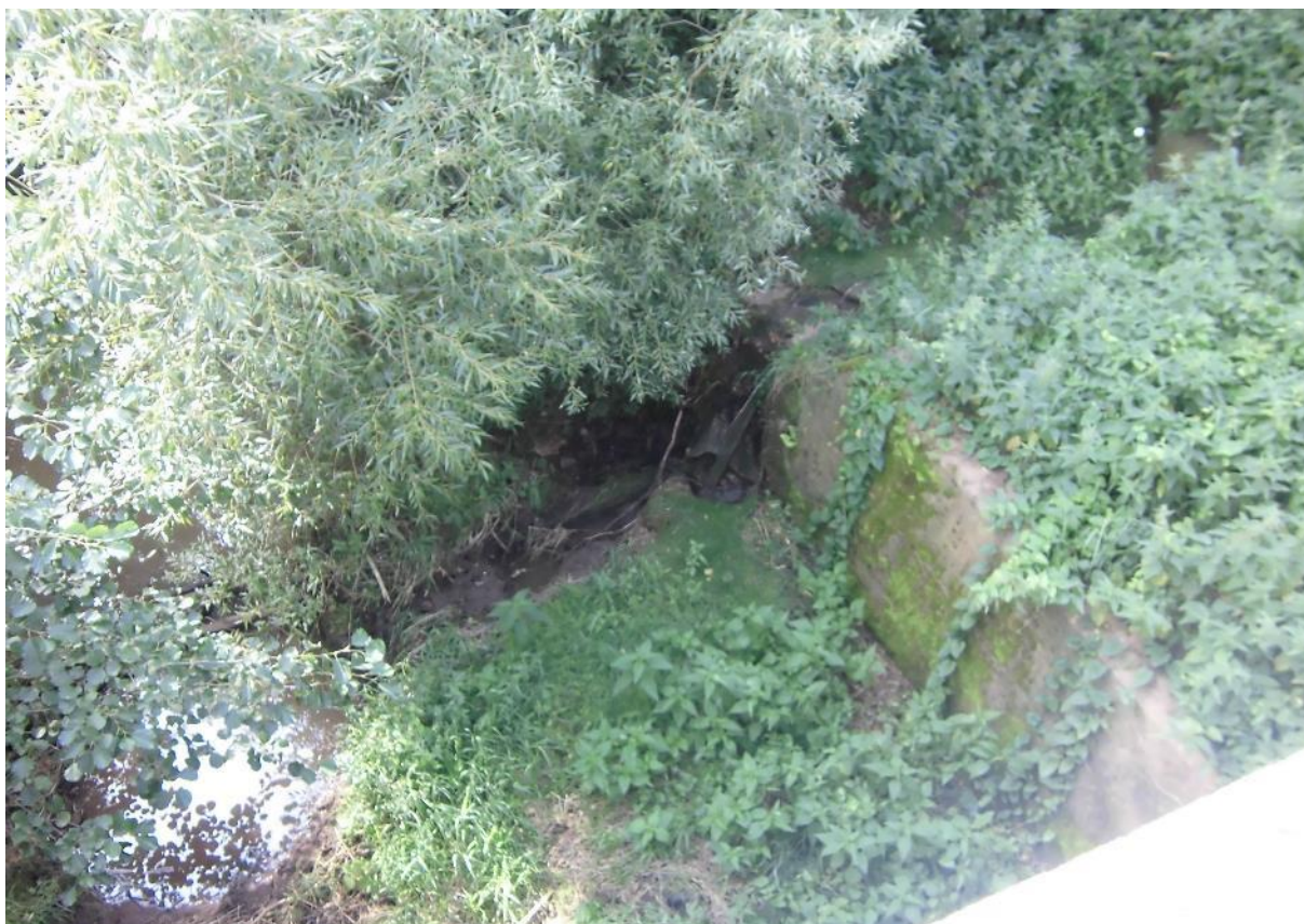
Foto č.5 - Pohled proti proudu Podvineckého potoka z mostu