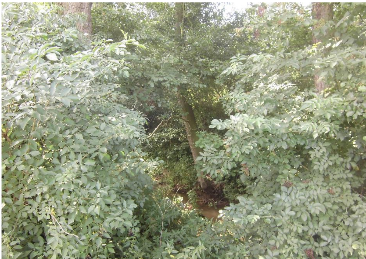
Foto č.3 - Pohled směrem na Podvinecký potok v chmelnici cca 15 m za mostem