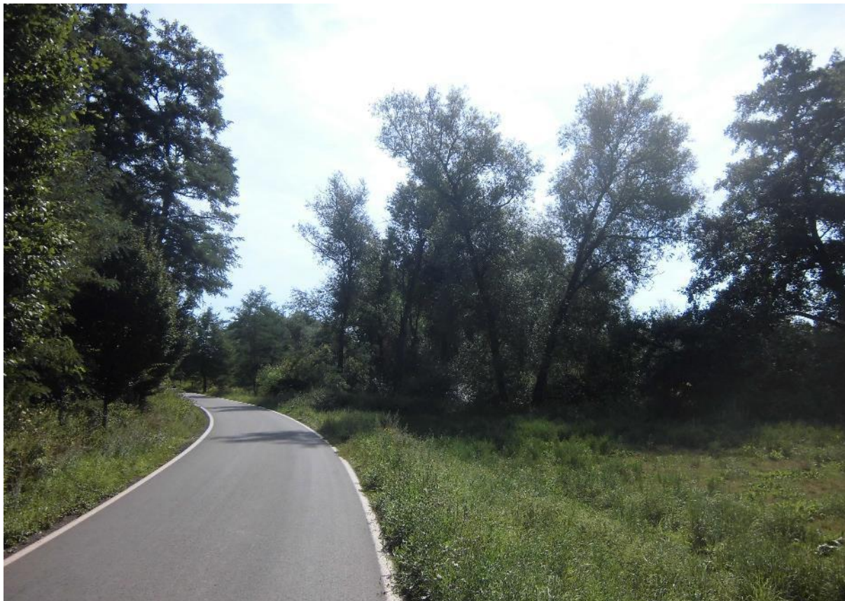
Foto č.14 - Pohled na stávající silnici směrem na Kryry – Březnice a prostor budoucího VD Kryry