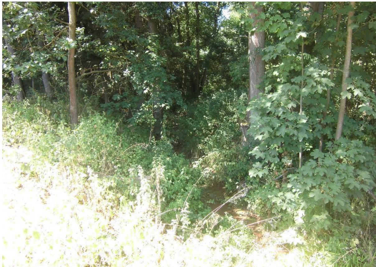
Foto č.26 – Pohled na koryto toku Březnice u sedimentační předzdrže