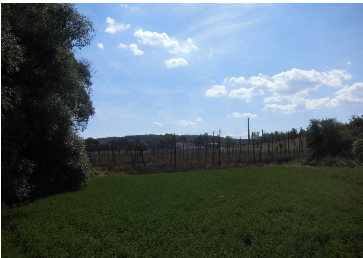
Foto č.8 - Pohled směrem na budoucí hráz a nádrž VD Kryry