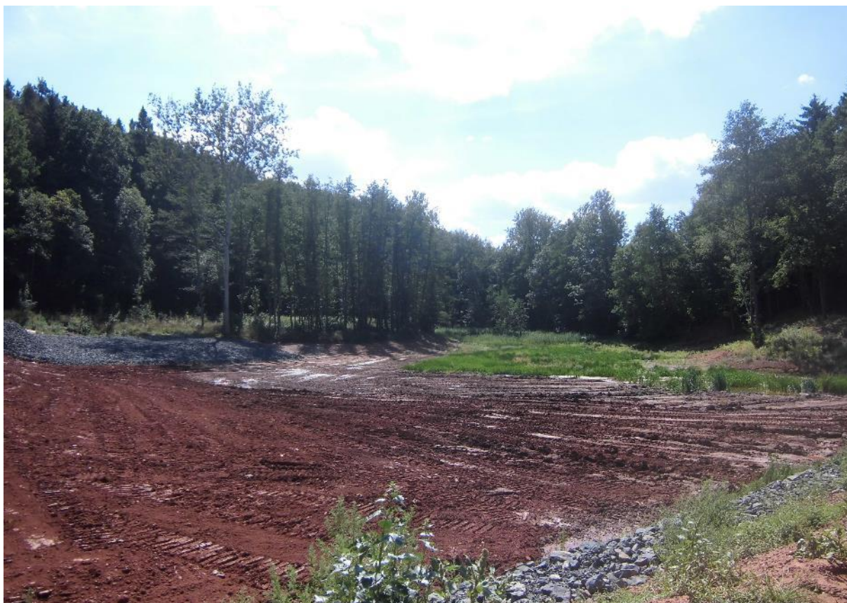
Foto č.19 – Pohled na sedimentační předzdrž na toku Březnice směrem na jihozápad