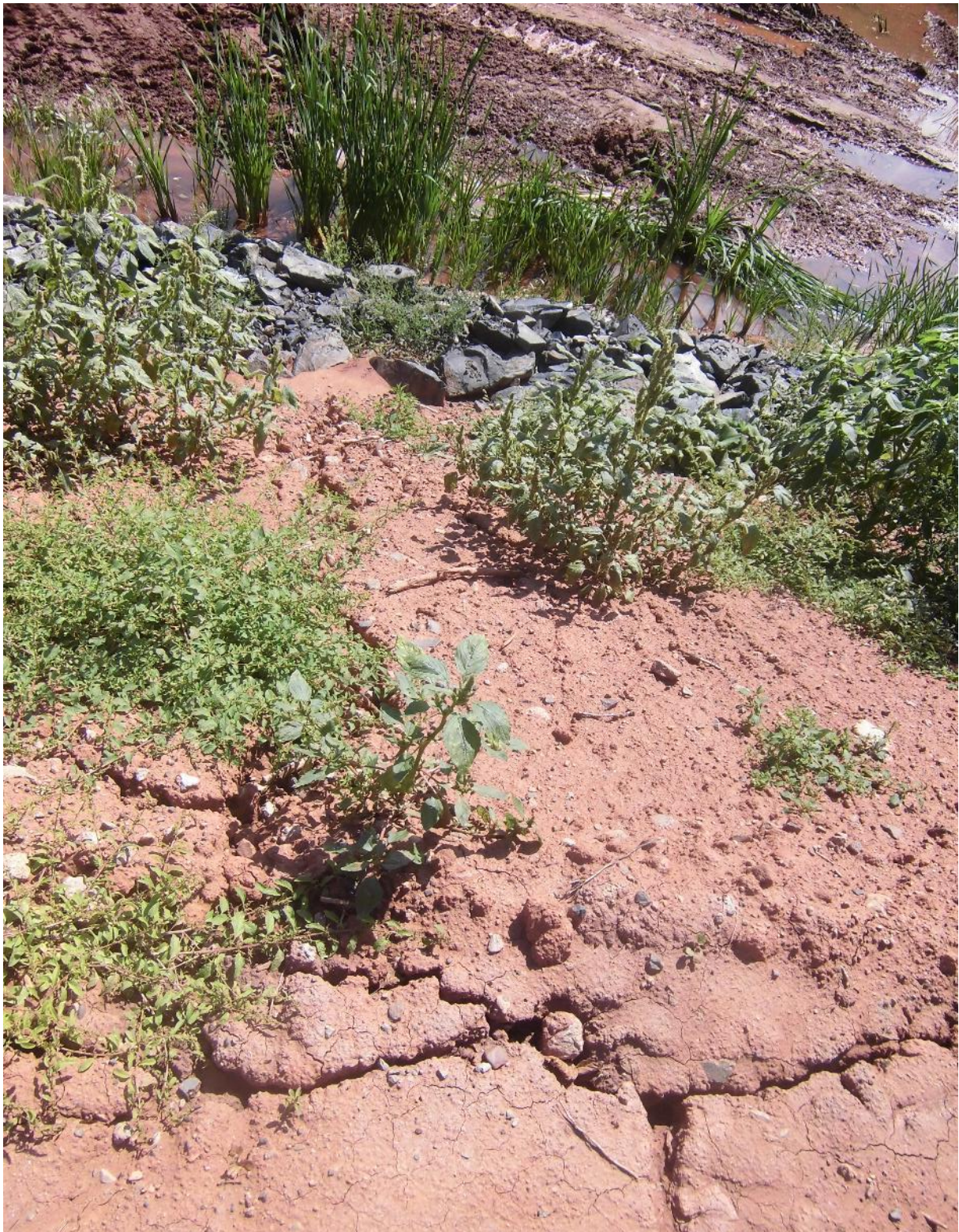
Foto č.24 – Pohled na trhliny hráze sedimentační předzdrže na toku Březnice