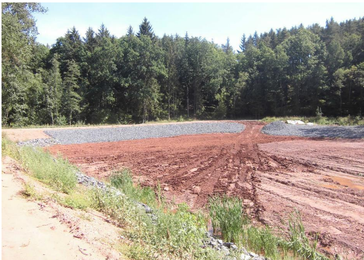
Foto č.21 – Pohled na sedimentační předzdrž na toku Březnice směrem na jihovýchod