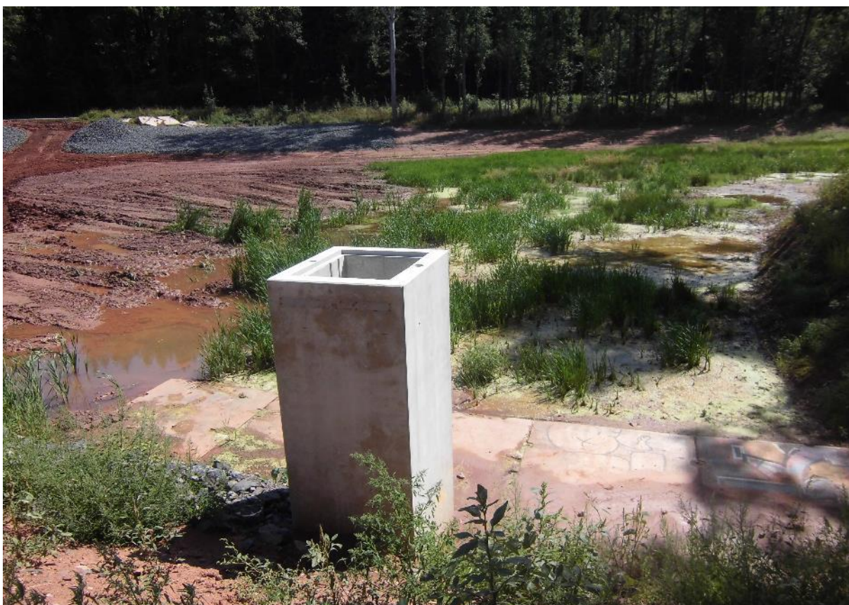
Foto č.22 – Pohled na sedimentační předzdrž s požerákem na toku Březnice směrem na jih