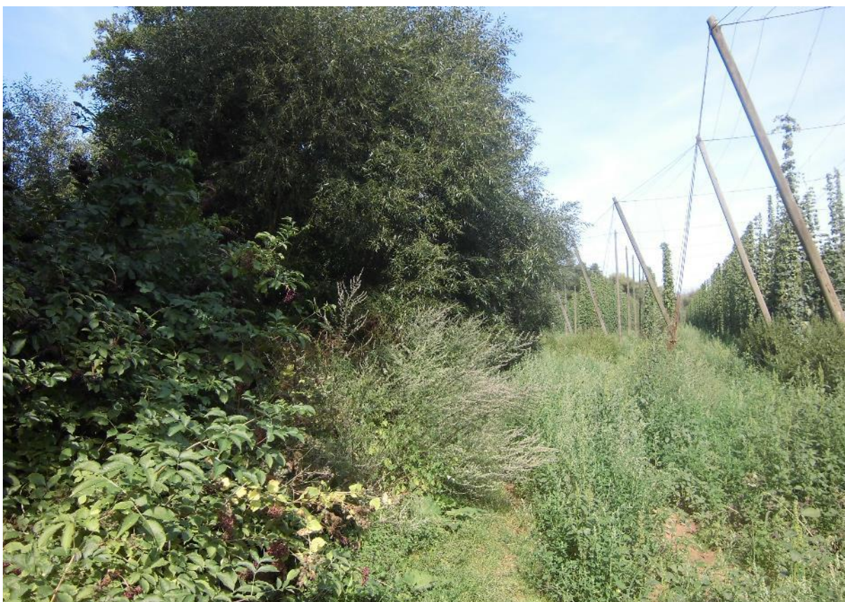
Foto č.2 - Pohled po proudu Podvineckého potoka v chmelnici cca 80 m za mostem