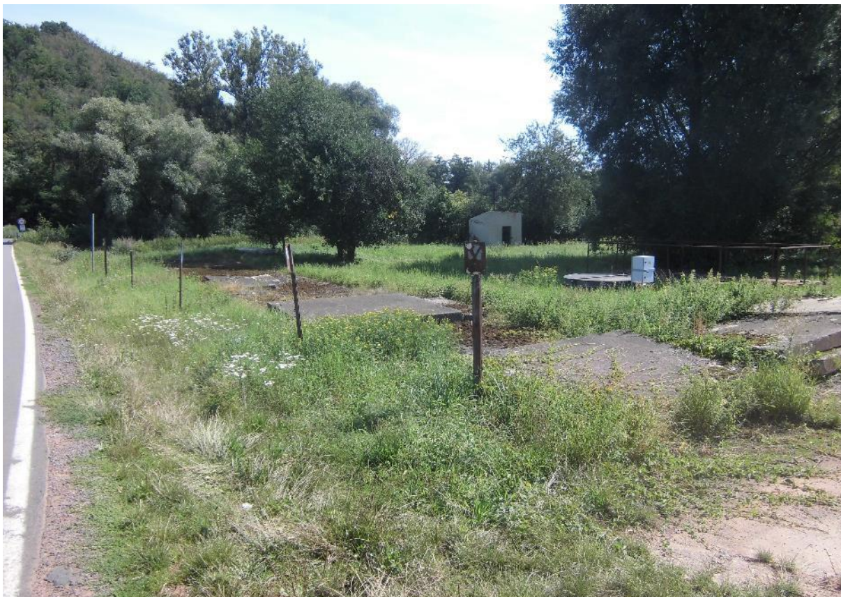
Foto č.9 - Pohled z křižovatky silnic na obec Kryry, Kryry – Březnice a Petrohrad směrem k mostu