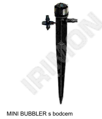
MINI BUBBLER s bodcem